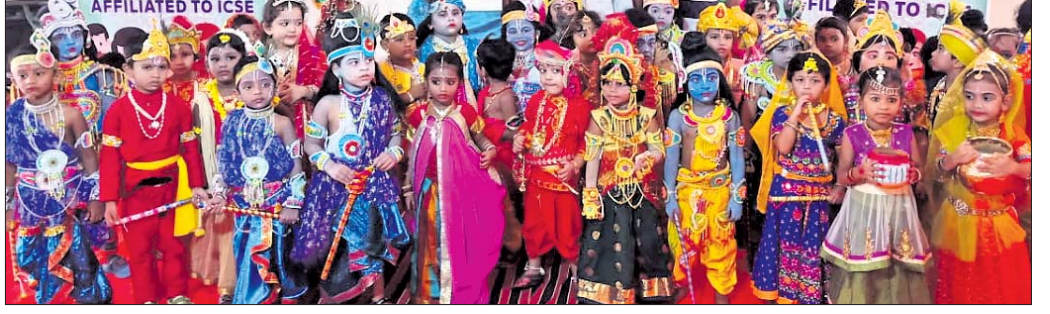
ଶ୍ରୀକୃଷ୍ଣ ଓ ଶ୍ରୀରାଧା ବେଶରେ ସଜିତ ହୋଇଛନ୍ତି ଛୋଟ ପିଲାମାନେ ।

ବ୍ରହ୍ମପୁର ସହରରେ ଗୁରୁବାର ଜନ୍ମାଷ୍ଟମୀ ପାଳିତ ହୋଇଯାଇଛି । ଜଗନ୍ନାଥ ଓ ରାଧାକୃଷ୍ଣ ମନ୍ଦିରରେ ମାନସିକ ଧାରା ଓ ଭକ୍ତଙ୍କ ଭିଡ଼ ଜମିଥିଲା । ଛୋଟ ଛୋଟ ଜନ୍ମବୃତ୍ତାନ୍ତ ପରିବେଷଣ ହୋଇଥିଲା । ପିଲାମାନେ ଶ୍ରୀକୃଷ୍ଣ ଓ ଶ୍ରୀରାଧା ବେଶରେ