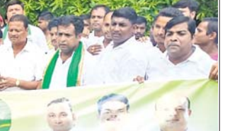
କାର୍ଯ୍ୟକ୍ରମରେ ଯୋଗ ଦେଲେ ଶ୍ରୀମମନ୍ତୀ

ଚାରାଚୋପଣ କାର୍ଯ୍ୟକ୍ରମରେ ଯୋଗ ଦେଲେ ଶ୍ରୀମମନ୍ତୀ