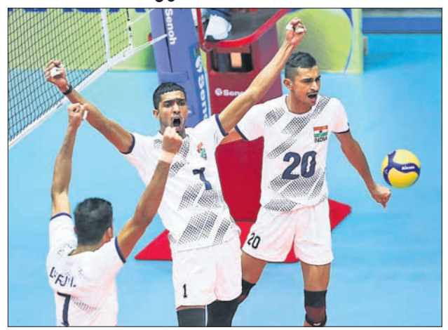
ବିଜୟ ହାସଲ ପରେ ଉଲ୍‌ସିତ ଭାରତୀୟ ଖେଳାଳି।

ଭୁବନେଶ୍ୱର, ୧୮୮ (କ୍ରୀଡ଼ା ପ୍ରତିନିଧି): ଇରାନର ତେହେରାନଠାରେ ଚାଲିଥିବା ୧୪ତମ ଏସିଆନ ୧୮ ବର୍ଷରୁ କମ୍ ପୁରୁଷ ଭଲିବଲ ଚୁନାମେଣ୍ଟରେ ଭାରତ ଗୁରୁବାର କୋରିଆକୁ ପରାସ୍ତ କରିଛି। ଚଳିତ ଚୁନାମେଣ୍ଟରେ ଭାରତର ଏହା ହେଉଛି ଦ୍ୱିତୀୟ ବିଜୟ। ପ୍ରଥମ ମ୍ୟାଚରେ ଦଳ ଜାପାନଠାକୁ ହାରି ଯାଇଥିଲେ ହେଁ ପରେ ଥାଇଲାଣ୍ଡକୁ ହରାଇ ସମ୍ପଳ ପ୍ରତ୍ୟାବର୍ତ୍ତନ କରିଥିଲା। କୋରିଆ କଡ଼ା ଚ୍ୟାଲେଞ୍ଜ