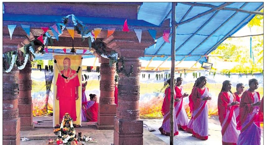
ସାମାଜିକ ଶ୍ରାବଣବେଳେ ପୂଜାର୍ଚନା ପାଇଁ ଆଗ୍ରମରେ ବାହାରିଥିବା କଳସ ଶୋଭାଯାତ୍ରା, ସାମାଜିକ ସମାଧିକାର

ଚକାପାଦ/ରୁପକ୍ତିବନ୍ଧ/ବାଲିଗୁଡ଼ା/ (ଡି.ଏନ୍.ଏ.)