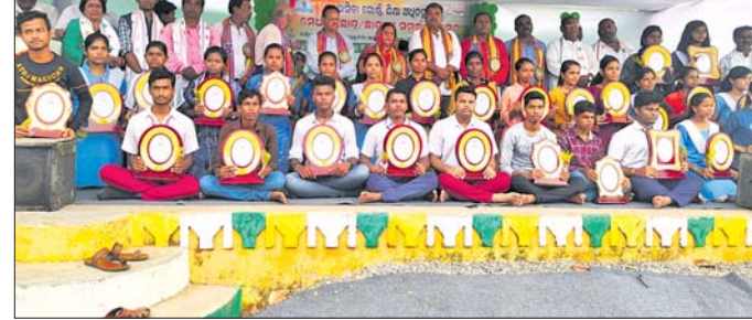
ଅତିଥିମାନଙ୍କ ଗହଣରେ ସମ୍ବର୍ଦ୍ଧନା ମେଧାବୀ ଛାତ୍ରାଛାତ୍ରୀ ।