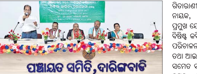
ପଞ୍ଚାୟତ ସମିତି, ଦାରିଙ୍ଗପାଡ଼ି

ଦେଶାତ୍ମକ କବିତା ପାଠୋତ୍ସବ (ଡି.ଏନ.ଏ.)- ଦେଶାତ୍ମକ କବିତା ପାଠୋତ୍ସବ ଆୟୋଜିତ ହୋଇଛି। ଦେଶାତ୍ମକ କବିତା ପାଠୋତ୍ସବ ଆୟୋଜିତ ହୋଇଛି।