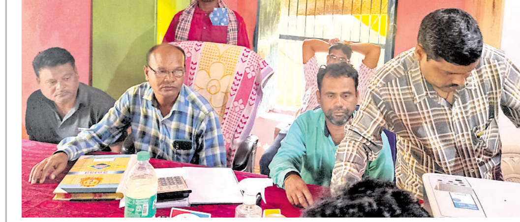
ବୋର୍ଡ଼ ବୈଠକରେ ଉପସ୍ଥିତ ସଦସ୍ୟ।

ଲୋଇସିଂହା, ୧୯୮୮ (ଡି.ଏନ.ଏ.) ଧାନ ବିକ୍ରି ସକାଶେ ୫୪୦ ଜଣ ଚାଷୀ ଫର୍ମ ନେଇଥିବା ବେଳେ ୪୩୨ ଜଣ ଫର୍ମ ଦାଖଲ କରିଛନ୍ତି। ଅଧ୍ୟାବଧି ୪୨୧ ଜଣ ଚାଷୀଙ୍କ ଫର୍ମ ଅନଲାଇନ କରାଯାଇଥିବା ସୂଚନା ଦିଆଯାଇଥିଲା। ୫୫ ଜଣଙ୍କ ବିଏଲ ମଞ୍ଜୁର ଏବଂ ନୂତନ ଭାବେ ଗ୍ରହଣ ପାଇଁ ଆଲୋଚନା କରାଯାଇଥିଲା। ସମିତି ଅଧୀନ ଖରମୁଣ୍ଡା, ବାରତୋଲ, ଗୋପା ଲପୁର, ବୁର୍ତ୍ତା, ବାଞ୍ଜପାଲି ଗ୍ରାମର କେତେକ ଏସଏଚ୍‌ସି ଗ୍ରୁପକୁ ଜିଏଲ୍‌ସି ରଖି ପ୍ରଦାନ କରାଯାଇଛି। ବିନା କାଗଜପତ୍ରରେ ଏହି ରଖି ଦିଆଯାଇଛି। ବାଞ୍ଜପାଲି ଗ୍ରାମର ଗୋଟିଏ ଗ୍ରୁପ ନିୟତିର ଋଣ ପୈଠକ କରି ଆସୁଛନ୍ତି। ନୌତିଏ ପରେ ବି ବାକି ମୁଦ୍ର ବର୍ଷାଧିକ ହେବା ପରେ ମଧ୍ୟ ରଖି ପରିଶୋଧରେ ଆନ୍ତରିକତା ଦେଖାଉନାହାନ୍ତି।