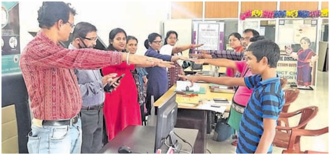
ଅଧିକାରୀ ଓ କର୍ମଚାରୀମାନେ ଏକତ୍ରିତ ହୋଇ ଶପଥ ପାଠ କରୁଛନ୍ତି ।

ଝାରସୁଗୁଡ଼ା ଅଫିସ୍, ୧୯୮୮ ଆଜ୍ଞାଦା କା ଅନୁତ ମହୋତ୍ସବ ଉପଲକ୍ଷେ ଗତ ୧୭ ତାରିଖରେ ଜିଲ୍ଲା ଶିଶୁ ସୁରକ୍ଷା କାର୍ଯ୍ୟାଳୟରେ ଶପଥପାଠ କାର୍ଯ୍ୟକ୍ରମ ଅନୁଷ୍ଠିତ ହୋଇଯାଇଛି। ଏଥିରେ ଶିଶୁ ଯତ୍ନ ଅନୁଷ୍ଠାନର କର୍ମକର୍ତ୍ତା, ଶିଶୁ ମଙ୍ଗଳ ସମିତିର ସଭ୍ୟ ସଭ୍ୟା ନିଜ ଉପରେ ନ୍ୟସ୍ତ ଦାୟିତ୍ୱ ସୁଚାରୁରୂପେ ସମ୍ପାଦନ ସହ ଦେଶ ପ୍ରଗତିରେ ଆନ୍ତରିକ ସହଯୋଗ କରିବାକୁ ଶପଥ କରିଥିଲେ। ଏ ନେଇ ଜିଲ୍ଲାରେ ଗତ ୧୩ ତାରିଖରୁ ରଙ୍ଗୋଲି, ଫ୍ୟାଟ୍‌ସ୍‌ଟ୍ରେସ୍ ଆଦି ପ୍ରତିଯୋଗିତା କାରି