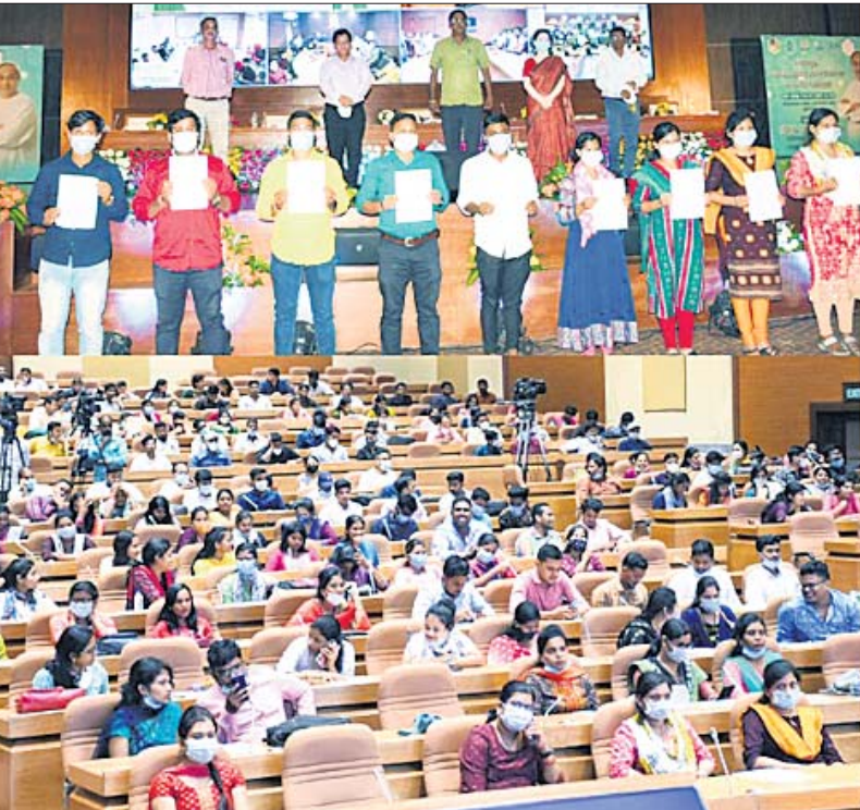
ଲୋକସେବା ଭବନ ନୂତନ ସମ୍ମିଳନୀ କକ୍ଷରେ ଶୁକ୍ରବାର ପୁଖ୍ୟମନ୍ତ୍ରୀ ନବୀନ ପଟ୍ଟନାୟକ ଆଭାସି ମାଧ୍ୟମରେ ୫୫୦ ଟେକ୍ନିସିଆନଙ୍କୁ ମାର୍ଗଦର୍ଶନ କରାଯାଇଛି। ନିକଟରେ ଅଛନ୍ତି ୫-ଟି ସଚିବ ଭି.କେ. ପାଣିଆନ୍।