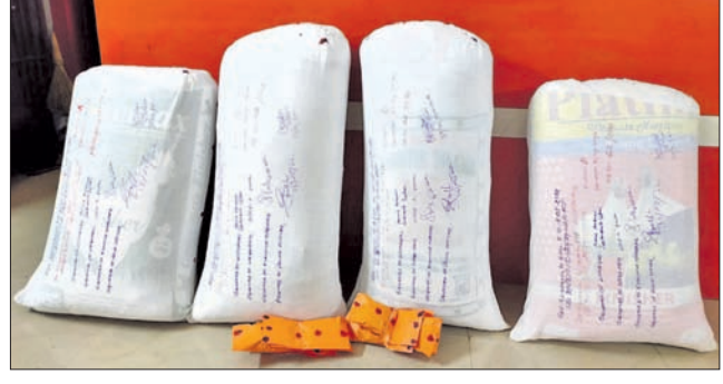
ଜବତ ହୋଇଥିବା ଗଞ୍ଜେଇ ।

ରେଡ଼ାଖୋଲ, ୧୯୮୮ (ଡି.ଏନ.ଏ.) ରେଡ଼ାଖୋଲ ପୋଲିସ୍ ଶୁକ୍ରବାର ରେଳ ଓଭରବ୍ରିଜ ନିକଟରେ ଛଳ ରହିଥିଲା। କାର୍ ପହଞ୍ଚିବା ପରେ ଚାହାଙ୍କୁ ଅବକାଳ କାର୍ ସହ ୧ କୁଇଣ୍ଟାଲ ଗଞ୍ଜେଇ ଜବତ କରିଛି। ତେବେ ଘଟଣାସ୍ଥଳକୁ ଚୋରାଚାଲାଣକାରୀ ଫେରାର ହୋଇଯାଇଥିବା ଥାନା ଅଧିକାରୀ ସୂଚନା ଦେଇଛନ୍ତି। କହିଥିବା କହିଛନ୍ତି। ପୂର୍ତ୍ତନ ଗୋଟିଏ ଛଳିଗୋ କାର୍ (ଓଡିଏ ୨ ଏକ-୧୧୧୧) ଯୋଗେ ଗଞ୍ଜେଇ ଚୋରାଚାଲାଣ