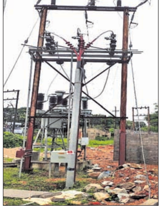
ହାରାକୁଦଠାରେ ଶୁଭାରମ୍ଭ ହୋଇଥିବା ୧୩୨/୩୩ କେଜି ଗ୍ରାଡ଼ ।

ସମ୍ବଲପୁର, ୧୯୮୮ (ବ୍ୟବହାର) ଚିପିତସୁଡ଼ିଏଲ ପକ୍ଷରୁ ହାରାକୁଦଠାରେ ଏକ ୧୩୨/୩୩ କେଜି ଗ୍ରାଡ଼ର ଶୁଭାରମ୍ଭ କରାଯାଇଛି। ଏଠାରେ ବ୍ୟାପାୟାଜିଥିବା ୨ଟି ପାଖର ପିଟରକୁ ବିଦ୍ୟୁତ୍ ସରବରାହ ସହିତ ସଂଯୋଗ କରିଦିଆଯାଇଛି। ଏହି ଗ୍ରାଡ଼ ଉପସ୍ଥାପନା ବ୍ଲକ୍‌ର ହାରାକୁଦ ସହର ବ୍ୟତୀତ ଭିମ୍ବାରକୁ ମଧ୍ୟ ଏକ ରିଙ୍ଗ ମାଧ୍ୟମରେ ସଂଯୋଗ କରାଯାଇଛି। ଏହାଦ୍ୱାରା ଭିମ୍ବାରକୁ ହାରାକୁଦ ଗ୍ରାଡ଼ରୁ ଆବଶ୍ୟକ ପୂରାବଳ ବିଦ୍ୟୁତ୍ ଯୋଗାଣ କରାଯାଇପାରିବ। ଯଦି କୌଣସି କାରଣରୁ ବିଦ୍ୟୁତ୍ ସେବାରେ ବ୍ୟାଘାତ ଘଟେ ତେବେ ଭିମ୍ବାରକୁ ଯେକୌଣସି ଗ୍ରାଡ଼ ମାଧ୍ୟମରେ ବିଦ୍ୟୁତ୍ ଯୋଗାଇ ଦିଆଯାଇପାରିବ। ଏ ନେଇ ଦୀର୍ଘଦିନରୁ ଅଞ୍ଚଳର ଜନସାଧାରଣ ଦାବି କରିଆସୁଥିଲେ। ଏହି ଗ୍ରାଡ଼