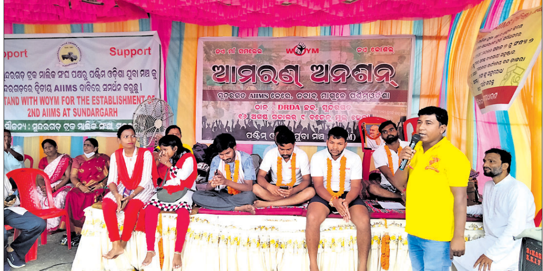
ସୁନ୍ଦରଗଡ଼ରେ ତିଆରିବିଧି ଛକରେ ଅନଶନ ଚାଲିଛି।