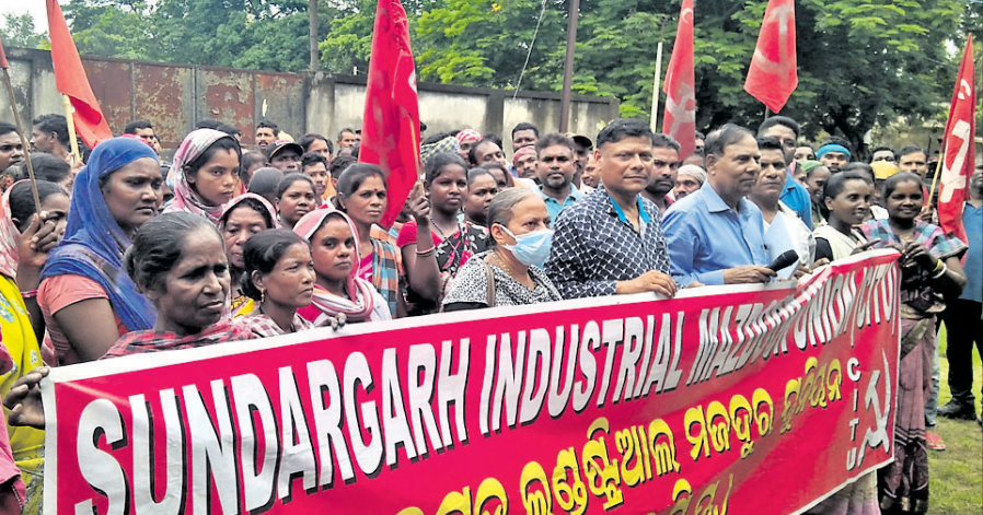
ସିବୁ ପକ୍ଷରୁ ବିକ୍ଷୋଭ ପ୍ରଦର୍ଶନ କରାଯାଇଛି।

ସୁନ୍ଦରଗଡ଼ ଜିଲା ଶିଳ୍ପ କାରଖାନାରେ କାର୍ଯ୍ୟରତ ଶ୍ରମିକ, କର୍ମଚାରୀମାନଙ୍କ ଲଏସ୍ଆଇ କାର୍ତ୍ତରେ ସେମାନଙ୍କୁ ଉପଯୁକ୍ତ ଚିକିତ୍ସା ସେବା କୁଆଁରମୁଣ୍ଡାସ୍ଥିତ ଲଏସ୍ଆଇ ଡିସପେନ୍ସାରୀରେ ମିଳୁ ନ ଥିବା ଓ ଦାୟିତ୍ଵରେ ଥିବା ଡାକ୍ତର, ସାମ୍ବଲ୍ କର୍ମଚାରୀଙ୍କ ମନୋମୁଖୀ କାର୍ଯ୍ୟକଳାପ ସହ ବାମପାରା ରୋଗୀଙ୍କୁ ଦୃଷ୍ୟବସ୍ତୁର ପ୍ରଦର୍ଶନ ପ୍ରତିବାଦରେ ଶୁକ୍ରବାର ସିବୁ ପକ୍ଷରୁ ଡିସପେନ୍ସାରୀ ଘେରାଉ କରାଯାଇଥିଲା। ସିବୁ ସହବନ୍ଧିତ ସୁନ୍ଦରଗଡ଼ ଇଣ୍ଡଷ୍ଟ୍ରିଆଲ ମକଦ୍ଦୁର ଯୁନିୟନ(ସିପୁ) ପକ୍ଷରୁ ଏହି ଘେରାଉରେ ନେତୃତ୍ଵ ଦେଇଥିଲାବେଳେ କୁଆଁରମୁଣ୍ଡା ଲଏସ୍ଆଇ ଡିସପେନ୍ସାରୀ ଡାକ୍ତର ବିକ୍ଷୋଭକାରୀ ଶ୍ରମିକ, କର୍ମଚାରୀମାନଙ୍କ ନେତୃତ୍ଵ ନେଉଥିବା ସିପୁର ସାଧାରଣ ସମ୍ପାଦକ ବାହାଜୀର