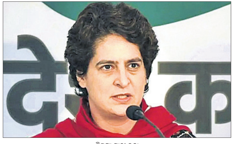
ପ୍ରିୟଙ୍କା ଗାନ୍ଧୀ ଭଦ୍ରା

କଂଗ୍ରେସ ଅଧକ୍ଷ ପଦ ପାଇଁ ଅଗଷ୍ଟ ୨୧ରୁ ସେପ୍ଟେମ୍ବର ୨୦ ମଧ୍ୟରେ ନିର୍ବାଚନ ଅନୁଷ୍ଠିତ ହେବ। କିନ୍ତୁ ପୁଣି ଥରେ ଦଳର ଅଧକ୍ଷ ହେବା ଲାଗି କଂଗ୍ରେସ ନେତା ରାହୁଲ ଗାନ୍ଧୀଙ୍କ କୌଣସି ଆଗ୍ରହ ଦେଖିବାକୁ ମିଳୁନାହିଁ।