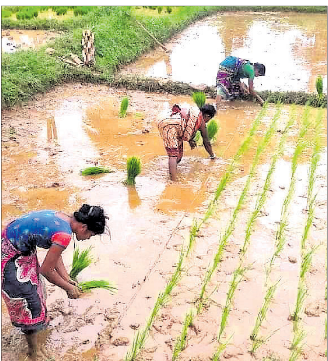
ସୁନ୍ଦରା ବ୍ଲକ୍ ଅଞ୍ଚଳରେ ଚାଷ କାର୍ଯ୍ୟ ଚାଲିଛି ।

ସମ୍ବଲପୁର, ୧୯୮୮ (ବ୍ୟବହାର) ଲଘୁଚାପ ଜନିତ ଲଗାଣ ବର୍ଷା ଚାଷୀଙ୍କୁ ଲାଭଦାୟକ ଆଶ୍ୱସ୍ତି ଦେଇଥିବା ବେଳେ ମାନେଶ୍ୱର ଓ ଧନକଉଡ଼ା ବ୍ଲକ୍‌ରେ ହୋଇଥିବା ଧାନ ଫସଲରେ ପାଣି ଜମି ନଷ୍ଟ ହୋଇଛି। ଚଳିତ ଖରିଫ ଋତୁ ଆରମ୍ଭରୁ ନିଅଣ୍ଟିଆ ବର୍ଷା ଯୋଗୁ ଚାଷକାର୍ଯ୍ୟ ଆଗେଇପାରି ନ ଥିଲା। ଆଖିାଡ଼ ଓ ଶ୍ରାବଣ ମାସରେ ଆବଶ୍ୟକ ଅନୁସାରେ ବୃଷ୍ଟିପାତ ହୋଇ ନ ଥିବାରୁ ଚାଷୀମାନେ ନିରାଶ ହୋଇପଡ଼ିଥିଲେ। ହାରାକୁଦ ଜଳଭଣ୍ଡାର ପାଣି ଉପରେ ନିର୍ଭର କରୁଥିବା ଚାଷୀ କ୍ଷୁଦ୍ର ଜଳସେଚନ ପ୍ରକଳ୍ପ, ଉଠାକଳସେଚନ ପ୍ରକଳ୍ପ ଯୋଗୁ ଚାଷ କାର୍ଯ୍ୟ କରିପାରିଥିଲେ। ହେଲେ ଅଣଜଳସେଚିତ ଅଞ୍ଚଳରେ ଚାଷକାର୍ଯ୍ୟ ସମ୍ପୂର୍ଣ୍ଣ ଠିକ୍ ହୋଇଯାଇଥିଲା। ବୁଣାଧାନରେ ମଧ୍ୟ ଗଜା ମରୁଡ଼ି ଦେଖାଦେଇଥିଲା। କୁଲାଇ ଶେଷ ପର୍ଯ୍ୟନ୍ତ ଜିଲ୍ଲାରେ ହାରାହାରି ୫୦ ପ୍ରତିଶତ ଚାଷ ହୋଇଥିବା କୃଷି ବିଭାଗ ପକ୍ଷରୁ ରିପୋର୍ଟ ଦିଆଯାଇଥିଲା।