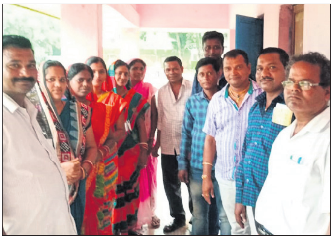
ପ୍ରଧାନଶିକ୍ଷକ ଓ କମିଟି ସଭାପତିଙ୍କ ସହ ପରିଚାଳନା କମିଟିର ଅନ୍ୟାନ୍ୟ ସଦସ୍ୟ ।