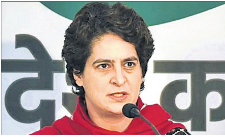
ପ୍ରିୟଙ୍କା ଗାନ୍ଧୀ ଭଦ୍ରା

୨୧୧୧ କଂଗ୍ରେସ ଅଧକ୍ଷ ନିର୍ବାଚନ ମନଃ ପରିବର୍ତ୍ତନ ରାହୁଲଙ୍କ ଅନାଗ୍ରହ ଚର୍ଚ୍ଚାରେ ସୁଶୀଳା ଶିନ୍ଦେ, ମଲ୍ଲିକାର୍ଜୁନ ଖାଟ୍ଟେ