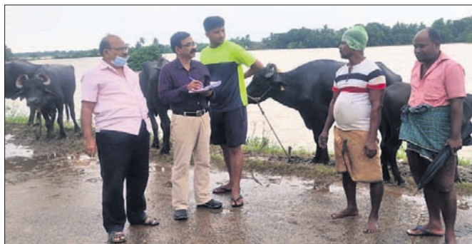
ପ୍ରାଣୀ ବିକ୍ଷେପ ଟିମ ଗୋଗୁରୁଡ଼ିକର ସାନ୍ଧ୍ୟାବସ୍ଥା ଯାଞ୍ଚ କରୁଛନ୍ତି ।

ଅଧିକାରୀମାନେ କାର୍ଯ୍ୟ କରୁଛନ୍ତି । ଗତି ନୋବାଇଲ ଖାତର ଟ୍ରିଟମେଣ୍ଟ ପ୍ଲାଣ୍ଟ ସ୍ଥାପନ କରାଯାଇ ପାନୀୟ ଜଳ ପାଇଁ ମାଧ୍ୟମରେ ଯୋଗାଣ ବ୍ୟବସ୍ଥା ହେଉଛି ।