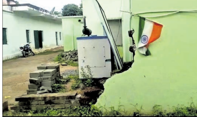
ବ୍ଲକ ଅଫିସରେ ଜାତୀୟ ପତାକାକୁ ଅସମ୍ମାନ ।

ବନ୍ଦପ୍ରସ୍ତୁପାଦ, ରଘୁତରୋଳମନା, ସିଂହାପଡ଼ା, ପଥରକଟା, କେନ୍ଦୁପଲ୍ଲା, ଧାନବେଙ୍ଗତା ଅଧୀନ ଅଧିକାରୀ ଗ୍ରାମ କ୍ଷତିଗ୍ରସ୍ତ ହୋଇଛି । ରାଜ୍ୟ ସରକାରଙ୍କ ଖଣ୍ଡପଡ଼ା ବ୍ଲକ ଅଧୀନ କୁହୁଣି, ଶାଳପଡ଼ିଆ, ବୋବାସ, ବନମାଳାପୁର, ରାଣିଲେଇବା, ବେଶାଗାଡ଼ିଆ, ଗଡ଼ିଆସାହି, କଣ୍ଠିଗୋ, ବାଣପୁର, ସିଧାପୁର, କୁସାରପଡ଼ା, ବନ୍ଦପ୍ରସ୍ତୁପାଦ, ରଘୁତରୋଳମନା, ସିଂହାପଡ଼ା, ପଥରକଟା, କେନ୍ଦୁପଲ୍ଲା, ଧାନବେଙ୍ଗତା ଅଧୀନ ଅଧିକାରୀ ଗ୍ରାମ କ୍ଷତିଗ୍ରସ୍ତ ହୋଇଛି । ରାଜ୍ୟ ସରକାରଙ୍କ ଖଣ୍ଡପଡ଼ା ବ୍ଲକ ଅଧୀନ କୁହୁଣି, ଶାଳପଡ଼ିଆ, ବୋବାସ, ବନମାଳାପୁର, ରାଣିଲେଇବା, ବେଶାଗାଡ଼ିଆ, ଗଡ଼ିଆସାହି, କଣ୍ଠିଗୋ, ବାଣପୁର, ସିଧାପୁର, କୁସାରପଡ଼ା, ବନ୍ଦପ୍ରସ୍ତୁପାଦ, ରଘୁତରୋଳମନା, ସିଂହାପଡ଼ା, ପଥରକଟା, କେନ୍ଦୁପଲ୍ଲା, ଧାନବେଙ୍ଗତା ଅଧୀନ ଅଧିକାରୀ ଗ୍ରାମ କ୍ଷତିଗ୍ରସ୍ତ ହୋଇଛି ।