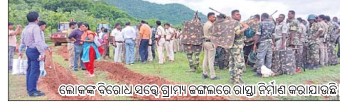
କୋକଳ ବିରୋଧୀ ସକ୍ଷେପ ଗ୍ରାମ୍ୟ ଜଙ୍ଗଲରେ ରାସ୍ତା ନିର୍ମାଣ କରାଯାଉଛି।

କଟକ ଅପିଏ/ନୟାଗଡ଼ ଅପିଏ, ୧୯୮ ନୟାଗଡ଼ ଜିଲ୍ଲା ଗୁଡୁପଞ୍ଜି ମୌଜାର ଗ୍ରାମ୍ୟ ଜଙ୍ଗଲ ଜମିରେ ରାସ୍ତା ନିର୍ମାଣ ସମ୍ପର୍କରେ ନ୍ୟାଶନାଲ ଗ୍ରାନ୍ଟ୍ ଟ୍ରଷ୍ଟମାଲ (ଏନ୍‌ଜିଟି)ର କମିଶନରୀତ ପୂର୍ଣ୍ଣାଞ୍ଚଳ ଜୋନ ବେଞ୍ଚରେ ହୋଇଥିବା ମାମଲାରେ ନୟାଗଡ଼ ଜିଲ୍ଲାପାଳ, ଜଙ୍ଗଲ ବିଭାଗ ତିଏପ୍‌ଓକୁ ୧୦ ଦିନ ମଧ୍ୟରେ ସତ୍ୟପାଠ ଦାଖଲ କରିବାକୁ ରୁଧିର ନିର୍ଦ୍ଦେଶ ଦିଆଯାଇଛି। ମାମଲା ଅନୁସାରେ, ବକ୍‌ଭଦ୍ରପୁରଠାରୁ ଡିପମାଳ ପର୍ଯ୍ୟନ୍ତ ନିର୍ମାଣାଧୀନ ରାସ୍ତାର କିଛି ଅଂଶ ନୟାଗଡ଼ ଜିଲ୍ଲା ଗୁଡୁପଞ୍ଜି ମୌଜାର ଖାତା ନଂ. ୫୧୦ ଓ ପୁଅ ନଂ ୭୭୩ ଗ୍ରାମ୍ୟ ଜଙ୍ଗଲ କ୍ଷେତ୍ରରେ ହୋଇଥିବା ଅଭିଯୋଗ ହୋଇଛି। ଉକ୍ତ ଖାତାର ୫୩.୬୦ ଏକର ଓ ୮.୯୪ ଏକର ପରିମିତ ଜମି ଜଙ୍ଗଲ କ୍ଷେତ୍ରରେ ହୋଇଥିବା ବେଳେ ରାସ୍ତା ନିର୍ମାଣ