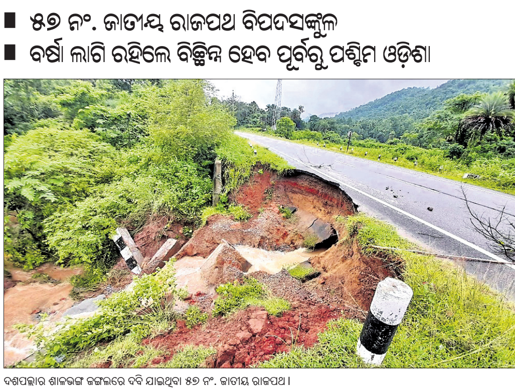
ଦଶପଲ୍ଲାର ଶାଳଭଙ୍ଗା ଜଙ୍ଗଲରେ ଡରି ଯାଇଥିବା ୫୭ ନଂ. ଜାତୀୟ ରାଜପଥ ।

ନୟାଗଡ଼ ଅଫିସ୍/ଦଶପଲ୍ଲା, ୧୯୮୮(ଡି.ଏସ୍.ଏ.) ବଲାଙ୍ଗୀର-ଖୋର୍ଦ୍ଧା ୫୭ ନଂ. ଜାତୀୟ ରାଜପଥର ଦଶପଲ୍ଲା ବ୍ଲକ ଚାକେରା ନିକଟସ୍ଥ ଶାଳଭଙ୍ଗା ଜଙ୍ଗଲ ନିକଟରେ ୧୫ ଫୁଟର ରାସ୍ତା ପ୍ରାୟ ୩୦ ଫୁଟ ତଳକୁ ଡରି ଯାଇଛି । ୧୫ ଫୁଟ ରାସ୍ତା ଡରିବା ପରେ ଏଠାର ରାଜପଥ ପୁଣି ଡରିବା ଆରମ୍ଭ ହୋଇଛି । ରାସ୍ତାର ବିଭିନ୍ନ ସ୍ଥାନରେ ଫାଟ ଖୁଣ୍ଟି ହୋଇଛି । ଲଗାଣ ବର୍ଷା ଲାଗି ରହିଲେ ବିପଦସଙ୍କୁଳ ଭାବେ ରହିଥିବା ଶାଳଭଙ୍ଗା ନିକଟସ୍ଥ ରାସ୍ତା ପୁଣି ଡରିବାର ସମ୍ଭାବନା ରହିଛି । ଏପରିକି ରାଜପଥରେ ୨୦ରୁ ୩୦ ଫୁଟର ଗର୍ଭ ହୋଇଯିବ । ରାଜପଥରେ ବଡ଼ ଧରଣର ଗର୍ଭ ଖୁଣ୍ଟି ହେବା ପରେ ପୂର୍ବରୁ ପଶ୍ଚିମ ଓଡ଼ିଶାର ଯୋଗାଯୋଗ ବିଚ୍ଛିନ୍ନ ହୋଇଯିବ । ରାସ୍ତାପାର୍ଶ୍ୱରେ ସୁରକ୍ଷା ପ୍ରାଚୀରର ଆବଶ୍ୟକତା ଥିବାବେଳେ ଜାତୀୟ ରାଜପଥ କର୍ତ୍ତୃପକ୍ଷ ଏହାକୁ ଅଣଦେଖା କରିଥିଲେ । ଲଗାଣ ବର୍ଷାର ପ୍ରଭାବରେ ଶୁକ୍ରବାର ରାଜପଥରୁ ଅତଡ଼ା ଖସି ରାସ୍ତାକୁ ବିପଦସଙ୍କୁଳ କରି ପକାଇଛି ।