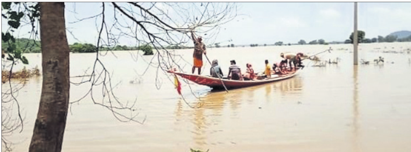
ଭାପୁର ବ୍ଲକ୍ ମଣିପୁର ଧାନ ଜମିରେ ବନ୍ୟା ଚାଲୁଛି।

ମହାନଦୀର ବନ୍ୟା ଓ ଲଗୁନାପ ବର୍ଷା ପ୍ରଭାବରେ ନୟାଗଡ଼ ଜିଲା ଅଞ୍ଚଳରେ ୭୯୯୯ ଧରି ବନ୍ୟାଜଳ ଚାଷ ଜମିରୁ ଛାଡ଼ିନାହିଁ। ଫଳରେ ଜମି କରାଯାଇଥିବା ଧାନ ଓ ପନିପରିବା ଫସଲ ନଷ୍ଟ ହୋଇଯାଇଛି। ଏହାକୁ ନେଇ ଚାଷୀ ଚିତ୍ରାରେ ପଡ଼ିଛି। ଜମିରୁ ବନ୍ୟାଜଳ ହ୍ରାସ ପାଇ ନ ଥିଲେ ମଧ୍ୟ କୃଷି ବିଭାଗ ପକ୍ଷରୁ ଏକ ପ୍ରାରମ୍ଭିକ ରିପୋର୍ଟ ସରକାରଙ୍କୁ ପ୍ରଦାନ କରାଯାଇଛି। ଏଥିରେ ନୟାଗଡ଼ ଜିଲାର ୫୮ଟି ବ୍ଲକ୍ ୨୬ ପଞ୍ଚାୟତ ଅନ୍ତର୍ଗତ ୧୨୭ ଗାଁର ୪,୨୩୪ ହେକ୍ଟର ଜମିରେ ହୋଇଥିବା ଧାନ ଓ ଅନ୍ୟ ଫସଲ ଉପରେ ବନ୍ୟାଜଳ ମାଡ଼ି ରହିଥିବା ବର୍ଣ୍ଣାଯାଇଛି। ଭାପୁର ବ୍ଲକ୍ରେ ଅଧିକାଂଶ ଫସଲ ଉପରେ ବନ୍ୟା ଜଳ ହୁଡ଼ି ରହିଛି। ସରକାରୀ ଭାବେ ଫସଲ କ୍ଷୟକ୍ଷତି ଦର୍ଶା ଯାଇ ନ ଥିବାବେଳେ ସେଥିପାଇଁ ଆବେଦନ ପନିପରିବା ଫସଲ ପତି ସାରିଲାଣି ବୋଲି ଅଧିକାରୀ ଚାଷୀ ମତବ୍ୟକ୍ତ କରୁଛନ୍ତି। ମହାନଦୀରେ ବନ୍ୟା ଯୋଗୁ ଗଣିଆ ବ୍ଲକ୍ରେ ୭ ପଞ୍ଚାୟତର ୭୬ ଗାଁର ୧,୩୫୮ ହେକ୍ଟର ଧାନ ଓ ୪୮୬ ହେକ୍ଟର ଅନ୍ୟ ଫସଲ ଏପରିମୋଟରେ ୧,୮୪୪ ହେକ୍ଟର ଜମିରେ ବନ୍ୟାଜଳ ଛାଡ଼ି ନାହିଁ। ସେହିଭଳି