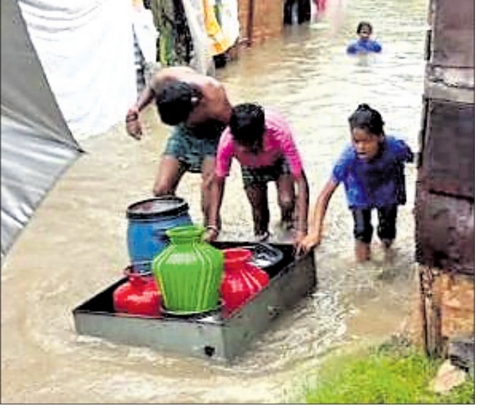
ମାର୍ଗାଘାଟ ବ୍ଲକ ବାଲିସଂଘରେ ପାନୀୟ ଜଳ ସଂଗ୍ରହ ପରେ ଚିଶା ଡ୍ରେରେ ନିଆଯାଉଛି। ମାର୍ଗାଘାଟର ଅଭିଭାବରେ ପାଣି ଘେରରେ ଥିବା ନଳକୂପ ପାନୀୟ ଜଳ ପିଲାମାନେ ନେଉଛନ୍ତି।

ମହାନଦୀର ହାରାହୁଡ଼ ଜଳଭଣ୍ଡାର ଧାରଣା କ୍ଷମତାକୁ ଲକ୍ଷ୍ୟ ରଖାଯାଇ ରେଗୁଲେଟିଂ ବନ୍ଦ ହେଉଛି। ଚଳିଥିବା କେନ୍ଦ୍ରାପଡ଼ା ପଞ୍ଚାୟତରେ ବନ୍ୟା ଜଳ ପ୍ରବାହ ହୁଏ ପାଇଁ। ଏହାପରେ ମହାନଦୀ ସିଂସୁପରେ କେନ୍ଦ୍ରାପଡ଼ା ଜିଲ୍ଲାରେ ପ୍ରବାହିତ ହେଉଥିବା ଲୁଣା, କରାଡ଼ିଆ, ଚିତ୍ରୋତ୍ପଳା, ପାଇକା ନଦୀର ଜଳସ୍ତର ବିପଦ ସଙ୍କେତ ଉପରେ ରାଜୁଛି। ଗତ ୩ ଦିନ ଧରି ୮୬ ଗ୍ରାମରେ ବନ୍ୟାଜଳ ପ୍ରବେଶ କରିଥିଲା ବେଳେ ୨୪ ଘଣ୍ଟା ମଧ୍ୟରେ ଏହି ସଂଖ୍ୟା ୯୩କୁ ବୃଦ୍ଧି ପାଇଛି। ସେହିପରି ନଦୀବନ୍ଧଗୁଡ଼ିକର ଘିଲିଆ ସଂଖ୍ୟା ୧୦୫ରେ ପହଞ୍ଚିଛି। ଲୋକଙ୍କୁ ସ୍ଥାନାନ୍ତର କରି ଖାଦ୍ୟ, ପାନୀୟ ଜଳ, ସ୍ୱାସ୍ଥ୍ୟ ସେବା ପରି ମୌଳିକ ଆବଶ୍ୟକତାକୁ ରୁଜୁ ଦିଆଯାଇଥିବା ପ୍ରଶ୍ନାସନ ପକ୍ଷରୁ କୁହାଯାଉଛି। ବନ୍ୟା ଯୋଗୁ ଚାରି ଆଡେ ପାଣି ଥିବାବେଳେ ବିପନ୍ନ ଯାତ୍ରୀଙ୍କୁ ପାନୀୟ ଜଳ ମିଳୁନାହିଁ ବୋଲି ସେମାନେ ଅଭିଯୋଗ କରିଛନ୍ତି। ଜିଲ୍ଲା ଜରୁରିକାଳୀନ ବିଭାଗ ତଥ୍ୟ ଅନୁଯାୟୀ, ଜିଲ୍ଲାର ୭ ବ୍ଲକ ଅଞ୍ଚଳ ବନ୍ୟା ଘେରରେ ଅଛି। ଅଧ୍ୟାପ୍ୟ ମୋଟ ୯୩ ପଞ୍ଚାୟତର ୯୨,୮୨୨ ଲୋକ ଏଥିରେ ପ୍ରଭାବିତ ହୋଇଛନ୍ତି। ୮୫ଟି ଗ୍ରାମର ୨୧,୫୬୦