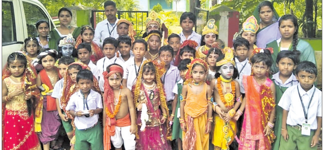
ରାଧାକୃଷ୍ଣ, ସଶୋଭା, ନନ୍ଦ ବେଶ୍‌ରେ ପିଲାମାନେ ।