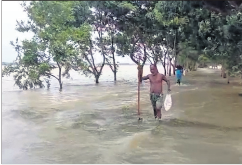
ଜଣେ ବ୍ୟକ୍ତି ହୁସୁରା ପଞ୍ଚାୟତସ୍ଥିତ ପାଣିକମିଥୁବା ରାସ୍ତାରେ ଯାଉଛନ୍ତି ।