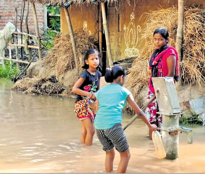
ଧରି ବନ୍ୟା ସ୍ଥିତି ସହ ସଂଘର୍ଷ କରୁଛି। ୧୦୫ଟି ଘିଲିଆ ବିଭିନ୍ନ ନଦୀବନ୍ଧରେ ହୋଇଥିବା ବେଳେ ଏହାର ମରାମତି ଅନ୍ୟ ଗ୍ରାମରେ ଶୁଖିଲା ଖାଦ୍ୟ ଓ ପାନୀୟ ଜଳ ବିତରଣ କରାଯାଇଛି। ସେହିପରି ମାର୍ଗାଘାଟ ବ୍ଲକ ଡିହବଳରାମପୁର ମୋଟ ୨୧,୮୮୨ଟି ଗୃହପାଳିତ ପଶୁ ବନ୍ୟା ଜଳ ଘେରରେ ଥିବା ବେଳେ ୯୨,୮୨୨ ଲୋକ ଏଥିରେ ପ୍ରଭାବିତ ହୋଇଛନ୍ତି। ୮୫ଟି ଗ୍ରାମର ୨୧,୫୬୦