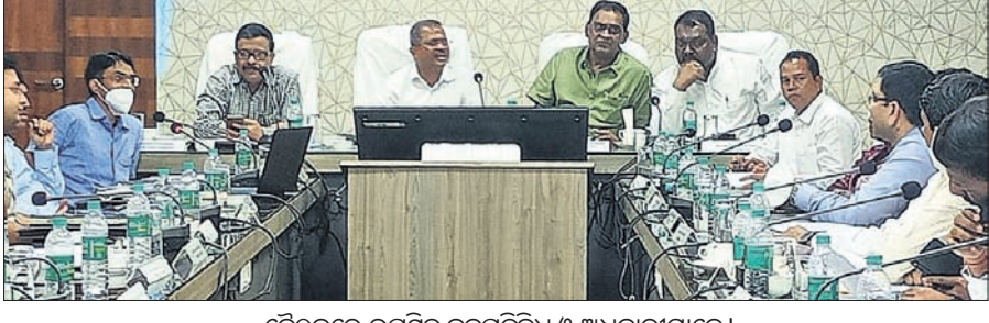
ବୈଠକରେ ଉପସ୍ଥିତ ଜନପ୍ରତିନିଧି ଓ ଅଧିକାରୀମାନେ।