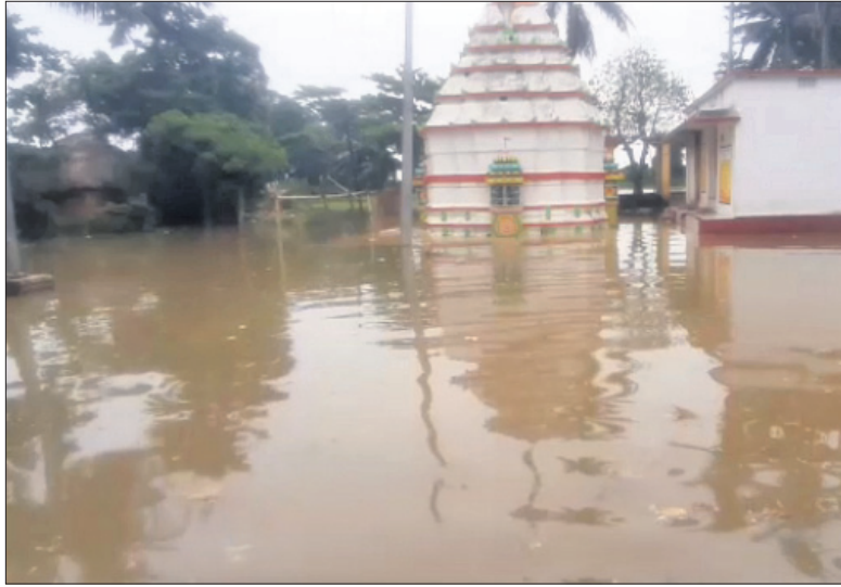
ଗୋବର୍ଦ୍ଧନପୁର- କୋଲାର ରୋଡ଼ସ୍ଥିତ ନୃସିଂହ ଠାକୁରଙ୍କ ମନ୍ଦିର ପାଣି ଘେରରେ ରହିଛି ।