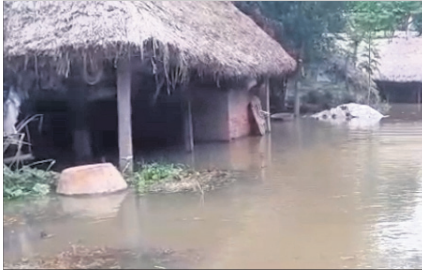
ବଡ଼ବାଲକଣା ଗ୍ରାମରେ ଘର ବୁଡ଼ିକରେ ପାଣି ପଶିଛି ।