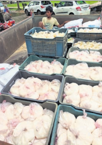
ରନ୍ଧ୍ୟାଖାଦ୍ୟ ପଠାଯାଇଛି ।