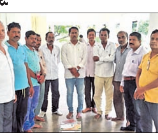
ଭାପୁର, ୧୯୮୮ (ଡି.ଏନ.ଏ.): ନୟାଗଡ଼ ଜିଲା ଭାପୁର ବ୍ଲକ୍ ଉପକଣ୍ଠ ଭାପୁର ବଜାରର ମା' ବ୍ରାହ୍ମଣୀଦେବୀ ଗଣିକ ସଂଘର ନୂତନ କର୍ମକର୍ତ୍ତା ନିର୍ବାଚନ ଶୁକ୍ରବାର ସ୍ଥାନୀୟ ତାଳବଙ୍ଗକାଳରେ ଅନୁଷ୍ଠିତ ହୋଇଯାଇଛି।