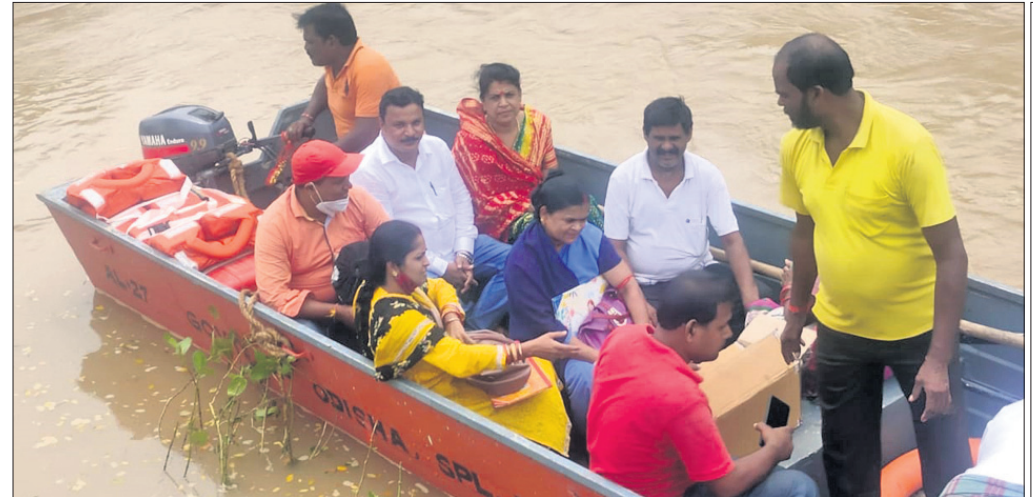
କାଠକୋଟ ପଞ୍ଚାୟତକୁ ବୋର୍ଡ଼ ଯୋଗେ ପାଣି ପ୍ୟାକେଟ୍ ନିଆଯାଇଛି ।

ଭିଟି, ୧୯୮୮ (ଡି.ଏନ.ଏ): ଭିଟି ତହସିଲ ଅନ୍ତର୍ଗତ ଉତ୍ତର ଶାସନ ସାମଲ ସାହିର ୩୬ ପରିବାରଙ୍କ ଘରେ ବନ୍ୟା ଜଳ ପ୍ରବେଶ କରିଛି ।