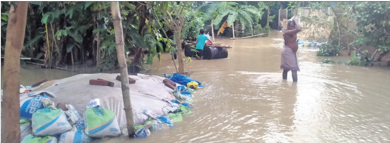
ଜୟଶଙ୍କରପୁର ଗ୍ରାମ ରାସ୍ତାରେ ପାଣି ଜମିଛି ।

କୁଳଙ୍କ, ୧୯୮୮ (ଡି.ଏନ.ଏ.): କୁଳଙ୍କ ବ୍ଲକ୍ରେ ୫ ଦିନ ହେବ ଜଳବନ୍ୟା ଥିବା ବନ୍ୟାବିପଦର ଦୁର୍ଦ୍ଦଶା ବଢ଼ିଯାଇଛି । ଗୁରୁବାର ରାତିରୁ ପୁନର୍ବାର ଲଘୁଚାପଜନିତ ବର୍ଷା ଆରମ୍ଭ ହୋଇଛି ।