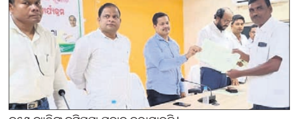
ଜଣ ବ୍ୟକ୍ତିଙ୍କୁ ଜମିପତା ପ୍ରଦାନ କରାଯାଇଛି।

ନୂଆଗାଁ ବ୍ଲକ୍ କାର୍ଯ୍ୟାଳୟରେ ଶୁକ୍ରବାର ଜମି ପତା ବଣ୍ଟନ କାର୍ଯ୍ୟକ୍ରମ ଅନୁଷ୍ଠିତ ହୋଇଯାଇଛି। ଏହାଦ୍ୱାରା ବ୍ଲକ୍ରେ ବିଭିନ୍ନ ପଞ୍ଚାୟତର ହିରାଧିକାରୀମାନଙ୍କୁ ବସ୍ତୁକ୍ତ ଯୋଜନାରେ ଜମି ପତା ଦିଆଯିବା ସହ ହାଇସ୍କୁଲକୁ ମଧ୍ୟ ନିଜ ଜାଗାର ପତା ଦିଆଯାଇଛି। ବସ୍ତୁକ୍ତ ଯୋଜନାରେ ମୋଟ ୩୬ ଜଣ ହିରାଧିକାରୀ ଓ ୬ଟି ହାଇସ୍କୁଲକୁ ମଧ୍ୟ ଜମିପତା ଦିଆଯାଇଛି।