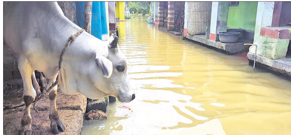
ଖୋର୍ଦ୍ଧା ଜଳର ଏକ ଗ୍ରାମରେ ଜମି ରହିଥିବା ବନ୍ୟାଜଳ ।

ଶିକ୍ଷାନବୀକ୍ଷ ୭୫୧୩୬ ଅଧିକାରୀଙ୍କୁ ଜମି ଅଧିଗ୍ରହଣ ତାଲିମ