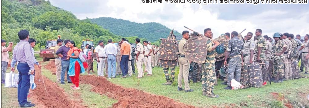
ଲୋକଙ୍କ ବିରୋଧ ସତ୍ତ୍ୱେ ଗ୍ରାମ୍ୟ ଜଙ୍ଗଲରେ ରାସ୍ତା ନିର୍ମାଣ କରାଯାଉଛି ।

କଟକ ଅଫିସ୍/ନୟାଗଡ଼ ଅଫିସ୍, ୧୯୮୮ ନୟାଗଡ଼ ଜିଲ୍ଲା ଗୁରୁପଞ୍ଚମୀ ମୌଳିକ ଗ୍ରାମ୍ୟ ଜଙ୍ଗଲ କମିସନର ରାସ୍ତା ନିର୍ମାଣ ସମ୍ପର୍କରେ ନିର୍ଦ୍ଦେଶ ଦିଆଯାଇଛି । କମିସନର ଦ୍ୱାରା ନିର୍ଦ୍ଦେଶ ଦିଆଯାଇଛି ।