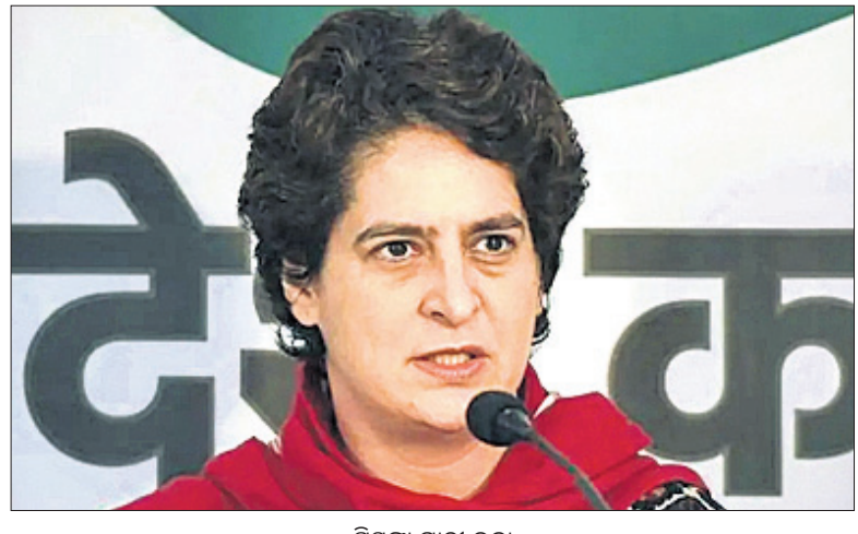
ପ୍ରିୟଙ୍କା ଗାନ୍ଧୀ ଭଗ୍ନ