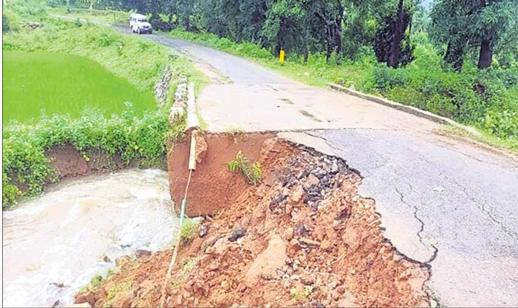
ଲଘୁଗାପକନିତ ଲଗାଣ ବର୍ଷା ଯୋଗୁ କନ୍ଧମାଳ ଜିଲ୍ଲା ବାଲିଗୁଡ଼ା ଉପଖଣ୍ଡ ଅନ୍ତର୍ଗତ ଦାରିଙ୍ଗବାଡ଼ି ବ୍ଲକ ତିଲୋରୀ ପଞ୍ଚାୟତର ସାମନବା ଗ୍ରାମ ନିକଟରେ ଥିବା ପୋଲର ପାର୍ଶ୍ୱ ରାସ୍ତା ଯୋଇହୋଇ ଧସିଯାଇଛି।

ଅପରେଶନରେ ନିକଟସ୍ଥ ଜଙ୍ଗଲକୁ ଯାଇଥିଲେ। ଏହି ସମୟରେ ଦୁଇଗଣରେ ଯାଉଥିବା ଏକ ଗ୍ରାହକଙ୍କୁ ସନ୍ଦେହ କରି ସର୍କାରମାନେ ପିଛା କରି ତାହାକୁ ଅଟକାଇଥିଲେ। ପରେ ଗ୍ରାହକ ଯାଅନ୍ତେକ ସେଥିରୁ ୧୦ ଡିଗ୍ରୀରେ, ୧୫ ମିଟର କଡ଼େଇ ଡାକ, ୪ଟି ଜେଲ୍‌ମାଟ୍ରିକ୍ ଡାକ, ୧୦୦ ମିଟର ଜେଲ୍‌ମାଟ୍ରିକ୍ ଡାକ ଓ ବହୁ ପରିମାଣର ରାଶନ ସାମଗ୍ରୀ ମିଳିଥିଲା। ସର୍କାରମାନେ ସେଗୁଡ଼ିକୁ ଜବତ କରି ଗାଡିରେ ଥିବା ୨ଜଣଙ୍କୁ ଆନାକୁ ଆଣି ପଚରାଉଚରା କରିଥିଲେ। ଉଭୟ ଚିତ୍ରାଗୁଣୀ ମାଓବାଦୀ ଦଳମାନଙ୍କୁ ସମ୍ବନ୍ଧ ସମ୍ପର୍କ। ଏହିସାମଗ୍ରୀଗୁଡ଼ିକୁ ମାଓବାଦୀଙ୍କ କ୍ୟାମ୍ପକୁ ନିଆଯାଉଥିଲା ବୋଲି ଗିରଫ ୨ ମାଓବାଦୀମାନେ ଘୋଷଣା ଆଗରେ କରିଛନ୍ତି। ଉଭୟଙ୍କୁ ଘୋଷଣା ଅଧିକ ପଚରାଉଚରା କରୁଛି।