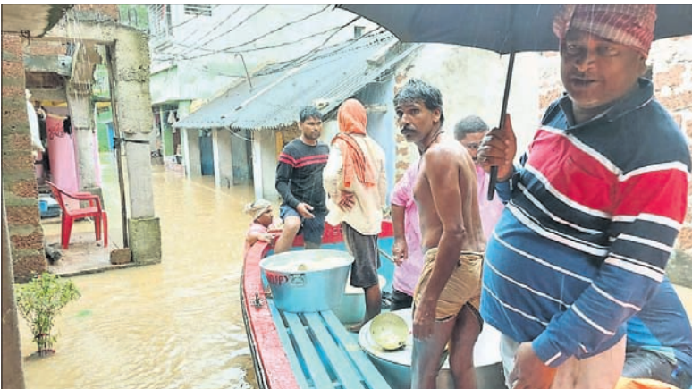
ପ୍ରଶାସନ ପକ୍ଷରୁ ବନ୍ୟା ପୀଡ଼ିତଙ୍କୁ ରକ୍ଷାଖାତ୍ୟ ପ୍ରଦାନ କରାଯାଇଛି ।