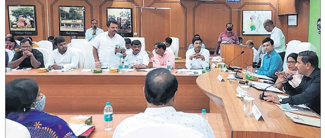
ବିକାଶ ପାଇଁ ପ୍ରତି ଓଡ଼ିଶାକୁ କୋଟିଏ କର୍ମସୂଚୀ ପ୍ରକାଶ କରାଯାଇଛି।

ବିକାଶ ପାଇଁ ପ୍ରତି ଓଡ଼ିଶାକୁ କୋଟିଏ କର୍ମସୂଚୀ ପ୍ରକାଶ କରାଯାଇଛି। ବିକାଶ ପାଇଁ ପ୍ରତି ଓଡ଼ିଶାକୁ କୋଟିଏ କର୍ମସୂଚୀ ପ୍ରକାଶ କରାଯାଇଛି।