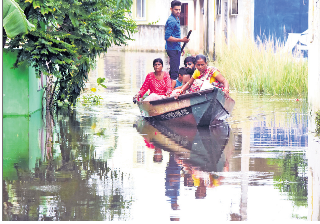
ପୂର୍ବା ସହାୟତା ପ୍ରଦାନ ପାଇଁ ପଞ୍ଚାଙ୍ଗ ପଢ଼ିବାକୁ ନିର୍ଦ୍ଦେଶ ଦେଇଛନ୍ତି।

ବନ୍ୟା ପ୍ରଭାବିତ ଜିଲ୍ଲାରେ ପୂର୍ବା ସହାୟତା ପ୍ରଦାନ ପାଇଁ ପଞ୍ଚାଙ୍ଗ ପଢ଼ିବାକୁ ନିର୍ଦ୍ଦେଶ ଦେଇଛନ୍ତି।