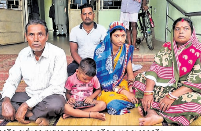
ଚଞ୍ଚକତା କାର୍ଯ୍ୟକ୍ରମ ଆଗରେ ସବେଶ୍ୱରକ ପରିବାର ଧାରଣା ଦେଇଛନ୍ତି ।

ଚଞ୍ଚକତା କରି ଜମି ହତୁପ କରିନେଇଥିବା ଅଭିଯୋଗରେ ଶୁକ୍ରବାର ପାସିପଦା ମୌଜାର ସର୍ବେକ୍ଷଣ ବରାଡ ଏବଂ ତାଙ୍କ ପରିବାର ଧାରଣା ଦେଇଥିଲେ ।