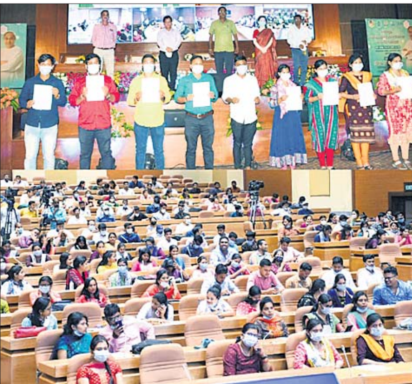
ଲୋକସେବା ଭବନ ନୂତନ ସମ୍ମିଳନୀ କକ୍ଷରେ ଶୁକ୍ରବାର ପୁଖ୍ୟମନ୍ତ୍ରୀ ନବୀନ ପଟ୍ଟନାୟକ ଆଭାସି ମାଧ୍ୟମରେ ୫୫୦ ଚେକ୍ରିସିଆନଙ୍କୁ ମାର୍ଗଦର୍ଶନ କରାଯାଇଛି। ନିକଟରେ ଅଛନ୍ତି ୫-ଟି ସଚିବ ଭି.କେ. ପାଣିଆନ୍।