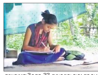
ମୁଖ୍ୟମନ୍ତ୍ରୀଙ୍କୁ ଚିଠି ଲେଖିବା ପାଇଁ ପଠାଇଥିବା ଛାତ୍ରୀ ପୁସ୍ତକ।

ବାଲେଶ୍ୱର ଜିଲ୍ଲା ରେଭିନ୍ୟୁ ଓ ମୁଖ୍ୟମନ୍ତ୍ରୀଙ୍କୁ ଚିଠି ଲେଖିବା ପାଇଁ ପଠାଇଥିବା ଛାତ୍ରୀ ପୁସ୍ତକ। ବାଲେଶ୍ୱର ଜିଲ୍ଲା ରେଭିନ୍ୟୁ ଓ ମୁଖ୍ୟମନ୍ତ୍ରୀଙ୍କୁ ଚିଠି ଲେଖିବା ପାଇଁ ପଠାଇଥିବା ଛାତ୍ରୀ ପୁସ୍ତକ।