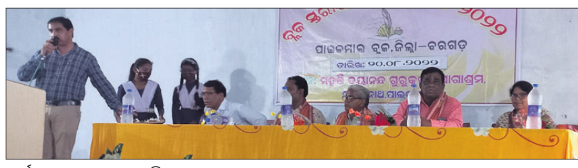
କାର୍ଯ୍ୟକ୍ରମରେ ମଞ୍ଚାସୀନ ଅତିଥିଙ୍କୁ ଦର୍ଶାଇବା ପାଇଁ ଯୋଜନା କରାଯାଇଥିଲା।

ପାଇକପାଳ, ୨୦୧୮ (ଡି.ଏନ୍.ଏ): ବରଗଡ଼ ଜିଲ୍ଲା ପାଇକପାଳ ବ୍ଲକ୍ ପର୍ଯ୍ୟନ୍ତ ପଞ୍ଚାୟତ ଅଧୀନ ଯୋଡ଼ା ଗ୍ରାମ୍ୟରେ ଶ୍ରମିକର ବୃକ୍ଷରୋପଣ କାର୍ଯ୍ୟକ୍ରମ ଅନୁଷ୍ଠିତ ହୋଇଛି।