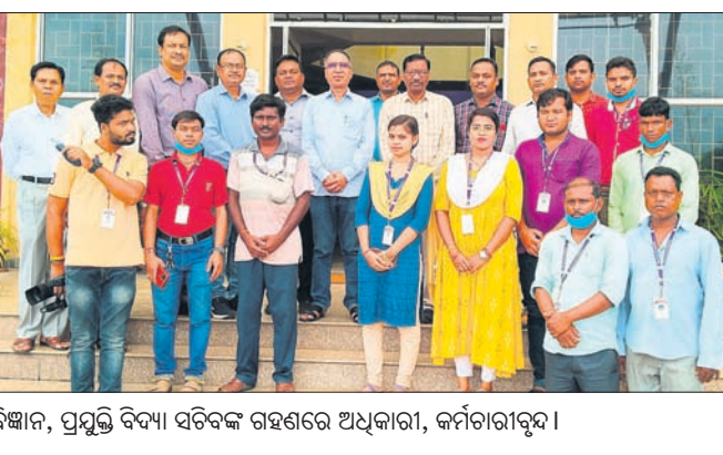
ବିଜ୍ଞାନ, ପ୍ରଯୁକ୍ତି ବିଦ୍ୟା ସଚିବଙ୍କ ରହଣିରେ ଅଧିକାରୀ, କର୍ମଚାରୀଙ୍କୁ ଦର୍ଶାଇବା ପାଇଁ ଯୋଜନା କରାଯାଇଥିଲା।