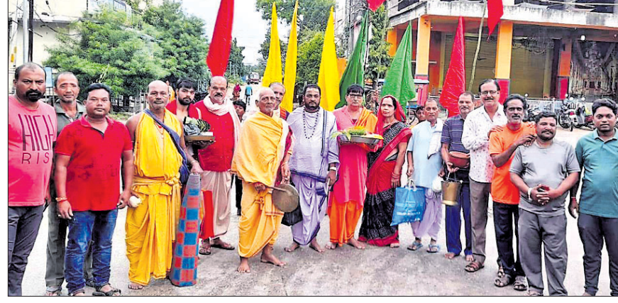
ଦୁର୍ଗାପୂଜା ପାଇଁ ମାଟି ଅନୁକୂଳ ହେବ

ଦୁର୍ଗାପୂଜା ପାଇଁ ମାଟି ଅନୁକୂଳ ହେବ। ଭୁବନେଶ୍ୱରର ଦୁର୍ଗାପୂଜା କମିଟି ମାଟି ଅନୁକୂଳ ହେବ।