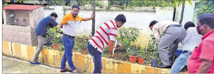
ଡିଆରଟିଏ ପରିସରରେ ଅନୁଷ୍ଠିତ ସଫେଇ ଅଭିଯାନ।

ପାଇକପାଳ, ୨୦୧୮ (ଡି.ଏନ୍.ଏ): ବରଗଡ଼ ଜିଲ୍ଲା ପାଇକପାଳ ବ୍ଲକ୍ ପର୍ଯ୍ୟନ୍ତ ପଞ୍ଚାୟତ ଅଧୀନ ଯୋଡ଼ା ଗ୍ରାମ୍ୟରେ ଶ୍ରମିକର ବୃକ୍ଷରୋପଣ କାର୍ଯ୍ୟକ୍ରମ ଅନୁଷ୍ଠିତ ହୋଇଛି।