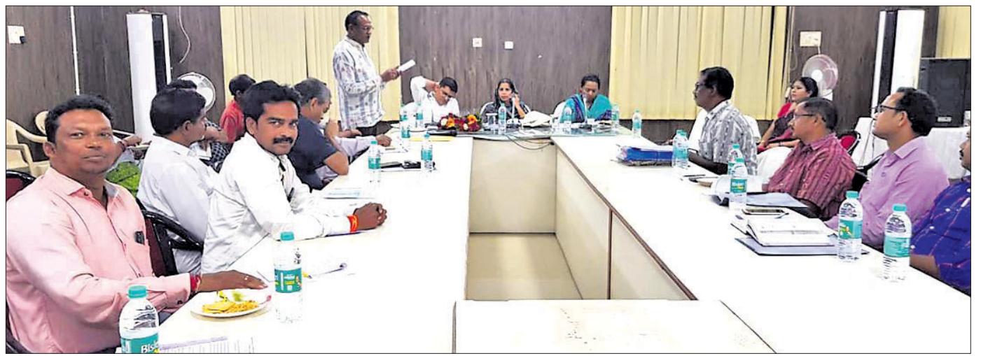
ବୈଠକରେ ଉପସ୍ଥିତ ହସ୍ତତନ୍ତ, ବୟନ ଶିଳ୍ପ ମନ୍ତ୍ରୀ, ଜିଲ୍ଲାପାଳ ଏବଂ ଅନ୍ୟ ଅଧିକାରୀଙ୍କୁ ଦର୍ଶାଇବା ପାଇଁ ଯୋଜନା କରାଯାଇଥିଲା।

ଅଗଷ୍ଟ ୧୯, ୨୦୧୮ (ଡି.ଏନ୍.ଏ): ବରଗଡ଼ ଜିଲ୍ଲା ଅଗଷ୍ଟ ୧୯ ତାରିଖ ଦିନ ପାଲିକଟା ପର୍ଯ୍ୟନ୍ତ ବରଗଡ଼ ଜିଲ୍ଲା କ୍ୟାମ୍ପ୍ ଛକରେ ଶୁକ୍ରବାର ରାତିରେ ଏକ ଦୁର୍ଘଟଣାରେ ଜଣେ ବାଳକ ଆରୋହୀଙ୍କ ମୃତ୍ୟୁ ହୋଇଛି।