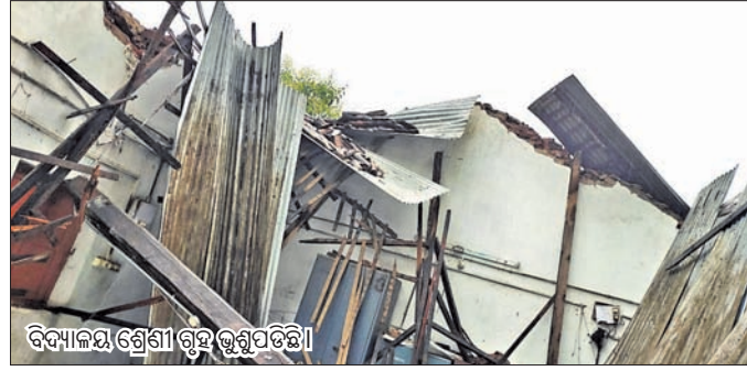
ବିଦ୍ୟାଳୟ ଶ୍ରେଣୀ ଗୃହଭୂମି

୧୫ ଜଣିଆ ଉପଦେଶ୍ୟା କମିଟି ଗଠନ କରାଯାଇଛି। ଅତିରଳ ଭାବେ ତ ମହେଶ୍ୱର ପଦନାୟକ ଏବଂ ଜୟଧର ମହାପାତ୍ର ଦାୟିତ୍ୱ ଦିଆଯାଇଛି।