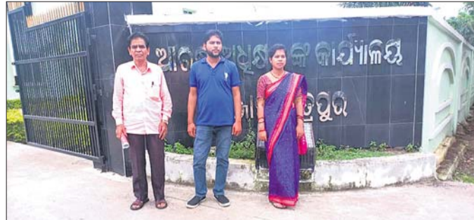
ଏସ୍‌ପିସ୍କୁ ଭେଟିଲେ ପରିବାରବର୍ଗ ।

ପ୍ରସ୍ତାବିତ କାରଖାନା ଏକାଧିକ ସରକାର ବାଟିଲ କରିଦେଲେ। ଦିଆଯାଇଥିବା ଜମି ମଧ୍ୟ ଜିଲ୍ଲା ପ୍ରଶାସନକୁ ଫେରସ୍ତ କରିଦିଆଗଲା।