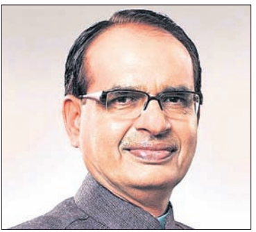
ଶିବରାଜ ସିଂ ରୌହାନ

ବ୍ୟୁତ୍କା, ୨୦୧୮: ଭାଜପା ସଂସଦୀୟ ବୋର୍ଡ଼ରୁ ବାହାର ହେବା ନେଇ ମଧ୍ୟପ୍ରଦେଶ ମୁଖ୍ୟମନ୍ତ୍ରୀ ଶିବରାଜ ସିଂ ରୌହାନ ପୂର୍ଣ୍ଣ ଖୋଲିଛନ୍ତି।