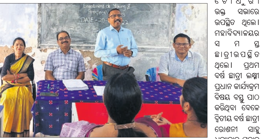
କାର୍ଯ୍ୟକ୍ରମରେ ଉପସ୍ଥିତ ଅତିଥିମାନେ ।

ମୋବାଇଲ ଆପ ଯଥା 'ଭୋଟର ହେଲପ ଲାଇନ', 'ଭୋଟର ପୋର୍ଟାଲ', ନ୍ୟାସନାଲ ଭୋଟର ସର୍ଭିସ ପୋର୍ଟାଲ ଉପରେ ଆଲୋଚନା କରି ପଞ୍ଜିକରଣ କରିବାର ଦୃଷ୍ଟାନ୍ତ ଦେଖାଇଥିଲେ ।