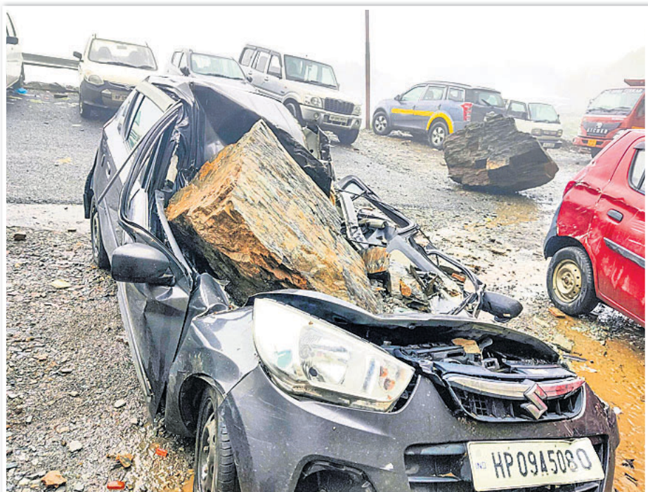
ଶିମ୍ଲା ପ୍ରଦେଶର ଭୁଞ୍ଜଳ ନଦୀରେ ଥିବା ଏକ କାର୍ ଭାଙ୍ଗିଯାଇଛି।