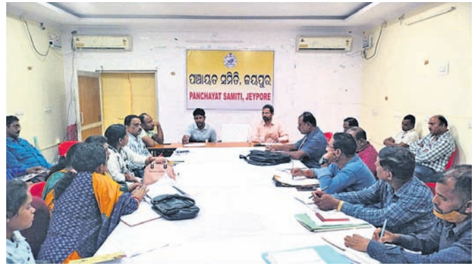
ବୈଠକରେ ଉପସ୍ଥିତ ପିଇଓମାନେ ।

ସାରି ଦେଇଛନ୍ତି । ବର୍ଷା ମାସରେ ନାକ ବନ୍ୟାପାଣିରେ ଫୁଲିବା ସହ ପୋଲ ଉପରେ ମା ଚୁଟ ପାଣି ଆସିବାକୁ ଅନକାବେତା ଏବଂ ଚକାମାଳର ଯୋଗାଯୋଗ ବିଚ୍ଛିନ୍ନ ହୋଇ ପଡିଥାଏ ।