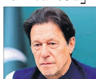
ଇସ୍କାମୀବାଦ, ୨୦୧୮ (ପି.ଟି.)