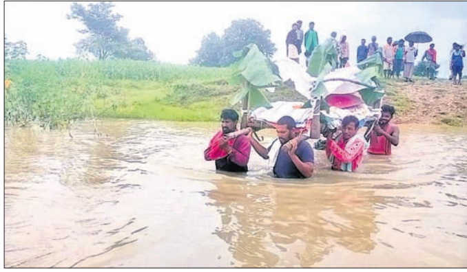
ମୃତଦେହକୁ କାନ୍ଧି ନେଇ ପରିବାର, ସମ୍ପର୍କୀୟମାନେ ନାକ ପାରି ହେଉଛନ୍ତି ।