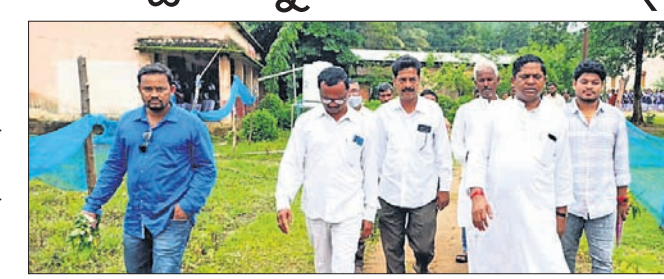
ନବରଞ୍ଜପୁର ଏମ୍.ପି ସତୀଗୁଡ଼ା କନ୍ୟାଶ୍ରମ ପରିବର୍ତ୍ତନ କରି ଫେରୁଛନ୍ତି ।

କନ୍ୟାଶ୍ରମ ବିଦ୍ୟାଳୟରେ ଶିକ୍ଷା ବ୍ୟବସ୍ଥା ଅନୁଧ୍ୟାନକଲେ ଏମ୍.ପି... (Continuation of the previous article)