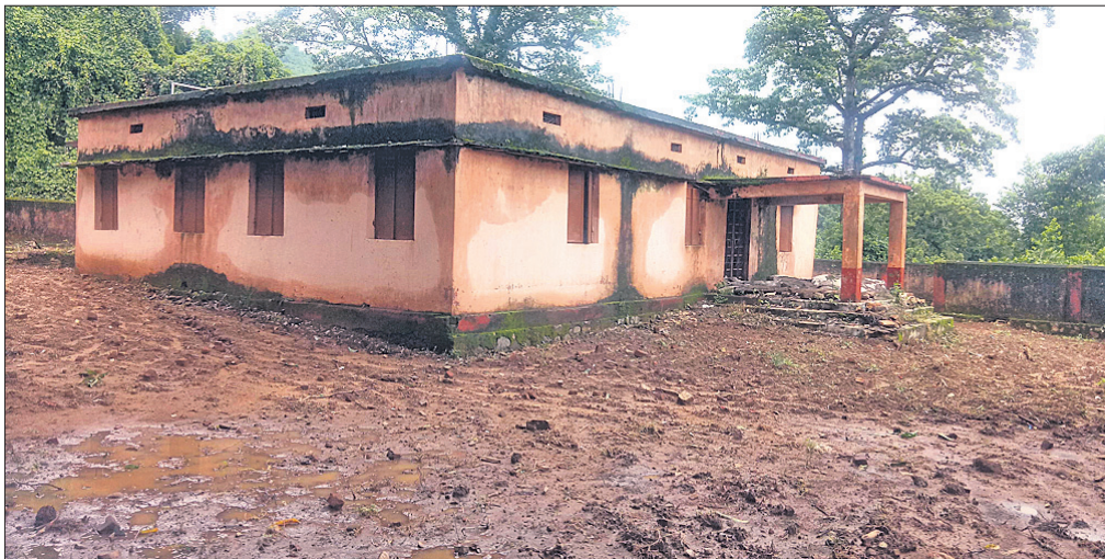
ଅନ୍ୟବନ୍ଦୁର ଅବସ୍ଥାରେ ରହିଥିବା ଛାତ୍ରାଭିବାସ କୋଠା।

ରାୟଗଡ଼ା ଜିଲ୍ଲା ଚନ୍ଦ୍ରପୁର ବ୍ଲକର ବିଭିନ୍ନ ପଞ୍ଚାୟତରେ ଅନୁସୂଚିତ କାତି ଓ ଜନକାତି ବର୍ଗର ପିଲାଙ୍କ ପାଇଁ ଆଶ୍ରମ ବିଦ୍ୟାଳୟ ସହ ଛାତ୍ରାବାସ ଓ ଛାତ୍ରାଭିବାସ ରହିଛି। ହେଲେ ପିଲାପଞ୍ଜୀ ପଞ୍ଚାୟତରେ ପିଲାଙ୍କ ପାଇଁ ବିଦ୍ୟାଳୟ ରହିଥିଲେ ମଧ୍ୟ ହସ୍ତେଲ ନାହିଁ। ବୁଡ଼ିବାଲି, ବିକାପୁର, ହନୁମନ୍ତପୁର, ତାଳସୋରଡ଼ା, ଚନ୍ଦ୍ରପୁର ଏବଂ ସୁରିଗୁଡ଼ା ପଞ୍ଚାୟତରେ ଆଶ୍ରମ ବିଦ୍ୟାଳୟ ଏବଂ ହସ୍ତେଲ ରହିଛି। ତେବେ ପରିତାପର ବିଷୟ ହେଲା ପିଲାପଞ୍ଜୀ ପଞ୍ଚାୟତର ଗେଣ୍ଡାବାଳୁ ଗ୍ରାମରେ ଦୀର୍ଘ ୨୦ ବର୍ଷ ହେଲା ଲକ୍ଷ୍ୟଧିକ ଟଙ୍କା ବ୍ୟୟରେ ନିର୍ମାଣ ହୋଇଥିବା ହସ୍ତେଲ କୋଠା ବନ୍ଦ ପଡ଼ିଛି।