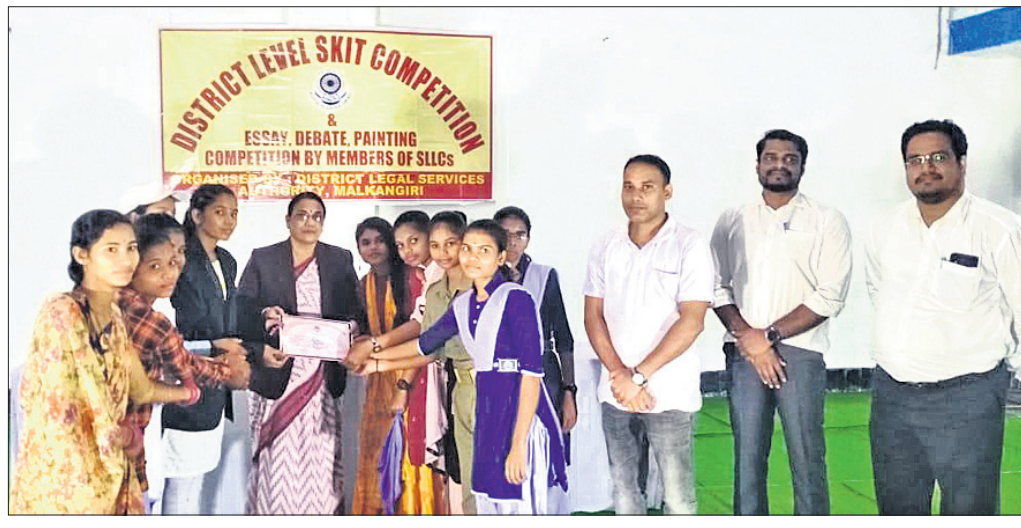
କୃତୀ ଛାତ୍ରାମାନଙ୍କୁ ଅତିଥି ପୁରସ୍କୃତ କରୁଛନ୍ତି ।

ଡିଏଲ୍‌ଏସ୍ ପକ୍ଷରୁ କୃତୀ ଛାତ୍ରାଛାତ୍ରୀଙ୍କୁ ପୁରସ୍କାର... (Continuation of the previous article)