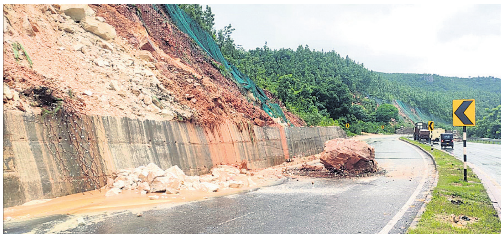
ଲଗାଶ ବର୍ଷା ଯୋଗୁ କେନ୍ଦୁଝର ଜିଲ୍ଲା ବୁଡ଼ିଆ ଘାଟିରେ ଶନିବାର ଭୂସଙ୍କଟ ହୋଇ ରାସ୍ତାରେ ପଥର ପଡ଼ିଛି । (ରିପୋର୍ଟ: ପୃଷ୍ଠା-୨)