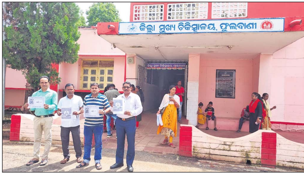
ଜିଲ୍ଲା ପୁଖ୍ୟ ଚିକିତ୍ସାଳୟ ସମ୍ମୁଖରେ କର୍ମଚାରୀମାନେ ବିରୋଧ ପ୍ରଦର୍ଶନ କରୁଛନ୍ତି।

ଏ ଦିନରେ ଅହେତୁକ ବିଳମ୍ବ କରୁଛନ୍ତି। ଫଳରେ କର୍ମଚାରୀମାନେ ସୋମବାର ଫୁଲବାଣୀ ଜିଲ୍ଲା ପୁଖ୍ୟ ଚିକିତ୍ସାଳୟ ସମ୍ମୁଖରେ ବିରୋଧ ପ୍ରଦର୍ଶନ କରିଛନ୍ତି।