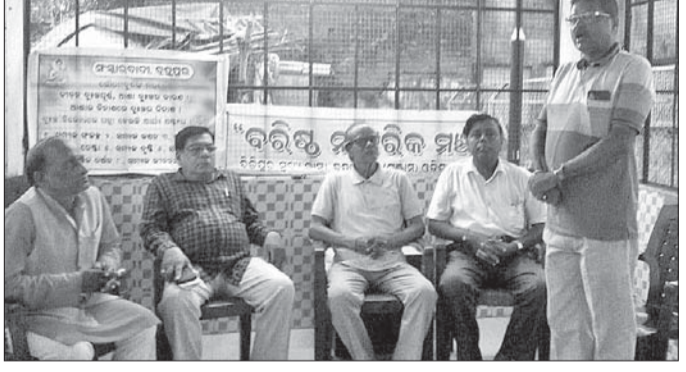
ବିଶ୍ୱ ବରିଷ୍ଠ ନାଗରିକ ଦିବସରେ ଉପସ୍ଥିତ ଅତିଥି ଓ ସଂଗର ସଦସ୍ୟବୃନ୍ଦ।