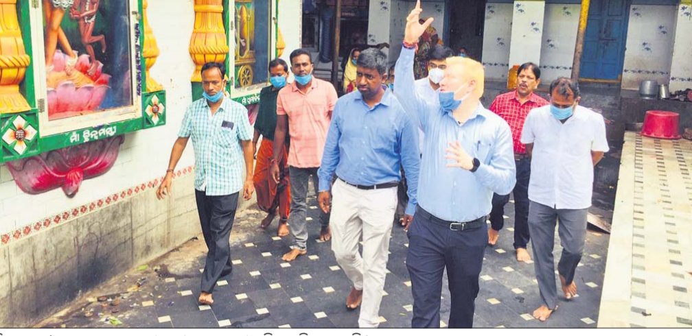
ଜିଲ୍ଲାପାଳ ଓ ଅନ୍ୟ ପଦାଧିକାରୀ ବୁଢ଼ୀ ଠାକୁରାଣୀ ମନ୍ଦିର ବୁଲି ଦେଖିଛନ୍ତି।

ବ୍ରହ୍ମପୁରର ଅଧିକାଂଶ ଦେବା ମା ବୁଢ଼ୀ ଠାକୁରାଣୀ ମନ୍ଦିର ଉନ୍ନତୀକରଣ ନେଇ ଯୋଜନା କରାଯାଇଛି।