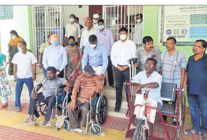
ଭିକ୍ଷାପୁର ଟ୍ରାଫିକ୍ ସାଇକେଲ ପ୍ରଦାନ।