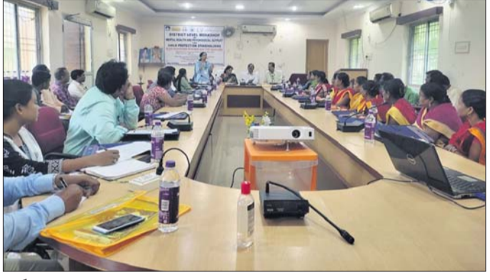
କର୍ମଶାଳାରେ ଉପସ୍ଥିତ ଅଧିକାରୀମାନେ।

ହୋଇ ଆୟୁର୍ଯ୍ୟ ଶିକ୍ଷାମାନଙ୍କର ମନକୁ ବୁଝି, ସେମାନଙ୍କୁ ନିପାଟିତ କରାଇ ଦେଖାଯାଉଛି। ଏକ କର୍ମଶାଳାରେ ଉପସ୍ଥିତ ଅଧିକାରୀମାନେ ମାନସିକ ସ୍ୱାସ୍ଥ୍ୟ ସହାୟତା ସମ୍ପର୍କିତ କର୍ମଶାଳାରେ ଉପସ୍ଥିତ ଅଧିକାରୀମାନେ।