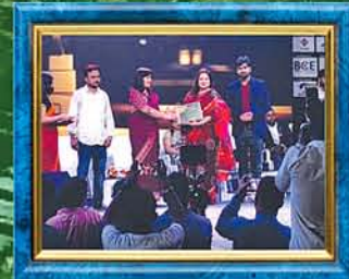
Awarded as Best Nursing & Paramedical College of Odisha

Our Associated Institution TSG Gurukul also offer +3 Sc. (Hons.) [ Phy, Chem, Maths, Bot & Zool ]