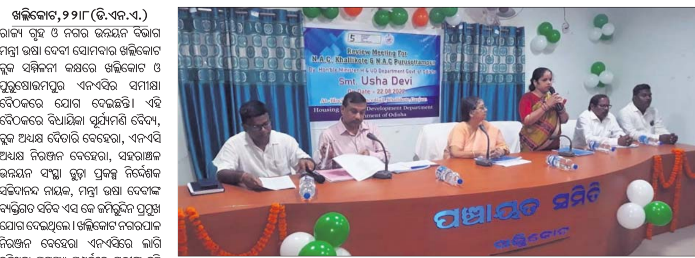
ସମୀକ୍ଷା ବୈଠକରେ ଉପସ୍ଥିତ ମନ୍ତ୍ରୀ, ବିଧାୟକ ଓ ଅନ୍ୟ ଅଧିକାରୀ।

ଖଲ୍ଲିକୋଟ, ୨୨୮୮ (ଡି.ଏନ.ଏ.) ରାଜ୍ୟ ଗୃହ ଓ ନଗର ଉନ୍ନୟନ ବିଭାଗ ମନ୍ତ୍ରୀ ଉଷା ଦେବୀ ସୋମବାର ଖଲ୍ଲିକୋଟ ରୁକ୍ ଯମ୍ବିକା କମ୍ପରେ ଖଲ୍ଲିକୋଟ ଓ ପୁରୁଷୋତ୍ତମପୁର ଏନଏସିର ସମୀକ୍ଷା ବୈଠକରେ ଯୋଗ ଦେଇଛନ୍ତି।