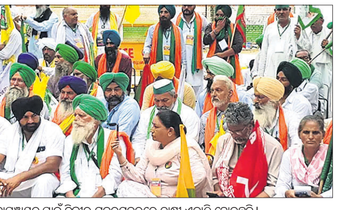
ମହାପଞ୍ଚାୟତ ପାଇଁ ଦିଲ୍ଲୀର ଯନ୍ତ୍ରମନ୍ତରରେ ଚାଷୀ ଏକାଠି ହୋଇଛନ୍ତି।

ଫସଲର ସର୍ବନିମ୍ନ ସହାୟକ ମୂଲ୍ୟ (ଏନ୍‌ଏସ୍‌ସି) ଉପରେ ଆଇନ ଆଣିବା, କୃଷି ରଣ ଛାଡ଼ ଓ ଅନ୍ୟାନ୍ୟ ପ୍ରସଙ୍ଗ ନେଇ କୃଷକ ସଂଗଠନ ପକ୍ଷରୁ ନୂଆଦିଲ୍ଲୀରେ ମହାପଞ୍ଚାୟତର ଡାକରା ଦିଆଯାଇଥିଲା। ଏଥିରେ ଯୋଗଦେବା ଲାଗି ବିଭିନ୍ନ ରାଜ୍ୟରୁ ହଜାର ହଜାର ଚାଷୀ ସୋମବାର ନୂଆଦିଲ୍ଲୀର ଯନ୍ତ୍ରମନ୍ତରରେ ପହଞ୍ଚିଛନ୍ତି। ପୂର୍ବରୁ କେନ୍ଦ୍ର ସରକାରଙ୍କ ଦ୍ୱାରା ବିବାଦୀୟ କୃଷି ଆଇନକୁ ବିରୋଧ କରି ବିଭିନ୍ନ କୃଷକ ସଂଗଠନ ପକ୍ଷରୁ ଦିଲ୍ଲୀ ସାମାଜିକ ଚର୍ଚ୍ଚା ପର୍ଯ୍ୟନ୍ତ ଧାରଣା ଦିଆଯାଇଥିଲା। କୃଷି ଆଇନକୁ ବିଭିନ୍ନ ମହଲରୁ ସମାଲୋଚନା କରାଯିବା ପରେ ୨୦୧୧ ନଭେମ୍ବରରେ କେନ୍ଦ୍ର ସରକାର ଏହାକୁ ପ୍ରତ୍ୟାହାର କରି ନେଇଥିଲେ। ଏଥିସହିତ ଚାଷୀମାନଙ୍କ ବିଭିନ୍ନ ଦାବି ପୂରଣ ଲାଗି ସରକାର ପ୍ରତିଶ୍ରୁତି ଦେବା