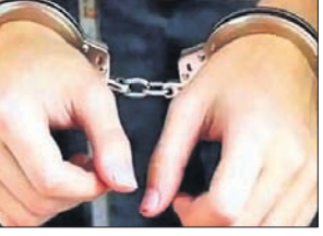
ଅଗ୍ରିମ ୯୦ ହଜାର ଟଙ୍କା ନେଇଥିଲେ। ଜୁଲାଇ ୨୩ରେ ଅଭିଯୁକ୍ତମାନେ

ନବାନଙ୍କୁ ଅପହରଣ କରି ତାମିଲନାଡୁ ନେଇଯାଇଥିଲେ, କିନ୍ତୁ ହତ୍ୟା କରିବା ପାଇଁ ସେମାନେ ଚିନ୍ତିତ ହେଲେ। ପରେ ୩ ସୁପାରିକିଲର ନବାନଙ୍କ ସହ ବନ୍ଧୁତା କରି ସେଠାରେ ପାର୍ଟି କରିଥିଲେ। ଅନୁପଲବୀଙ୍କ ଫୋନ୍ ଆସିବାକୁ ସେମାନେ ନବାନଙ୍କ ଦେହଧାରୀ କେନ୍ଦ୍ରାପଡ଼ା ଡାକି ଦେଇଥିଲେ। ଏହାକୁ ରକ୍ତ ବୋଲି କହିବା ସହ ସେମାନେ