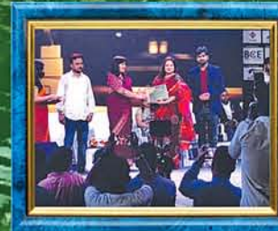
Awarded as Best Nursing & Paramedical College of Odisha

Our Associated Institution TSG Gurukul also offer +3 Sc. (Hons.) [ Phy, Chem, Maths, Bot & Zool ]