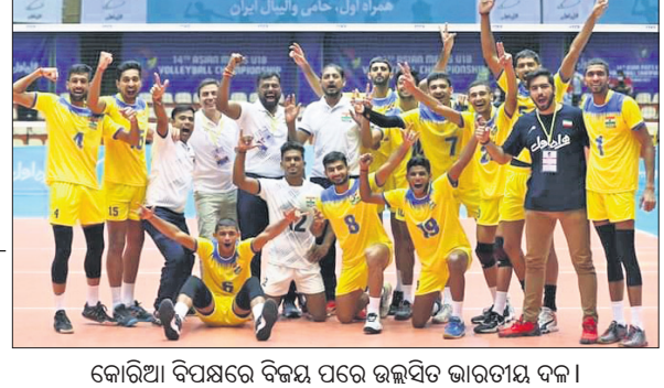
କୋରିଆ ବିପକ୍ଷରେ ବିଜୟ ପରେ ଉଲ୍ଲାସରେ ଭାରତୀୟ ଦଳ।