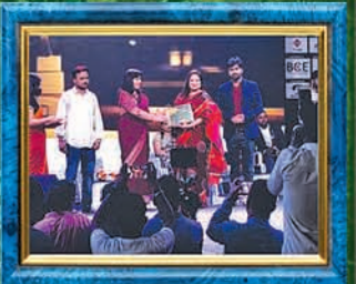
Awarded as Best Nursing & Paramedical College of Odisha