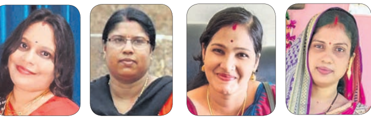
ଗୀତାଞ୍ଜଳି ଅମିତା ରାହୁ ସୌଦାମିନୀ ଉପାୟ ଚିନ୍ତାକରି କାମ କରିଥାଏ। ଅନେକ ସମୟରେ ମୁଁ ଘର ତିଆରି ସହଜ ଆଉ ହେଲଦି ଜଳଖିଆ ତିଆରି କରିଥାଏ। ବାହାରୁ ଖାଦ୍ୟ ଅର୍ଡର କରିବା କି ବୁଲ୍‌ବୁଲି କରି ବାହାରେ ପାର୍ଟି କରିବା ଏବେ ପ୍ରାୟ ବନ୍ଦ କରିଦେଇଛି। ଗୀତାଞ୍ଜଳି ଦାଶ ଗୁଣ୍ଡିଶା, କପାସିରା, ସୁବର୍ଣ୍ଣପୁର ରାହୁ ମହାନ୍ତି , ଗୁଣ୍ଡିଶା, ଗଭେଶ୍ୱର, ଭଦ୍ରକ

ମାର୍କେଟ୍ ରେଟ୍ ଅନୁସାରେ ଖର୍ଚ୍ଚ କରେ ଘରର ବିଭିନ୍ନ ଛୋଟ ଛୋଟ ଦିନ ପ୍ରତି ସଚେତନ ରହିଲେ ସବୁ ଗୁଣ୍ଡିଶା ଖର୍ଚ୍ଚକାଟ କରିପାରିବେ। ଆଉ ସହଜରେ ଦରଦାମ୍ ଚେଷ୍ଟା କରିଥାଏ। ସେଥିପାଇଁ ତ ବିଭିନ୍ନ