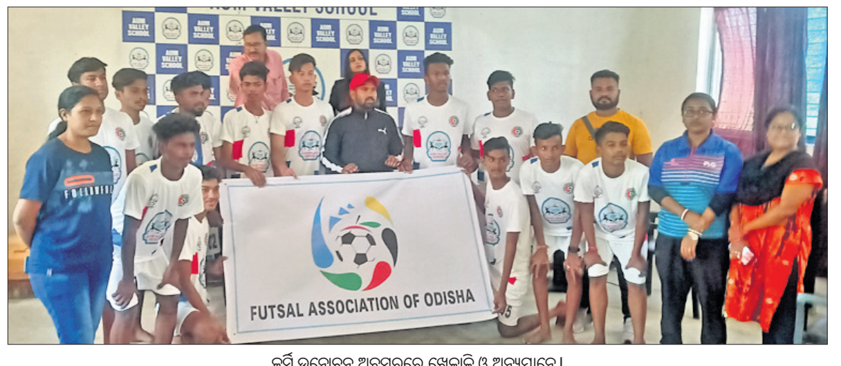
ଜର୍ସି ଉନ୍ମୋଚନ ଅବସରରେ ଖେଳାଳି ଓ ଅଧିନାୟକ।