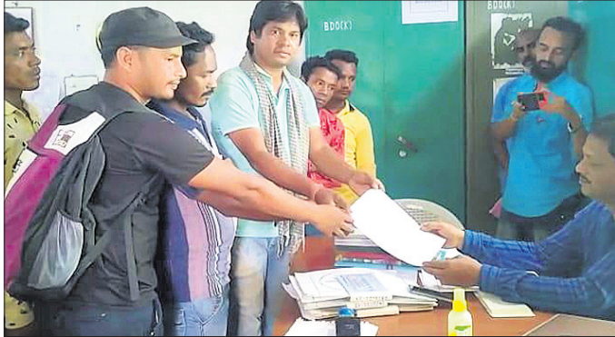
ଗ୍ରାମବାସୀ ଏବିଡିଓକୁ ଦାବିପତ୍ର ପ୍ରଦାନ କରୁଛନ୍ତି।

ଲଗାଶ ବର୍ଷା ଯୋଗୁ ରାୟଗଡ଼ା ଜିଲ୍ଲା କଲ୍ୟାଣସିଂହପୁର ବ୍ଲକ୍ କରପା ପଞ୍ଚାୟତର ରାଣାପଦର ଗ୍ରାମବାସୀ ବିଭିନ୍ନ ସମସ୍ୟାରେ ରହିଛନ୍ତି। ଗାଁର ୨୮ ଘର ମଧ୍ୟରୁ ୧୬ ଘରେ ବର୍ଷାପାଣି ସହ ଝର ପୃଷ୍ଠିହୋଇ କାନ୍ଧ ଓଦା ହୋଇଛି। କେତେକଙ୍କ କାନ୍ଧ ଭୁଲ୍ଲିଗଲ୍ଲି ଲୋକଙ୍କ ଜୀବନ ଚାଲିଯିବା ଭୟ ରହିଛି। ତେଣୁ ଲୋକେ ନିଜ ଘର ଛାଡ଼ି ଗାଁରେ ଥିବା ଏକ ଛାତ୍ରଘରେ ଏବଂ ଆଉ କେତେକ ବାରଣ୍ଡାରେ ଆଶ୍ରୟ ନେଇଛନ୍ତି। ରୋଷେଇ ଘରେ ନ କରିପାରି ଘର ବାହାରେ କରୁଛନ୍ତି। ଅନ୍ୟପକ୍ଷରେ ଗାଁକୁ ଅନ୍ୟତ୍ର ଯିବାକୁ ହେଲେ ଗାଁ ନିକଟସ୍ଥ ଏକ ନାଳ ଅତିକ୍ରମ କରି ଯିବାକୁ ପଡ଼ୁଛି।