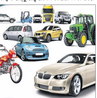
ଯାନବାହନର ଯନ୍ତ୍ରଣା ବିଷୟରେ ଆଲୋଚନା କରାଯାଉଛି।