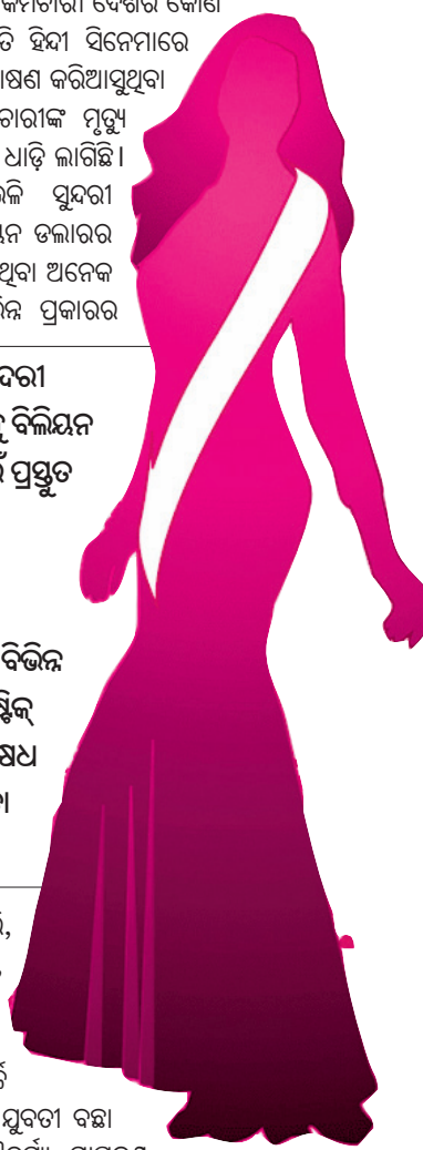
ପ୍ରତିଯୋଗିତା ପାଇଁ ପ୍ରସ୍ତୁତ ହେବେ।