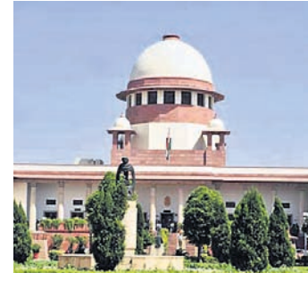
ସୁପ୍ରିମକୋର୍ଟରେ ପ୍ରଦୀପ ପାଣିଗ୍ରାହୀ ମାମଲା