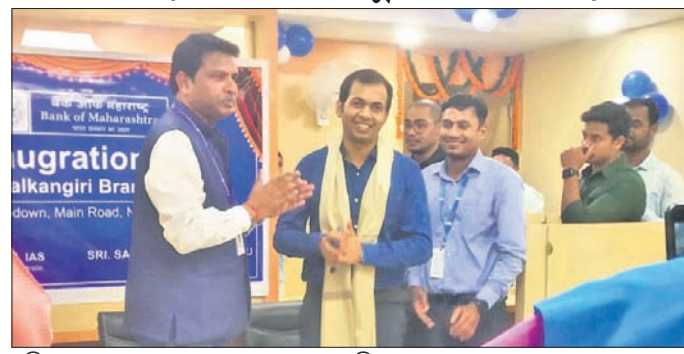
ଅତିଥିମାନେ ବ୍ୟାଙ୍କ ଶାଖାକୁ ଉଦ୍ଘାଟନ କରୁଛନ୍ତି ।