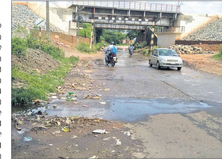
ଜାତୀୟ ରାଜପଥ ପାର୍ଶ୍ୱରେ ଜଳା ହୋଇଥିବା ନର୍ଦ୍ଦମାଜଳ ।

କୋରାପୁଟ ଦେଇ ଯାଇଥିବା ୨୬ ନମ୍ବର ଜାତୀୟ ରାଜପଥରେ ସହରର ନର୍ଦ୍ଦମା ଜଳ ମାଧ୍ୟମ ଧରି ପ୍ରବାହିତ ହେଉଥିବା ଦେଖିବାକୁ ମିଳୁଛି। ପ୍ରକାରେ ସାଧାରଣତଃ ବେଳେ ବେଳେ ହଳଦିଆ ହେଉଛନ୍ତି। ଏନେଇ ସାଧାରଣରେ ଅସନ୍ତୋଷ ପ୍ରକାଶ ପାଇଛି। ରେଳୱେ ଓଭର ବ୍ରିଜ ନିକଟ ଦେଇ ଯାଇଥିବା ଏହି ରାଜପଥ କଡ଼ରେ ଥିବା ନାଳ ବର୍ଷ ବର୍ଷ ଧରି ପୋଡି ହୋଇ ରହିଛି। ଏହାକୁ ଠିକ୍ ରୂପେ ସଫା କରାଯାଉ ନ ଥିବାରୁ ଏପରି ପରିସ୍ଥିତି ସୃଷ୍ଟି ହୋଇଛି। ଅଧିକ ବର୍ଷା ହେଲେ ଏହି ସ୍ଥାନରେ ଆସୁଏ ପାଣି ପ୍ରବାହିତ ହେଉଛି। ଏହି ସମୟରେ ଉଚ୍ଚ ରାସ୍ତାରେ ଗାଡିମୋଟର ଚଳାଚଳ ପ୍ରଭାବିତ ହେଉଛି। କୋରାପୁଟ ମ୍ୟୁନିସିପାଲିଟି ଅନ୍ତର୍ଗତ ବ୍ୟସ୍ତ ବସ୍ତୁକ ଏହି ରାସ୍ତା ଉପରେ ନାଳ