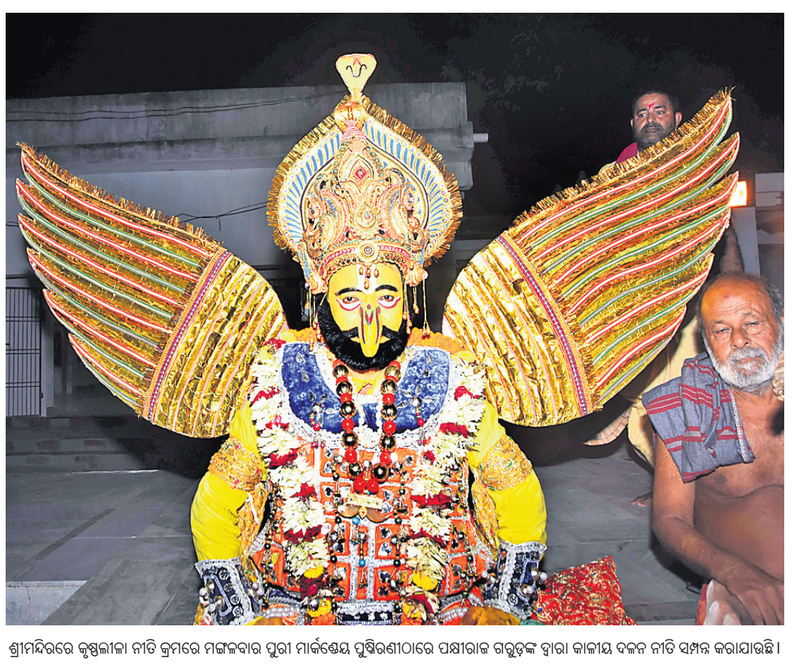
ଶ୍ରୀମନ୍ଦିରରେ କୃଷ୍ଣଲୀଳା ନୀତି କ୍ରମରେ ମଙ୍ଗଳବାର ପୁରୀ ମାର୍କଣ୍ଡେୟ ପୁଷ୍କରିଣୀରେ ପକ୍ଷୀରାଜ ଗରୁଡ଼ଙ୍କ ଦ୍ୱାରା କାଳୀୟ ଦଳନ ନୀତି ସମ୍ପନ୍ନ କରାଯାଉଛି।