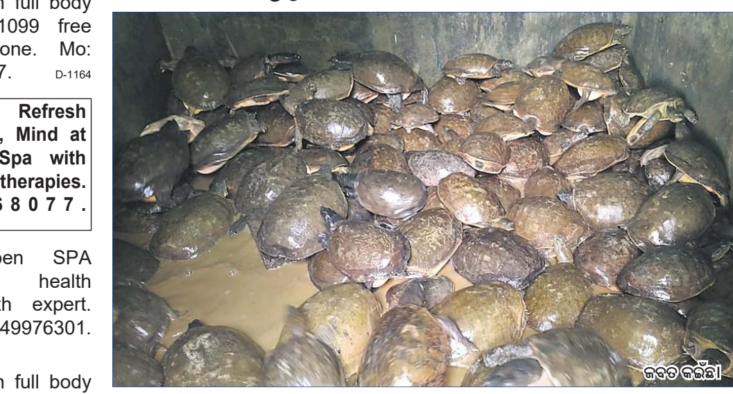
କାଳିମେଳା, ୨୩୮ (ଡି.ଏନ.ଏ.)