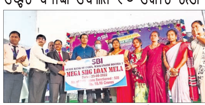
ସ୍ୱୟଂ ସହାୟକ ଗୋଷ୍ଠୀକୁ ରଣ ବାବଦକୁ ଟଙ୍କା ପ୍ରଦାନ କରାଯାଇଛି ।