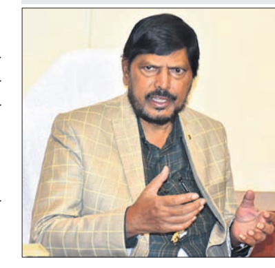
କେନ୍ଦ୍ରମନ୍ତ୍ରୀ ରାମଦାସ ଅଠାଠାଲୋକ୍ଷ