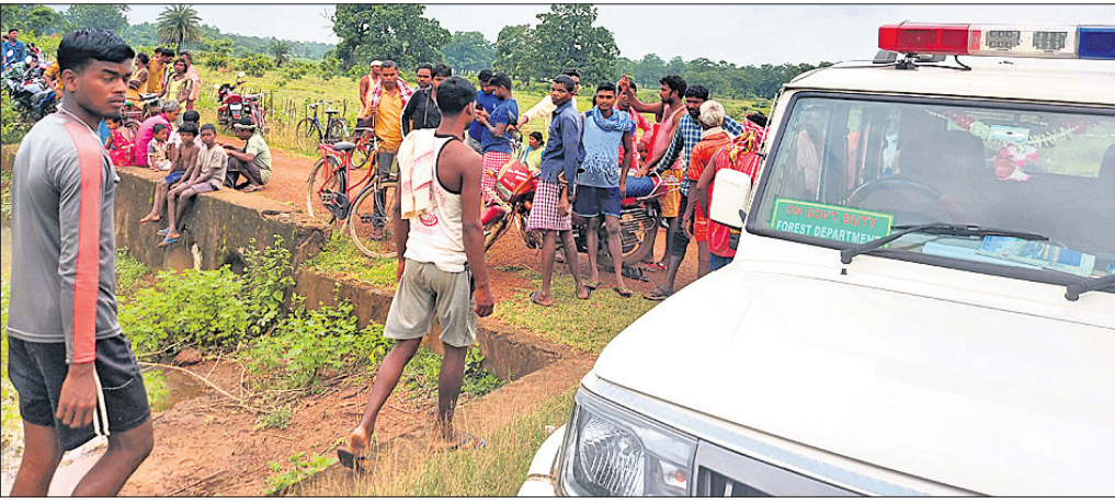
ମୋରଡ଼ାରେ ଉଦ୍ଧୃତ ଗ୍ରାମବାସୀ ବନ ବିଭାଗ ଗାଡ଼ି ନିକଟରେ ହୋଇଛି କରୁଛନ୍ତି।

ରାଜ୍ୟରେ ହାତୀ-ମଣିଷ ସଂଘର୍ଷ ଚାଳୁ ରୂପ ନେଇଛି। ପ୍ରାକୃତିକ ଆବାସଭଙ୍ଗରେ ମନୁଷ୍ୟର ଅଧିକ ହସ୍ତକ୍ଷେପ ହାତୀ ଭଳି ବିଶାଳକାୟ ପ୍ରାଣୀଙ୍କୁ ଜନସମ୍ବନ୍ଧୀୟ କରାଇଥିବାବେଳେ ସେମାନଙ୍କ ଉପଦ୍ରବରେ ବ୍ୟାପକ ଧନଜୀବନ ହାନି ହେଉଛି। ବର୍ଷା ବିପ୍ଳବ ସମୟରେ ମୟୂରଭଞ୍ଜ ଏବଂ ଢେଙ୍କାନାଳ ଜିଲ୍ଲାରେ ପୁଅନ୍ ଗ୍ରାମରେ ହାତୀ ଆକ୍ରମଣରେ ୩ ଜଣଙ୍କ ମୃତ୍ୟୁ ଘଟିବା ଆଲୋଚନା ସୃଷ୍ଟି କରିଛି।