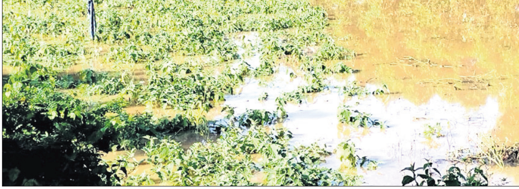
ସୁବର୍ଣ୍ଣରେଖା ନଦୀର କୂଳେ ଜଳେଶ୍ୱର ବ୍ଲକର ୧୪ଟି ପଞ୍ଚାୟତର ହଜାର ହଜାର ଚାଷୀ ଉପକ୍ରମିତ ହୋଇଥିବା ପରିବାର ଚାଷ ବନ୍ୟାପାଣିରେ ବୁଡ଼ି ନଷ୍ଟ ହୋଇଛି। ଆଗାମୀ ଦିନ ପାଇଁ ଚଳି ପଡ଼ିଥିବା କୋବି, ବାଲଗଣ, ବିନ୍ଦୁ, ଚମାଟୋ ପତି ସଭି ନଷ୍ଟ ହୋଇଛି। ଲକ୍ଷ ଲକ୍ଷ ଟଙ୍କା ରୋଜଗାର କରିବା ଲାଗି ଆଶା ରଖୁଥିବା ଚାଷୀ ଏବେ ମୁଣ୍ଡରେ ହାତ ମାରି ବସିଛି।

ଜଳେଶ୍ୱର ବ୍ଲକର ରାୟାଗାମପୁର ପଞ୍ଚାୟତର ୩ଟି ଗାଁର ୬୦ ହେକ୍ଟର, କୋଟସାହି ପଞ୍ଚାୟତର ୨ଟି ଗାଁର ୧୫ ହେକ୍ଟର, ପାଇକସିଦା ପଞ୍ଚାୟତର ୫ଟି ଗାଁର ୪୦ ହେକ୍ଟର, ପଣ୍ଡିମବାଡ଼ି ପଞ୍ଚାୟତର ୩ଟି ଗାଁର ୩୫ ହେକ୍ଟର, ବାଲଗଣବାଡ଼ିଆ ପଞ୍ଚାୟତର ୫ଟି ଗାଁର ୪୦ ହେକ୍ଟର, ଝାଡ଼ପିଟଳ ପଞ୍ଚାୟତର ୩୨ଟି ଗାଁ ୨୦ ହେକ୍ଟର, ମହମ୍ମଦନଗର ପଞ୍ଚାୟତର ୪ଟି ଗାଁର ୬୦ ହେକ୍ଟର, ରାଜପୁର ପଞ୍ଚାୟତର ୨ଟି ଗାଁର ୧୦ ହେକ୍ଟର, ଶିଖରପୁର ପଞ୍ଚାୟତର ୬ଟି ଗାଁର ୪୦ ହେକ୍ଟର, ମାଳିଆ ପଞ୍ଚାୟତର ୩ଟି ଗାଁର ୬୦ ହେକ୍ଟର, ଖୁଣ୍ଟିଆମାଡ଼ିସାହି