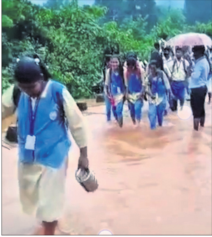
ଛାତ୍ରାଛାତ୍ରୀ ପାଣିରେ ପଶି ପୋଲ ପାରି ହେଉଛନ୍ତି।