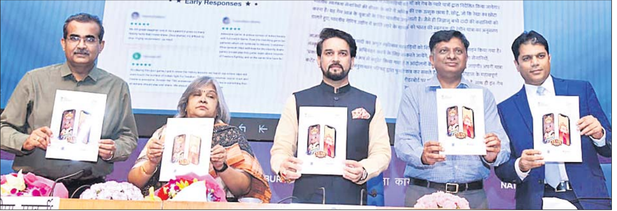
କେନ୍ଦ୍ର ସୂଚନା ଓ ପ୍ରସାରଣ ମନ୍ତ୍ରୀ ଅନୁରାଗ ଠାକୁର ରୁଧିରା ରାତି ୧୦ଟା ପୂର୍ବା (+ ଅନ୍ୟ ରୋଗରେ କରୋନା ଆକ୍ରାନ୍ତ ମୃତ୍ୟୁ) ୧୩: https://www.worldometers.info/coronavirus/ ଏବଂ ଓଡ଼ିଶା ସରକାର