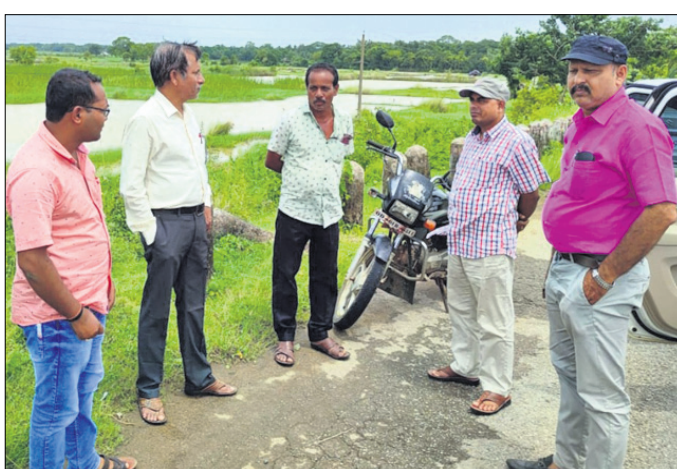
ଜିଲ୍ଲା ମୁଖ୍ୟ କୃଷି ଅଧିକାରୀ ଓ ତହସିଲଦାର କ୍ଷେତ୍ର ପରିଦର୍ଶନ କରୁଛନ୍ତି।

ବାଲେଶ୍ୱର ଜିଲ୍ଲା ବସ୍ତା ବ୍ଲକରେ ବନ୍ୟା ଆଠିଛି ଚାଷୀଙ୍କ ପାଇଁ ଘୋର ଦୁର୍ଦ୍ଦଶା। ଜଳକା ଓ ସୁବର୍ଣ୍ଣରେଖା ନଦୀରେ ପ୍ରବଳ ବନ୍ୟା ଯୋଗୁଁ ଏବର୍ଷ ଖରିପ ଧାନ ଚାଷ ପ୍ରଭାବିତ ହୋଇଛି। ରୁଧିର ପୁଣି ୧୮ ପଞ୍ଚାୟତର ଶାହାପୁର ଉର୍ଦ୍ଧ୍ୱ ଚାଷଜମି ବୁଡ଼ି ରହିଥିବାରୁ ଚାଷୀଙ୍କ ଆର୍ଥିକ ମାନବଣ୍ଡ ସମ୍ପୂର୍ଣ୍ଣ ଭୁଗୁଡ଼ି ପଡ଼ିଛି। ଅପରପକ୍ଷରେ କୃଷିବିଭାଗ ପକ୍ଷରୁ ବନ୍ୟା ବେଳେ କ୍ଷେତ୍ର ପରିଦର୍ଶନ କରାଯାଇଥିଲେ ହେଁ ବ୍ଲକ କୃଷି ଅଧିକାରୀଙ୍କ ଅନୁପସ୍ଥିତିକୁ ନେଇ ଅସନ୍ତୋଷ ଦେଖାଦେଇଛି। ବ୍ଲକ ଅଧୀନ ୩୧ ପଞ୍ଚାୟତରେ ରହିଛି ୨୯୫ ଗାଁ ମୋଟ ୨୦୫୩୧ ୧୨୯ ହେକ୍ଟର ଚାଷ ଜମିରୁ ଚଳିତବର୍ଷ ୧୮୮୫୩ ୮୪୦ ହେକ୍ଟରରେ ଖରିପ ଧାନ ଓ ୧୩୨୯ ହେକ୍ଟରରେ ପରିବର୍ତ୍ତନୀୟ ସମେତ ଅଣଧାନ ଚାଷ ହୋଇଥିଲା। ଜଳକାରେ ବନ୍ୟା ଯୋଗୁଁ ଗଡ଼ପଦା, ରାଉତପଡ଼ା, ମଥାନୀ, ରୁଧିରପୁର, ବାସୁକୀପୁର, ବାହାଦୁରୀ, କୁଡ଼ୁଆ ଦରଢ଼ା, ମୁକୁନ୍ଦି, ଉଡ଼ୁଦା ଏବଂ ସୁବର୍ଣ୍ଣରେଖାରେ ବନ୍ୟା ଯୋଗୁଁ