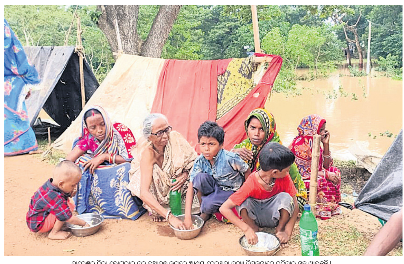
ବାଲେଶ୍ୱର ଜିଲ୍ଲା ଭୋଗରାଇ ବ୍ଲକ ଭୁଆବନ୍ଧ ଉପରେ ଆଶ୍ରୟ ନେଇଥିବା ବନ୍ୟା ବିପନ୍ନମାନେ ପରିବାର ସହ ଖାଇଛନ୍ତି।

କେନ୍ଦୁଝର ଜିଲ୍ଲା ତେଲକୋଇ ବ୍ଲକ ଅନ୍ତର୍ଗତ ପିତାମାତା-ସାପଲାଇ ପୋଲରେ ପାଣି ପ୍ରଦାନ ହେବା ଯୋଗୁ ଓଡ଼ିଆ ପଞ୍ଚାୟତ ଅଧ୍ୟକ୍ଷ ଆଦର୍ଶ ବିଦ୍ୟାଳୟର ଛାତ୍ରାଛାତ୍ରୀ ଅତି ରହିଥିଲେ। ତେବେ ସାମାନ୍ୟ ପାଣି କମିପାରେ ଶିକ୍ଷକ ସହାୟତାରେ ବିଦ୍ୟୁତ୍ ଅବସ୍ଥାରେ ଛାତ୍ରାଛାତ୍ରୀ ପୋଲ ପାରି ହୋଇଥିଲେ। ଏହି ଆଦର୍ଶ ବିଦ୍ୟାଳୟରେ ୮୩ ଶ୍ରେଣୀ ଠାରୁ ଯୁକ୍ତ ୨ ପର୍ଯ୍ୟନ୍ତ ୨୮୦ ଛାତ୍ରାଛାତ୍ରୀ ଅଧ୍ୟୟନ କରୁଛନ୍ତି। ହଷ୍ଟେଲ ବ୍ୟବସ୍ଥା ରହିଥିଲେ ହେଁ ବହୁ ଛାତ୍ରାଛାତ୍ରୀ ତେଲକୋଇ ପୁଖ୍ୟାଳୟରୁ ଯିବାଆସିବା କରିଥାନ୍ତି। ଛାତ୍ରାଛାତ୍ରୀଙ୍କ ପୁରୁଣା ଦୁଷ୍ଟିରୁ ଅଭିଭାବକ ମାନେ ଏକ ଉକ୍ତ ପୋଲ ନିର୍ମାଣ ପାଇଁ ଦାବି କରିଛନ୍ତି। ପ୍ରତ୍ୟେକ ବର୍ଷ ବର୍ଷାଦିନେ ଏଭଳି ସମସ୍ୟା ଦେଖାଦେଇଥାଏ। ଅନେକ ସମୟରେ ଦମକକ ବାହିନୀ ସହାୟତାରେ ପିଲାମାନେ ପାଣି ହୋଇଥାନ୍ତି।