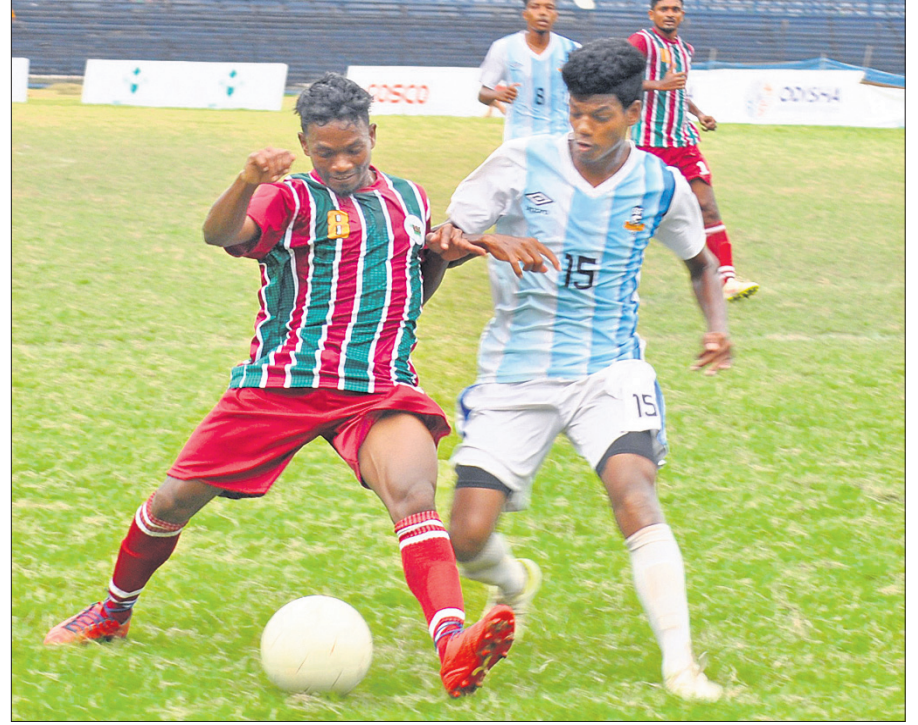
ବାରବାଟୀ ଷ୍ଟାଡ଼ିୟମରେ ଚାଲିଥିବା ପୁରସ୍କାର ଲିଗରେ ରୂପବାର ରାଇଜିଂ ଷ୍ଟାର ଓ ସନ୍ତୋଷକୁ କୁବ ମଧ୍ୟରେ ଅନୁଷ୍ଠିତ ମ୍ୟାଚ।

ନିନିତରେ ଗୋଟିଏ ଲେଖାଏଁ ଗୋଲ ଦେଇଥିଲେ। ଗୁରୁବାର ସିଆରଆରଆଇ-ଇଲେଭେନ ଗର୍ (ଅପରାହ୍ନ ୧ଟା ୩୦) ଏବଂ ରାଧାଗୋବିନ୍ଦ-ବିଜ୍ଞାନସା କୁବ (ଅପରାହ୍ନ ୩ଟା ୩୦) ମଧ୍ୟରେ ମ୍ୟାଚ ଅନୁଷ୍ଠିତ ହେବ।