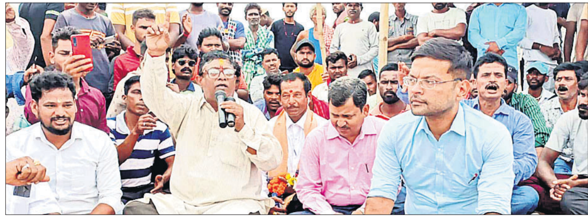
ପୁରୀ ବେଳାଭୂମି ରୁ ପୁରୀ ବି. ବି. ବି.ରୋଡ଼ା ମଞ୍ଚ ପକ୍ଷରୁ ପ୍ରଶାସନ ନିଷ୍ପତ୍ତିକୁ ସ୍ୱାଗତ କରାଯାଇଛି।