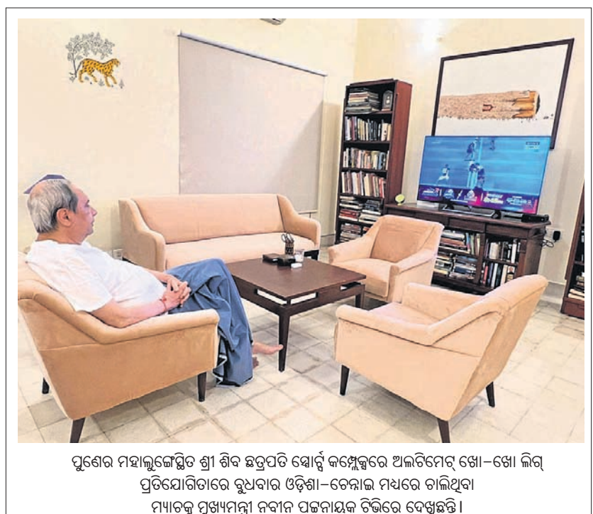
ପୁଣେର ମହାଲକ୍ଷ୍ମୀଙ୍କୁ ଶ୍ରୀ ଶ୍ରୀ ଛତ୍ରପତି ଚୋର୍ସ୍ କମ୍ପ୍ଲେକ୍ସରେ ଅଧିକାରୀଙ୍କୁ ଖୋ-ଖୋ ଲିଭି ପ୍ରତିଯୋଗିତାରେ ରୁଧିରୀ ଓଡ଼ିଶା-ଚେନ୍ନାଇ ମଧ୍ୟରେ ଚାଲିଥିବା ମ୍ୟାଟ୍ଟର ପୁଞ୍ଜୀମଣ୍ଡଳୀ ନବୀନ ପକ୍ଷରୁ ବିଭାଗୀୟ ଦେଖିଛନ୍ତି।