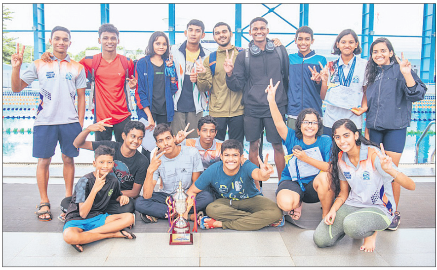
କଳିଙ୍ଗ ଷ୍ଟାଡ଼ିୟମର ବିଜୁ ପଟ୍ଟନାୟକ ସ୍ମୃତି ପୁଲରେ ଗୁଡ଼ିକର ଉଦ୍‌ଘାଟିତ ରାଜ୍ୟ ସନ୍ତରଣ ଚାମ୍ପିୟନଶିପ୍ରେ ଚାମ୍ପିୟନ ଭୁବନେଶ୍ୱର ଓ ରତ୍ନଅପ୍ ସମ୍ବଲପୁର ଦଳ ଚୁପ୍ ସହ।