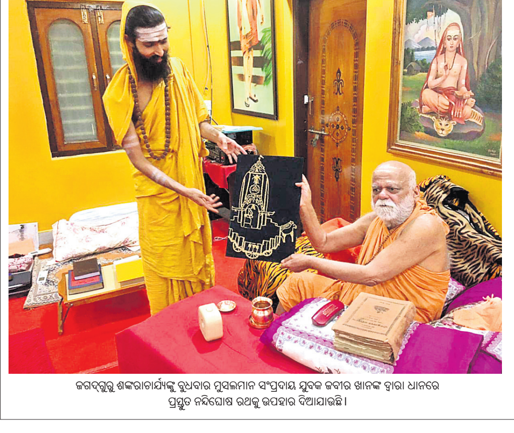
ଜଗଦଗୁରୁ ଶଙ୍କରାଚାର୍ଯ୍ୟଙ୍କୁ ବୁଧବାର ମୁଖ୍ୟମାନ ସଂପ୍ରଦାୟ ସ୍ତମ୍ଭକ ଜବାର ଖାନଙ୍କ ଦ୍ୱାରା ଧ୍ୟାନରେ ପ୍ରସ୍ତୁତ ନିର୍ଦ୍ଦେଶାଳୟ ଉପହାର ଦିଆଯାଇଛି।

ରାଜ୍ୟରେ ପ୍ରଥମରୁ ଅଷ୍ଟମ ଶ୍ରେଣୀରେ ବ୍ୟବହାର ହେବାକୁ ଥିବା ପାଠ୍ୟକ୍ରମ ଏବଂ ପାଠ୍ୟ ପୁସ୍ତକକୁ ଷ୍ଟେଟ୍ ଏକାଡେମିକ ଅଥରିଟି (ଏସଏଏଏଏ) ଅନୁମୋଦନ କରିବ। ଏ ନେଇ ବୁଧବାର ରାଜ୍ୟ ସରକାର ଘୋଷଣା କରିଛନ୍ତି। ଏ ସମ୍ପର୍କରେ ଶିକ୍ଷକ ଶିକ୍ଷା ନିର୍ଦ୍ଦେଶାଳୟ ଏବଂ ରାଜ୍ୟ ଶିକ୍ଷା ଗବେଷଣା ଓ ପ୍ରଶିକ୍ଷଣ ପରିଷଦ ପକ୍ଷରୁ ନିର୍ଦ୍ଦେଶନାମା ଜାରି ହୋଇଛି। ବିଭିନ୍ନ ବିଭାଗ, ନିର୍ଦ୍ଦେଶାଳୟ ଏବଂ ଏକେଡ୍ମି ଦ୍ୱାରା ପ୍ରସ୍ତୁତ ହେଉଥିବା ପ୍ରଥମରୁ ଅଷ୍ଟମ ଶ୍ରେଣୀର ପାଠ୍ୟକ୍ରମ, ପାଠ୍ୟପୁସ୍ତକ ଏବଂ ସଫ୍ଟୱେର ଆମେରିକାନ୍ ଷ୍ଟାଣ୍ଡାର୍ଡ୍ସ ରାଜ୍ୟରେ କାର୍ଯ୍ୟକାରୀ ହେବା ପାଇଁ ଏସଏଏଏ ଦ୍ୱାରା ଅନୁମୋଦିତ ହେବ ବୋଲି ଉଚ୍ଚ ନିର୍ଦ୍ଦେଶନାମାରେ ଉଲ୍ଲେଖ ରହିଛି। ସୂଚନାଯୋଗ୍ୟ, ରାଜ୍ୟ ସରକାର ୨୦୧୦ ଅକ୍ଟୋବର ୨୦ରେ ମାଗଣା ଓ ବାଧ୍ୟତାମୂଳକ ଶିକ୍ଷା ଅଧିନିୟମ, ୨୦୦୯ ଅନୁସାରେ ପ୍ରାଥମିକ ଶିକ୍ଷା ପାଇଁ ପାଠ୍ୟକ୍ରମ ଏବଂ ମୂଲ୍ୟାୟନ ପ୍ରକ୍ରିୟା ଛାଡ଼ି କରିବାକୁ ଶିକ୍ଷକ ଶିକ୍ଷା ନିର୍ଦ୍ଦେଶାଳୟ ଏବଂ ରାଜ୍ୟ ଶିକ୍ଷା ଗବେଷଣା ଓ ପ୍ରଶିକ୍ଷଣ ପରିଷଦକୁ ଷ୍ଟେଟ୍ ଏକାଡେମିକ ଅଥରିଟି ଭାବେ ଘୋଷଣା କରିଥିଲେ।