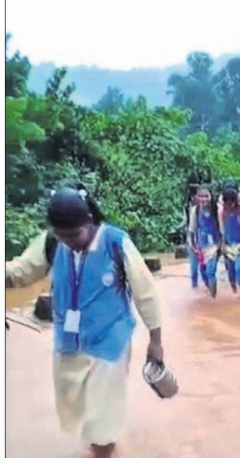
ଛାତ୍ରୀଛାତ୍ର ପାଣିରେ ପଶି ପୋଲ ପାରି ହେଉଛନ୍ତି।

କେନ୍ଦୁଝର ଜିଲ୍ଲା ଡେଲକୋଇ ବ୍ଲକ୍ ଅନ୍ତର୍ଗତ ପିଟାମାଳି-ସାପଲୀଖି ପୋଲରେ ଦୁଇପୁଠର ପାଣି ପ୍ରବାହିତ ହେବା ଯୋଗୁ ଓଡ଼ିଆ ପଞ୍ଚାୟତ ଅଧୀନ ଆଦର୍ଶ ବିଦ୍ୟାଳୟର ଛାତ୍ରୀଛାତ୍ର ଅଟକି ରହିଥିଲେ। ତେବେ ସାମାନ୍ୟ ପାଣି କମିବାପରେ ଶିକ୍ଷକଙ୍କ ସହାୟତାରେ ବିପଦପୂର୍ଣ୍ଣ ଅବସ୍ଥାରେ ଛାତ୍ରୀଛାତ୍ରୀ ପୋଲ ପାରି ହୋଇଥିଲେ। ଏହି ଆଦର୍ଶ ବିଦ୍ୟାଳୟରେ ୮ମ ଶ୍ରେଣୀ ଠାରୁ ୧୨ ପର୍ଯ୍ୟନ୍ତ ୨୮୦ ଛାତ୍ରୀଛାତ୍ର ଅଧ୍ୟୟନ କରୁଛନ୍ତି। ହଷ୍ଟେଲ ବ୍ୟବସ୍ଥା ରହିଥିଲେ ହେଁ ବହୁ ଛାତ୍ରୀଛାତ୍ର ଡେଲକୋଇ ମୁଖ୍ୟାଳୟରୁ ଯିବାଆସିବା କରିଥାନ୍ତି। ଛାତ୍ରୀଛାତ୍ରଙ୍କ ପୁରୁଣା ଦୃଷ୍ଟିରୁ ଅଭିଭାବକ ମାନେ ଏକ ଭଲ ପୋଲ ନିର୍ମାଣ ପାଇଁ ଦାବି କରିଛନ୍ତି। ପ୍ରତ୍ୟେକ ବର୍ଷ ବର୍ଷାଦିନେ ଏଭଳି ସମସ୍ୟା ଦେଖାଦେଇଥାଏ। ଅନେକ ସମୟରେ ଦମକକ ବାହିନୀ ସହାୟତାରେ ପିଲମାନେ ପାର ହୋଇଥାନ୍ତି।