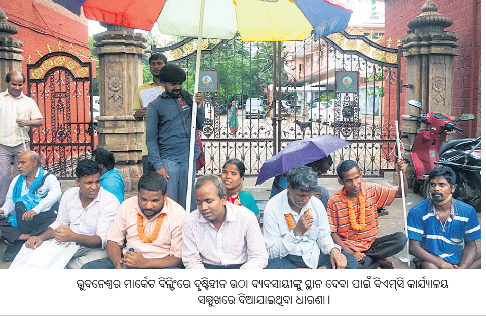
ଭୁବନେଶ୍ୱର ମାର୍କେଟ ବିଲ୍ଡିଂରେ ଦୃଷ୍ଟିହୀନ ଉଠା ବ୍ୟବସାୟୀଙ୍କୁ ସ୍ଥାନ ଦେବା ପାଇଁ ବିଏମ୍‌ସି କାର୍ଯ୍ୟକ୍ରମ ସମ୍ବନ୍ଧରେ ଦିଆଯାଇଥିବା ଧ୍ୟାନ।