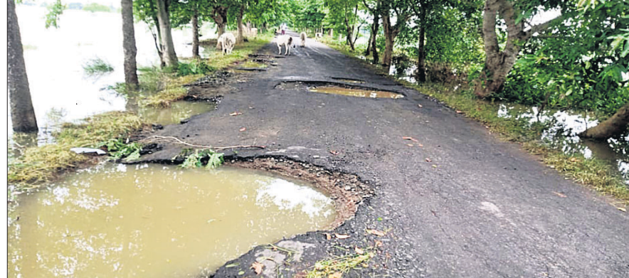
କଣାସ/ଡେଲାଙ୍ଗ, ୨୪।୮ (ସ.ପ୍ର./ଡି.ଏନ୍.ଏ.)