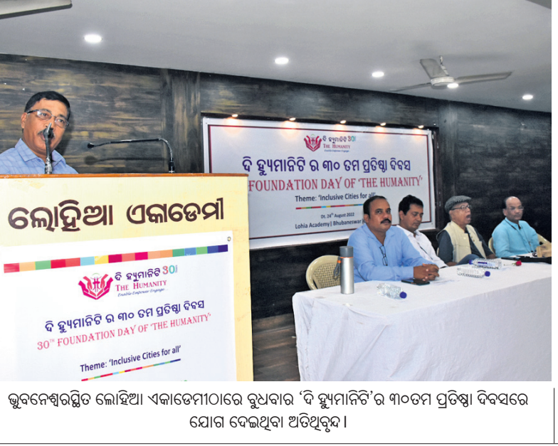
ଭୁବନେଶ୍ୱରସ୍ଥିତ ଲୋହିଆ ଏକାଡେମୀରେ ବୁଧବାର 'ଦି ହ୍ୟୁମାନିଟି'ର ୩୦ତମ ପ୍ରତିଷ୍ଠା ଦିବସରେ ଯୋଗ ଦେଇଥିବା ଅଭିଯୋଗକରଣ।