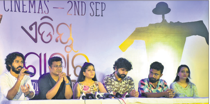
ଖବରଦାତା ସମ୍ମିଳନୀରେ ଫିଲ୍ମ 'ଏଡିୟୁ ଗୋଦାର' ସମ୍ପର୍କରେ ସୂଚନା ଦିଆଯାଇଛି।