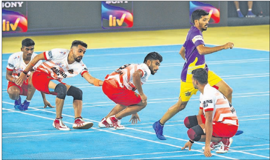
ଓଡ଼ିଶା ଜଗରନନନ୍ଦ ଓ ଚେନାଇ କୁଲକ୍ ଗର୍ବୁ ମଧ୍ୟରେ ଅନୁଷ୍ଠିତ ମ୍ୟାଚ।

ପୁଣେର ମହାଲକ୍ଷ୍ମୀ ଶ୍ରୀ ଶିବ ଉତ୍ସବରେ ଯୋଗ୍ୟ କର୍ମେତ୍ରରେ ଚାଲିଥିବା ଅଲିମ୍ପିକ ଖେଳା ଲିଗର ରୂପବାର ଅନୁଷ୍ଠିତ ଏକ ମ୍ୟାଚରେ ଓଡ଼ିଶା ଜଗରନନନ୍ଦ ୧୦ (୫୧-୪୧) ପଏଣ୍ଟରେ ଚେନାଇ କୁଲକ୍ ଗର୍ବୁ ପରାସ୍ତ କରିଛି। ଏଥିସହ ବିଜୟରେ ହାତୀକ ଅର୍ଜନ କରିଛି।