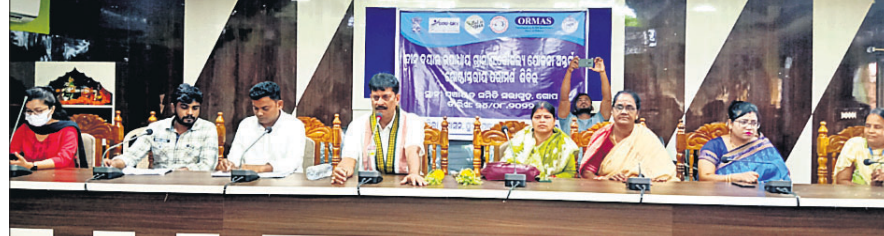
ରୁକ୍ମସୁରାୟ ଆତ୍ମନିର୍ଭରଶୀଳ ପରାମର୍ଶ ଶିବିରରେ ଉପସ୍ଥିତ ମନ୍ତ୍ରୀ ସମୀର ରଞ୍ଜନ ଦାଶ ଓ ଅନ୍ୟ ଅତିଥି।