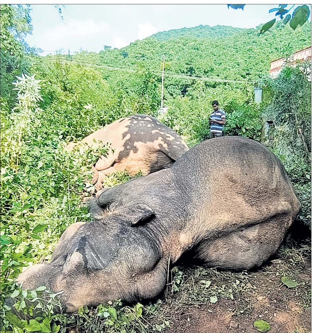
କେନ୍ଦୁଝର ଜିଲ୍ଲା କୁଡ଼ିଆ ଘାଟି ନିକଟସ୍ଥ ଓୟୁଏଟି କ୍ୟାମ୍ପସ ପରିସରରେ ଗୁରୁବାର ବିଦ୍ୟୁତ୍ ତାରରେ ଛଦି ହୋଇ ୨ ହାତୀଙ୍କ ମୃତ୍ୟୁ ଘଟିଛି। (ବିପୋର୍ତ୍ତ: ପୃଷ୍ଠା-୩)