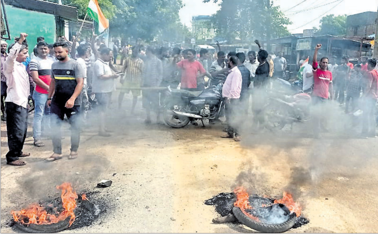
ଝାରସୁଗୁଡ଼ା ଜିଲ୍ଲା ବନ୍ଧବାହାଲ ଶିଳ୍ପାଞ୍ଚଳର ସ୍ୱାଧୀନ କମ୍ପ୍ଲେକ୍ସ ଛକରେ ଗୁରୁବାର ଚାନ୍ଦିର କାଳି ଉତ୍ସବ ଲୋକଙ୍କ ରାସ୍ତା ଅବରୋଧ।