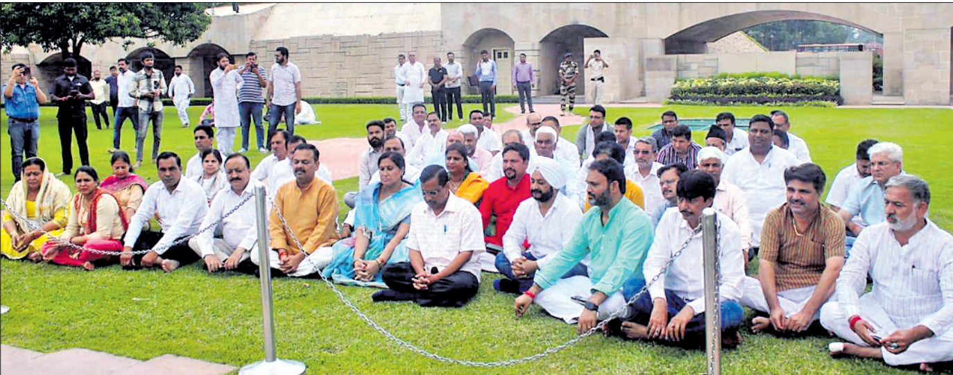
ଦିଲ୍ଲୀ ପୁଖ୍ୟମନ୍ତ୍ରୀ ଅରବିନ୍ଦ କେଜ୍ରିୱାଲ ଏବଂ ଆମ୍ମା ଆଦମା ପାର୍ଟି (ଏଏପି)ର ବିଧାୟକମାନେ ଗୁରୁବାର ରାଜଘାଟ ଯାଇ ମହାତ୍ମା ଗାନ୍ଧୀଙ୍କ ସମାଧିରେ ଶ୍ରଦ୍ଧାଞ୍ଜଳି କରାଇବା ସହ ଭାଜପା 'ଅପରେଶନ ଲୋଡ଼ା' ବିପକ୍ଷ ହେବା ଲାଗି ପ୍ରାର୍ଥନା କରିଛନ୍ତି।