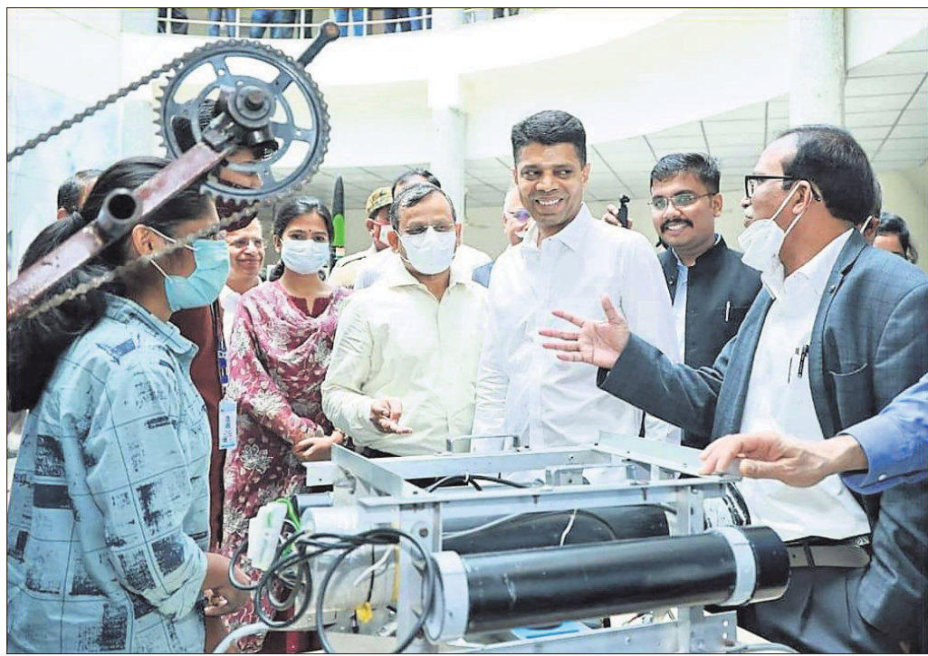
ଭିପୁର୍ ପରିସରରେ ମୁଖ୍ୟ ଶାସନ ସଚିବ, ୫-ଟି ସଚିବ, ଜିଲାପାଳ, କୁଳପତି ଓ ଅନ୍ୟମାନେ।