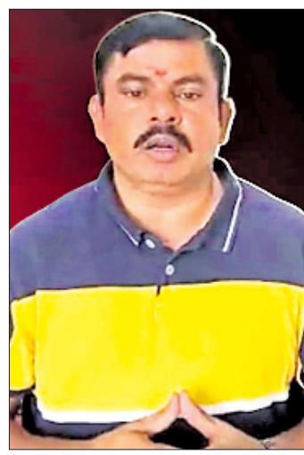
ଟି. ରାଜା ସିଂ

ହାଇଦ୍ରାବାଦ, ୨୫।୮ ଭାଜପା ନିଲମ୍ବିତ ହୋଇଥିବା ତେଲଙ୍ଗାନା ବିଧାୟକ ଟି. ରାଜା ସିଂ ଗାମିନରେ ମୁକ୍ତିଲାଭ ପରେ ଗୁରୁବାର ତାଙ୍କୁ ପିଡି ଆଇନରେ ପୁଣିଥରେ ଗିରଫ କରାଯାଇଛି।