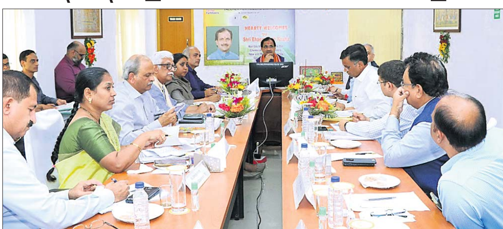
ସମୀକ୍ଷା ବୈଠକରେ କେନ୍ଦ୍ରମନ୍ତ୍ରୀଙ୍କ ସହ ଅନ୍ୟ ଅଧିକାରୀମାନେ।

ଭୁବନେଶ୍ୱର, ୨୫ (ବୁଧବୋ) କେନ୍ଦ୍ରମନ୍ତ୍ରୀ ଡି.ଏ. କିଶୋରୀ ରାଜ୍ୟରେ ଛାତ୍ର-ଶିକ୍ଷକ ଅନୁପାତକୁ ବୃଦ୍ଧି କରିବା ପାଇଁ ଉଦ୍ଦେଶ୍ୟ ପ୍ରଫେସର ଏବଂ କନିଷ୍ଠ ଅଧ୍ୟାପକ ପଦବୀ ପୂରଣ କରାଯାଇଛି।