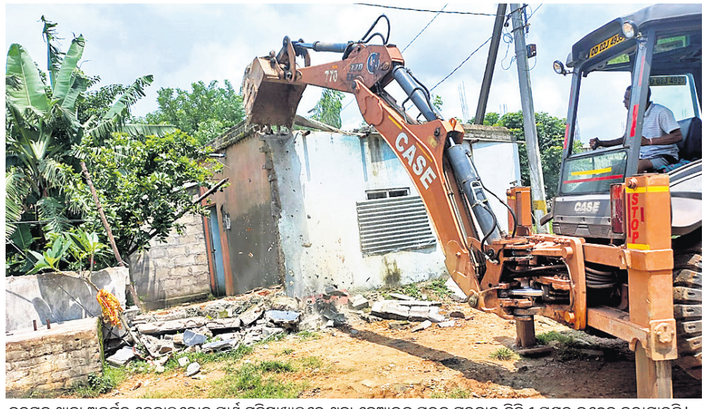
ବଡ଼ଗଡ଼ ଥାନା ଅନ୍ତର୍ଗତ କେନାଲରୋଡ଼ ପାଖ ମହିଷାଖାଇରେ ଥିବା ବେଆଇନ ଘରକୁ ଗୁରୁବାର ବିଧି-ପଦ ଥିବା ହାତରେ ଭଙ୍ଗ ହେଉଛି।

କନ୍ୟା ପଦାକୁ ଆସିଥିଲା। ୨୦୧୮ ସେପ୍ଟେମ୍ବର ୧୫ରୁ ପିପି ଏଣ୍ଡ ପିଏନ୍‌ଡିଟି ଆକ୍ରମଣ ଲାଗୁ ହେବାପରେ ଭୁବନେଶ୍ୱର ଡି.ଏନ.ଏ. କୋର୍ଟରେ ମାମଲା (୩୨୬/୨୧) ଦାଏର କରିଥିଲେ।