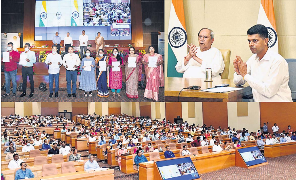
ଲୋକସେବା ଭବନରେ ଗୁରୁତ୍ୱପୂର୍ଣ୍ଣ ଉଦ୍ଦେଶ୍ୟ ସମ୍ପାଦନା ପୂର୍ଣ୍ଣାଙ୍ଗ ପଦକାନ୍ତ ଉଦ୍ଘାଟନ ସମୟରେ ଯୋଗଦେଇ ସମସ୍ତଙ୍କୁ ମନୁଷ୍ୟମାନୁଷ୍ୟଙ୍କୁ ଅଧିକାନ୍ତ କରିବା ପାଇଁ ଉଦ୍ଦେଶ୍ୟ ପ୍ରଫେସର ଏବଂ କନିଷ୍ଠ ଅଧ୍ୟାପକ ପଦବୀ ପୂରଣ କରାଯାଇଛି। ଏହା ରାଜ୍ୟରେ ଛାତ୍ର-ଶିକ୍ଷକ ଅନୁପାତକୁ ବୃଦ୍ଧି କରିବା ପାଇଁ ଉଦ୍ଦେଶ୍ୟ ପ୍ରଫେସର ଏବଂ କନିଷ୍ଠ ଅଧ୍ୟାପକ ପଦବୀ ପୂରଣ କରାଯାଇଛି।

ରାଜ୍ୟର ବିଭିନ୍ନ ସରକାରୀ କଲେଜରେ ୩୩୪ ଟି ଅଗ୍ରଣିକ ପଦବୀରେ ନିଯୁକ୍ତି ଦିଆଯାଇଛି। ଯେମାନଙ୍କ ମଧ୍ୟରେ ୨୯୧ ଜଣ ଲାଇବ୍ରେରିଆନ ଆସିଷ୍ଟାଣ୍ଟ, ୨୫୫ ଜଣ ଛାତ୍ରାଧିକାରୀ ଏବଂ ୧୮ ଜଣ ଶାସ୍ତ୍ରୀୟ ଶିକ୍ଷକ ପଦବୀ ପୂରଣ କରାଯାଇଛି। ନବନିଯୁକ୍ତମାନଙ୍କର ଏକ ଉଦ୍ଦେଶ୍ୟଗତ କାର୍ଯ୍ୟକ୍ରମ ଗୁରୁତ୍ୱପୂର୍ଣ୍ଣ ଲୋକସେବା ଭବନରେ ଅନୁଷ୍ଠିତ ହୋଇଛି। ଏହି କାର୍ଯ୍ୟକ୍ରମରେ ଭାର୍ତ୍ତ୍ୱ ଆଲୋଚନା ପ୍ରସଙ୍ଗରେ ପ୍ରଫେସର ଏବଂ କନିଷ୍ଠ ଅଧ୍ୟାପକ ପଦବୀ ପୂରଣ କରାଯାଇଛି। ଏହା ରାଜ୍ୟରେ ଛାତ୍ର-ଶିକ୍ଷକ ଅନୁପାତକୁ ବୃଦ୍ଧି କରିବା ପାଇଁ ଉଦ୍ଦେଶ୍ୟ ପ୍ରଫେସର ଏବଂ କନିଷ୍ଠ ଅଧ୍ୟାପକ ପଦବୀ ପୂରଣ କରାଯାଇଛି।