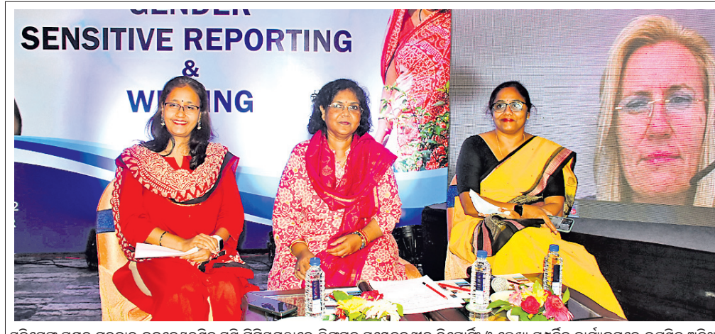
ଯୁନିସେପ୍ ପକ୍ଷରୁ ଗୁରୁବାର ଭୁବନେଶ୍ୱରସ୍ଥିତ ସ୍ୱପ୍ନା ପ୍ରିମିୟମ୍‌ରେ ଲିଜରସ୍ ସାମ୍ବେଦନଶୀଳ ରିପୋର୍ଟ ଓ ଲେଖା ସମ୍ପର୍କିତ କାର୍ଯ୍ୟକ୍ରମରେ ଉପସ୍ଥିତ ଅତିଥି।

କ୍ୟାପିଟାଲ ହସ୍ପିଟାଲରେ ୨୦୨୨-୨୩ ଶିକ୍ଷାବର୍ଷରୁ ପଞ୍ଜି ପାଠ୍ୟକ୍ରମ ଆରମ୍ଭ ନିମନ୍ତେ ଅନୁମତି ମିଳିଛି।