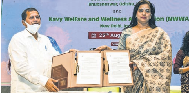
ଭୁବନେଶ୍ୱର, ୨୫।। (ବ୍ୟୁରୋ) ଦିୱାନି କଳାକାର ଶିକ୍ଷା ଯୋଗାଇଦେବା ଉପସ୍ଥିତ କିଏ ଓ କିଏର ଛାତ୍ରାଧିକାରୀ...

କଳାକାର ଶିକ୍ଷା ଯୋଗାଇଦେବା ଉପସ୍ଥିତ କିଏ ଓ କିଏର ଛାତ୍ରାଧିକାରୀ ପରାମର୍ଶ ଦେଇ ହରିଜୁମାର କହିଲେ, ସମଗ୍ର ବିଶ୍ୱକୁ ପରିବର୍ତ୍ତନ କରିବାର କ୍ଷମତା ଶିକ୍ଷାରେ ରହିଛି।