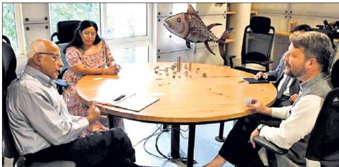
ଭୁବନେଶ୍ୱର, ୨୫ (ବୁଧବୋ)

କେନ୍ଦ୍ର ସରକାରଙ୍କ ଗୁରୁତ୍ୱପୂର୍ଣ୍ଣ ନିଷ୍ପତ୍ତିଗୁଡ଼ିକ ଆକାରରେ ନିରୀକ୍ଷଣ କରାଯାଇଛି। ଏହା ରାଜ୍ୟରେ ଛାତ୍ର-ଶିକ୍ଷକ ଅନୁପାତକୁ ବୃଦ୍ଧି କରିବା ପାଇଁ ଉଦ୍ଦେଶ୍ୟ ପ୍ରଫେସର ଏବଂ କନିଷ୍ଠ ଅଧ୍ୟାପକ ପଦବୀ ପୂରଣ କରାଯାଇଛି।