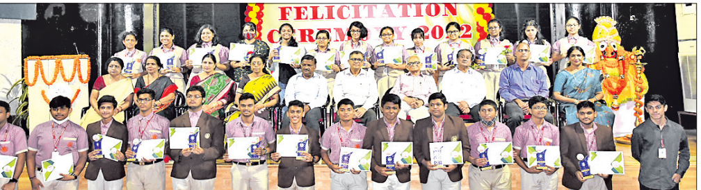
ଭୁବନେଶ୍ୱର, ୨୫।। (ବ୍ୟୁରୋ) ବିଜେଇଏମ୍ ସ୍କୁଲ ପକ୍ଷରୁ ଗୁରୁବାର ଏକ ସମର୍ପଣ ଉତ୍ସବ ଆୟତ୍ତ କରିବାକୁ ମନ୍ତ୍ରାଳୟରୁ ଅନୁମତି ମିଳିଥିଲା।