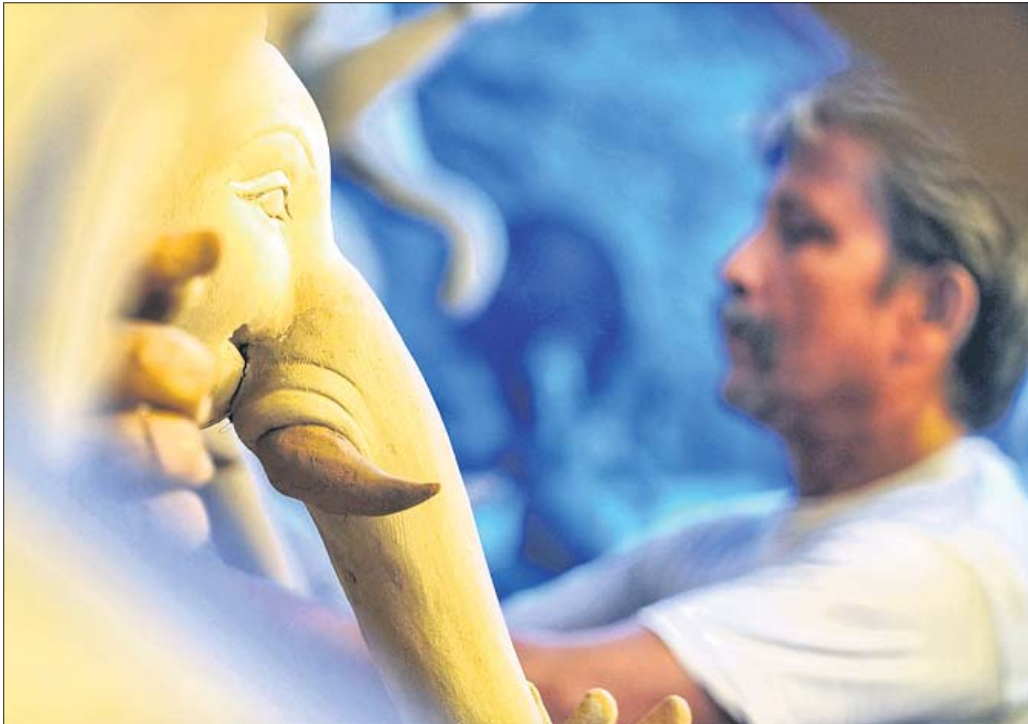
ଅନୁଗୋଳ ଦଶହରା ପଡ଼ିଆଠାରେ ଜଣେ କାରିଗର ଗଜାନନଙ୍କ ମୂର୍ତ୍ତିରେ ଶେଷ ସ୍ପର୍ଶ ଦେଉଛନ୍ତି।