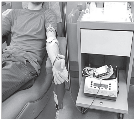
୨୦୦୦ ମସିହା ମୋ ମାସ ୨୦ ତାରିଖ । ଆମେ ବାଙ୍ଗାଲୋରରେ ପହଞ୍ଚି ତାକୁ ଖବର ଦେଲୁ । ସେ କହିଲା, 'ସାର୍, ରକ୍ତଦାନ ଦିବସ ସ୍ଥିରାକୃତ ହେଲେ ଜଣାଇବେ ।' ନିର୍ବାଚିତ ଦିନ । ରୁସରତ ପହଞ୍ଚିଲା ତା'ର ୫/୨ ଜଣ ସାଙ୍ଗକୁ ନେଇ । କେତେ ରକ୍ତ ନେଉଛ ନିଆ ! ସେମାନଙ୍କର ବିଶୁଦ୍ଧ ରକ୍ତ

ହୋଇଛି । ଏମାନେ ଜଣେ ଜଣେ ମୂର୍ଖ, ଚଳମାନ ଦେବଶିଳ୍ପୀ । ମଦର କେତେବେଳେ ଏହିମାନଙ୍କ କଥା କୁହନ୍ତି । ଏମାନେ କେତେ ପରିଚିତ, ପୁଣି କେତେ ସ୍ୱର୍ଗୀୟ, ଦୈବ ଆତ୍ମପ୍ରକାଶର କେତେ ନିର୍ଭରଯୋଗ୍ୟ ମାଧ୍ୟମ । ନିଜ ଆଦ୍ୟ ଜୀବନର ଅନୁଭୂତି ବ୍ୟାଖ୍ୟାକୁ ଯାଇ ମଦର କହନ୍ତି, କିପରି ଥରେ ରାତିରେ ଆଶ୍ରମରେ ରାଶନ ନ ଥିବା ଯୋଗୁ ସେମାନେ ବ୍ୟସ୍ତ ହେଉଥିବାବେଳେ ଜଣେ ଭଦ୍ରମହିଳା ପଣି ଆସିଲେ ଏବଂ ବାହାରକୁ ଯାଉଥିବାକୁ ନିଜ ଘରେ ଥିବା ଡାକି ଚାଉଳ ଆଣିବାକୁ ଦେଇଥିବା ପାଇଁ ଆଗ୍ରହ ପ୍ରକାଶ କଲେ । ମଦର ଆଶ୍ଚର୍ଯ୍ୟ ହେଲେ ଏବଂ କିଛି ସମୟ ପରେ ଭଦ୍ରମହିଳା ଜଣକ ଡାକି ବଳକା ସାମଗ୍ରୀତକ ଦେଇଗଲେ । ମଦରଙ୍କ ଅନୁସନ୍ଧିତା ବଢ଼ିଲା । ସେ ଅନ୍ତେସାଧନାମାନଙ୍କୁ କହିଲେ, ସେ ଚାଉଳତକ ଛୋଟ ମାପ ଡବାରେ ମାପି ଦେବାକୁ ଏବଂ ଦେଖାଗଲା ଠିକ୍ ଯେତିକି ଡବା ଚାଉଳ ରାତି ପାଇଁ ଦରକାର ଠିକ୍ ସେତିକି ହିଁ ଚାଉଳ ଥିଲା ବ୍ୟାଗରେ ! ଏତେ ଦିବ୍ୟ ସମ୍ଭାବନା ଥିବା ଭାରତର ଯୁବଗୋଷ୍ଠୀର ଆଜିର ଏ ଅବସ୍ଥା କ'ଣ ପାଇଁ ? ସ୍ୱାମିନୀର ଓ ସ୍ୱାଧୀନତା ରହିତ ଭାରତର ଯୁବଗୋଷ୍ଠୀ ଆଜି ରାଜନେତାମାନଙ୍କ କଳକରେ । ସେମାନଙ୍କର ବର୍ତ୍ତମାନ ଓ ଭବିଷ୍ୟତ ସେମାନଙ୍କ ନିୟନ୍ତ୍ରଣରେ ନାହିଁ । ତାହା ବନ୍ଧା ପଡ଼ିଛି ଅନ୍ୟ ଜାଗାରେ । ରାଜନେତାମାନଙ୍କ ଯାବତୀୟ ଶୋଷଣ ସତ୍ତ୍ୱେ ପୁଁ ଭାରତୀୟ ଯୁବଗୋଷ୍ଠୀଙ୍କ ଭବିଷ୍ୟତ ସମ୍ବନ୍ଧରେ ଆଶାବାଦୀ । ମୋ ଚେତୁଳ ଉପରେ ଦୁଇଟି ପଇଢ଼ ଥୋଇ ଦେଇଥିବା ସେହି ଶିକ୍ଷିତ ଯୁବକର ମୁଁ ଏବେ ବି ଦେଖାଯାଉଛି, ଆଉ ଦେଖାଯାଉଛି ତା'ର ନିଷ୍ପତ୍ତ ଆତ୍ମବିଶ୍ୱାସ । ନିଜର ମନ, ସିଦ୍ଧାନ୍ତ, ଅତିଥି ଉପରେ କି ବିଶ୍ୱାସ ! ସମାଜରେ ଆଜି ବିଶ୍ୱାସର ସଂକଟ- ନିଜ ଉପରେ, ପରସ୍ପର ଭିତରେ । ଭାବୁଛି ପରୁଲୋଚନର ବ୍ୟକ୍ତିଗତ ବିଶ୍ୱାସ ସାଧକମାନ ହୋଇଉଠିବ ଦିନ ! ପୂର୍ବର ଅଧ୍ୟକ୍ଷ, କଲ ଚୋଡ଼, ବାଲେଶ୍ୱର, ମୋ : ୯୪୩୭୭୭୭୨୧୯