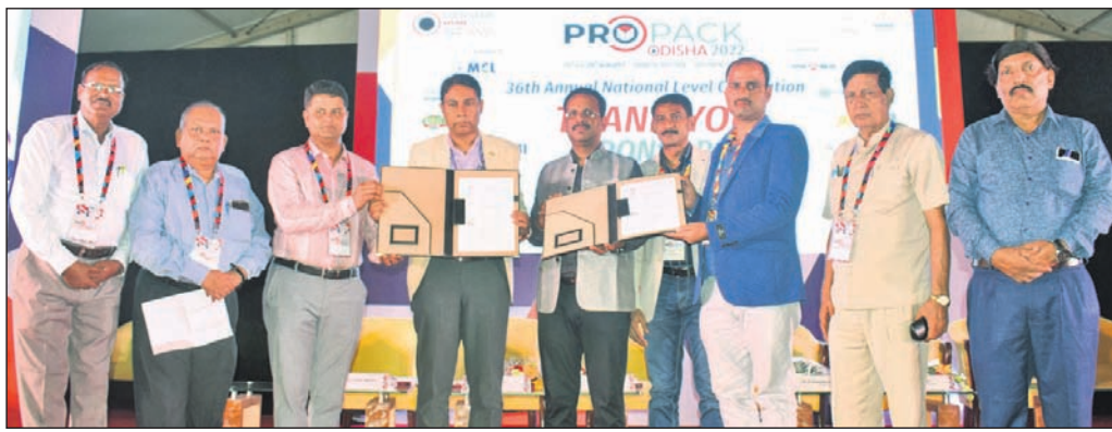
ପ୍ରୋପ୍ୟାକ୍ ଓଡ଼ିଶା-୨୦୨୨ ପରିପ୍ରେକ୍ଷାରେ ଆୟୋଜିତ ଏମ୍‌ଏସ୍‌ଏମ୍‌ଇ କର୍ମଶାଳାରେ ରୁଦ୍ଧିପତ୍ର ସ୍ୱାକ୍ଷର ଅବସରରେ ଉପସ୍ଥିତ ଅତିଥିମାନେ।

କରିଥାନ୍ତି ଓ ଗ୍ଲାନାୟ ଉଦ୍ୟୋଗୀ ଓ ଶିଳ୍ପ ସଂଘ ତା'ର ସଦସ୍ୟ ରହିଥାନ୍ତି। ସେହି ବୈଠକ ଆୟୋଜନ କଲେ ନିଷ୍ପତ୍ତି ନେଉଥିବା ବରିଷ୍ଠ ଅଧିକାରୀଙ୍କ ସହ ଉଦ୍ୟୋଗୀମାନେ ସିଧାସଳଖ ଯୋଡ଼ି ହୋଇପାରିବେ ଓ ସେମାନଙ୍କ ନିର୍ଦ୍ଦେଶ ଆବଶ୍ୟକତାକୁ ଗଣିପାରିବେ। ନାଲିକୋ