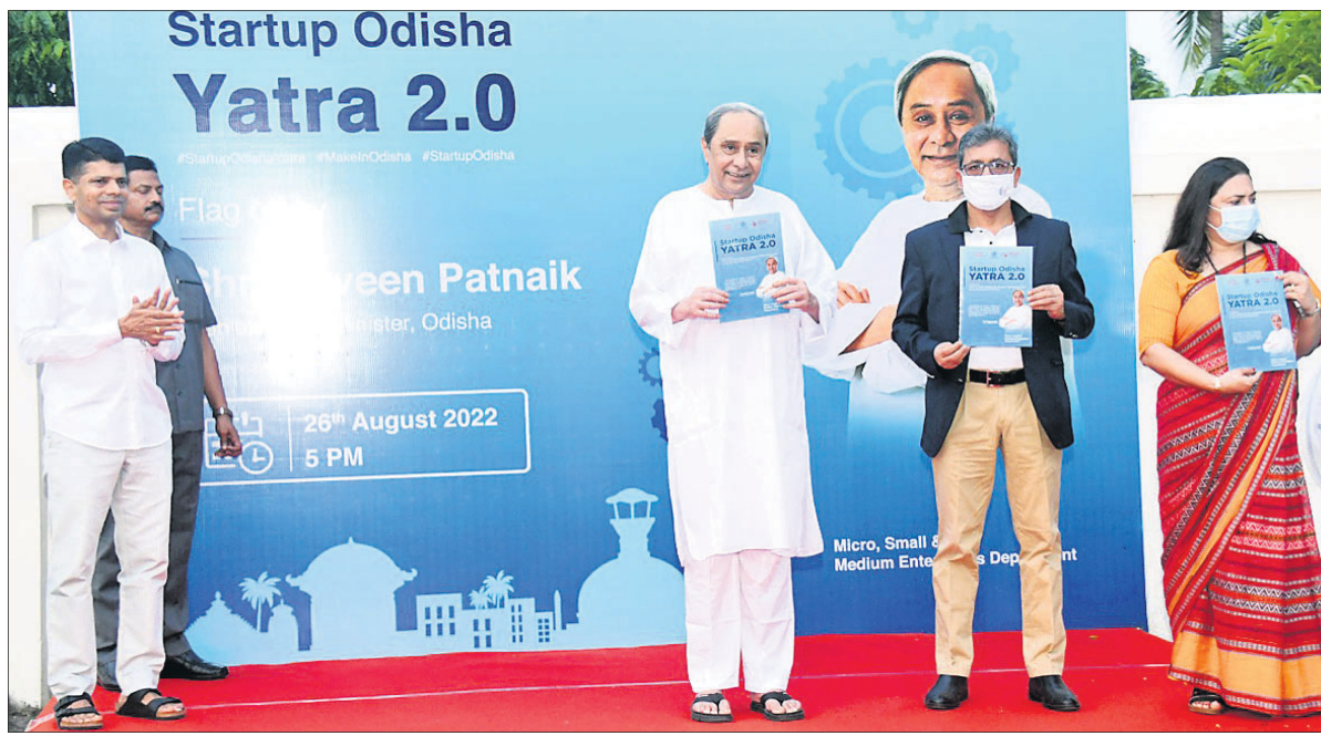
ଖୁବ୍ ଗୁରୁତ୍ଵ ଦେଇଛନ୍ତି। ରାଜ୍ୟରେ ବହୁ ସଂଖ୍ୟାରେ ମୁବ ଉଦ୍ୟୋଗୀ ସୃଷ୍ଟି ହେବେ। ଆସନ୍ତା ୨୦୨୫ ମୁଖ୍ୟ ୫ ହଜାର ଖୁବ୍ ଗୁରୁତ୍ଵ ଦେଇଛନ୍ତି। ରାଜ୍ୟର ଶିକ୍ଷାନୁଷ୍ଠାନଗୁଡ଼ିକରେ ମଧ୍ୟରେ ଉଦ୍ୟୋଗୀ ହେବାର ଭାବନା ଜାଗ୍ରତ କରାଯିବ। ଏହି ଲକ୍ଷ୍ୟ

ଭୁବନେଶ୍ଵର, ୨୬/୮ (ବୁଧବାର) ରାଜ୍ୟରେ ଅଧିକ ମୁବ ଉଦ୍ୟୋଗୀ ସୃଷ୍ଟି କରିବା ଉପରେ ସରକାର ଗୁରୁତ୍ଵ ଦେଉଛନ୍ତି। ମୁବଗୋଷ୍ଠୀଙ୍କ ମଧ୍ୟରେ ନୂତନ ଉଦ୍ୟୋଗୀ ହେବାର ଚିନ୍ତାଧାରାକୁ ତ୍ଵଣମୂଳ ପ୍ରଚାର କରିବା ପାଇଁ ସରକାର ରାଜ୍ୟ ସରକାର ଉଦ୍ୟମ ଆରମ୍ଭ କରିଛନ୍ତି। ଶିକ୍ଷିତ ମୁବଗୋଷ୍ଠୀକୁ ଏକ ସଫଳ ଉଦ୍ୟୋଗୀ ଭାବେ ଗଢ଼ି ତୋଳିବା ପାଇଁ ସରକାର ଖୁବ୍ ଗୁରୁତ୍ଵ ଦେଇଛନ୍ତି।