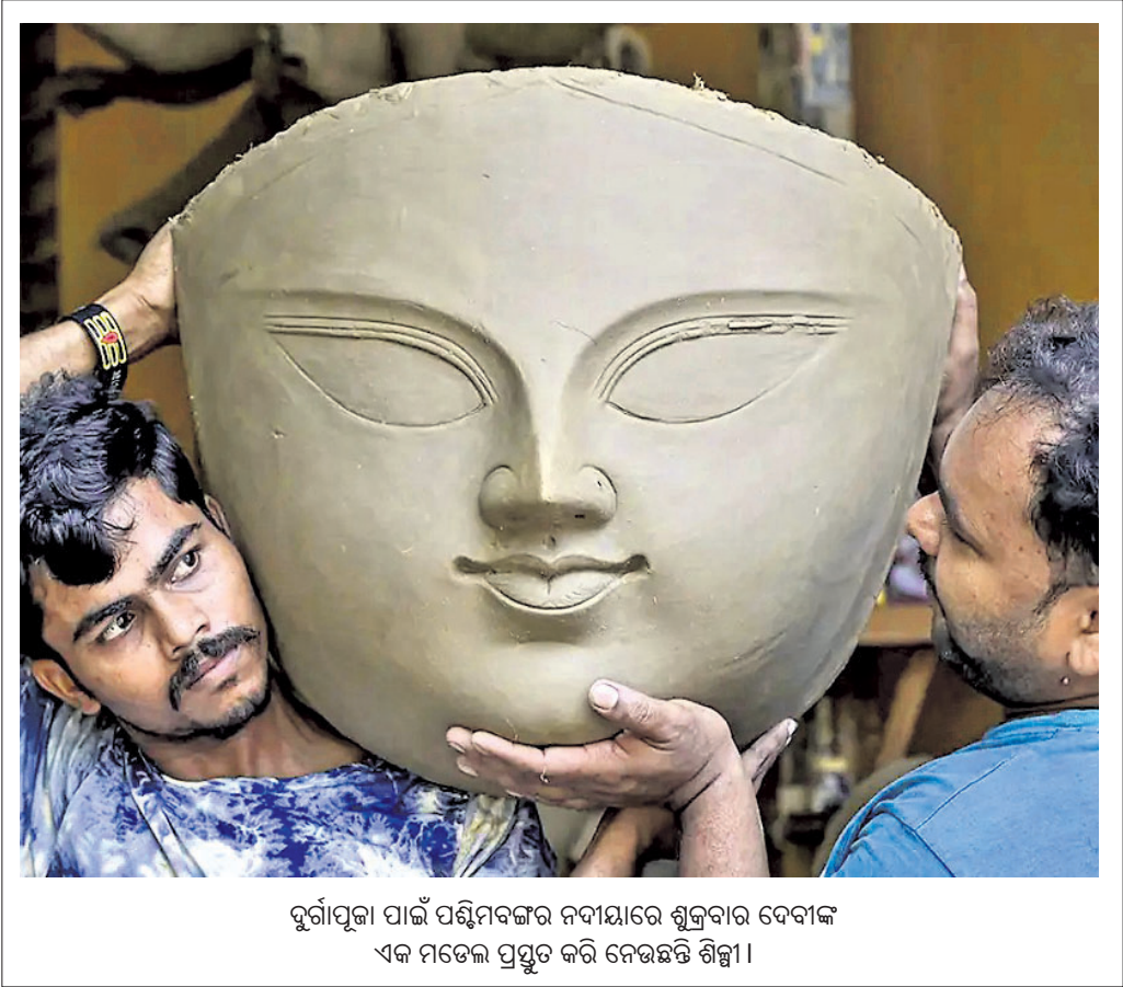
ଦୁର୍ଗାପୂଜା ପାଇଁ ପଶ୍ଚିମବଙ୍ଗର ନଦୀୟାରେ ଶୁକ୍ରବାର ଦେବାଙ୍କ ଏକ ମତେଲ ପ୍ରସ୍ତୁତ କରି ନେଉଛନ୍ତି ଶିଳ୍ପୀ।