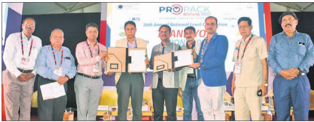
ପ୍ରୋପ୍ୟାକ୍ ଓଡ଼ିଶା-୨୦୨୨ ପରିପ୍ରେକ୍ଷାରେ ଆୟୋଜିତ ଏମ୍‌ଏସ୍‌ଏମ୍‌ଇ କର୍ମଶାଳାରେ ରୁଦ୍ରିପତ୍ର ସ୍ୱାକ୍ଷର ଅବସରରେ ଉପସ୍ଥିତ ଅତିଥିମାନେ।

କରିଥାନ୍ତି ଓ ଗ୍ଲାନାୟ ଉଦ୍ୟୋଗୀ ଓ ଶିଳ୍ପ ସଂଘ ତା'ର ସଦସ୍ୟ ରହିଥାନ୍ତି। ସେହି ବୈଠକ ଆୟୋଜନ କଲେ ନିଷ୍ପତ୍ତି ନେଉଥିବା ବରିଷ୍ଠ ଅଧିକାରୀଙ୍କ ସହ ଉଦ୍ୟୋଗୀମାନେ ସିଧାସଳଖ ଯୋଡ଼ି ହୋଇପାରିବେ ଓ ସେମାନଙ୍କ ନିର୍ଦ୍ଦେଶ ଆବଶ୍ୟକତାକୁ ଗଣିପାରିବେ। ନାଲିକୋ