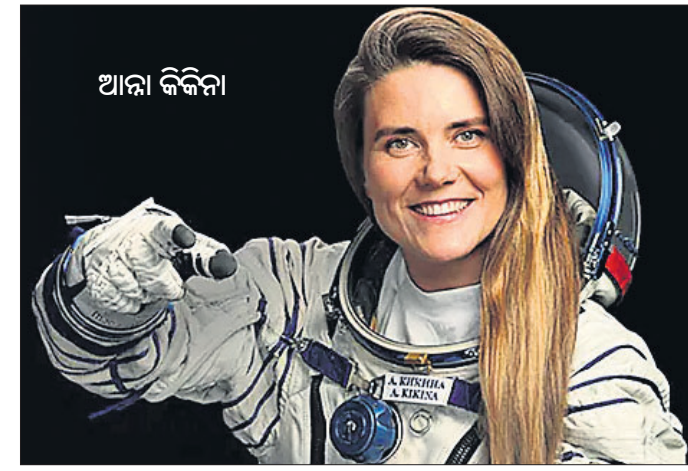
ଏବଂ ପ୍ରଥମ ରୁଷିଆ ଯେ, ଡ୍ରାଗନ୍ ଫ୍ଲାଜର୍ ଯାତ୍ରା ନେଇ ସ୍ୱେପ୍‌ସ୍ଟାସନ୍ ଯାତ୍ରା କରିବାକୁ ହେବାକୁ ଥିବା ଫାଇନାଲ ଟ୍ରେନିଂ ପାଇଁ

ରୁଷିଆର ଏକମାତ୍ର ମହିଳା ମହାକାଶଚାରୀ ଆନା କିକିନା ଆମେରିକା ସ୍ୱେପ୍ ଷ୍ଟେସନ୍ ଯିବା ନେଇ ନିଷ୍ପତ୍ତି ନିଆଯାଇଛି। କିନ୍ତୁ ଏହି କାର୍ଯ୍ୟକ୍ରମକୁ ଅନିର୍ଦ୍ଦିଷ୍ଟ ସମୟ ପାଇଁ ସ୍ଥଗିତ କରିଦିଆଯାଇଛି। ଅକ୍ଟୋବର ୩ରେ ସ୍ୱେପ୍ ଏକ୍ସପ୍ରେସ୍ କ୍ରିଜ ଡ୍ରାଗନ୍ ଫ୍ଲାଜର୍ କରିଆରେ ସ୍ୱେପ୍ ଷ୍ଟେସନ୍ ଯିବାର ସମୟ ଧାର୍ଯ୍ୟ କରାଯାଇଥିଲା। ୟୁକ୍ରେନ୍ ଓ ରୁଷିଆ ୟୁକ୍ରେନ୍ କେମ୍ବ କରି ଧାର୍ଯ୍ୟ କାର୍ଯ୍ୟକ୍ରମକୁ ବନ୍ଦ କରାଯାଇଥିବା ଜଣାଯାଇଛି। ରୁଷିଆ ତଥା ସୋଭିଏଟ୍ ସଂଘ ତରଫରୁ ସ୍ୱେପ୍ ମିଶନରେ ଆନା ହେଉଛନ୍ତି ୫ମ ମହିଳା ମହାକାଶଚାରୀ