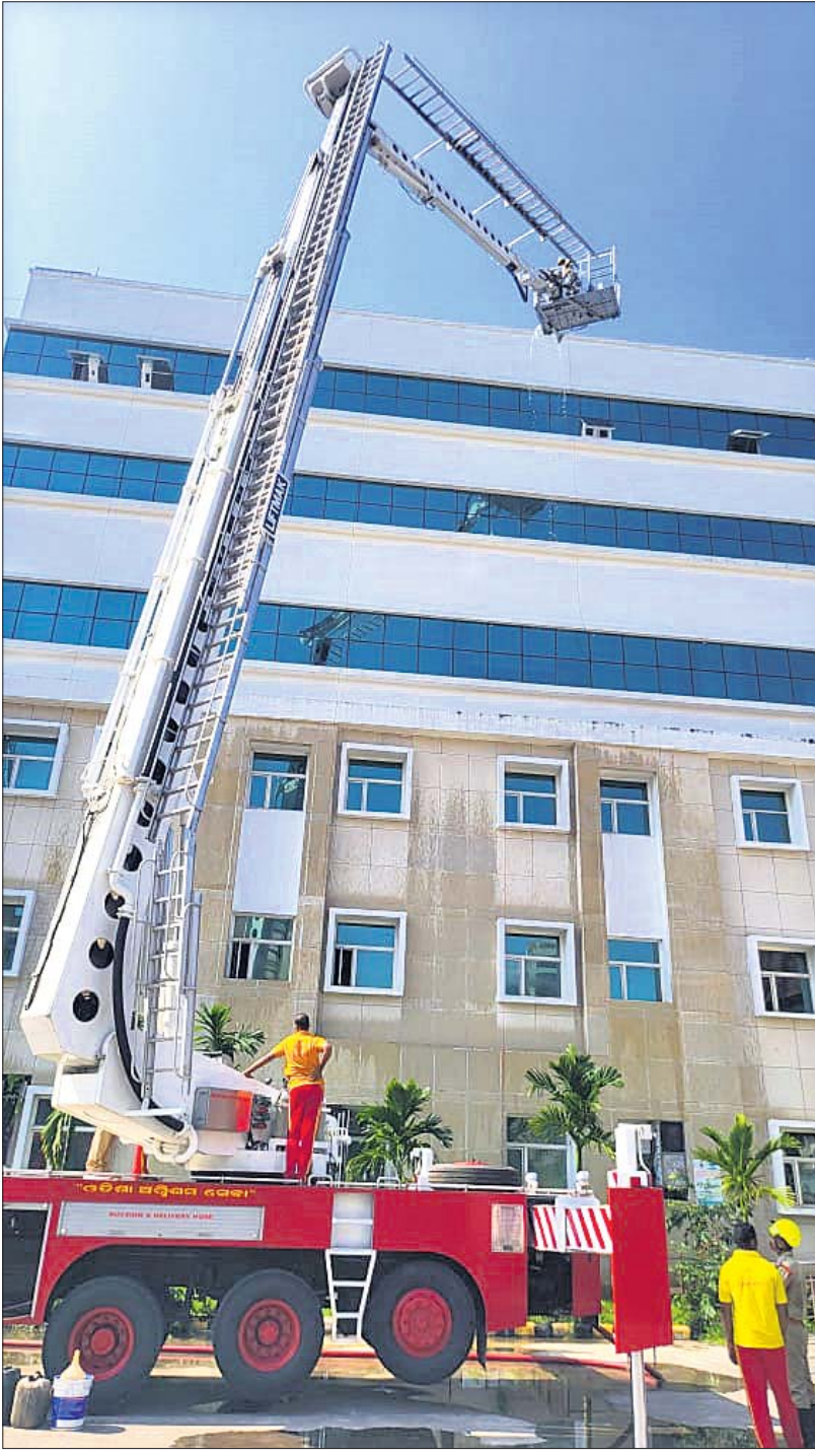
ସ୍ୱାସ୍ଥ୍ୟ ଲିଫ୍ଟ୍ ସାହାଯ୍ୟରେ ବାହାରପଟୁ ରୋଗୀଙ୍କୁ ଉଦ୍ଧାର କରୁଛନ୍ତି ଅଗ୍ନିଶମ କର୍ମଚାରୀ ।

ଶୁକ୍ରବାର ରାତି ୧୦ଟା ସୁଦ୍ଧା (+ ଅନ୍ୟ ରୋଗରେ କରୋନା ଅତୀତ ହେଉଥିବା ମୃତ୍ୟୁ) ଠିକଣା: https://www.worldometers.info/coronavirus/ ବଦଳୁ ଉପରେ