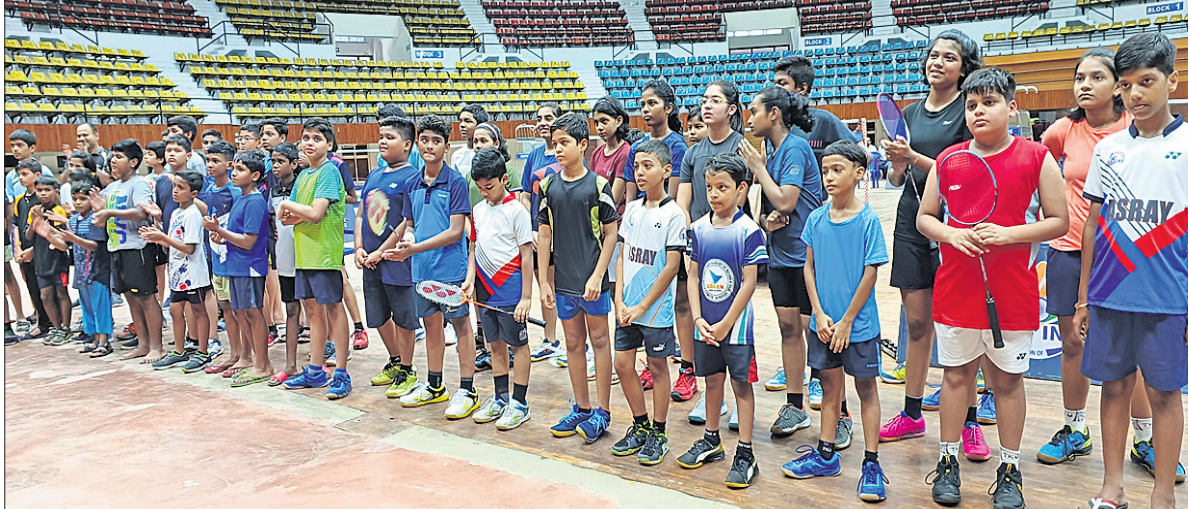
କଟକ ଜବାହରଲାଲ ନେହେରୁ ଇନ୍ଡୋର ସ୍ପୋର୍ଟସରେ ଶୁକ୍ରବାର କୁନିୟର ଓ ସର୍ବକୁନିୟର ଅଲ୍ ଓଡ଼ିଶା ଚ୍ୟାମ୍ପିୟନ୍ ବ୍ୟାଡ୍ମିଣ୍ଟନ ତୁର୍ନ୍ତମେଷ୍ଟର ଉଦ୍‌ଘାଟନା ଅବସରରେ ଅଂଶଗ୍ରହଣକାରୀ ପ୍ରତିଯୋଗିତାରେ।