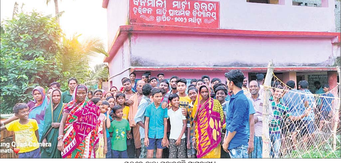
ସ୍କୁଲରେ ଡାଲା ପକାଇଛନ୍ତି ଗ୍ରାମବାସୀ ।

ଭୋଗରାଇ, ୨୬/୮ (ଡି.ଏନ.ଏ.) ବିଦ୍ୟାଳୟରେ ଛାତ୍ରଛାତ୍ରୀଙ୍କୁ ଶୁଖିଲାଖିନ ଶିଖାଇବା ଦାୟିତ୍ୱ ଶିକ୍ଷୟିତ୍ରୀ ଶିକ୍ଷକଙ୍କର । ହେଲେ ସ୍କୁଲ ପରିସରରେ ଦୁଇ ଶିକ୍ଷୟିତ୍ରୀ ନିଜ ନିଜ ମଧ୍ୟରେ ହାତାହାତି ହେବା ଓ ଜଣଙ୍କ ଆକ୍ରମଣରେ ଆଉ ଜଣଙ୍କ ମୁଣ୍ଡ ଫାଟିବା ଭଳି ଘଟଣା ସାଧାରଣରେ ଚର୍ଚ୍ଚାର ବିଷୟ ହୋଇଛି । ଆହତ ଶିକ୍ଷୟିତ୍ରୀଙ୍କୁ ଚିକିତ୍ସା ଲାଗି ଡାକ୍ତରଖାନାରେ ଭର୍ତ୍ତି କରାଯାଇଛି । ଏଭଳି ଘଟଣା ଘଟିଛି ବାଲେଶ୍ୱର ଜିଲ୍ଲା ଭୋଗରାଇ ବ୍ଲକ୍‌ରେ ।