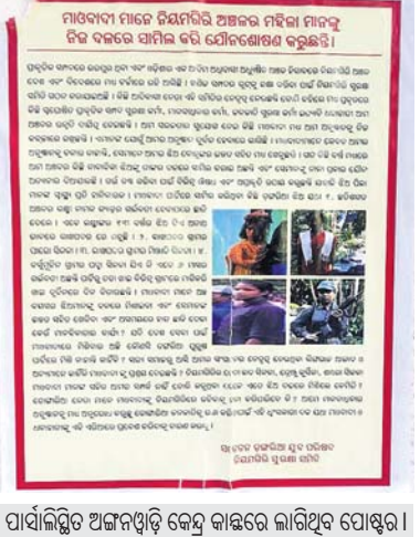
ପାରାଲିମ୍ପିକ ଅନୁଭବୀଙ୍କୁ କେନ୍ଦ୍ର କାଳରେ ମାରିଥିବା ପୋଷ୍ଟର