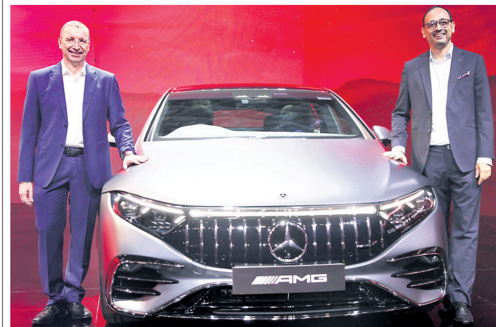
ମୁମ୍ବାଇଠାରେ ବିଳାସପୁର୍ଣ୍ଣ କାର୍ ନିର୍ମାତା ମର୍ସିଡିଜ୍-ବେଞ୍ଚ୍ ପକ୍ଷରୁ ଅତ୍ୟାଧୁନିକ ଛାନବୋକିଣ୍ଟରେ ନିର୍ମିତ ଏସ୍-ଏସ୍ ଆଇ-ଇଲେକ୍ଟ୍ରିକ୍ ଯାନ (ଇଭି) ଉପରେ ଏକ ଉତ୍ସାହୀଳତ ମହୁଲାର 'ମର୍ସିଡିଜ୍-AMG EQS 53 4MATIC +'ର ଶୁଭାରମ୍ଭ ଅବସରରେ କମ୍ପାନୀର ବରିଷ୍ଠ ଅଧିକାରୀ ଉପସ୍ଥିତ ଅଛନ୍ତି।