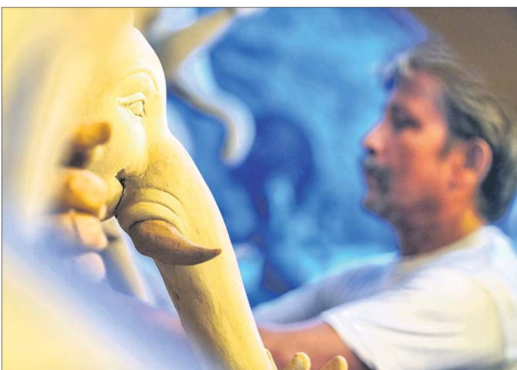
ଅନୁଗୋଳ ଦଶହରା ପଡ଼ିଆଠାରେ ଜଣେ କାରିଗର ଗଜାନନଙ୍କ ମୂର୍ତ୍ତିରେ ଶେଷ ସ୍ପର୍ଶ ଦେଉଛନ୍ତି।

ଭାରତୀୟ ହେଲେ ସଲମାନ ବଲିଉଡ୍ରେ ୩୪ ବର୍ଷର କ୍ୟାରିୟର ପୂରା ହେବା ନେଇ ସଲମାନ୍ ଖାନ୍ ଫ୍ୟାନ୍ସଙ୍କୁ ଧନ୍ୟବାଦ ଜଣାଇଛନ୍ତି।