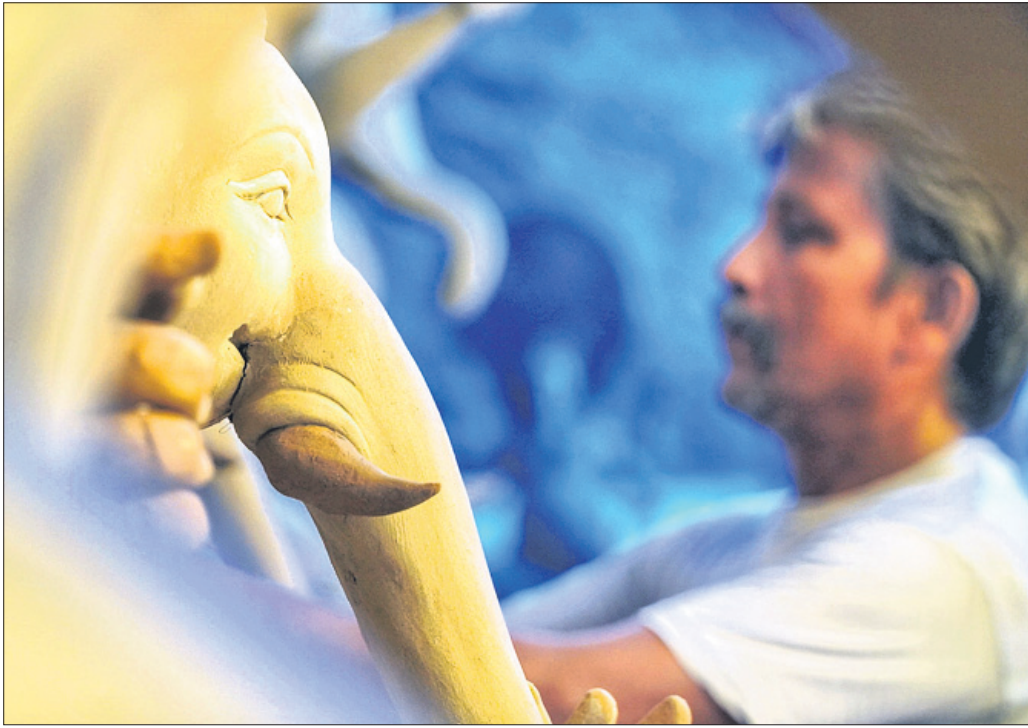
ଅନୁଗୋଳ ଦଶହରା ପଡ଼ିଆଠାରେ ଜଣେ କାରିଗର ଗଜାନନଙ୍କ ମୂର୍ତ୍ତିରେ ଶେଷ ସ୍ପର୍ଶ ଦେଉଛନ୍ତି।