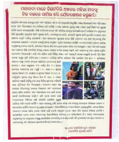
ପାରାଲିମ୍ବିଟ ଅନୁଷ୍ଠାନୀଙ୍କୁ କେନ୍ଦ୍ର କାନ୍ଧରେ ଲାଗିଥିବା ପୋଷ୍ଟର

ସେହିପରି ରାୟଗଡ଼ା ଏସ୍ପି ବିବେକନନ୍ଦ ଶର୍ମାଙ୍କ ପ୍ରତିକ୍ରିୟା ନେବାକୁ ଯୋଗଯୋଗ କରାଯାଇଥିଲେ ମଧ୍ୟ ସେ ଫୋନ୍ ଉଠାଇ ନ ଥିଲେ। ଫଳରେ ପୋଷ୍ଟରର ସାମାଜିକ ଏବଂ ଏହାକୁ କିଏ ଲଗାଇଛି ତାହା ସ୍ପଷ୍ଟ ହୋଇନାହିଁ। ଅନୁପପକ୍ଷରେ ରାୟଗଡ଼ା ଜିଲ୍ଲା ଧାରେ ଧାରେ ମାଓବାଦୀ ପୂର୍ଣ୍ଣ ହେଉଥିବା କୁହାଯାଉଥିବାବେଳେ ପୋଷ୍ଟରରେ ଉଲ୍ଲେଖ ଅଭିଯୋଗ ସତ ହେଲେ ସାଂଘାଟିକ ବୋଲି ବୁଝିକାଯାଇ ମଧ୍ୟରେ ମତପ୍ରକାଶ ପାଇଛି।