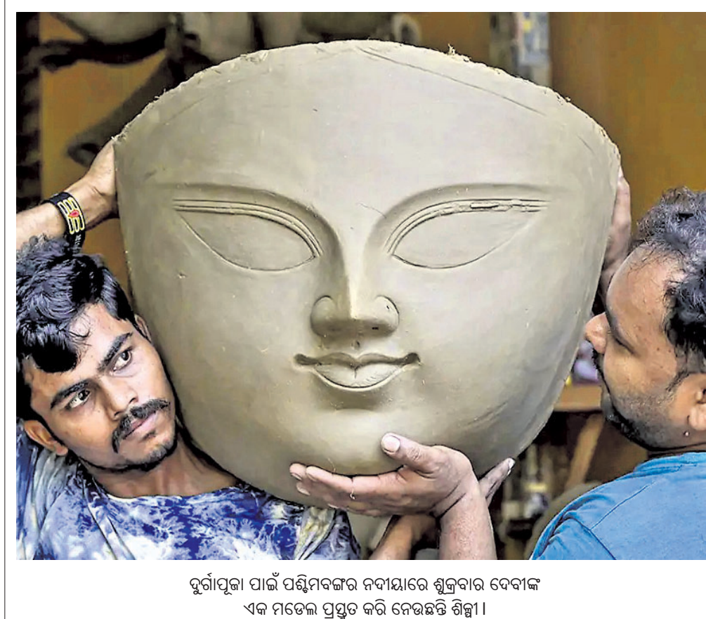
ଦୁର୍ଗାପୂଜା ପାଇଁ ପଣ୍ଡିତମାନଙ୍କ ନଦୀକୂଳରେ ଶୁକ୍ରବାର ଦେବାଙ୍କ ଏକ ମଡେଲ ପ୍ରସ୍ତୁତ କରି ନେଉଛନ୍ତି ଶିଳ୍ପୀ।

ସିଦ୍ଧାନ୍ତ ମଧ୍ୟ ରହିଛି। ଆମେରିକାରେ ବର୍ଣ୍ଣବୈଷମ୍ୟ ନିନ୍ଦାୟା। ହଁ, ଆମେ ଭାରତୀୟମାନେ ସବୁଠି ଅଛୁ।