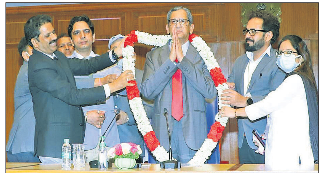
ବିଦାୟ ସିନେଆଲ୍ ଏନ୍.ଭି. ରମନାଙ୍କୁ ଅବସରକାଳୀନ ସମ୍ବର୍ଦ୍ଧନା ଦିଆଯାଇଛି।

ଭାରତର ପ୍ରଧାନ ବିଚାରପତି (ସିନେଆଲ୍) ପଦକୁ କ୍ଷୟ ଏନ୍.ଭି. ରମନା ଶୁକ୍ରବାର ଅବସର ନେଇଛନ୍ତି।