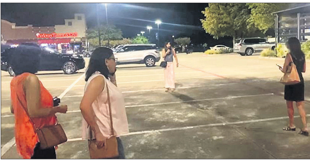
ଭାରତୀୟ ଭିତ୍ତିରେ ଭାରତୀୟ ମହିଳାଙ୍କୁ ଦୁର୍ବ୍ୟବହାର ବେଳର ଦୃଶ୍ୟ।

ମିଡିଆରେ ବହୁଳ ପ୍ରସାରିତ ହେବାରେ ଲାଗିଛି। ଏସ୍ମେରାଲ୍ଡା ଏଭଲି ବ୍ୟବହାର ଦେଖି ଆମେରିକାରେ ବସବାସ କରୁଥିବା ଭାରତୀୟ ସମୁଦାୟ ମଧ୍ୟରେ ଉଦ୍‌ବେଗ ପ୍ରକାଶ ପାଇଛି।