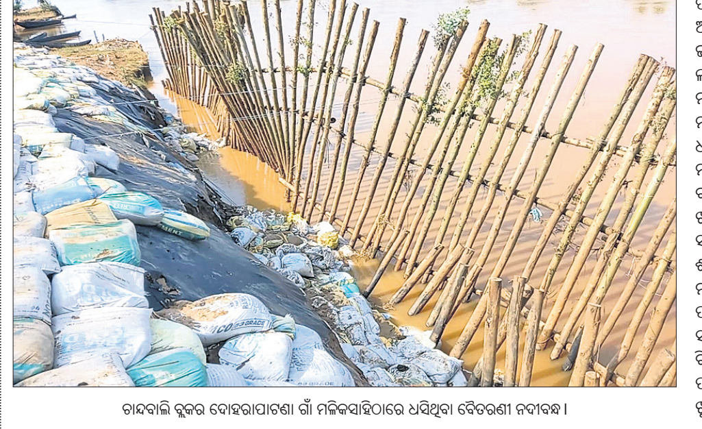
ଧର୍ମଶାଳା ବୈତରଣୀ ନଦୀରେ ନିର୍ମାଣ ହେଉଥିବା ଧର୍ମଶାଳା ବୈତରଣୀ ନଦୀବନ୍ଧ ।

ଧର୍ମଶାଳା ବୈତରଣୀ ନଦୀରେ ନିର୍ମାଣ ହେଉଥିବା ଧର୍ମଶାଳା ବୈତରଣୀ ନଦୀବନ୍ଧ । ଧର୍ମଶାଳା ବୈତରଣୀ ନଦୀରେ ନିର୍ମାଣ ହେଉଥିବା ଧର୍ମଶାଳା ବୈତରଣୀ ନଦୀବନ୍ଧ । ଧର୍ମଶାଳା ବୈତରଣୀ ନଦୀରେ ନିର୍ମାଣ ହେଉଥିବା ଧର୍ମଶାଳା ବୈତରଣୀ ନଦୀବନ୍ଧ ।