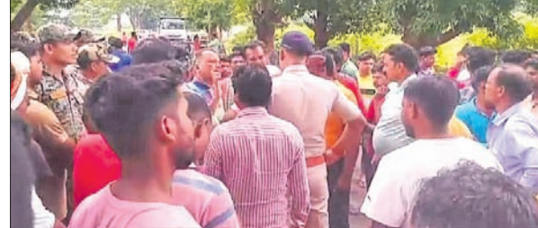
ରାଜ୍ୟ ଲୋକଙ୍କୁ ପୋଲିସ୍ ବୁଝାଶୁଣା କରୁଛି ।

ଫୁଲବାଣୀ-ବାଲିକୁଡ଼ା ମୁଖ୍ୟ ରାସ୍ତାରେ ବନ୍ଧଗଡ଼ ଗାଁ ନିକଟରେ ଶୁକ୍ରବାର ଏକ ତୃଣ-ଅଟୋ ମୁହାଁମୁହିଁ ଧର୍ମାନ୍ୱୟ ହୋଇଛି । ଏଥିରେ ଅଟୋରେ ବସିଥିବା ୫ ଜଣ ଗୁରୁତର ହୋଇଛନ୍ତି ।