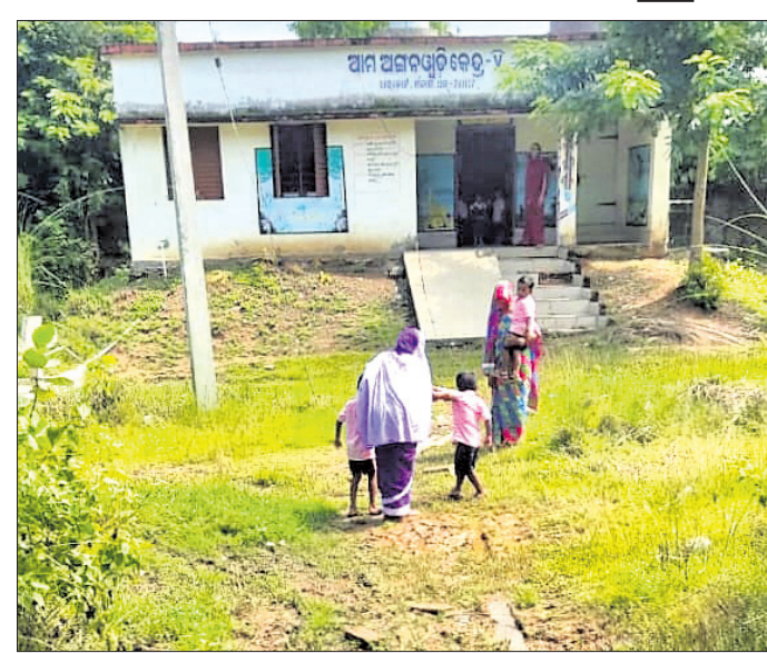
ଅଙ୍ଗନୱାଡ଼ି କେନ୍ଦ୍ର ପରିସରରେ ଅନାଦରା ଗଛ ଉଠିଛି ।

ଅନ୍ଧାର ଶିଶୁ କାଳିନ ନାଗରିକ। ସେମାନଙ୍କ ପୁରୁଣା, ଶିକ୍ଷା, ଦାୟିତ୍ୱ ଯୁଗ୍ମକୁ ରୂପେ ପାଳନ ପାଇଁ ସରକାରଙ୍କ ଶିଶୁ ବିକାଶ ବିଭାଗ ରହିଛି । ବିଭାଗ ତରଫରୁ ନିୟମିତ ଭାବରେ ଅଙ୍ଗନୱାଡ଼ି କେନ୍ଦ୍ରକୁ ସୁପରଭାଇକରମାନେ ପରିଦର୍ଶନ କରି ଶିଶୁ ବିକାଶ ପ୍ରକଳ୍ପ ଅଧିକାରୀଙ୍କୁ ରିପୋର୍ଟ ପ୍ରଦାନ କରିଥାନ୍ତି । ଶିଶୁର ବୌଦ୍ଧିକ ବିକାଶ ପାଇଁ ହସ, ଖେଳକୁ ପାଠ୍ୟପରେ ଶିକ୍ଷାଦାନ ସହ ପୁଷ୍ଟିକର ଖାଦ୍ୟ ପ୍ରଦାନ କରି ଅଙ୍ଗନୱାଡ଼ି କେନ୍ଦ୍ରକୁ ଆସିବା ପାଇଁ ପିଲାଙ୍କୁ ଆକୃଷ୍ଟ କରାଯାଏ । ଏଥିପାଇଁ ଅଙ୍ଗନୱାଡ଼ି କେନ୍ଦ୍ରରେ ପରିଷ୍ଠାର ପରିଚ୍ଛେଦ ସହ ସ୍ୱଳ୍ପ ପରିବେଶ ଏବଂ ଉପଯୁକ୍ତ ଭିତ୍ତିଭୂମି ରହିବା ଆବଶ୍ୟକ । ହେଲେ ସମ୍ପୂର୍ଣ୍ଣ ଧରାକୋଟର ଏକ ଅଙ୍ଗନୱାଡ଼ି କେନ୍ଦ୍ର ଭିତ୍ତିଭୂମି ଶିଶୁଙ୍କ ଉଦ୍ଦେଶ୍ୟରେ ପ୍ରସ୍ତୁତ ହୋଇନାହିଁ । ଧରାକୋଟର ୫ ନମ୍ବର କେନ୍ଦ୍ର ଗାନ୍ଧୀ ପାଠ୍ୟ ଉପକେନ୍ଦ୍ରରେ ଅନାଦରା ଗଛ ଉଠିଛି । ଏହି କେନ୍ଦ୍ରରେ ପଢ଼ୁଛନ୍ତି । ଇଶୋ କର୍ମୀ ଓ