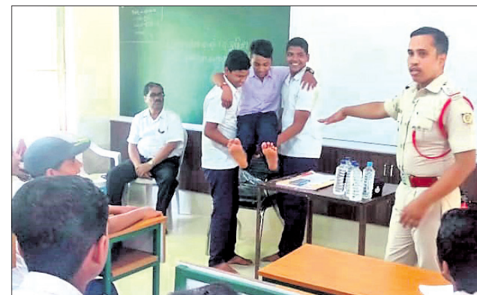
ଛାତ୍ରମାନଙ୍କୁ ତାଲିମ ଦିଆଯାଇଛି ।

ନୂଆଗାଁ, ୨୭।୮ (ଡି.ଏନ୍.ଏ.) ନୟାଗଡ଼ ଜିଲା ନୂଆଗାଁ ବ୍ଲକ ନୂଆଗାଁ ହାଇସ୍କୁଲରେ ଶୁକ୍ରବାର ଦମକକ ବାହିନୀ ପକ୍ଷରୁ ମକ୍ ତ୍ରିଲ୍ ଅନୁଷ୍ଠିତ ହୋଇଯାଇଛି । ଏଥିରେ ନିଆଁ ଲାଗିବା ଓ ଚୂର୍ଯ୍ୟଗଣ ସମୟରେ କିଛି ନିକଟ ପୁରୁଣିତ କରିବେ ସେ ନେଇ ଛାତ୍ରଛାତ୍ରୀମାନଙ୍କୁ ପ୍ରଶିକ୍ଷଣ ଦିଆଯାଇଥିଲା । କୌଣସି ସ୍ଥାନରେ ଚୂର୍ଯ୍ୟଗଣ ଘଟିଲେ ଆହତମାନଙ୍କୁ ଉଦ୍ଧାର କରି କିଛି ଡାକ୍ତରଖାନାକୁ ପ୍ରମୁଖ ଯୋଗଦେଇ ହାଇସ୍କୁଲ ପ୍ରାୟ ୧୫୦ ଛାତ୍ରଛାତ୍ରୀଙ୍କୁ ପ୍ରଶିକ୍ଷଣ ଦେଇଥିଲେ ।