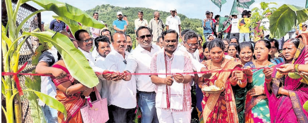
ମୋବାଇଲ୍ ନେଟୱାର୍କ ସେବା ଉଦ୍‌ୟାନ କରୁଛନ୍ତି ବିଧାୟକ ।