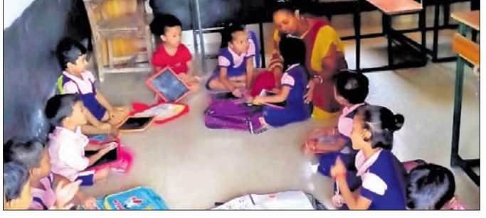
ଧୋବାସାହି ସ୍କୁଲରେ ପଢୁଛନ୍ତି ଅଙ୍ଗନୱାଡ଼ି ଶିଶୁ ।