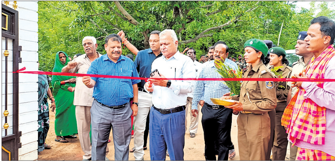
ଘୋଡ଼ାହାଡ଼ ଇକୋଟୁରିଜମ୍ ସ୍ୱର୍ଣ୍ଣ ଉଦ୍‌ୟାନ କରୁଛନ୍ତି ରାଜ୍ୟ ବନ୍ୟପ୍ରାଣୀ ବିଭାଗର ପ୍ରମୁଖ ସଚିବ ।