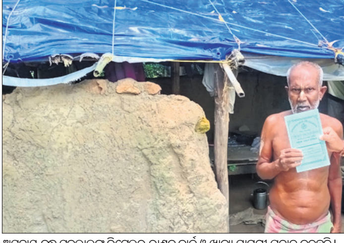
ଅସହାୟ ବୃଦ୍ଧ ଫୁଲଲାଲଙ୍କୁ ରିଟେଲର ରାଶନ କାର୍ଡ ଓ ଖାଦ୍ୟ ସାମଗ୍ରୀ ପ୍ରଦାନ କରୁଛନ୍ତି।

ପହଞ୍ଚି ଭଲ ମନ୍ଦ ପଚାରି ବୁଝିବା ସହ ଖାଦ୍ୟ ସୁରକ୍ଷା ଯୋଜନାରେ ତାଙ୍କ ନାମ ପଞ୍ଜୀକରଣ କରିବା ସହ ନୂଆ ରାଶନ କାର୍ଡ ଓ ଖାଦ୍ୟ ସାମଗ୍ରୀ ପ୍ରଦାନ କରିଛନ୍ତି। ବୁଦ୍ଧଶ୍ରୀ ପଦକ୍ଷେପ ଭଙ୍ଗା ପ୍ରଦାନ କରାଯିବ ବୋଲି ପ୍ରଶାସନ ପକ୍ଷରୁ ଜଣାଯାଇଛି। ଏହି ବୃଦ୍ଧ ଅସହାୟ, ଖବର ପ୍ରଦାନ ପରେ ଅଞ୍ଚଳର ବିଭିନ୍ନ ବର୍ଗର ଲୋକମାନେ 'ଧରିତ୍ରୀ'କୁ ସାଧୁବାଦ ଜଣାଇଛନ୍ତି।