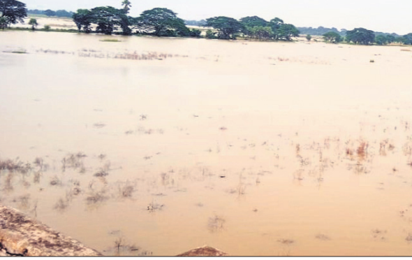
ଚାଷ ଜମି ବନ୍ୟା ପାଣିରେ ବୁଡ଼ି ରହିଛି।

ତନ୍ତୁଖୋଳ, ୨୬।୮ (ଡି.ଏନ୍.ଏ.): ହୋଇଛି। ସେଥିପାଇଁ ମହାନଦୀରେ ଆସୁଥିବା ଜଳ ଓ ବ୍ରାହ୍ମଣୀ ନଦୀରେ ଆସୁଥିବା ଜଳ ମିଶି ଯାଉଥିବା ଯୋଗୁ ବନ୍ୟାପରିସ୍ଥିତି ସୃଷ୍ଟି ହେଉଛି। ଉଚ୍ଚକ୍ରମରୁ, ଖଡ଼କପୁର, ଦେକୁରା, କଳାଗ୍ରୀ ଠାରେ ଏହି ବନ୍ୟାଜଳ ବିରୁଦ୍ଧା ନଦୀବନ୍ଧକୁ ଲାଗିଛି। ଯଦି ଆଦି ପଞ୍ଚାୟତର ବହୁ ଚାଷଜମି ଆଧିକାରୀଙ୍କ ମଧ୍ୟରେ ପ୍ରବେଶ ଦେଖିବାକୁ ମିଳିଛି। ମହାନଦୀର ବନ୍ଧିବାକୁ ମିଳିଛି। ମହାନଦୀର ଖାଖାନ୍ଦା ବିରୁଦ୍ଧା ଓ ବ୍ରାହ୍ମଣୀର ଖାଖାନ୍ଦା ବିରୁଦ୍ଧା ବଡ଼ତଣା କଳର ଖଡ଼କପୁରଠାରେ ମିଶ୍ରଣ ହୋଇଥିବା ଦେଖିବାକୁ ମିଳିଛି।