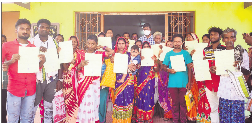
ପଢ଼ା ପାଇଥିବା ହିତାଧିକାରୀ ।