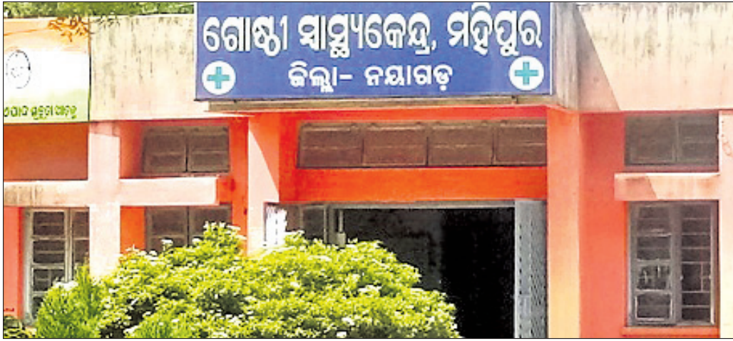
ମହାପୁର ଗୋଷ୍ଠୀ ସ୍ୱାସ୍ଥ୍ୟକେନ୍ଦ୍ର।

ଲଗାଣ ବର୍ଷା ଓ ବନ୍ୟା ପରେ ଖୋଲା କୂଅଗୁଡ଼ିକର ପାଣି ଦୂଷିତ ହୋଇ ଯାଇଥାଏ। ସେହି ପାଣି ବିଶୁଦ୍ଧ ନ ହେବା ଯାଏ ତାହାକୁ ବ୍ୟବହାର ନ କରିବା ଲାଗି ସରକାର ବିଜ୍ଞାପନ ଦେଇଛନ୍ତି। ସେହି ବିଜ୍ଞାପନ ପାଇଁ ଲକ୍ଷ ଲକ୍ଷ ଟଙ୍କା ମଧ୍ୟ ବ୍ୟୟ ହେଉଛି। କିନ୍ତୁ ଲଗାଣ ବର୍ଷା ପରେ କୂଅଗୁଡ଼ିକର ପାଣି ବିଶୁଦ୍ଧ କରିବାକୁ ସରକାର ଭୁଲି ଯାଇଛନ୍ତି। କୂଅ ପାଣିକୁ ବିଶୁଦ୍ଧ କରିବାକୁ ସରକାର ଝିଟିଂ ପାଇଡ଼ର ଯୋଗାଇ ଦେଇଛନ୍ତି। ହେଲେ ନୂଆଗାଁ ବ୍ଲକରେ କୌଣସି କୂଅରେ ଝିଟିଂ ପାଇଡ଼ର ପକା ଯାଇ ନ ଥିବା ଅଭିଯୋଗ ହେଉଛି। ନୟାଗଡ଼ ଜିଲ୍ଲା ନୂଆଗାଁ ବ୍ଲକର ଅନେକ ଗାଁକୁ ପାଇପ ଯୋଗେ ଜଳ ଯୋଗାଣ ବ୍ୟବସ୍ଥା କରାଯାଇ ନ ଥିବାରୁ ଲୋକମାନେ ଖୋଲା କୂଅ ପାଣିକୁ ବ୍ୟବହାର କରୁଛନ୍ତି।