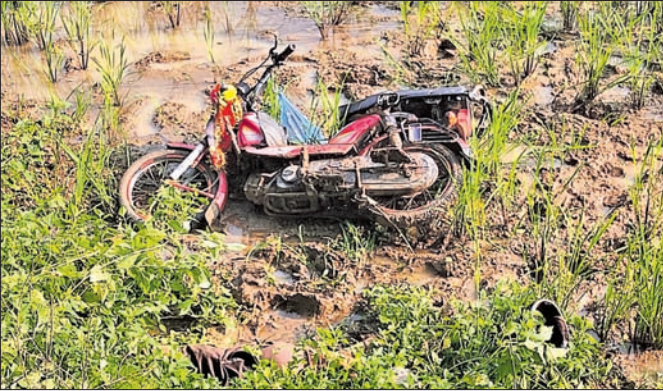
ଦୁର୍ଘଟଣାଗ୍ରସ୍ତ ବାଇକ୍ ଧାନଜମିରେ ପଡିଛି ।