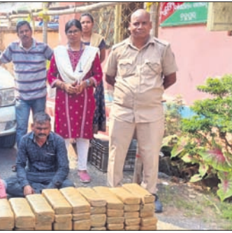
ଗିରଫ ଅଭିଯୁକ୍ତଙ୍କ ସହ ଜବତ ଗଞ୍ଜେଇ ପ୍ୟାକେଟ୍ ।