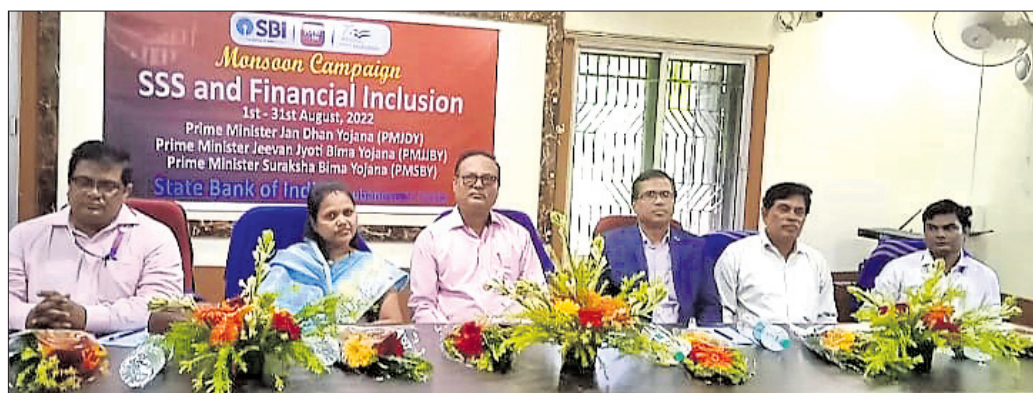
ସଚେତନତା କାର୍ଯ୍ୟକ୍ରମରେ ଉପସ୍ଥିତ ଅତିଥିମାନେ ।