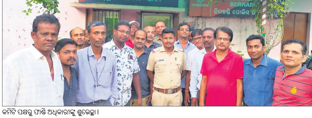
କମିଟି ପକ୍ଷରୁ ପାଞ୍ଚି ଅଧିକାରୀଙ୍କୁ ଶୁଭେଚ୍ଛା ।

ନିମନ୍ତ୍ରଣ ପାଞ୍ଚକୁ ରାଜ୍ୟ ସରକାର ବିଧିବଦ୍ଧ ଭାବେ ଥାନାରେ ପରିଶତ କରିବା ଘୋଷଣା କରିଥିବା ନେଇ ସହର ତଳି ଅଞ୍ଚଳ ମିଳିତ କ୍ରିୟାନୁଷ୍ଠାନ କମିଟି ମୁଖ୍ୟମନ୍ତ୍ରୀଙ୍କୁ କୃତଜ୍ଞତା ଜଣାଇଛନ୍ତି । ସହରତଳି ଅଞ୍ଚଳରେ ଭୌଗୋଳିକ ଅବସ୍ଥିତି, ପରିସାଧନା ଓ ଲୋକ ସଂଖ୍ୟା ଅଭିବୃଦ୍ଧି ହେବା ପରେ ଉଚ୍ଚ ଅଞ୍ଚଳରେ ଚୋରି, ଡକାୟତି, ରାହାକାନା, ନକଲି ସାମଗ୍ରୀ ପ୍ରଭୃତି ଓ ବିଭିନ୍ନ ଆପରାଧିକ କାର୍ଯ୍ୟକଳାପ ବୃଦ୍ଧି ପାଇଥିଲା । କୌଣସି ଅଭିଯୋଗ ନିମନ୍ତେ ଘ୍ନାନୀୟ ଲୋକଙ୍କୁ ୧୪ କି.ମି.ଦୂରରେ ଥିବା ସହର ଥାନା ଉପରେ ନିର୍ଭର ହେବାକୁ ପଡୁଥିଲା । ଏହାକୁ ଦୃଷ୍ଟିରେ ରଖି ନିମନ୍ତ୍ରଣରେ ଏକ ପାଞ୍ଚି ଘ୍ନାନୀୟ କରାଯାଇଥିଲା । କିଛି ପାଞ୍ଚି କ୍ଷମତା ଓ ଲୋକ ବଳ ସାମଗ୍ରୀ ସହରତଳି ଅଞ୍ଚଳରେ ଉପସ୍ଥିତ ହେବାକୁ ପଡୁଥିଲା । ଏହି ନିମନ୍ତ୍ରଣରେ ଉପସ୍ଥିତ ଅଭିଯୋଗ ଦାଖଲ ପାଇଁ ସହର ଥାନାକୁ ସହରତଳି ଅଞ୍ଚଳରେ ସୁରକ୍ଷା ମୁହାଁଣି କରାଯାଇଛି । ଏହି ନିମନ୍ତ୍ରଣରେ ଉପସ୍ଥିତ ଅଭିଯୋଗ ଦାଖଲ ପାଇଁ ସହର ଥାନାକୁ ସହରତଳି ଅଞ୍ଚଳରେ ସୁରକ୍ଷା ମୁହାଁଣି କରାଯାଇଛି । ଏହି ନିମନ୍ତ୍ରଣରେ ଉପସ୍ଥିତ ଅଭିଯୋଗ ଦାଖଲ ପାଇଁ ସହର ଥାନାକୁ ସହରତଳି ଅଞ୍ଚଳରେ ସୁରକ୍ଷା ମୁହାଁଣି କରାଯାଇଛି ।