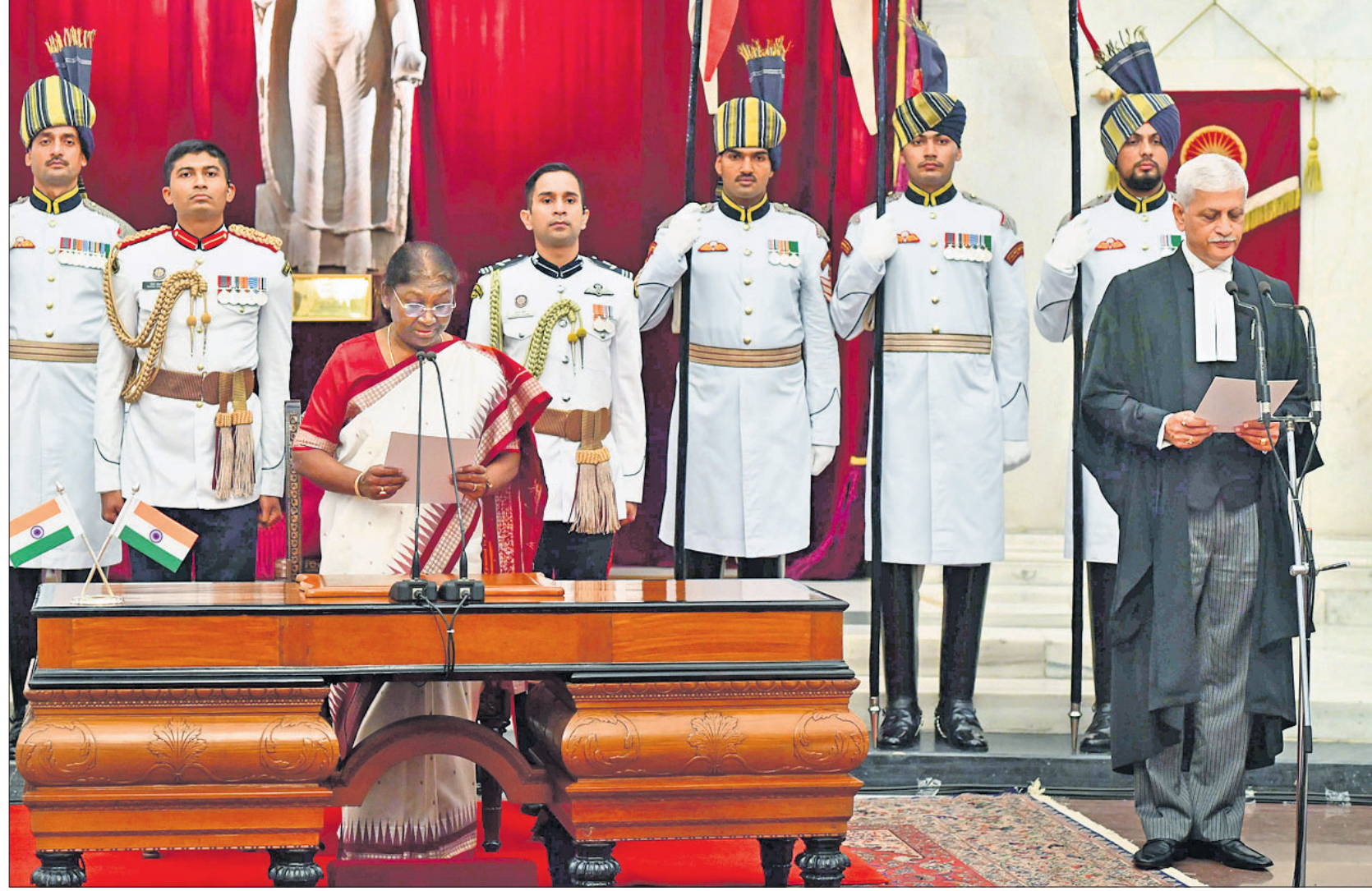
ରାଷ୍ଟ୍ରପତି ଭବନରେ ଶନିବାର ୪୯ତମ ପ୍ରଧାନ ବିଚାରପତି କୃଷ୍ଣସିଂହ ଉପେଶ ଲଲିତଙ୍କୁ ପଦ ଓ ଗୋପନୀୟତାର ଶପଥପାଠ କରାଇଛନ୍ତି ରାଷ୍ଟ୍ରପତି କ୍ରେତୀପତା ମୁର୍ମୁ।