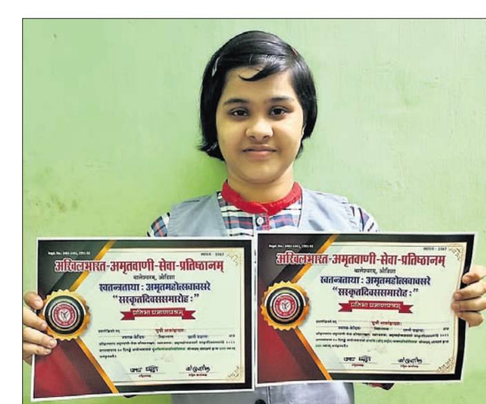
ଆକାଂକ୍ଷା ପାଇଥିବା ସାର୍ବଭାରତୀୟ ପ୍ରତିଯୋଗିତାରେ ଆକାଂକ୍ଷା ପ୍ରଥମ ହୋଇଥିବା ଦର୍ଶନୀକାଙ୍କର ଫୋଟୋ।

ଓ ସର୍ବଭାରତୀୟ ସ୍ତରରୁ ବହୁ ଅତିଥି ଆକାଂକ୍ଷା ପ୍ରମାଣ ପତ୍ର ସହିତ ଅନୁରୋଧକୁ ଧରି ପ୍ରଥମ ଆକାଂକ୍ଷା ବେଦାନ୍ତାଗ୍ରାହ୍ୟ ଆଦି ଅବହେଳିତ ନ ଚଳାଇ ଭାଷଣ ପ୍ରଦାନ କରି ସମସ୍ତଙ୍କୁ କର୍ତ୍ତବ୍ୟ କରିଥିଲେ । ଅତିଥିମାନେ ଆକାଂକ୍ଷାଙ୍କୁ ପ୍ରମାଣ ପତ୍ର ସହିତ ପୁରସ୍କୃତ କରିଥିବା ବେଳେ ସମାଜରେ ସଂସ୍କୃତ ଶ୍ଳୋକ ଆଦୃତି କରିବା ସହ ବିଦ୍ୟାଳୟ ପ୍ରମାଣ ପ୍ରଦାନ କରି ସମସ୍ତଙ୍କୁ କର୍ତ୍ତବ୍ୟ କରିଥିଲେ ।