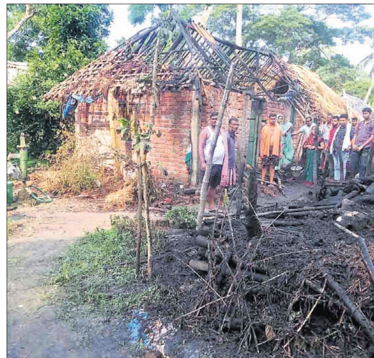
ପୋଡ଼ିଯାଇଥିବା ଘର ।

ବନ୍ୟାରେ କୁଳଙ୍ଗ ବ୍ଲକ୍‌ର ୧୦୦ ଉର୍ଦ୍ଧ୍ୱ ପଞ୍ଚାୟତର ୨୦ ହଜାରରୁ ଉର୍ଦ୍ଧ୍ୱ ଲୋକ ପ୍ରତିଦ୍ୱାର ହୋଇଛନ୍ତି । ସେମାନଙ୍କୁ ପାରାଦୀପର ସମସ୍ତ ଛୋଟବଡ଼ ଶିଳ୍ପ ସଂସ୍ଥାମାନେ ସହଯୋଗର ହାତ ବଢ଼ାଇ ଦେବାକୁ ନବନିର୍ମାଣ କୃଷକ ସଙ୍ଗଠନର କୁଳଙ୍ଗ ଶାଖା ପକ୍ଷରୁ ସହାୟତା ନିବେଦନ କରାଯାଇଛି । କ୍ଷତିଗ୍ରସ୍ତ ଚାଷୀଙ୍କୁ ମାଗଣାରେ ଖାଦ୍ୟ, ବସ୍ତ୍ର ଓ ଦିହନ ସାମଗ୍ରୀ ଛାତ୍ରୀଛାତ୍ରୀଙ୍କ ନିମନ୍ତେ ପାଠ୍ୟପୁସ୍ତକର ଯୋଗାଇ ଦେବାକୁ ନବନିର୍ମାଣ କୃଷକ ସଙ୍ଗଠନର କୁଳଙ୍ଗ ଶାଖା ପକ୍ଷରୁ ସହାୟତା ନିବେଦନ କରାଯାଇଛି । କ୍ଷତିଗ୍ରସ୍ତ ଚାଷୀଙ୍କୁ ମାଗଣାରେ ଖାଦ୍ୟ, ବସ୍ତ୍ର ଓ ଦିହନ ସାମଗ୍ରୀ ଛାତ୍ରୀଛାତ୍ରୀଙ୍କ ନିମନ୍ତେ ପାଠ୍ୟପୁସ୍ତକର ଯୋଗାଇ ଦେବାକୁ ନବନିର୍ମାଣ କୃଷକ ସଙ୍ଗଠନର କୁଳଙ୍ଗ ଶାଖା ପକ୍ଷରୁ ସହାୟତା ନିବେଦନ କରାଯାଇଛି ।