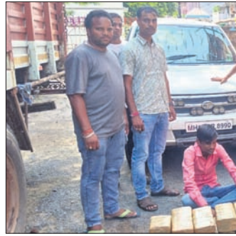
ଗିରଫ ଅଭିଯୁକ୍ତଙ୍କ ସହ ଜବତ ଗଞ୍ଜେଇ ପ୍ୟାକେଟ୍ ।