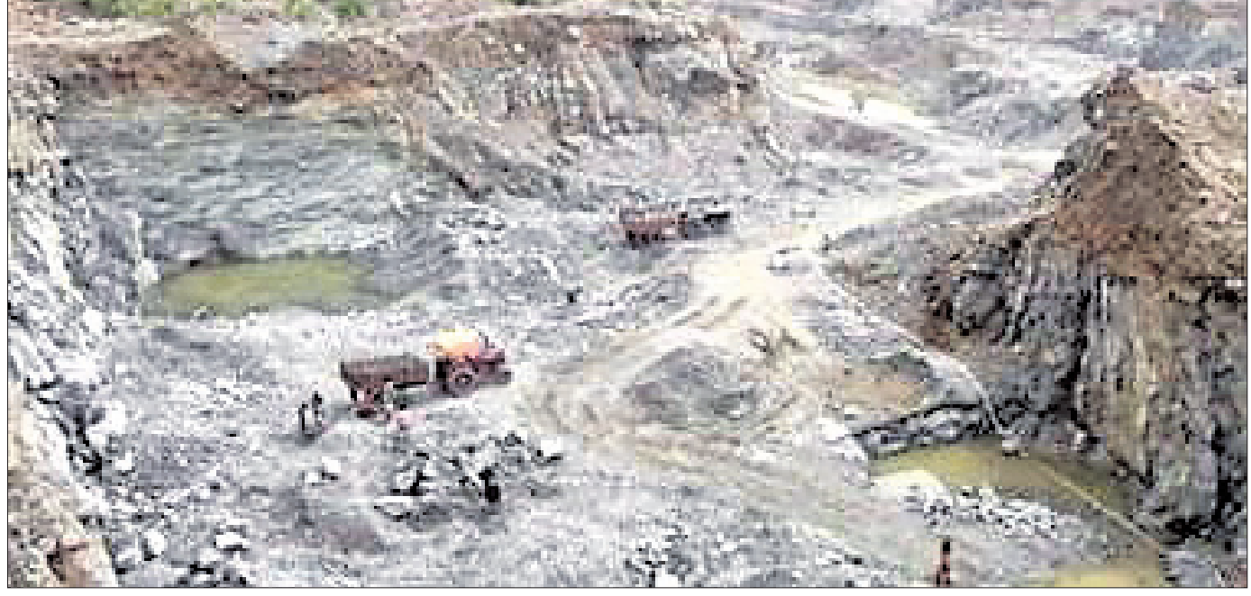
ନୟାଗଡ଼ ଅଞ୍ଚଳରେ ଥିବା ପଥର ଖାଦାନ।

ନୟାଗଡ଼ ଜିଲ୍ଲାରେ ପଥର ଓ ବାଲିଖାଦାନ ବେଆଇନ ଭାବେ ଚାଲୁଥିବାରୁ ଅଣ ପଞ୍ଜୀକୃତ ଶ୍ରମିକମାନଙ୍କୁ ନେଇ କାମ କରାଯାଉଛି । ଅଣ ସଙ୍ଗଠିତ ଶ୍ରମିକ ଓ ସେମାନଙ୍କ ପରିବାର ସରକାରୀ ଯୋଜନାର ସହାୟତା ପାଇ ନ ପାରି ଚୁଖି କଷ୍ଟରେ ଦିନ କାଟୁଛନ୍ତି । ବିଭିନ୍ନ କ୍ଷେତ୍ରରେ କାର୍ଯ୍ୟରେ ଶ୍ରମିକ ନିଯୁକ୍ତି ସର୍ଭାବନାକୁ ନିୟନ୍ତ୍ରଣ କରିବା ଓ ସେମାନଙ୍କ ସାମାଜିକ ନିରାପଣା ନିମନ୍ତେ ଅଣ ସଙ୍ଗଠିତ ଶ୍ରମିକ ଆଇନ ରହିଛି । ହେଲେ ଅଣସଙ୍ଗଠିତ ଶ୍ରମିକ ଓ ସେମାନଙ୍କ ଉପରେ ନିର୍ଦ୍ଦେଶାଳିତ ସାମାଜିକ ନିରାପଣା ନିଜୁଟି ବୋଲି ଅଭିଯୋଗ ହୋଇ ଆସୁଛି । ବେଆଇନ ଖଣି ଓ ଖାଦାନକୁ ଲୁଚାଇବାକୁ ଯାଇ ନୟାଗଡ଼ ଜିଲ୍ଲାରେ ଶ୍ରମିକଙ୍କ ମୃତ୍ୟୁ ଭିନ୍ନ ଦର୍ଶାଯାଉଛି । ମୃତ୍ୟୁର କାରଣ ବଦଳି ଯାଉଥିବାରୁ ମୃତ ଶ୍ରମିକଙ୍କ ପରିବାର ଅଣସଙ୍ଗଠିତ ଶ୍ରମିକ ଆଇନର ପରିସର ଛୁଇଁ ହୋଇ ପାରୁ ନାହାନ୍ତି । ଏହାପରେ ବି ଜିଲ୍ଲାରେ ଆବଶ୍ୟକ ସତ୍ତେତନତା ସୃଷ୍ଟି ହେଉ ନାହିଁ । ପ୍ରକାଶ ଯେ, ଖଣି ମନ୍ତ୍ରଣାଳୟ ପକ୍ଷରୁ ଅଣ ସଙ୍ଗଠିତ ଶ୍ରମିକମାନଙ୍କୁ ବୁଦ୍ଧି, ନିୟନ୍ତ୍ରଣ ପ୍ରକାର, ବିଶେଷ ଭାବେ ରାଗାବ ଶ୍ରେଣୀ ଓ ଚାକିରିଆ ଶ୍ରେଣୀ ଆଦି ୪ ଭାଗରେ ବିଭକ୍ତ କରାଯାଇଛି । ଏହି ବର୍ଗର ଶ୍ରମିକମାନଙ୍କ ପାଇଁ ସରକାର ଅନେକ ଯୋଜନା କରିଛନ୍ତି। ହେଲେ