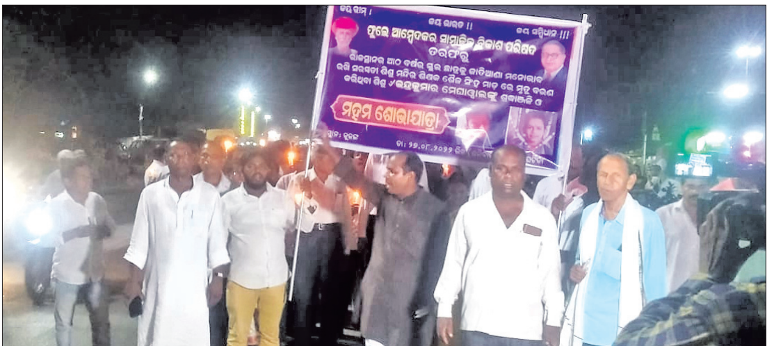
ପୁଲେ ଆୟେଦକର ସାମାଜିକ ବିକାଶ ପରିଷଦ ପକ୍ଷରୁ ମହମବତି ଶୋଭାଯାତ୍ରା କରାଯାଇଛି ।