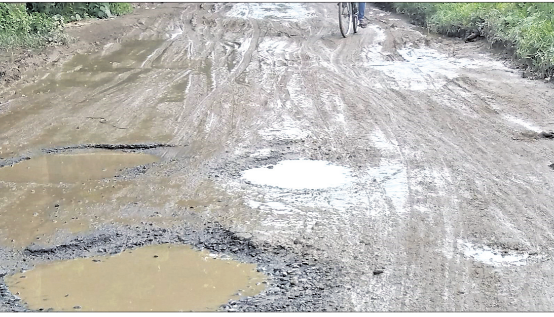
ପଟାମୁଣ୍ଡାଳ- ରାଜନଗର ଉତ୍ତରକଣ୍ଠା ଯେଉଁ ବନ୍ଧ ପୁରୁଣା ରାସ୍ତା ଖାଲଖମାରେ ଭର୍ତ୍ତି।

ପଟାମୁଣ୍ଡାଳ ବାଜପାଞ୍ଚ ପାଖରୁ ବାହାରିଥିବା ପଟାମୁଣ୍ଡାଳ-ରାଜନଗର ଉତ୍ତରକଣ୍ଠା ଯେଉଁ ବନ୍ଧ ପୁରୁଣା ରାସ୍ତା ଗୁରୁତ୍ୱ ବହନ କରେ। ଏହି ରାସ୍ତାର ମରାମତି ନାମରେ ବାରମ୍ବାର ବିପୁଳ ଅର୍ଥ ଖର୍ଚ୍ଚ ହୋଇସାରିଲାଣି।