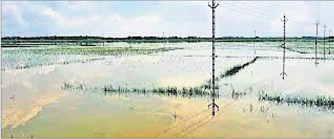
ପାଣିରେ ବୁଡ଼ି ରହିଥିବା ବାସକମି ।