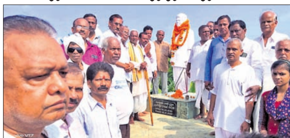
ଅତିଥିମାନେ ବୈଷ୍ଣବଙ୍କ ପ୍ରତିମୂର୍ତ୍ତିରେ ମାଲ୍ୟାପର୍ଣ୍ଣ କରୁଛନ୍ତି।