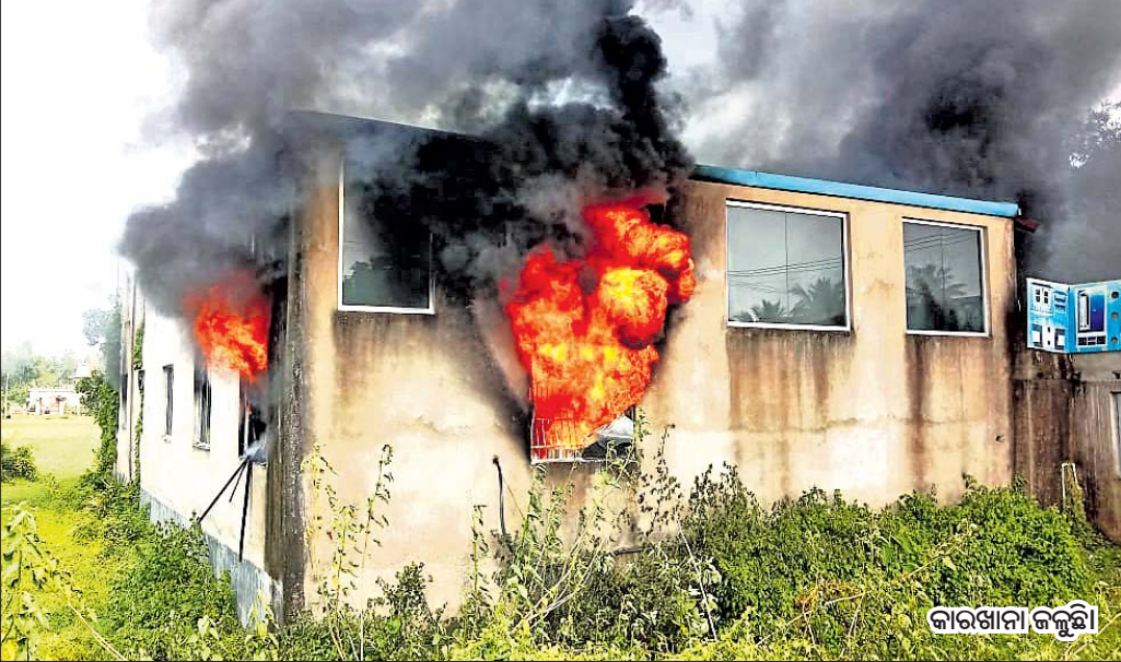
ବାସୁଦେବପୁର, ୨୭।୮ (ଡି.ଏନ.ଏ.)