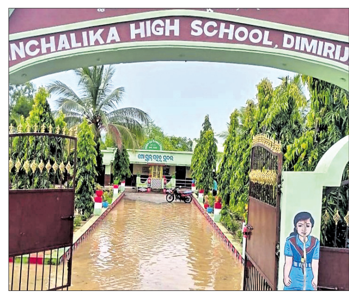
ସ୍କୁଲ ଗେଟ ନିକଟରେ ପାଣି ଜମିଛି । ଅସରାଏ ବର୍ଷା ହେଲେ ସ୍କୁଲ ପରିସରରେ ଆଶୁଏ ପାଣି ଜମି ରହିଛି ।