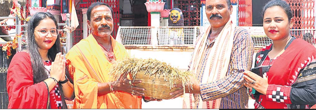
ସମଲେଇ ମନ୍ଦିର ମୁଖ୍ୟ ପୂଜକ ନୂଆ ଧାନ ଗ୍ରହଣ କରୁଛନ୍ତି।