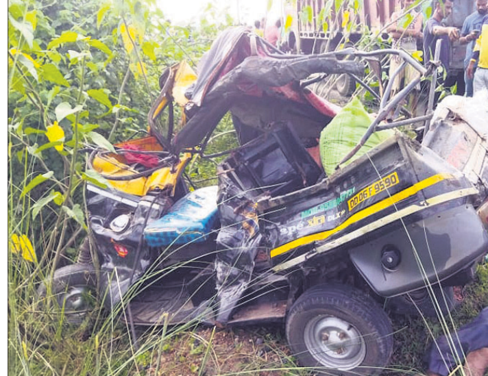
ବୁର୍ଯ୍ୟଗଣରେ ଅଟୋରିକ୍ସା ଟ୍ରକ୍‌ମାର୍ ହୋଇଯାଇଛି।

କାମାକ୍ଷାନଗର, ୨୮୮୮(ଡି.ଏ.ଏ.ଏ.) ଭୋରୁରୁ ମହୁଳ ଫଳ (ଟୋଲ) ପେଡ଼ାକରା ଲାଗି ବାହାରିଥିଲେ ଘଟଣାକୁ ହେଲେ ଏହି ଯାତ୍ରା ଯେ ସେମାନଙ୍କ ପାଇଁ ଶେଷଯାତ୍ରା ପାଲଟିଯିବ ଏ କଥା ଜାଣି ନ ଥିଲେ ସେମାନେ। ଲକ୍ଷ୍ୟଭୁକ୍ତ ମାତ୍ର ଗୋଟିଏ କିଲୋମିଟର ପୂର୍ବରୁ ମୃତ୍ୟୁ ବାବଦ ପରି ମାଡ଼ିଆସିଲା କୋଇଲା ବୋହେଇ ଟ୍ରକ୍। ■ ଏନ୍‌ଏଚ୍ ୫୩ରେ ଛାତିଧରା ବୁର୍ଯ୍ୟଗଣ ■ କାମାକ୍ଷାନଗରର ବାଲୁରା ଗ୍ରାମ ପ୍ରକ୍ଷ ■ ମୃତକଙ୍କ ମଧ୍ୟରେ ପରିବାରର ୩ ■ ଅଧୀରେ ରହିଲା ଟୋଲ ପେଡ଼ା ■ ମୁଖ୍ୟମନ୍ତ୍ରୀ ଘୋଷଣା କଲେ କ୍ଷତିପୂରଣ ଏବଂ ଏଥିରେ ଅକାଳରେ ଲିଙ୍ଗିଗଲା ୫ ଜୀବନ ଦାପ। ତେଜାନାଳ ଜିଲାର କାମାକ୍ଷାନଗର ଥାନା ଅଧୀନ କାଟାୟ ରାଜପଥ ୫୩ରେ ପଥରଖମ୍ବ ଛକ ନିକଟରେ ରବିବାର ଘଟଣା ଏଭଳି ଏକ ହୃଦୟ ବିଚାରକ ବୃଦ୍ଧିଗଣ। ସମସ୍ତ ମୃତକଙ୍କ ଘର ବାଲୁରା ଗ୍ରାମରେ ହୋଇଥିବାବେଳେ ସେମାନଙ୍କ ମଧ୍ୟରେ ଅଧିକ ଗୋଟିଏ ପରିବାରର ବାପପୁଅଙ୍କ ସମେତ ୩ ଜଣ। ଏଭଳି ଦୁଃଖ ଘଟଣାରେ ପ୍ରକ୍ଷ ପାଳିଯାଇଛି ସମଗ୍ର ଗାଁ। ମୃତକଙ୍କ ସମ୍ପର୍କୀୟଙ୍କ ବୁଦ୍ଧପତ୍ନୀ ଚିତ୍କାର ପରିବେଶକୁ ଭାବଗର୍ଭୀର କରିଦେଇଥିବାବେଳେ ଗାଁ ଶୁଖାନରେ ଜଳିଛି ସମସ୍ତଙ୍କୁ ଜୁଳା। ବୁର୍ଯ୍ୟଗଣକୁ ନେଇ ମୁଖ୍ୟମନ୍ତ୍ରୀ ନବୀନ ପଟ୍ଟନାୟକ, କେନ୍ଦ୍ରମନ୍ତ୍ରୀ ଧର୍ମେନ୍ଦ୍ର ପ୍ରଧାନ, ଖଣି ମନ୍ତ୍ରୀ ତଥା ସ୍ଥାନୀୟ ବିଧାୟକ ଟ୍ରଷ୍ଟି-୪