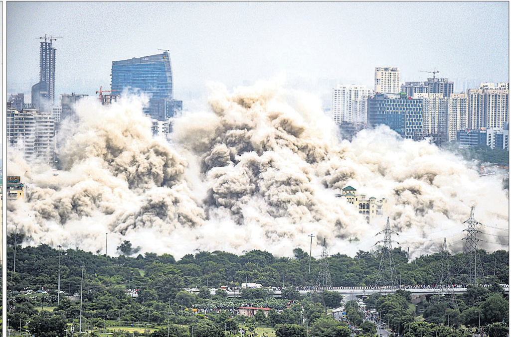
ଧରାଣୀୟା ସୁପରଟେକ୍ ଅଟାଳିକା।