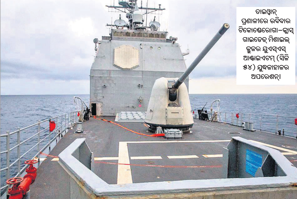
ତାଲୁଘାନ୍ ପ୍ରଶାଳୀରେ ରବିବାର ଟିକୋହୋଗୋ-କ୍ଲ୍ୟାସ୍ ଗାଇଡେଡ୍ ମିସାଇଲ୍ କୁଳର ସୁସ୍ୱୟଂ ଆଖାଇଏଟ୍ (ସିଜି ୫୪) ମୁକ୍ତାହାର ଅପରେଶନ୍।

ଏହି ଆମେରିକୀୟ ଖୋଲା ଚ୍ୟାଲେଞ୍ଜ କରିଥିଲା। ସମୁଦ୍ରରେ ମୁକ୍ତାହାର ପୁରସ୍କାର କରିବା ସହ ମୋଡ଼ିଆନ୍ ଲାଲନ୍ ବା ମଧ୍ୟବର୍ତ୍ତୀ ସାମାଜିକ ପିଏଲଏର ମୁକ୍ତାହାର ଅତିକ୍ରମ କରିଥିଲା। ସମବାଚ୍ୟାସ ବେଳେ କେତେକ ଦୂରଗାମୀ କ୍ଷେପଣାସ୍ତ୍ର ମଧ୍ୟ ପରୀକ୍ଷଣ କରିଥିଲା, ଯାହାକୁ ତାଲୁଘାନ୍ ନିଜ ପ୍ରତି ବିପଦ ବୋଲି ଦର୍ଶାଇଥିଲା। ଏହାର ମାତ୍ର ନ ବିକୃତ ଆମେରିକା ନୌସେନାର ଟିକୋହୋଗୋ-କ୍ଲ୍ୟାସ୍ ଗାଇଡେଡ୍ ମିସାଇଲ୍ କୁଳର ସୁସ୍ୱୟଂ ଆଖାଇଏଟ୍ (ସିଜି ୫୪) ମୁକ୍ତାହାର ତାଲୁଘାନ୍ ପ୍ରଶାଳୀରେ ଅପରେଶନ୍ ଆରମ୍ଭ କରିଛି। ତେବେ ଏହାକୁ ଆମେରିକା ନୌସେନା ସପ୍ତମ ଦିନ ଏକ 'ଟୁଟିନ୍ ମିଶନ୍' ବୋଲି ଅଭିହିତ କରିଛି। ଅନ୍ତର୍ଜାତୀୟ ଜଳରାଶି ଉପରେ ଏହି ମୁକ୍ତାହାର ବୃନ୍ଦର ପ୍ରବେଶ ଏକ ମୁକ୍ତ ଓ ଖୋଲା ଭାରତ-ପ୍ରଶାଳ