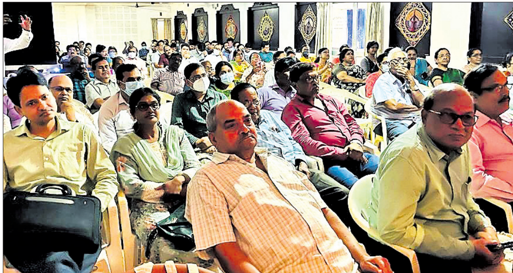
ଆଲୋଚନା ଚକ୍ରରେ ଉପସ୍ଥିତ ତାଙ୍କର ଓ ଅନ୍ୟମାନେ।