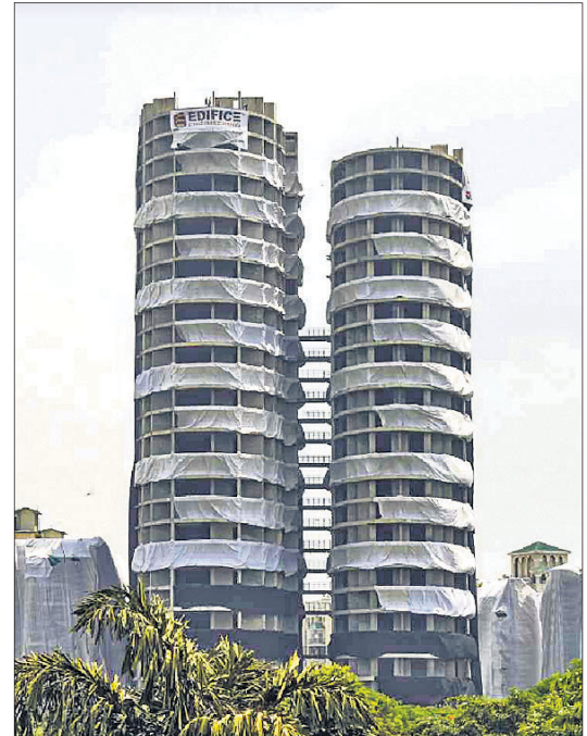
ଭଙ୍ଗାଯିବା ପୂର୍ବରୁ ନୋଏଡ଼ାସ୍ଥିତ ଚୁଇନ୍ ଟାଉର।