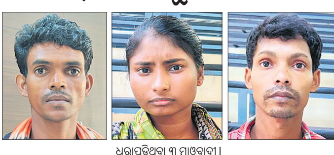
ଧରାପଡ଼ିଥିବା ୩ ମାଓବାଦୀ।

ପହାରାଷ୍ଟ୍ର ଗଡ଼ଚିରୋଲି ପୋଲିସ ହାତରେ ଧରା ପଡ଼ିଛନ୍ତି ୩ ଜଣ ଦୁର୍ଦ୍ଦଶ ମାଓବାଦୀ। ମହାରାଷ୍ଟ୍ର ସାମାଜିକ କୋୟାମ୍ବର ଜଙ୍ଗଲରେ ଶନିବାର ସିଆରପିଏମ୍-୬୦୦୪ର ପକ୍ଷରୁ ମିଳିତ କୋର୍ଡ଼ ଅପରେଶନ ଚାଲିଥିବା ବେଳେ ମାଓବାଦୀଙ୍କ ସହ ଯବାନ ମୁହାଁମୁହିଁ ହୋଇଥିଲେ। ଦୁଇ ଘଣ୍ଟାରୁ ଅଧିକ ସମୟ ଧରି ଉଭୟ ପକ୍ଷର ମଧ୍ୟରେ ଗୁଳି