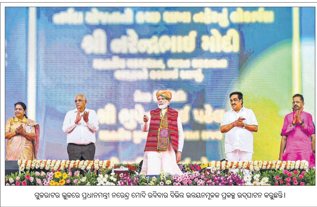
ଗୁଜରାଟର ଭୁଜରେ ପ୍ରଧାନମନ୍ତ୍ରୀ ନରେନ୍ଦ୍ର ମୋଦି ରବିବାର ବିଭିନ୍ନ ଉନ୍ନୟନମୂଳକ ପ୍ରକଳ୍ପ ଉଦ୍‌ଘାଟନ କରୁଛନ୍ତି।

କଂଗ୍ରେସ କରିଥିବା ସମସ୍ତ ଆଇନ ଓ ଯୋଜନାକୁ ଅଣଦେଖା କରାଯାଉଥିବା ବେଳେ ବର୍ତ୍ତମାନ ଆମକୁ ଏ କ୍ଷେତ୍ରରେ ସଂଗ୍ରାମ କରିବାକୁ ପଡ଼ିବ ବୋଲି ସେ କହିଛନ୍ତି। ଦରକାର ଆକାଶକୁ ଛୋଇଥିବା ବେଳେ ଚେରୋଜଗାରା ମହାମାରୀରୂପ ନେଉଛି। ଫଳରେ ଏମାନଙ୍କ ଜୀବନ ଦୁର୍ବିଷୟ ହୋଇପଡ଼ିଛି। ସେପ୍ଟେମ୍ବର ୪ ମହଙ୍ଗାଲ ବିରୋଧରେ ଦିଲ୍ଲୀ ଚଳେ ଆଭିଯାନକୁ ସଫଳ କରିବା ପାଇଁ ଆହ୍ୱାନ ଦେଇଛନ୍ତି। ତେଣୁ ଆଗାମୀ ଦିନରେ କଂଗ୍ରେସ ହିଁ ଏକମାତ୍ର ବିକଳ୍ପ ବୋଲି ତାଙ୍କ ଖଚିତ୍ତା ରାଜ୍ୟରେ ନିର୍ବାଚନ ଏବଂ କେନ୍ଦ୍ରରେ ମୋଦି ନିଶ୍ଚିତ କରିବା ପାଇଁ ବିଗତ ଦିନରେ