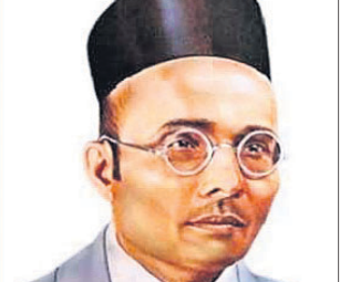
ବୋଲି ସେଥିରେ ଲେଖାଅଛି। ସପରି କି ସାବରକର ରହିଥିବା ଜେଲ ପ୍ରକୋଷ୍ଠରେ