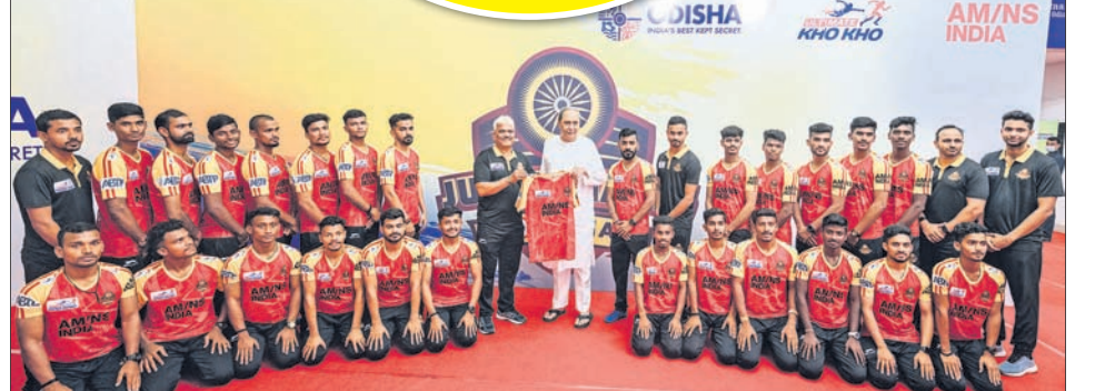
ଓଡ଼ିଶା ଜଗରନପୁ ବକର ଜର୍ସି ଉନ୍ମୋଚନ ଅବସରରେ ମୁଖ୍ୟମନ୍ତ୍ରୀ ନବୀନ ପଟ୍ଟନାୟକ।

ରହିଛି ଓଡ଼ିଶା ଜଗରନପୁ। ମୁଖ୍ୟମନ୍ତ୍ରୀ ନବୀନ ପଟ୍ଟନାୟକଙ୍କ 'ଶୋର୍ଟ୍ ଫର ଯୁଥ୍, ଯୁଥ୍ ଫର ଫୁଟ୍ବର' ଦୃଷ୍ଟିଭଙ୍ଗା ଓଡ଼ିଶାକୁ ଏକ କ୍ରୀଡ଼ା ହବ୍ରେ ପରିଣତ କରିଛି। ଫଳରେ ଦେଶ ବିଦେଶ କ୍ରୀଡ଼ା ସମ୍ପ୍ରଦାୟ ନଜର ଏବେ ଓଡ଼ିଶା ଉପରେ। ୨୦୧୮ରେ ଓଡ଼ିଶା ହକି ବିଶ୍ୱକପ୍ ଆୟୋଜନ କରି ଅନେକ ପ୍ରଶଂସା ସାଧନ କରିଥିଲା। ଏହା ଅନ୍ୟ ସମସ୍ତ ହକି ବିଶ୍ୱକପ୍ଠାରୁ ନିଆରା ହୋଇଥିଲା। କେବଳ ସେତିକି ନୁହେଁ, ମାତ୍ର ୩୩ମସିଖା ଲକ୍ଷ୍ମଣ ଗ୍ରହଣ କରି ଓଡ଼ିଶା ୨୦୧୭ରେ ଏସିଆନ୍ ଆଥଲେଟିକ୍ସ ଚାମିୟନସ୍ଥିତକୁ ଅତ୍ୟନ୍ତ ସଫଳତାର ସହ ଆୟୋଜନ କରିଥିଲା। ଏହା ବ୍ୟତୀତ ୨୦୧୫ ହକି ଚାମିୟନସ୍ ଟ୍ରଫି, ୨୦୧୮-୧୯ ହକି ଓଲିମ୍ପିକ୍ସ ଫାଇନାଲ୍ସ