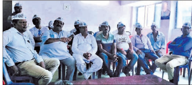
ବୈଠକରେ ଯୋଗ ଦେଇଥିବା ଦଳୀୟ କର୍ମକର୍ତ୍ତା।

ଆମ୍ ଆଦମୀ ପାର୍ଟି (ଆପ୍) ପକ୍ଷରୁ ରବିବାର ଗୋଲାପଲୀ ସାହି ସ୍ଥିତ ଜିଲ୍ଲା କାର୍ଯ୍ୟକ୍ରମରେ ଏକ ସାଙ୍ଗଠିକ ବୈଠକ ଅନୁଷ୍ଠିତ ହୋଇଥିଲା।