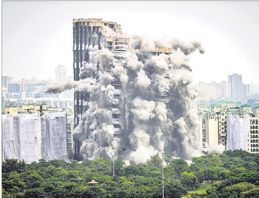
ଚୁଇନ୍ ଟାଉରରେ ବିଘୋରଣ ବେଳର ଦୃଶ୍ୟ।