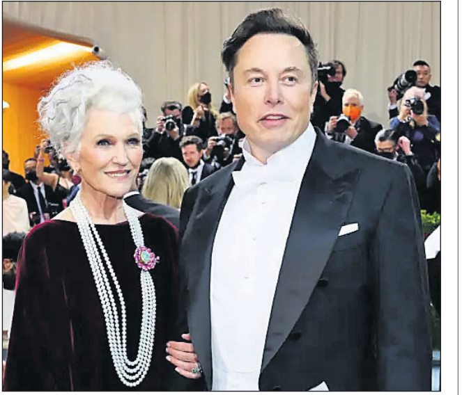
ମା' ମାୟେ ମଧ୍ୟକ୍ ସହ ଏଲନ୍ ମଧ୍ୟ। ଓଷ୍ଟିନ୍, ୨୮

ବିଲିୟନେୟାର ପୁଅ ଏଲନ୍ ମଧ୍ୟକ୍ ଦେଖାକରିବାକୁ ଚେଷ୍ଟା ଆସିବା ବେଳେ ମା' ମାୟେ ମଧ୍ୟ ଗ୍ୟାରେଜରେ ଶୁଅନ୍ତି। ଏ ନେଇ ୭୪ ବର୍ଷୀୟା ମାୟେ ତ୍ରିତେକର ଏକ ଗଣମାଧ୍ୟମକୁ ସାକ୍ଷାତକାର ଦେଇ କହିଛନ୍ତି। ମତେଲ ତଥା ସାମାଜିକକର୍ମୀ ମାୟେ କହିଛନ୍ତି, ମଧ୍ୟ ସମ୍ପତ୍ତିକୁ ସେତେ ଆଗ୍ରହ ଦେଖାନ୍ତି ନାହିଁ। ମାୟେ କ୍ଷେପଣକୁ ପୂର୍ଣ୍ଣାଲୟ ଥିବା ବେଳାକୁ ସେତେବେଳେ ତାଙ୍କ ଶୋଇବା ବ୍ୟବସ୍ଥା ଏକ ଗ୍ୟାରେଜରେ ହୋଇଥିଲା। କାରଣ ରକେଟ୍