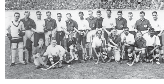
୧୯୨୮ ଅଲିମ୍ପିକ୍ସରେ ସର୍ବ୍ ବିଜୟୀ ଭାରତୀୟ ହକି ଦଳ।

ଧ୍ୟାନ ଚାନ୍ଦ ପାଇଁ ଚୟନ କରାଗଲା। ଏହି ସମୟରେ ଭାରତର ହକି ଖେଳର ପ୍ରଚାର ପ୍ରସାର ଆରମ୍ଭ ହୋଇ ଯାଇଥାଏ ଏବଂ ଭାରତୀୟ ହକି ଫେଡେରେଶନ୍ (ଆଇଏଏଏସ୍) ମଧ୍ୟ ଗଠିତ ହୋଇ ସାରିଥାଏ। ସେମାନେ ପାଇଁ ଗୋଟିଏ ହକି ଦଳ ପ୍ରସ୍ତୁତ କରି ସର୍ବ୍ ପଦକ ହାସଲ କରିଥିଲେ। ତେଣୁ ଗୋଟିଏ ୨୨ ଜଣ ଖେଳାଳି ଆମ୍ଷ୍ଟରଡାମ୍ରେ ଅଂଶ ଗ୍ରହଣ କରିଥିଲେ। ହକି ଯାତ୍ରାରେ ଧ୍ୟାନ ଚାନ୍ଦ ନିଜ ନିୟନ୍ତ୍ରଣରେ ରଖି ପ୍ରତିଯୁଗ ଦଳକୁ ପରାଜୟ ଆଡ଼କୁ ଠେଲିଦେବାର କଳା କ୍ରୀଡ଼ାରେ ଆୟୋଜକ ପାଇଁ ପ୍ରଦେଶ ଉନ୍ନତ ହୋଇ ଉନ୍ନତ କରିବା ଏବଂ ଜାତୀୟ କ୍ରୀଡ଼ାକୁ ମନୋନୀତ ଖେଳାଳିମାନଙ୍କୁ ଗ୍ରାଣ୍ଡମାଷ୍ଟର ଅଲିମ୍ପିକ୍ସ ପାଇଁ ପ୍ରସ୍ତୁତ କରି ପ୍ରୋତ୍ସା କରିବା। ଏହି କାରଣରୁ ୧୯୨୮ରେ ଆଥଲେଟିକ୍ ଜାତୀୟ କ୍ରୀଡ଼ାରେ ୬୭ଜଣ ଆଥଲେଟିକ୍ସ ପଦକର୍ତ୍ତା (୧୯୨୮ ଆମ୍ଷ୍ଟରଡାମ୍) ଅଲିମ୍ପିକ୍ସରେ