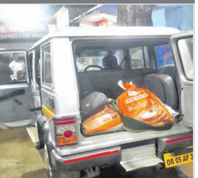
ଆଲୋଚନାର ବିଷୟ ପାଇଛି।

ଆଲୋଚନାର ବିଷୟ ପାଇଛି। କଟକ ଜିଲା ଆଠଗଡ଼ ଅଞ୍ଚଳରୁ ଏକ ବୋଲେରୋ (ନଂ. ଓଆର୍ ୦୫ ଏଏସ୍ ୩୯୫୫)ରେ ଗିଫିଆ ବେଲ ଯାଜପୁରକୁ ଚୋରା ମାଦ ତାଲାଣ କରାଯାଉଥିବା କୌଣସି ସୂତ୍ରରୁ ଟାଉନ ଥାନା ପୋଲିସ୍‌କୁ