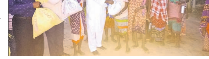
ବନ୍ୟା ବିପନ୍ନଙ୍କୁ ଚିଲିଫ ପ୍ରଦାନ କରାଯାଇଛି।

କର୍ଣ୍ଣାଟ-ଗୋଡ଼ିବନ୍ଧ ରାସ୍ତା ଅବସ୍ଥା ଶୋଚନୀୟ ହୋଇପଡ଼ିଛି। ବ୍ଲକ୍ ୨୬ଟି ପଞ୍ଚାୟତ ଉଚ୍ଚ ରାସ୍ତା ଉପରେ ନିର୍ଦ୍ଦେଶିତ। ଜାତୀୟ ରାଜପଥ ୫୩ର ଏହା ଅଂଶ ବିଶେଷ। କିନ୍ତୁ ଭିତ୍ତିରେ ତଳତଳ ଦ୍ଵାରା ହରିହରପଡା ପଞ୍ଚାୟତର ୧୪ଟି ଗ୍ରାମର କଳସାଧାରଣ ଅବସ୍ଥାରେ ସମ୍ପୂର୍ଣ୍ଣ ହେଉଛି। ଏ ନେଇ ପୂର୍ବରୁ ପ୍ରଶ୍ନାସନ ଓ ଖଣି କମିଶନରୁ ଅବଗତ କରାଯାଇଥିଲେ ମଧ୍ୟ ପଦକ୍ଷେପ ନିଆଯାଇ ନାହିଁ। ଫଳରେ ଆସନ୍ତା ୫ ବର୍ଷରୁ ଆୟୋଜନ କରାଯିବ ବୋଲି ପବିତ୍ରନଗର ମଣ୍ଡଳ ଭାଙ୍ଗିବା ପକ୍ଷରୁ ଆୟୋଜନ କରାଯାଇଛି।