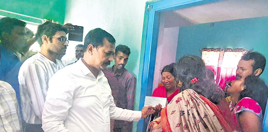
ମୃତକଙ୍କ ପରିବାରକୁ ଭେଟି ଜିଲାପାଳ ଭେଟି ରେଡକ୍ରସ୍ ସହାୟତା ପ୍ରଦାନ କରୁଛନ୍ତି।