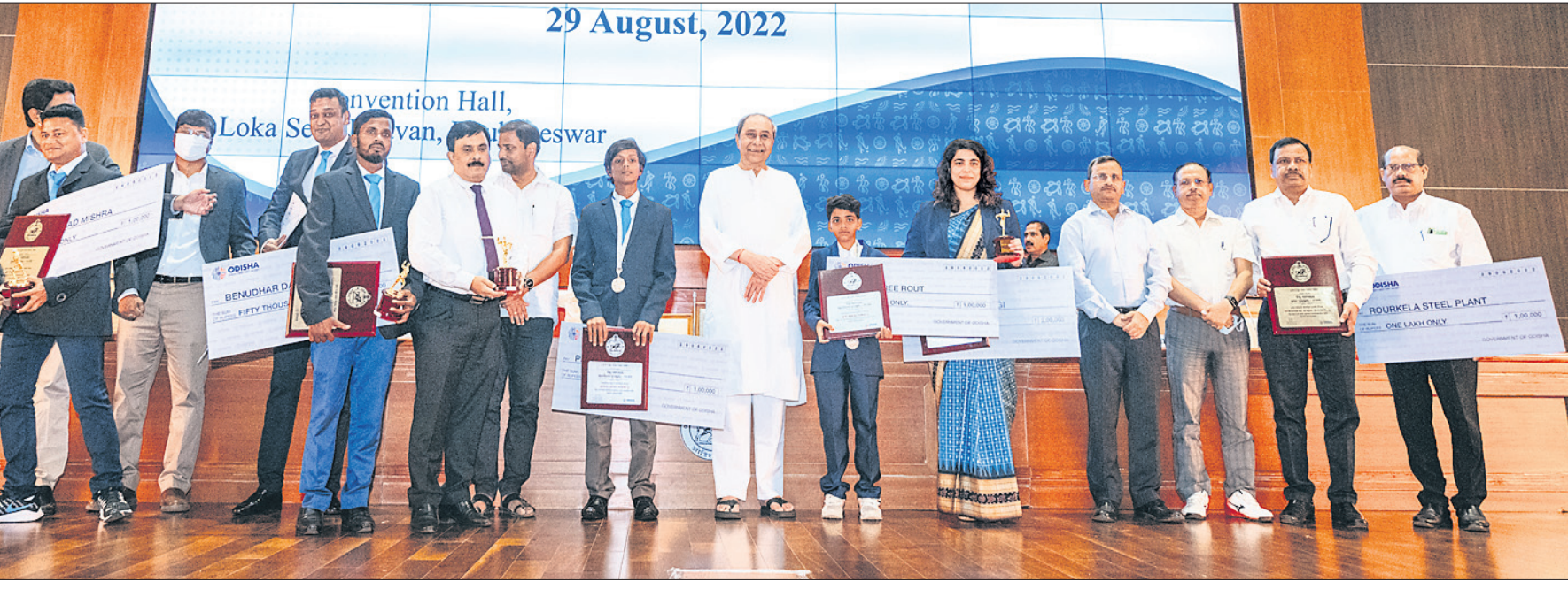
ପୁରସ୍କୃତ କ୍ରୀଡ଼ାବିତ୍ତ୍ୱ ରାଜ୍ୟରେ ପୁଷ୍ୟମନ୍ତ୍ରୀ ନବୀନ ପଟ୍ଟନାୟକ ଓ ଅନ୍ୟ ଅତିଥି।

ଭୁବନେଶ୍ୱର, ୨୯।୮ (କ୍ରୀଡ଼ା ପ୍ରତିନିଧି) କ୍ରୀଡ଼ା ଦିବସ ଅବସରରେ ସୋମବାର ପୁଷ୍ୟମନ୍ତ୍ରୀ ନବୀନ ପଟ୍ଟନାୟକ ରାଜ୍ୟର ସର୍ବୋଚ୍ଚ ବିଜୁ ପଟ୍ଟନାୟକ କ୍ରୀଡ଼ା ପୁରସ୍କାର ପ୍ରଦାନ କରିଛନ୍ତି।