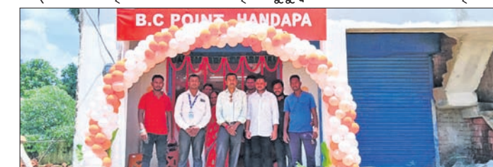
ଗ୍ରାହକ ସେବା କେନ୍ଦ୍ର ଉଦ୍ଘାଟନ ଅବସରରେ ଅତିଥିମାନେ।

କିଶୋରନଗର ବ୍ଲକ୍ ହଷ୍ଟପାଠାରେ ସୋମବାର ବ୍ୟାଙ୍କ ଅଫ୍ ବରୋଦାର ଗ୍ରାହକ ସେବା କେନ୍ଦ୍ର ଉଦ୍ଘାଟିତ ହୋଇଯାଇଛି। ପୁଖ୍ୟ ଅତିଥି ଭାବରେ ପରିଚାଳନା କରିବା ସହ ସମସ୍ତ ଲବ୍ଧ ବାସ ଯୋଗଦେଇ ଏହାକୁ ଉଦ୍ଘାଟନ କରିଥିଲେ। ଅନନ୍ତମ୍ଭ ଅତିଥି ଭାବରେ ବିଧିଯୋଗ କରିଥିଲେ।