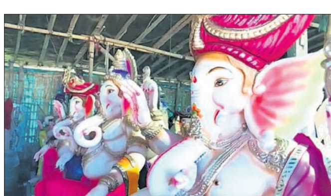
ଚାଳଚେର, ୨୯/୮ (ଡି.ପ୍ର.)

ଦିନଟିଏ ପରେ ଗଣପତି ଗଣେଶ ପୂଜା। ଅଜିତା ପର୍ଯ୍ୟାୟରେ ପହଞ୍ଚିଛି ସାଜସଜ୍ଜା। ପୂର୍ବିଠାରୁ ଚୋରଣସାଧ୍ୟ ଶେଷ ସ୍ଵର୍ଗ ଦିଆଯାଉଥିବା ବେଳେ ଉତ୍ସାହିତ ହୋଇପଡ଼ିଛନ୍ତି ଚାଳଚେରବାସୀ। ୨ ବର୍ଷ ପରେ ଧୂମଧାମରେ ପ୍ରଭୁ ବିଷ୍ଣୁ ବିନାଶନଙ୍କ ପୂଜା ପାଇଁ ଅନୁମତି ମିଳିଥିବାରୁ ଆୟୋଜନରେ ଲାଗିପଡ଼ିଛନ୍ତି ସମସ୍ତେ। ଚଳିତବର୍ଷ ଚାଳଚେର ସହରରେ ଶହେରୁ ଊର୍ଦ୍ଧ୍ଵ ମଣ୍ଡପରେ ହେବ ଗଜନନଙ୍କ ପୂଜା। ଏଥିପାଇଁ ପ୍ରତ୍ୟେକ ମଣ୍ଡପରେ ପ୍ରସ୍ତୁତି କାର୍ଯ୍ୟ ସରିବା ଉପରେ। ଗତ ବୁଦ୍ଧ ବର୍ଷ ହେଲା କରୋନା କଟକଣା ଯୋଗୁ ପୂଜା ବନ୍ଦ ରହିଥିବାରୁ ଚଳିତବର୍ଷ ବଡ଼ ଧରଣର ଆୟୋଜନ କରାଯାଇଛି। ବିଶେଷକରି ମଣ୍ଡପଗୁଡ଼ିକରେ ମୂର୍ତ୍ତି ଓ ସାଜସଜ୍ଜାକୁ ନେଇ ପ୍ରତିଯୋଗିତା ସ୍ଥିତି ସୃଷ୍ଟି ହୋଇଛି। ରାଜ୍ୟ ବାହାରୁ କାରିଗରଙ୍କୁ