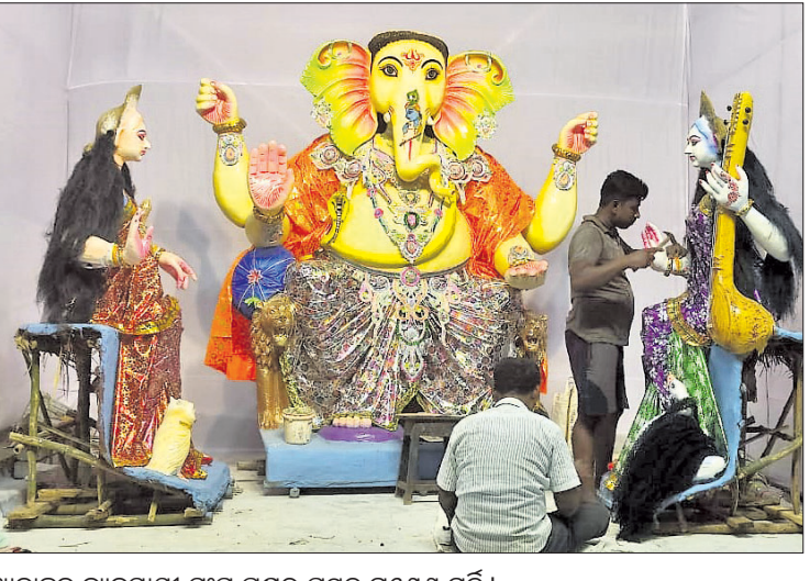
ଆନାହକ ବ୍ୟବସାୟୀ ସଂଘ ପକ୍ଷରୁ ପ୍ରସ୍ତୁତ ଗଣେଶ ମୂର୍ତ୍ତି।

ଆଜି ଗଣେଶ ପୂଜା। ଏଥିପାଇଁ ଉତ୍ତର ମୁଖର ଗାଁ ଠୁ ସହର। କରୋନା କଟକଣା ହରିବା ପରେ ଏଥର ବିସ୍ମ ବିନାଶକଙ୍କ ପୂଜା ପାଇଁ ଚଳଚଞ୍ଚଳ ହୋଇଉଠିଛି ଖୋର୍ଦ୍ଧାର ଜଟଣୀ ହାଇ, ବଜାର, ଗଳିକନ୍ଦିରେ ଭିଜିନ ବେଶ, ଭିନ ଆକୃତିର ଗଜାନନଙ୍କୁ ପୂଜା କରିବାକୁ ପ୍ରସ୍ତୁତ ରହିଛନ୍ତି ଶ୍ରଦ୍ଧାଳୁ। ପୂଜାମଣ୍ଡପ ଗୁଡ଼ିକ ରଙ୍ଗୀନ ଆଲୋକମାଳାରେ ସଜ୍ଜିତ ହୋଇଥିବା ବେଳେ ସୁଉଚ ମୂର୍ତ୍ତି ଏବଂ ଚୋରଣ ଏଥର ମୁଖ୍ୟ ଆକର୍ଷଣ ସାଜିବ। କେତେକ ସ୍ଥାନରେ ଭଜନ ସମାବେଶ ସାଙ୍ଗକୁ ମେଲୋଡ଼ି ସମ୍ପା ପୂଜାର ମାହୋଲକୁ ଆହୁରି ସୁଗୁଣିତ କରିବ। ଜଟଣୀ ଓ ଏହାର ଆଖପାଖ ଅଞ୍ଚଳରେ ୨୦୦ରୁ ଊର୍ଦ୍ଧ୍ଵ ପୂଜା ମଣ୍ଡପରେ ଗଜାନନ ପୂଜା ପାଇବେ। ଅନ୍ୟପକ୍ଷରେ ପୂଜା ଠାରୁ ଭାସାଣି ପର୍ଯ୍ୟନ୍ତ ଶାନ୍ତିଶୃଙ୍ଖଳା ବଜାୟ ରଖିବା ପାଇଁ ପୋଲିସ୍ ପକ୍ଷରୁ ବ୍ୟାପକ ବ୍ୟବସ୍ଥା କରାଯାଇଛି।