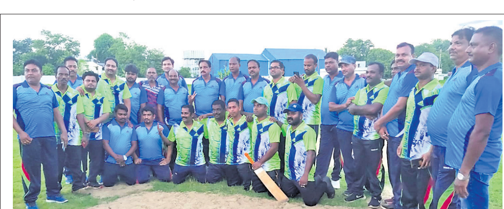
କଟକ: ପୌର ପରିଷଦ ଗଠନର ୫୦ ବର୍ଷ ପୂର୍ତ୍ତି ଅବସରରେ ମଙ୍ଗଳବାର ଗାଁନାୟକ ରେଳଠେଡ଼ି ସ୍ୱାଡ଼ିୟମରେ ଅନୁଷ୍ଠିତ ବସ୍ତୁତ୍ରୟ କ୍ରିକେଟ ମ୍ୟାଚ୍ରେ ପୌର ପରିଷଦ ଏକାଦଶ ଓ ମିଡ଼ିଆ ସହାୟକ ଖେଳାଳିମାନେ।