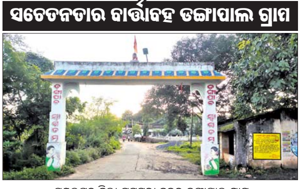
ସମ୍ବଲପୁର ଜିଲା ମୁକୁନ୍ଦା ବୁଦ୍ଧ ତତ୍ତ୍ୱାପାଳ ଗ୍ରାମ

ସମ୍ବଲପୁର, ୩୦/୮ (ସ୍ୱାରେ) ପଶ୍ଚିମ ଓଡ଼ିଶାର ଗଣପତି ନୂଆଁଖାଇ ଗୋଟିଏ ପରିବାର ଭିତରେ ପାଳନ ହୋଇଥିଲା। ପରିବାର ସଦସ୍ୟ ଏକାଠି ହୋଇ ନୂଆଁ (ନବୀନ) ଖାଇଥିଲେ। ପରେ ଗୁରୁଜନଙ୍କଠାରୁ ଆଶୀର୍ବାଦ ଭିକ୍ଷା କରିଛନ୍ତି। ହେଲେ ସ୍ଥାନୀୟ ଉତ୍ସବ ପରିବାର ପ୍ରଚେଷ୍ଟାରେ ସମ୍ବଲପୁର ଜିଲାର ମାଓପ୍ରସଙ୍ଗ ମୁକୁନ୍ଦା ବୁଦ୍ଧ ତତ୍ତ୍ୱାପାଳ ଗ୍ରାମବାସୀ ଏହି ପର୍ବକୁ ନିଆରା ଭଙ୍ଗାରେ ପାଳନ କରିବାକୁ ଯାଉଛନ୍ତି। ଜାତି, ଧର୍ମ, ବର୍ଣ୍ଣ ନିର୍ବିଶେଷରେ ସମସ୍ତ ଭେଦଭାବକୁ ଦୂର କରିବାକୁ ପ୍ରୟାସ କରିଛନ୍ତି। ସେପୋର ୧ ଚାରିଶ ଗୁରୁବାର ପୁରା ଗ୍ରାମ ଗୋଟିଏ ପରିବାର ହୋଇ ଏକାଠି ନୂଆଁ ଖାଇବାକୁ ସ୍ଥିର କରିଛନ୍ତି। ଏ ନେଇ ଏକ କମିଟି ଗଠନ କରି ପ୍ରସ୍ତୁତି ଶେଷ କରିଛନ୍ତି। ଧାର୍ଯ୍ୟ ସମୟରେ ଘରେ ନିଜ ଇଷ୍ଟଦେବାଙ୍କୁ ପୂଜା କରିବେ। ପରେ ମଦିରରେ ପୂଜା କରି ଗାଁ ଦାଣ୍ଡରେ ଏକାଠି ନୂଆଁ ଖାଇବେ। ପରିବାର ବର୍ଗ ନିଜ ଘର ଭଳି ଗାଁ ଦାଣ୍ଡ ସମାପୁରୁଣା କରିଛନ୍ତି।