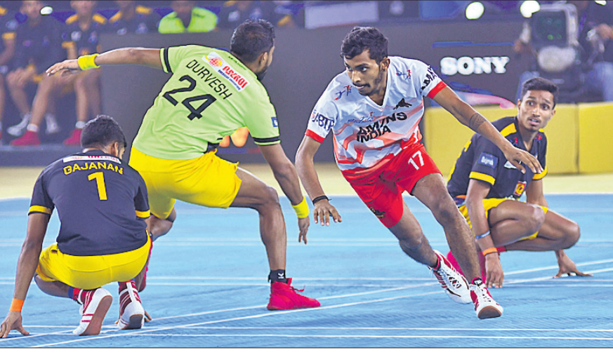
ଓଡ଼ିଶା ଜଗରନଟ୍ସ ଦଳର ପୁଣ୍ୟାଳ ଖୁଲାତିକ୍ ମଧ୍ୟରେ ଅନୁଷ୍ଠିତ ମ୍ୟାଚ ।

ବୃହତ୍ ପରାଜୟ ଚଳିତ ପ୍ରାଞ୍ଜାଳ ଭିତ୍ତିକ ଲିଗ୍‌ରେ ଓଡ଼ିଶା ଜଗରନଟ୍ସର ଏହା ଥିଲା ସବୁଠାରୁ ବଡ଼ ପରାଜୟ । ମ୍ୟାଚରେ ପୁଣ୍ୟାଳ ଖୁଲାତିକ୍ ୭୯ ପଏଣ୍ଟ ହାସଲ କରିଥିବାବେଳେ ଓଡ଼ିଶା ଦଳ ୩୧ ପଏଣ୍ଟରେ ସୀମିତ ରହିଥିଲା । ତେବେ ଏହି ପରାଜୟ ଦଳର ଅଗ୍ରଗତିରେ ବାଧା ସୃଷ୍ଟି କରିପାରି ନାହିଁ । ପୂର୍ବ ମ୍ୟାଚ ରୁଡ଼ିକରେ ଚମତ୍କାର ପ୍ରଦର୍ଶନ ଦଳକୁ ପୁଣେ-ଅପ୍ରେ ନେଇ ଯାଉଛି । ଅନ୍ୟ ପକ୍ଷରେ ପୁଣ୍ୟାଳ ଦଳ ୧୦ଟି ଯାକ ମ୍ୟାଚ ଖେଳି ଯାଉଥିବାବେଳେ ମାତ୍ର ୧୨ ପଏଣ୍ଟ ପାଇ ଅଭିଯାନ ଶେଷ କରିଛି । ରୁଧିବାର ଓଡ଼ିଶା ଦଳ ଏହାର ଶେଷ ଲିଗ୍ ମ୍ୟାଚରେ ଟେକଗୁ ଯୋଦ୍ଧାକୁ ଭେଟିବ ।