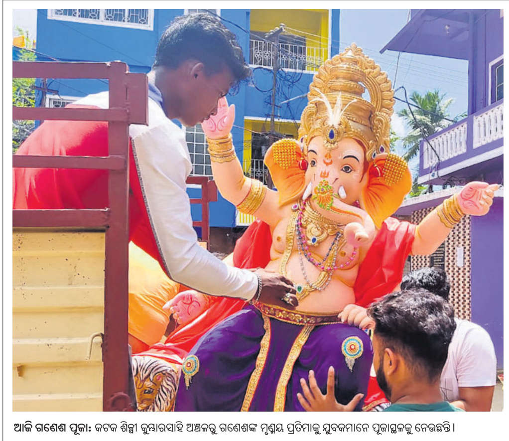
ଆଜି ଗଣେଶ ପୂଜା: କଟକ ଶିଳ୍ପୀ କୁମାରସାହି ଅଞ୍ଚଳର ଗଣେଶଙ୍କ ମୂର୍ତ୍ତିର ପ୍ରତିମାକୁ ଯୁବକମାନେ ପୂଜାସ୍ଥଳକୁ ନେଇଛନ୍ତି।