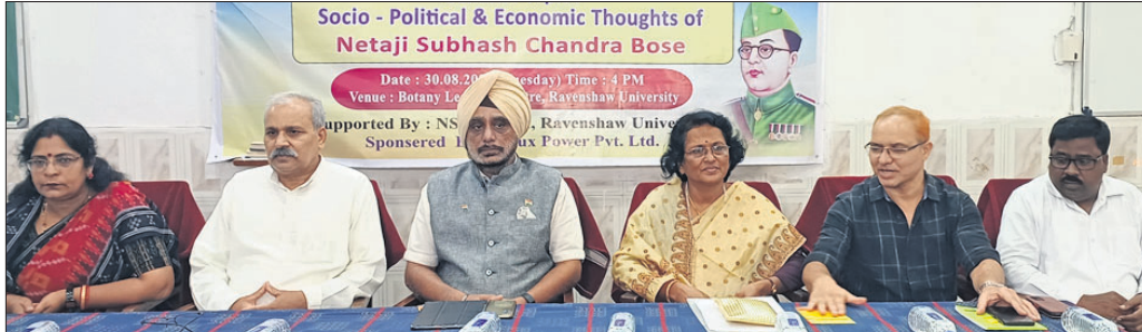
ରେଭେନ୍‌ସା ବିଶ୍ୱବିଦ୍ୟାଳୟରେ ଅନୁଷ୍ଠିତ ଆଲୋଚନାଚକ୍ରରେ ମଞ୍ଚାଧୀନ ଅତିଥିବୃନ୍ଦ।