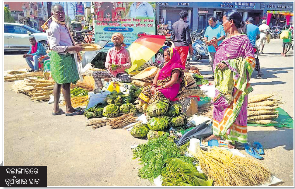
ବଲାଙ୍ଗୀରରେ ନୂଆଁଖାଇ ହାଟ

ପ୍ରାୟ ଦୁଇବର୍ଷ ତଳେ କୋଭିଡ଼ ମହାମାରୀ ସମଗ୍ର ମଣିଷ ଜାତିକୁ ଦେହଲାଇ ଦେଲା । ଜୀବନ ବଞ୍ଚାଇବାକୁ ହେଲେ ସାମାଜିକ ଦୂରତା ଅବଲମ୍ବନ କରିବାକୁ ହିଁ ପଡ଼ିବ ବୋଲି କୁହାଗଲା । ସାମାଜିକ ଦୂରତା ଶବ୍ଦର ବ୍ୟବହାରକୁ ନେଇ ଅନେକ ବିଶ୍ଳେଷଣ, ବୁଦ୍ଧିଜୀବୀ ପ୍ରଶ୍ନ କଲେ । ସାମାଜିକ ଦୂରତା ବଦଳରେ ଶାରୀରିକ ଦୂରତା କଥା କୁହାଯାଇ ବୋଲି ପରାମର୍ଶ ଦେଲେ । ସାମାଜିକ ଦୂରତା ଶବ୍ଦର ବହୁଳ ବ୍ୟବହାର ମଣିଷର ଅନ୍ତରାଳ ଓ ସମାଜକୁ ବହୁଳ ମାତ୍ରାରେ ପ୍ରଭାବିତ କରି ବୋଲି ଚେତାଇ ଦେଲେ । ଲୋକେ ଜୀବିକା ହରାଇ ନିଜ ଗାଁକୁ ଫେରିଲା ବେଳେ ଗ୍ରାମବାସୀ ଓ ସରକାରୀ କଳ ପ୍ରବାସୀଙ୍କୁ ଗାଁକୁ ପଶିବାକୁ ଦେଲେନାହିଁ । ଭୋକ ଉପାସ, ଭୟ ଓ ଭ୍ରାନ୍ତି ଭିତରେ