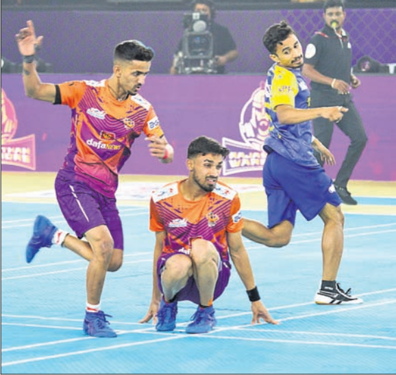
ଗୁଜରାଟ ଲାଏଣ୍ଡ ଓ ରାଜସ୍ଥାନ ଖିରିୟର୍ ମଧ୍ୟରେ ଅନୁଷ୍ଠିତ ମ୍ୟାଚ୍।

ଭୁବନେଶ୍ଵର, ୩୧୮୮ (କ୍ରୀଡ଼ା ପ୍ରତିନିଧି) ମହାଲୁକେସ୍ଥିତ ଶ୍ରୀ ଶିବ ଛତ୍ରପତି ସୋର୍ଷ୍ଟ୍ କମ୍ପ୍ଲେକ୍ସରେ ତାଲିକା ଅଲଟିମେଟ ଖୋ ଖୋ ଲିଗ୍ରେ ଲିଗ୍ ପର୍ଯ୍ୟାୟ ବୁଧବାର ଶେଷ ହୋଇଛି। ଅଧିନ ଲିଗ୍ ମ୍ୟାଚରେ ଓଡ଼ିଶା ଜଗରନନ୍ଦ ୨୯ ପଏଣ୍ଟରେ ତେଲୁଗୁ ଯୋଦ୍ଧାପାଠୁହାରି ଯାଇଛି। ତେଲୁଗୁ ଯୋଦ୍ଧା ସଂ ୫୫ ପଏଣ୍ଟ ହାସଲ କରିଥିବାବେଳେ ଜଗରନନ୍ଦ