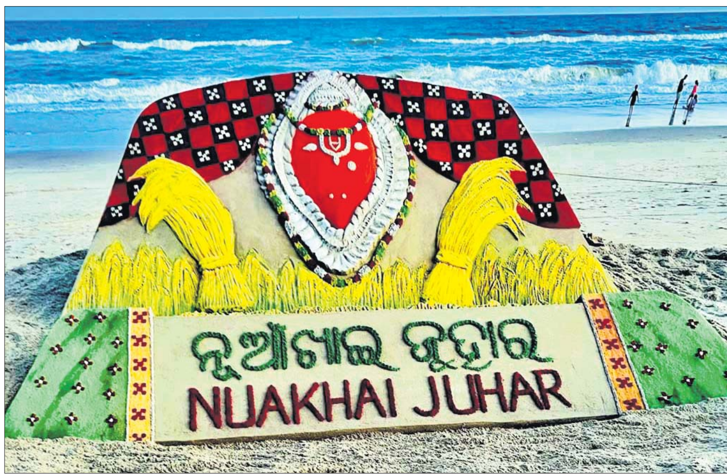
ପଶ୍ଚିମ ଓଡ଼ିଶାର ଗଣପର୍ବ ନୁଆଖାଇ ଉପକଣ୍ଠେ ରୁଧିରା ପୁରୀ ବେଳାଭୂମିରେ ପରୁଣା ସୁବର୍ଣ୍ଣ ପଟ୍ଟନାୟକଙ୍କ ବାଲୁକା କଳା।

ତଦନ୍ତ ପାଇଁ ପୋର୍ଟ ଭିଜିଲାନ୍ସ ବିଭାଗକୁ ସିବିଆଇର ଚିଠି ଧର୍ମଶାଳା, ୩୧।୮ (ବି.ଏନ.ଏ.): ଯାଜପୁର ଜିଲ୍ଲା ଧର୍ମଶାଳା ତହସିଲ ଅନ୍ତର୍ଗତ ବ୍ରହ୍ମପୁର ଶାସନରେ ପାରାଦୀପ ପୋର୍ଟ ଜମିକୁ ସ୍ଥାନୀୟ ଅଞ୍ଚଳର ଜଣେ ଖଣି ବ୍ୟବସାୟୀ ହାତେଇଥିବା ନେଇ ସିବିଆଇରେ ଅଭିଯୋଗ ହେବାପରେ ତଦନ୍ତ ପ୍ରକ୍ରିୟା ଆରମ୍ଭ ହୋଇଛି। ଏନେଇ ପାରାଦୀପ ପୋର୍ଟ ଭିଜିଲାନ୍ସ ଡିପାର୍ଟମେଣ୍ଟକୁ ଘଟଣାର ତଦନ୍ତ ପାଇଁ ସିବିଆଇ ପକ୍ଷରୁ ନିର୍ଦ୍ଦେଶ ଦିଆଯାଇଛି। ଧର୍ମଶାଳା ତହସିଲର ବ୍ରହ୍ମପୁର ଶାସନରେ ତଳେ ଉଲ୍ଲେଖିତ ପାରାଦୀପ ପୋର୍ଟ ବ୍ରହ୍ମପୁର ୩୫.୪୬ ଏକର ଜମି ପ୍ରଦାନ କରାଯାଇଛି। ଏଥିରୁ ୨୦ ଏକର ଜମିକୁ ପୋର୍ଟ ପକ୍ଷରୁ ୬ ବର୍ଷିଆ ଲିଜ୍ ଆକାରରେ ସ୍ଥାନୀୟ ଅଞ୍ଚଳର ଖଣି ବ୍ୟବସାୟୀ ଶ୍ରୀବାସ ଜେନାଙ୍କୁ ୨୦୦୭ ନଭେମ୍ବର ୧ରେ ପ୍ରଦାନ କରାଯାଇଥିଲା। ୮/୨୦୧୨ରେ ଏହାର ଅବଧି ଏହି ୨୦ ଏକର ଜମିକୁ ସେଆଇନ ଭାବେ ନିଜ ଅଧିକାରରେ ରଖି ସେଠାରେ ନିଜ ବ୍ୟବସାୟ ଚଳାଇଛନ୍ତି। ଏନେଇ ଧର୍ମଶାଳା ଅଞ୍ଚଳର ପୁରୁଣା ଅଧିକାର କର୍ମୀ ସର୍ବେଶ୍ୱର ବେହେରା ଘଟଣାର ସିବିଆଇ ତଦନ୍ତ ପାଇଁ ଆବେଦନ କରିଥିଲେ।