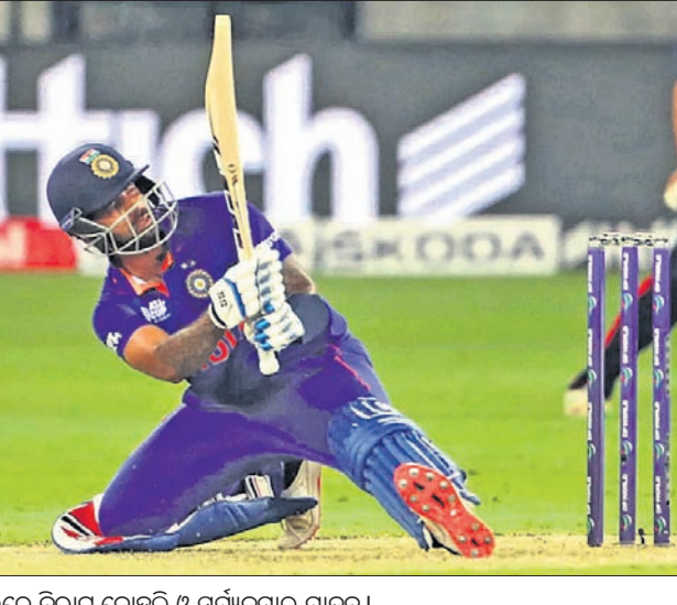
ଅପରାଜିତ ଅର୍ଦ୍ଧଶତକ ହାସଲ ଅବସରରେ ବିରାଟ କୋହଲି ଓ ସୂର୍ଯ୍ୟକୁମାର ଯାଦବ।