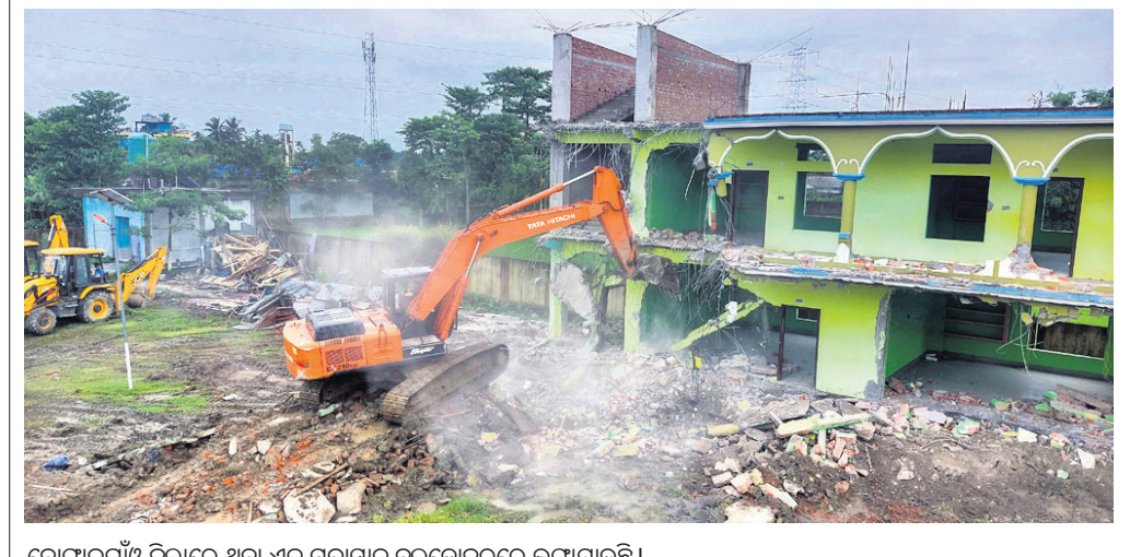
ବୋଙ୍ଗାଳୁରୁ ଉପରେ ଥିବା ଏକ ମହାସାଧୁ ବୁଲ୍‌ଡୋଜରରେ ଭଙ୍ଗାଯାଉଛି।