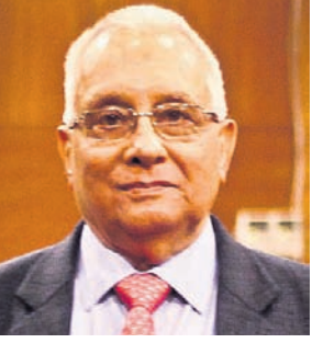
ଡକ୍ଟର ପ୍ରଦୀପ୍ତ ମହାପାତ୍ରଙ୍କ ପରଲୋକ ୧୯୭୫-୨୨