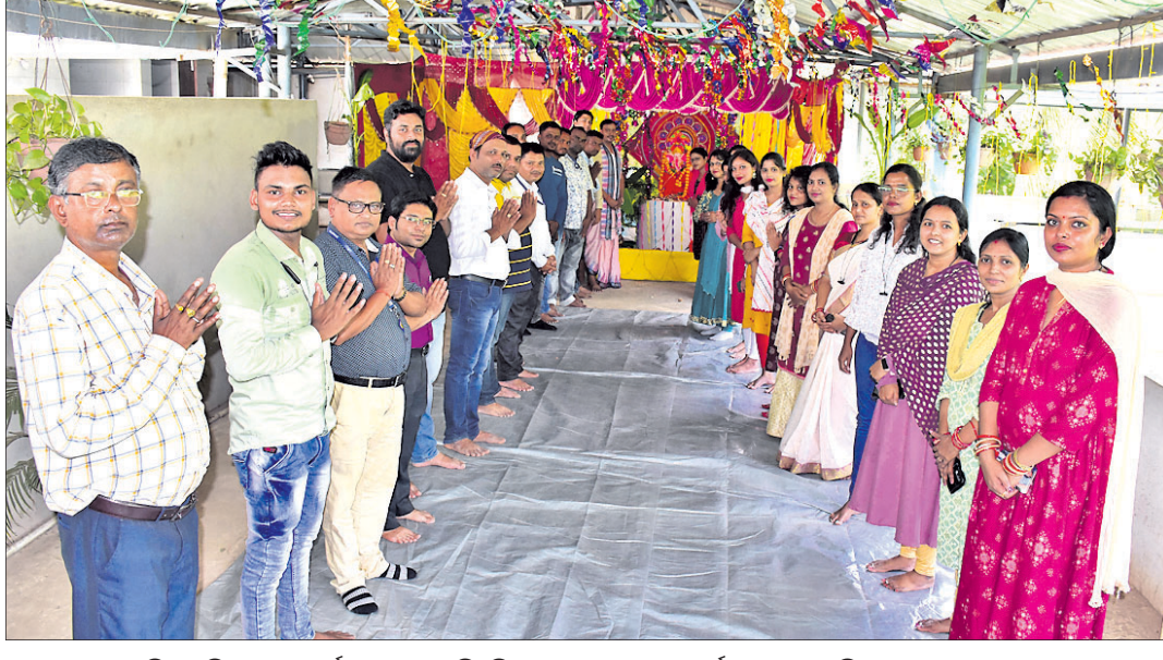
ଭୁବନେଶ୍ୱରସ୍ଥିତ ଧରିତ୍ରୀ ମୁଖ୍ୟକାର୍ଯ୍ୟାଳୟରେ ବିକ୍ରିବିନାଶନ ଗଣେଶଙ୍କ ପୂଜାର୍ଚ୍ଚନା କରାଯାଇଛି।