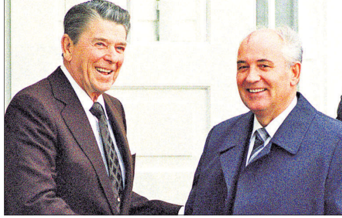
ଆମେରିକାର ୪୦ତମ ରାଷ୍ଟ୍ରପତି ରୋନାଲ୍ଡ ରେଗାନ୍‌ଙ୍କ ସହ ମିଖାଇଲ୍ ଗୋର୍ବାଚେଭ୍।

୧୯୧୭ରେ ବୋଲସେଭିକ୍ କ୍ରାନ୍ତି ପରେ ଜାରି ନିକୋଲାଇଫ୍ ବ୍ରିଟାନ୍ ଶାସନରୁ ହଟିବା ପରେ ସୋଭିଏଟ୍ ସଂଘ ଗଠନ ହୋଇଥିଲା। ହେଲେ ଦେଶରେ ରାଜନୈତିକ ଅସ୍ଥିରତା ଜାରି ରହିଥିଲା। ଭ୍ଲାଡିମିର ଲେନିନ୍ ରୁଷିଆ ଶାସନ ଭାର ସମ୍ଭାଳିଥିଲେ। ରୁଷିଆକୁ ଲାଗି ରହିଥିବା ରାଜ୍ୟଗୁଡ଼ିକୁ ସେ ଏକତ୍ର କରିଥିଲେ। ପରେ ଅର୍ପିଆଲି ସୋଭିଏଟ୍ ସଂଘ ଗଠନ ହୋଇଥିଲା। ହେଲେ ଲୋକଙ୍କୁ ନିଜ ଇଚ୍ଛାରେ ବଞ୍ଚିବା ସ୍ୱାଧୀନତା ମିଳିପାରି ନ ଥିଲା। ରୁଷିଆରେ ଏକଛତ୍ରବାଦ ଶାସନର ପୂର୍ବଧର ଥିଲେ ଯେମିତି ଷ୍ଟାଲିନ୍। ଦେଶର ସମସ୍ତ ନିଷ୍ପତ୍ତି କମ୍ୟୁନିଷ୍ଟ ପାର୍ଟି ହିଁ ନେଉଥିଲା। ୧୯୮୫ରେ ମିଖାଇଲ୍ ଗୋର୍ବାଚେଭ୍ ସୋଭିଏଟ୍ ସଂଘର ରାଷ୍ଟ୍ରପତି ହୋଇଥିଲେ। ସେହି ସମୟରେ ରୁଷିଆ ଗଣତାନ୍ତ୍ରିକ ଓ ରାଜନୈତିକ ସଙ୍କଟ