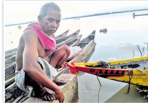
ନୂଆଁଖାଇର ନିଆରା ପରମ୍ପରା

ମଣିଷ ସେଦିନ କୋଭିଡ଼ ମହାମାରୀ କାଳର ସାମାଜିକ ଦୂରତାକୁ ଅଙ୍ଗେ ନିଭାଇଥିଲା। କେବଳ ପ୍ରବାସୀ ନୁହଁ, ପରିବାର, ଗାଁ ଓ ସହର ଭିତରେ ପାତିତ ମଣିଷଟିଏ କେତେ ଅଲୋଚା, ଅବହେଳା ଏବଂ ଅମାନବିକ ପରିସ୍ଥିତିରେ ସମ୍ମୁଖୀନ ହେଲା। ସେଇ ଗଭୀର ପାତା ଆଜି ଅନେକଙ୍କ ଅନ୍ତର୍ଦ୍ଧନକୁ ଦେହଲାଲ ଦେଉଛି। କୋଭିଡ଼ ସମାଜରେ ସାମାଜିକ ପାଟ ଓ ଦୂରତା ସୃଷ୍ଟି କରିଥିଲା। ଏଭଳି ସମୟରେ କୋଭିଡ଼ ପରବର୍ତ୍ତୀ ନୂଆଁଖାଇ ଅଧିକ ପ୍ରାସଙ୍ଗିକ ହୋଇପଡ଼ିଛି। ସାମାଜିକ ଦୂରତାରୁ ସାମାଜିକ ନିବିଡ଼ତା ଆଡ଼କୁ ପୁଣି ଥରେ ମଣିଷକୁ ଫେରାଇ ନେବାକୁ ନୂଆଁ ଆହ୍ୱାନ ନେଇ ଆସିଛି ନୂଆଁଖାଇ। - ରିପୋର୍ଟ: ବୀରେନ୍ଦ୍ର କୁମାର ଝାଙ୍କର