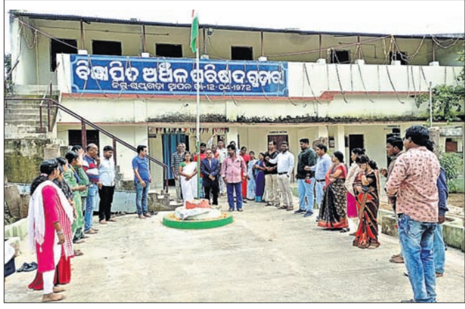
ଏନ୍ଏସି କାର୍ଯ୍ୟକ୍ରମରେ ପଠାକା ଉଚ୍ଚୋଚ୍ଚ କରାଯାଇଛି।

ନବରଙ୍ଗପୁର ଜିଲ୍ଲା ଉପରକୋଟ ବ୍ଲକ୍ ବୁର୍ଜା ପଞ୍ଚାୟତର କପଦାପାଟଣା, ସାରିଆଭାଗ, ଲକ୍ଷ୍ମୀପୁରୀ ଓ ସେମଲଧରା ଗାଁରେ ଆଦିବାସୀଙ୍କ କର୍ମରେ ଫଳାଫଳ ନଷ୍ଟକରି ଗ୍ରାମବାସୀଙ୍କୁ ଆକ୍ରମଣ କରାଯାଇଥିଲା। କେତେକ ଜଣଙ୍କ ବିଭାଗ କର୍ମଚାରୀଙ୍କ ଉଚ୍ଚତରେ ଆଦିବାସୀ ବିରୋଧୀମାନେ ଏହି ଅମାନବୀୟ ଓ ବେଆଇନ କାର୍ଯ୍ୟ କରିଥିଲେ ବୋଲି ଅଭିଯୋଗ ହୋଇଥିଲା। ଆଦିବାସୀ ଓ ବନବାସୀଙ୍କ ବିରୋଧରେ ଚକ୍ରାନ୍ତକାରୀଙ୍କୁ ଗିରଫ କରାଯାଇ ବୋଲି ଓଡ଼ିଶା ଆଦିବାସୀ ଅଧିକାର ମନ୍ତ୍ରାଳୟ ପକ୍ଷରୁ ଯାତା ନବରଙ୍ଗପୁର ଦଳିତ ପାଠାଗାର ଠାରେ ରୁଧିରୀ ଆହୁତ ଖବରଦାତା ସମ୍ମିଳନୀରେ କହିଛନ୍ତି। ଜଣଙ୍କ ବିଭାଗ ଦ୍ୱାରା ଗିରଫ ହେଉଥିବା ସମ୍ବନ୍ଧରେ ଆଦିବାସୀଙ୍କୁ କର୍ମଚାରୀଙ୍କୁ ଜଣାଇ ଅଧିକାରୀ ଆଇନ ୨୦୦୬ ଓ ପୋପା ଆଇନ ୧୯୯୬କୁ ବିଚଳ କରାଇବା ପାଇଁ ଜଣଙ୍କର ପତ୍ନୀ ପ୍ରମାଣକୁ ବିରୋଧ କରିବା ଲକ୍ଷ୍ୟକର ବୋଲି କୁହାଯାଇଛି। ନବରଙ୍ଗପୁର ଜିଲ୍ଲା ଏକ ଆଦିବାସୀ ଅଧିକାର ଅଞ୍ଚଳ। ବ୍ୟକ୍ତିଗତ ଜଣଙ୍କ ଜମିରେ ରାଜକର୍ମୀ ପତ୍ନୀ ସହ ଗୋଷ୍ଠୀଗତ ଜଣଙ୍କ ଅଧିକାର ପାଇଁ ଆବେଦନ ହୋଇଛି। ରାଜ୍ୟରେ ବିଭେଦିତ ଓ କେନ୍ଦ୍ରରେ ଭାଙ୍ଗିପା ଦରକାରଙ୍କ ଶାସନ ଚଳିଛି। ରାଜ୍ୟରେ ବନ ବିଭାଗକୁ ଓ ବନ ସୁରକ୍ଷା ସମିତିକୁ ବ୍ୟବହାର କରି ଆଦିବାସୀ ଓ ଅନ୍ୟ ପାରମ୍ପାରିକ ବନବାସୀଙ୍କୁ ଜଣଙ୍କ ଜମି ଓ ଗୋଷ୍ଠୀଗତ