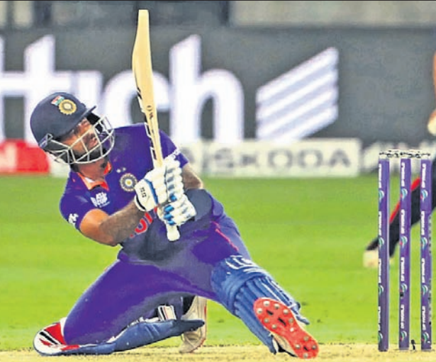
ଅପରାଜିତ ଅର୍ଦ୍ଧଶତକ ହାସଲ ଅବସରରେ ବିରାଟ କୋହଲି ଓ ସୂର୍ଯ୍ୟକୁମାର ଯାଦବ।

ବୁବାଲ, ୩୧୮୮ (ପି.ଟି.) ଅନ୍ତର୍ଜାତୀୟ କ୍ରିକେଟ ପରିଷଦ (ଆଇସିସି)ର ଟି୨୦ ର୍ୟାଙ୍କିଂ ତାଲିକା ପ୍ରକାଶ ପାଇଛି। ଏଥିରେ ଭାରତୀୟ ଅଲରାଉଣ୍ଡର ହାର୍ଡିକ ପାଞ୍ଚା ଗୁମ୍ମାନ୍ ଉପରକୁ ଉଠି ଅନ୍ତର୍ଜାତୀୟ ଟି୨୦ ଅଲରାଉଣ୍ଡର ର୍ୟାଙ୍କିଂରେ କ୍ୟାରିୟର ଶ୍ରେଷ୍ଠ ୫ମ ସ୍ଥାନ ଅଧିକାର କରିଛନ୍ତି। ଏଠାରେ ଚାଲିଥିବା ଏସିଆ କପ୍ରେ ପାଞ୍ଚାଙ୍କୁ ବିପକ୍ଷ ମ୍ୟାଚରେ ତାଙ୍କର ଚମତ୍କାର ପ୍ରଦର୍ଶନ ଯୋଗୁ ଏହା ସମ୍ଭବ ହୋଇପାରିଛି। ହାର୍ଡିକ ଏହି ମ୍ୟାଚରେ ୨୫୨ରନ ବିନମୟରେ ୩ ଉଇକେଟ ଅଭିଆର କରିଥିବା ବେଳେ ମାତ୍ର ୧୭ ବଲ୍ରେ ୩୩୩ ରନ କରି ଅପରାଜିତ ରହିଥିଲେ। ଏସିଆ କପ୍ ଟୁର୍ନାମେଣ୍ଟରେ ଅପରାଜିତ୍ୟର