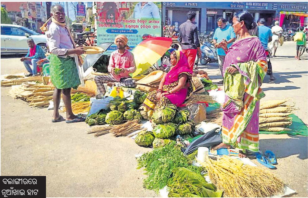
ବଲାଙ୍ଗୀରରେ ନୂଆଁଖାଇ ହାଟ

ନୂଆଁଖାଇ ତିହାର ମୂଳ ଆଦେବନ ସାମାଜିକ ନିବିଡ଼ତା। ଏଥିରେ ସାମାଜିକ ଦୂରତାର ଘ୍ନାନ ନାହିଁ। କେଉଁ ଆବହମାନ କାଳକୁ ପଶିବୁ ଓଡ଼ିଶା ବା କୋଶଳାଞ୍ଚଳର ଭୌଗୋଳିକ ପରିସୀମାରେ ନୂଆଁଖାଇ ତିହାର ପାଳିତ ହୋଇଆସୁଛି। ଏହାକୁ ପ୍ରଥମ ଅନନ୍ତ ପର୍ବ କୁହାଯାଏ। ମୂଳତଃ ଏହା କୃଷିଭିତ୍ତିକ ତିହାର। ଭାଦ୍ରବ ମାସରେ ଅର୍ଦ୍ଧ(ହଳ) ଜମିରେ ଧାନକେଣ୍ଡା ଗଛୁରି ଉଠେ। ଏହାକୁ ଦେଖି ମଣିଷ ମନ ଭାବୋତ୍ତାପରେ ଭରିଯାଏ। ପ୍ରଥମ ଅନନ୍ତ କୃତଜ୍ଞତା ସ୍ୱରୂପ ଇଷ୍ଟ ଦେବଦେବୀଙ୍କୁ ଅର୍ପଣ କରେ। ଏକ ପ୍ରଥମ ଅନନ୍ତ ଅର୍ପଣ ପର୍ବ ବା ତିହାର ହେଉଛି ନୂଆଁଖାଇ। ବିଭିନ୍ନ ରାଜ୍ୟରେ ପ୍ରଥମ ଅନନ୍ତ ନେଇ ଅନେକ ପର୍ବପର୍ବାଣି ପାଳନ ହୋଇଥାଏ। ତେବେ ପଶ୍ଚିମ ଓଡ଼ିଶାର ନୂଆଁଖାଇର ସ୍ୱାତନ୍ତ୍ରତା ରହିଛି। ନୂଆଁଖାଇ ପରିବାରକୁ ଏକାକାର କରେ। ବନ୍ଧୁ ପରିଚନ, ସମ୍ପର୍କାୟ, ପତ୍ନୀଶାଳୁ ଚୋରପଟ୍ଟନରେ ଯୋଗେ। ପରମ୍ପରକୁ ଦାୟିତ୍ୱସମ୍ପନ୍ନ କରେ। ନୂଆଁଖାଇ ଦିନ ଯିଏ ଯେତେ ଦୂରଥିଲେ ମଧ୍ୟ ଘରକୁ ଫେରିବାକୁ ବ୍ୟାକୁଳ ହୁଏ। ଅଧିକାଂଶ ଲୋକେ ଦୂରଦୂରାନ୍ତରୁ ଘରକୁ ଓ ଗାଁକୁ ଫେରୁଥିବାକୁ ଏକ ସାମାଜିକ ପର୍ବରେ ରୂପାନ୍ତରିତ ହୋଇଯାଏ। ଇଷ୍ଟ ଦେବଦେବୀଙ୍କୁ ଅର୍ପଣ ନୂଆଁଖାଇ ସହ ଅନେକ ବ୍ୟଞ୍ଜନକୁ ପରିବାର ଲୋକେ ଏକତ୍ର ବସି ଖାଆନ୍ତି। ଏହାପରେ ପରିବାରର ବୟୋଜ୍ୟେଷ୍ଠଙ୍କୁ କନିଷ୍ଠମାନେ ମୁଣ୍ଡିଆ ମାରି ଆଶୀର୍ବାଦ ନେଇଥାନ୍ତି। ପରମ୍ପର ଭିତରେ ସ୍ନେହ ଓ ଶ୍ରଦ୍ଧା ଝଳିବିଲେ। ଏହାପରେ ପତୋଶା, ସମ୍ପର୍କାୟ ଓ ଗାଁ ଲୋକଙ୍କ ସହ ଆରମ୍ଭ ହୁଏ କୁହାର ଭେଟ କାର୍ଯ୍ୟକ୍ରମ। ନୂଆଁଖାଇ ତିହାର ଦିନ ଗାଁ ବା ସହର ଏକ ଦୁଇ ଦୂରଦୂରରେ ରୂପାନ୍ତରିତ ହୋଇଯାଏ। ମତାନ୍ତର, ମନାନ୍ତର ଭୁଲି ଶାବନକୁ ରତଖିଳ କରିବା ପାଇଁ ନୂଆଁ ଝଙ୍କଳୁ ନିଅନ୍ତି। ଏହାହିଁ ନୂଆଁଖାଇର ପାରମ୍ପରିକତା, ମୂଳତତ୍ତ୍ୱ ଓ ବିରାଜବୋଧ। ତେବେ ସମୟଚକ୍ରରେ ନୂଆଁଖାଇ ତିହାର ପାଳନରେ ଅନେକ ପରିବର୍ତ୍ତନ ଘଟିଛି। କାଳକ୍ରମେ ମୂଳ କୃଷି ପରମ୍ପରାରେ ଅନେକ ନୂଆଁ ସାମାଜିକ, ସାଂସ୍କୃତିକ ଓ ରାଜନୈତିକ ଉପକ୍ରମ ଯୋଡ଼ିହୋଇଛି। ଦିନକୁ ଦିନ ନୂଆଁଖାଇ ଉତ୍ସବ ମୁଖିତ ଓ ଆକର୍ଷଣୀୟ ହୋଇଉଠୁଛି ସତ, ମାତ୍ର ଏହାର ମୂଳ ବିରାଜବୋଧ ଯେମିତି ସଂକ୍ରମିତ ହୋଇନାହିଁ।