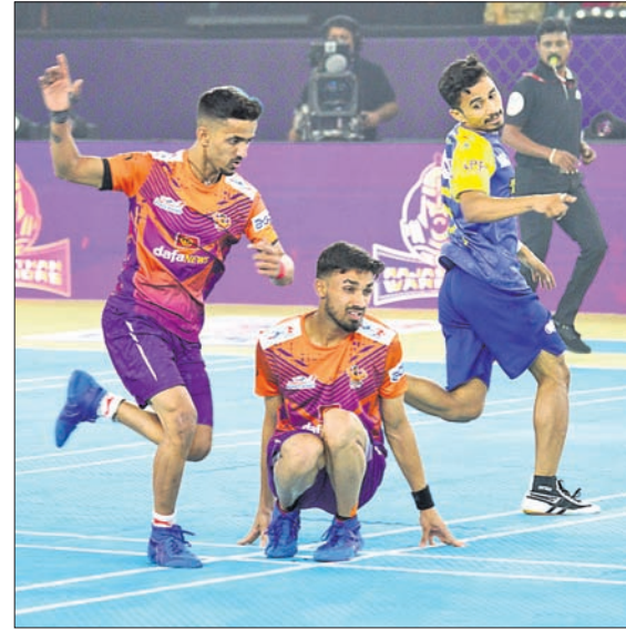
ଗୁଜରାଟ ଲୀକ୍ଷଣ ଓ ରାଜସ୍ଥାନ ଖିରିୟର୍ ମଧ୍ୟରେ ଅନୁଷ୍ଠିତ ମ୍ୟାଚ୍।

ପୁଣେ, ୩୧୮୮ (କ୍ରୀଡ଼ା ପ୍ରତିନିଧି) ମହାଲୁକେସ୍ଥିତ ଶ୍ରୀ ଶିବ ଛତ୍ରପତି ସ୍ପୋର୍ଟ୍ସ କମ୍ପ୍ଲେକ୍ସରେ ଚାଲିଥିବା ଅଲଟିମେଟ ଖୋ ଖୋ ଲିଗ୍‌ର ଲିଗ୍ ପର୍ଯ୍ୟାୟ ବୁଧବାର ଶେଷ ହୋଇଛି। ଅଧିନ ଲିଗ୍ ମ୍ୟାଚରେ ଓଡ଼ିଶା ଜଗରନମ୍ ୨୯ ପଏଣ୍ଟରେ ତେଲୁଗୁ ଯୋଦ୍ଧାପାଠୁହାରି ଯାଇଛି। ତେଲୁଗୁ ଯୋଦ୍ଧାସ ୬୫ ପଏଣ୍ଟ ହାସଲ କରିଥିବାବେଳେ ଜଗରନମ୍