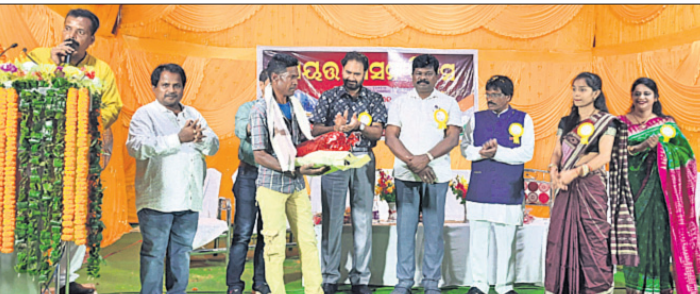
ଉତ୍ତମ କାର୍ଯ୍ୟ ପାଇଁ ସଫଳତା କର୍ମଚାରୀ ତତ୍ପ୍ରାଣୀଙ୍କୁ ସମ୍ମାନିତ କରାଯାଇଛି।

ନବରଙ୍ଗପୁର ପୌର ପରିଷଦ ପକ୍ଷରୁ ରୁପକାର ସ୍ଵାୟତ୍ତ ଶାସନ ଦିବସ ପାଳିତ ହୋଇଯାଇଛି। ପୂର୍ବରୁ ଏଠାରେ ପୌରାଧିକାରୀଙ୍କୁ ନିୟମିତ ଭାବେ ପଠାଯାଇ ଆସୁଥିଲା।