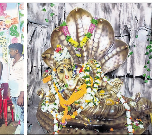
ରାୟଗଡ଼ା ଜଳକଳା ଗାଏବ ପକ୍ଷରୁ ଗଣେଶ ପୂଜା।