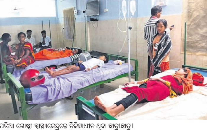
ପଡ଼ିଆ ଗୋଷ୍ଠୀ ସାମ୍ବଲକେନ୍ଦ୍ରରେ ଚିକିତ୍ସାଧୀନ ଥିବା ଛାତ୍ରାଛାତ୍ରୀ।

ମାଲକାନଗିରି ଜିଲ୍ଲା ପଡ଼ିଆ ବ୍ଲକ୍ କାଳଦାପାଳି ପଞ୍ଚାୟତ ଅନ୍ତର୍ଗତ କଳାଗଣା ମଙ୍ଗଳ ବିଭାଗ ବିଦ୍ୟାଳୟରେ ଗତ ୨ଦିନ ମଧ୍ୟରେ ଅଜଣା ରୋଗରେ ୨ଜଣ ଛାତ୍ରଙ୍କ ମୃତ୍ୟୁ ହୋଇଛି।