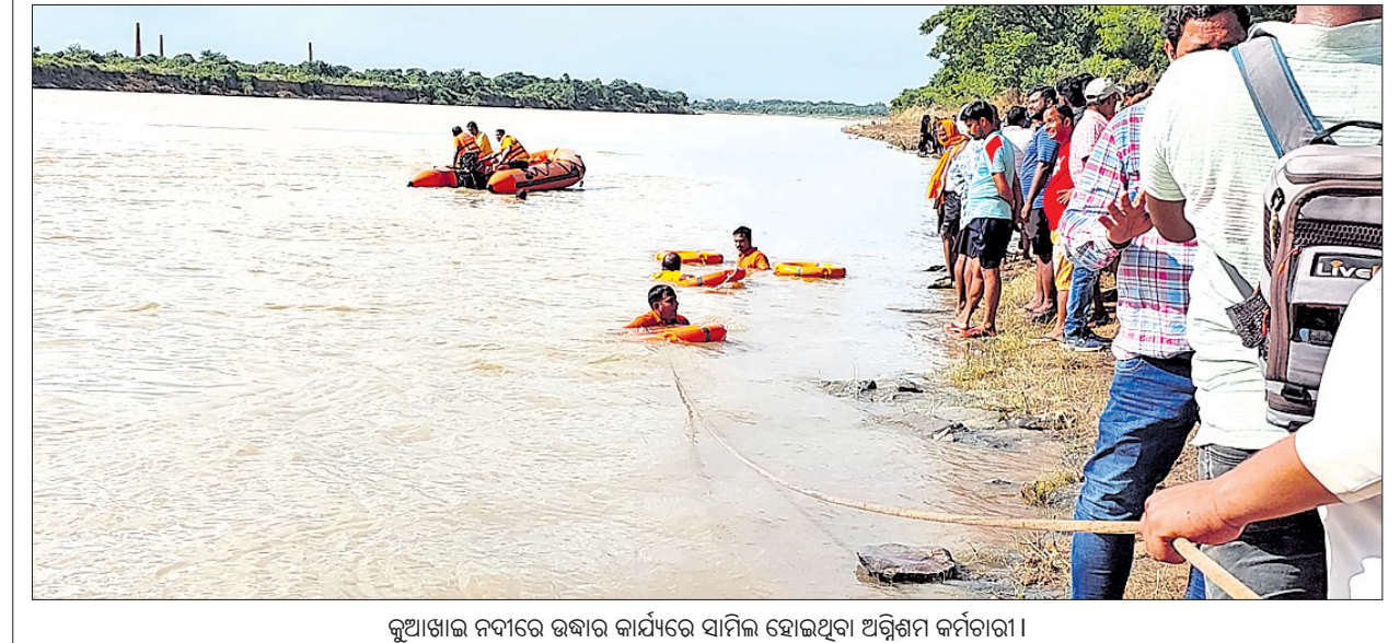
କୁଆଖାଇ ନଦୀରେ ଉଦ୍ଧାର କାର୍ଯ୍ୟରେ ସାମିଲ ହୋଇଥିବା ଅଗ୍ନିଶମ କର୍ମଚାରୀ ।