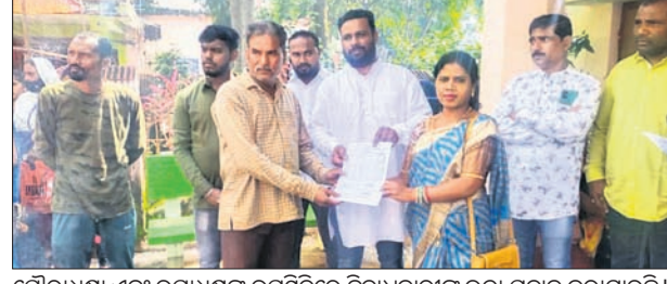
ପୌରାଧିକାରୀ ଏବଂ ଉପାଧିକାରୀଙ୍କୁ ଉତ୍ତମକୋଟରେ ଶାସନ ଦିବସ ପାଳିତ କରାଯାଇଛି।

ଉତ୍ତମକୋଟ, ୩୧୮୮ (ଡି.ଏନ୍.ଏ.) - ଉତ୍ତମକୋଟ ପୌର ପରିଷଦ ପକ୍ଷରୁ ରୁପକାର ସ୍ଵାୟତ୍ତ ଶାସନ ଦିବସ ପାଳିତ ହୋଇଯାଇଛି।