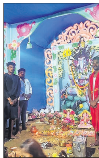
ନବରଙ୍ଗପୁର ଜିଲ୍ଲା ଉତ୍ତମକୋଟ ଶିବାଜୀନଗରଠାରେ ଗଣେଶ ପୂଜା।

ଉପାଧିକାରୀଙ୍କୁ ଶିକ୍ଷକ ଉପାଧିରେ ଗ୍ରହଣ କରିବାକୁ ନିର୍ଦ୍ଦେଶ ଦିଆଯାଇଛି।