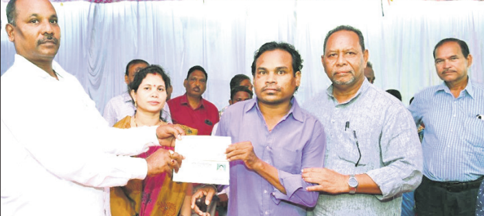
ଜଣେ ବିଦ୍ୟାଳୟ ପ୍ରମାଣପତ୍ର ପ୍ରଦାନ କରାଯାଇଛି।

ବସଷ୍ଟା ଛାଡ଼ି ଯୋଗାଣ ସୁବିଧା ସୁଗମ କରିବା ପାଇଁ ପଦକ୍ଷେପ ଗ୍ରହଣ କରାଯାଇଛି।