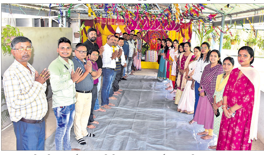
ଭୁବନେଶ୍ୱରରେ ଧରଣୀ ପୁସ୍ତକାଳୟରେ ବିକ୍ରମବାଣନ ଗଣେଶଙ୍କ ପୂଜାର୍ଚ୍ଚନା କରାଯାଇଛି।

ବ୍ରହ୍ମପୁର ଅଧିକ, ୩୧୮ ବ୍ରହ୍ମପୁର ସଦର ଥାନା ପୋଲିସ୍ ମଞ୍ଚକାରୀ ବାଉଁଶିଆପଲ୍ଲୀ ଓ ରାମଚନ୍ଦ୍ରପୁରରେ ଚାଲିଥିବା ପୁଅକ ୩ ଗୁରୁତ୍ୱା ପ୍ରସ୍ତୁତ କାରଖାନାରେ ତଡ଼ାଇ କରିଥିଲା।