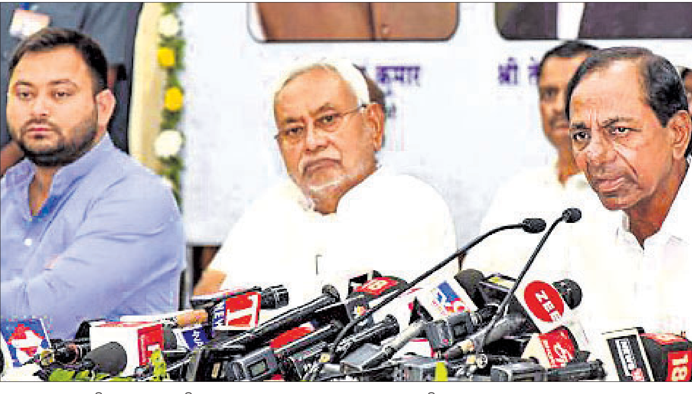
ପାଟନାରେ ରୁଧିରୀ ଅନୁଷ୍ଠିତ ଏକ ଖବରଦାତା ସମ୍ମିଳନୀରେ ତେଲଙ୍ଗାନା ମୁଖ୍ୟମନ୍ତ୍ରୀ କେ. ଚନ୍ଦ୍ରଶେଖର ରାଓଙ୍କ ସହ ବିହାର ମୁଖ୍ୟମନ୍ତ୍ରୀ ନୀତୀଶ କୁମାର ଓ ଉପମୁଖ୍ୟମନ୍ତ୍ରୀ ତେଜସ୍ୱୀ ଯାଦବ ।

ସେପ୍ଟେମ୍ବର ଶେଷ ସପ୍ତାହରେ ଓଡ଼ିଶା ଆସିବେ ଜେ.ପି. ନଈ