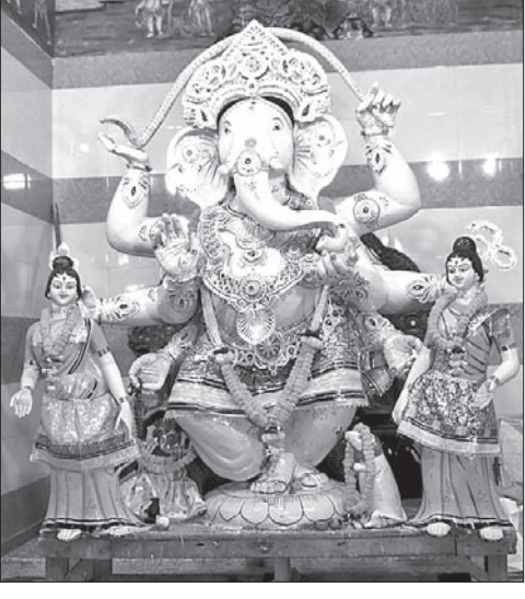
ସବୁଠି ଅଗ୍ରପୁରୁଷ ଆବାହନ: ପୁରୀ ମହାଶିବରାତ୍ର ବଜାର

ପୁରୀ ଅଫିସ: ସମସ୍ତଙ୍କୁ ଧାରୀ ଅଞ୍ଚଳରେ ବାଦାଦି ଆଦାୟ ଅଭିଯୋଗରେ ପୋଲିସ୍ ଦୁରଭ୍ୟାସକୁ ରିପୋର୍ଟ କରି ବୁଧବାର କୋର୍ଟ ଚାଲାଣ କରିଛି। ସେମାନେ ହେଲେ ସେହି ଧାରୀ ଅଞ୍ଚଳର ବାଲିନୋଲିଆ ସାହି ଦେଉଳି ସାହିର ଲୋକନାଥ ସାହୁ ଓ ରାମମନ୍ଦିର ଛକ ନିକଟ ଗାଳିସାହିର ପ୍ରମା ଚାଲି। ଦୁଇଟି ନିକଟତ୍ର ଗୋଟିଏ କ୍ଲଡ଼ି ଓ ନଗର ଘାଟୁଗଡ଼ା ଜନସାହାରଣୀ ଏ ନେଇ ପୋଲିସ୍ ଏକ କେସ୍ (ନଂ. ୨୮୧/୨୨) ରୁଦ୍ଧ କରିଛି। ପୁରୀ ଅନୁଯାୟୀ, ବୁଧବାର ସକାଳ ପ୍ରାୟ ୧୦ଟା ୩୦ରେ ସମସ୍ତଙ୍କୁ ଧାରୀ ଅଞ୍ଚଳରେ ଚେତନା ଛକ ନିକଟରେ ଦୁରଭ୍ୟାସ ବ୍ୟକ୍ତି ଗୋଦାନୀମାନଙ୍କୁ ଭୁବନେଶ୍ୱର ବନ୍ଦୀ ଆଦାୟ କରୁଥିଲେ। ପୋଲିସ୍ ଏହି ଖବର ସେଠାରେ ଜଣାଣ କରି ଅଭିଯୁକ୍ତମାନଙ୍କୁ ଗିରଫ କରିଥିଲା।