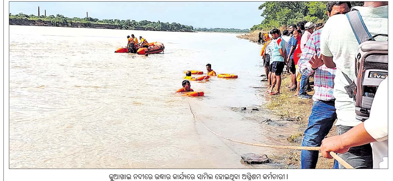
କୁଆଖାଇ ନଦୀରେ ଉଦ୍ଧାର କାର୍ଯ୍ୟରେ ସାମିଲ ହୋଇଥିବା ଅଗ୍ନିଶମ କର୍ମଚାରୀ ।