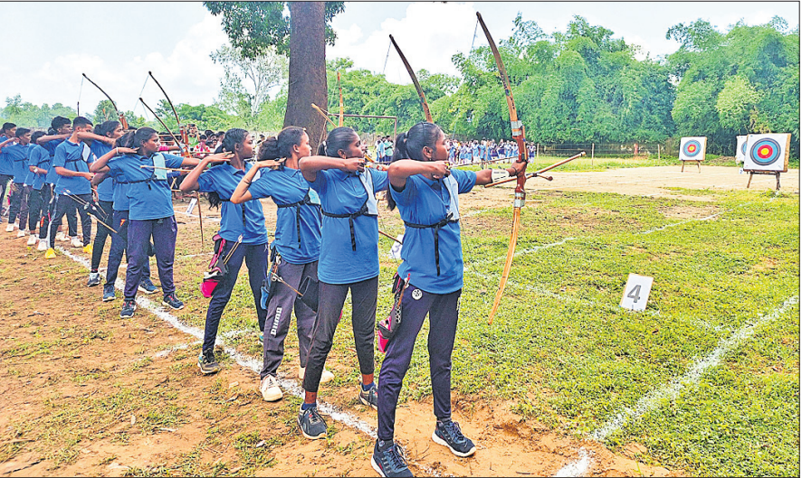
ବେଦାନ୍ତ ପକ୍ଷରୁ ଆୟୋଜିତ କ୍ରୀଡ଼ା ମହୋତ୍ସବରେ ଚାରଣାଳୀ ପ୍ରତିଯୋଗିତାର ଏକ ଦୃଶ୍ୟ ।

ଭୁବନେଶ୍ୱର, ୩୧ (ପି.ଟି.) ବେଦାନ୍ତ ଆଲୁମିନିୟମ ପକ୍ଷରୁ ରାଷ୍ଟ୍ରୀୟ କ୍ରୀଡ଼ା ଦିବସ ପରିବେଷଣରେ ସ୍ଥାନୀୟ କ୍ରୀଡ଼ା କର୍ମିତ ସହଯୋଗରେ ସପ୍ତାହବ୍ୟାପୀ ଏକ କ୍ରୀଡ଼ା ମହୋତ୍ସବ ଅନୁଷ୍ଠିତ ହୋଇଯାଇଛି। ଏଥିରେ ବାୟୋଟେକ୍ନୋଲୋଜି, ପ୍ରୋବଲ, ମାଗାଧନ, ଖାଦ୍ୟ ଓ ଅନ୍ୟାନ୍ୟ କ୍ରୀଡ଼ା ଆୟୋଜିତ ହୋଇଥିଲା। ଯୁବ ପ୍ରତିଭାକୁ ଅଂଶଗ୍ରହଣ ସହ କ୍ରୀଡ଼ା ସଂସ୍କୃତିକୁ ମଜବୁତ କରିବା ବେଦାନ୍ତ