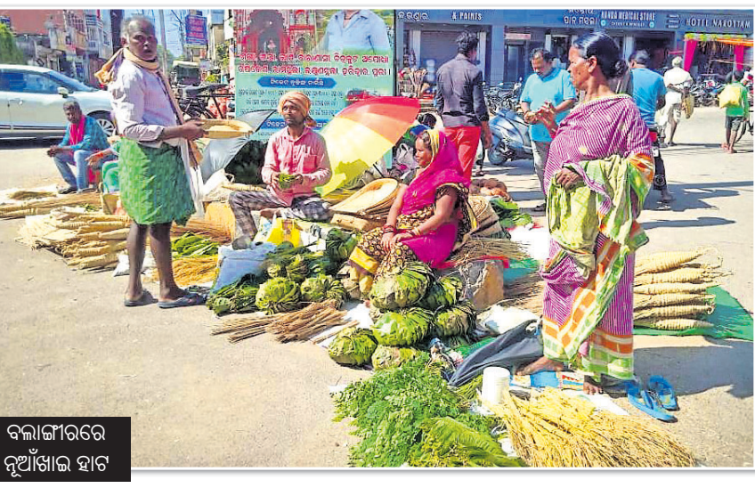
କଳାଙ୍ଗାରେ ନୂଆଁଖାଇ ହାଟ

ହୋଇଯାଏ । ଇଷ୍ଟ ଦେବଦେବୀଙ୍କୁ ଅର୍ପିତ ନୂଆଁଖୁଆ ଏହା ଅନେକ ବ୍ୟଞ୍ଜନରୂପରେ ଲୋକେ ଏକତ୍ର ବସି ଖାଆନ୍ତି । ଏହାପରେ ପରିବାରର ବୟୋଦେବୀଙ୍କୁ ଜନିଷ୍ଠମାନେ ମୁଖିଆ ମାରି ଆଶୀର୍ବାଦ ନେଇଥାନ୍ତି । ପରଞ୍ଚର ଭିତରେ ସେହି ଓ ଶ୍ରଦ୍ଧା ଓଲଟିଯାଏ । ଏହାପରେ ପଡୋଶୀ, ସମ୍ପର୍କୀୟ ଓ ଗାଁ ଲୋକଙ୍କ ସହ ଆରମ୍ଭ ହୁଏ ଲୁହାର ଭେଦ କାର୍ଯ୍ୟକ୍ରମ । ନୂଆଁଖାଇ ତିହାର ଦିନ ଗାଁ ବା ସହର ଏକ ବୃହତ୍ ପରିବାରରେ ରୁପାନ୍ତର ହୋଇଯାଏ । ମତାନ୍ତର, ମନାନ୍ତର ଭୁଲି ଜୀବନକୁ ଗତିଶୀଳ କରିବା ପାଇଁ ନୂଆଁ ସଂକଳ୍ପ ନିଅନ୍ତି । ଏହାହିଁ ନୂଆଁଖାଇର ପାରମ୍ପରିକତା, ମୂଳତତ୍ତ୍ୱ ଓ ବିଚାରବୋଧ । ତେବେ ସମୟକ୍ରମେ ନୂଆଁଖାଇ ତିହାର ପାଳନରେ ଅନେକ ପରିବର୍ତନ ଘଟିଛି । କାଳକ୍ରମେ ମୂଳ କୃଷି ପରମ୍ପରାରେ ଅନେକ ନୂଆଁ ସାମାଜିକ, ସାଂସ୍କୃତିକ ଓ ରାଜନୈତିକ ଉପକ୍ରମ ଯୋଡ଼ିହୋଇଛି । ଦିନକୁ ଦିନ ନୂଆଁଖାଇ ଉତ୍ସବ ପୁଷ୍ଟିତ ଓ ଆକର୍ଷଣୀୟ ହୋଇଉଠୁଛି । ସତ, ମାତ୍ର ଏହାର ମୂଳ ବିଚାରବୋଧ ଯେମିତି ସଂକ୍ରମିତ ହୋଇଗଲାଣି । ପ୍ରାୟ ଦୁଇବର୍ଷ ତଳେ କୋଭିଡ ମହାମାରୀ ସମଗ୍ର ମଣିଷ ଜାତିକୁ ଦେହଲାଇ ଦେଲା । ଜୀବନ ବଞ୍ଚାଇବାକୁ