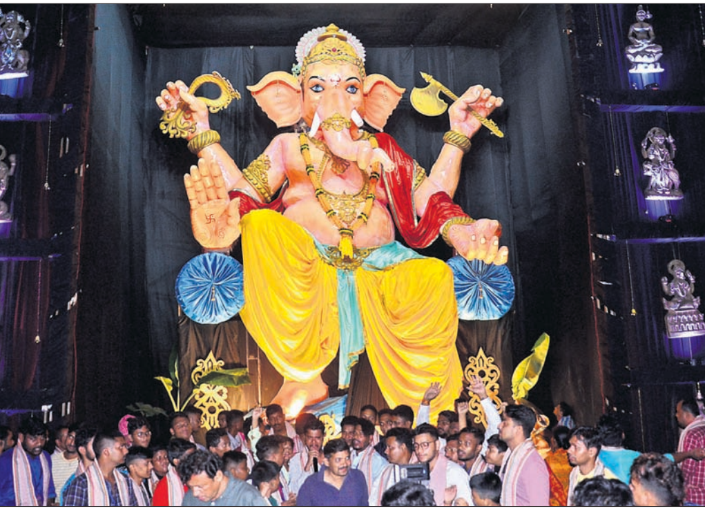
ଭୁବନେଶ୍ୱର ଶୈଳଶ୍ରୀବିହାର ତଳପଡ଼ିଆ ପୂଜା କମିଟି ପକ୍ଷରୁ ନିର୍ମିତ ୫୦ଫୁଟରୁ ଊର୍ଦ୍ଧ୍ୱ ଉଚ୍ଚତାର ଗଣେଶ ପୂର୍ଣ୍ଣ ।