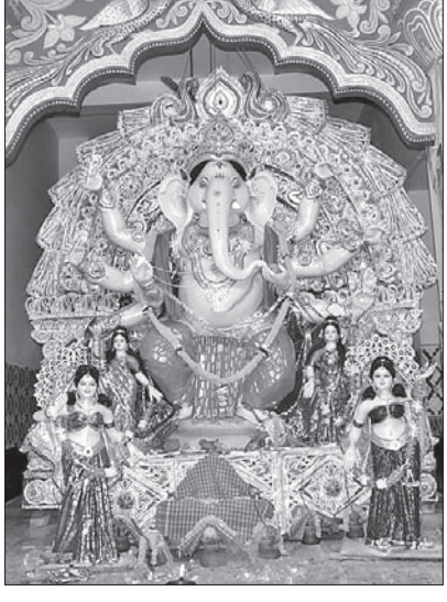
ପୁରୀ ଗଣେଶ ମାର୍ଜଣେଟ୍ଟି ଛକ