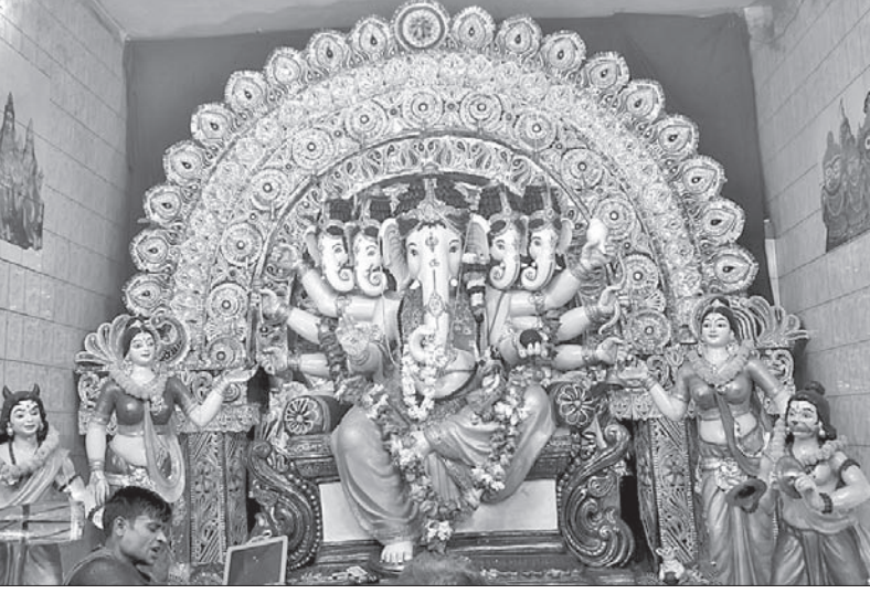
ପୁରୀ ଅଷ୍ଟମୁଖୀ ଚଉରା ଛକ