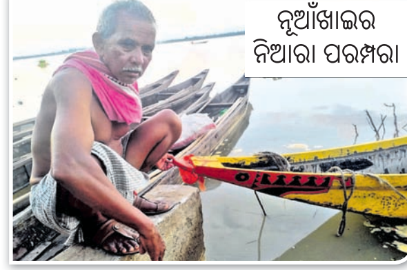
ନୂଆଁଖାଇର ନିଆରା ପରମ୍ପରା

ସାରା ପୃଥିବୀର ଜୀବନ ଲୀଳାରେ ନଈର ରହିଛି ଗୁରୁତ୍ୱପୂର୍ଣ୍ଣ ଭୂମିକା । ଏଇ ନଈକୂଳରେ ହିଁ ଯାତାୟତ ଓ ନୌବାଣିଜ୍ୟ ପାଇଁ ଗଢ଼ି ଉଠିଥିଲା ବସତି । ସେଇ କ୍ରମରେ ଓଡ଼ିଶାର ନୌବାଣିଜ୍ୟ ପରମ୍ପରା ବି ବହୁତ ପୁରୁଣା । ଆଉ ଅତୀତରେ ଓଡ଼ିଶାର ପୂର୍ବାଞ୍ଚଳ ସହ ପଶ୍ଚିମାଞ୍ଚଳର ଯୋଗାଯୋଗର ମାଧ୍ୟମ ହିଁ ଥିଲା ଏଇ ଡଙ୍ଗା । ବଡ଼ ବଡ଼ ପଥର (ଡଙ୍ଗାକୁ ଡଙ୍ଗା ପଟାରେ ଯୋଡ଼ି ଗଢ଼ା ବଡ଼ ଡଙ୍ଗା)ରେ ପରିବହନ ହେଉଥିଲା ଅତ୍ୟାବଶ୍ୟକ ସାମଗ୍ରୀ । ନଈକୁ ଆଧାର କରି ଅତୀତରୁ ଏଯାଏ ଡଙ୍ଗାପୂଜା ମେଣ୍ଟାଉଛନ୍ତି ଅନେକ ପରିବାର । ପଶ୍ଚିମ ଓଡ଼ିଶାରେ ନୂଆଁଖାଇ ବେଳେ ନଈ ଓ ଡଙ୍ଗାପୂଜାର ପରମ୍ପରା ନିଆରା । ନଈକୁ ନିର୍ଭର କରି ତନ୍ମୁଥିବା ପରିବାର ଭିତରେ ନଈ ଓ ଡଙ୍ଗା ସହ ଅନେକ ପରିବାରଙ୍କ ସମ୍ପର୍କ ସ୍ୱତନ୍ତ୍ର । ସେଇମାନଙ୍କ ଭିତରେ କେଉଟ, ରିଜାଗା ଓ ଝରାମାନଙ୍କ ଜାତିରେ ନୂଆଁଖାଇ ସମୟରେ ନଈ ଓ ଡଙ୍ଗାକୁ ପୂଜା କରିବାର ବିଧି ରହିଛି ।