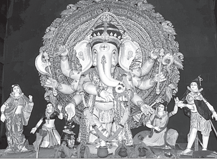
ପୁରୀ ମୋତିବାର ବଜାର ।