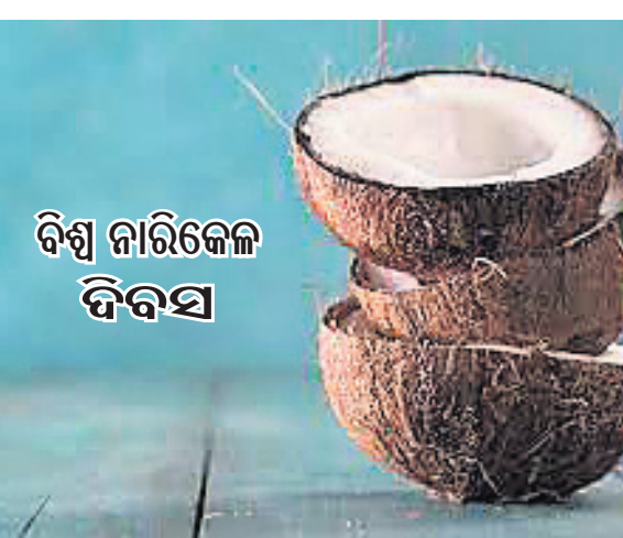
ବିଷ୍ଣୁ ନାରିକେଳ ଦିବସ

ନାରିକେଳକୁ ଶ୍ରୀଫଳ କୁହାଯାଏ। ଶ୍ରୀ ଶବ୍ଦ ଅର୍ଥ ମାତା ଲକ୍ଷ୍ମୀଙ୍କୁ ପୂଜିତ କରିଥାଏ। ଏହି ଶବ୍ଦ ମଧ୍ୟରେ ଧନଧାନ୍ୟ ସୁଖ ସମୃଦ୍ଧିର ପରିଚ୍ଛେଦନା କରାଯାଇଥାଏ। ନଡ଼ିଆ ବିଷ୍ଣୁ ଅର୍ଥନୀତିରେ ଏକ ଗୁରୁତ୍ୱପୂର୍ଣ୍ଣ ସ୍ଥାନ ହାସଲ କରିପାରିଛି। ଚେଷ୍ଟା ପ୍ରତିବର୍ଷ ୨ ସେପ୍ଟେମ୍ବରରେ ବିଷ୍ଣୁ ନାରିକେଳ ଦିବସ ପାଳନ କରାଯାଇଥାଏ। ନଡ଼ିଆର ମହତ୍ତ୍ୱ ଏବଂ ଉପକାରଣ ବିଷୟରେ ସଚେତନତା ସୃଷ୍ଟି କରିବା ପାଇଁ ଏହି ଦିବସ ପାଳନ କରାଯାଏ। ନଡ଼ିଆରେ ବିଭିନ୍ନ ଆଖି-ଫାଙ୍ଗ, ଆଖି-ଭାଇରାଳ, ଆଖି-ଅକ୍ଷତ୍ୱ ଏବଂ ଆଖି-ବ୍ୟାଘେରିଆଲ ଉପାଦାନ ରହିଛି। ନଡ଼ିଆ ଗଛ ବିଶେଷ ଭାବେ ଏସାୟ-ପ୍ରଶାନ୍ତ ମହାସାମଗ୍ରୀୟ ଅଞ୍ଚଳରେ ଅଧିକମାତ୍ରାରେ ବୃଦ୍ଧିଗୋଚର ହୋଇଥାଏ।