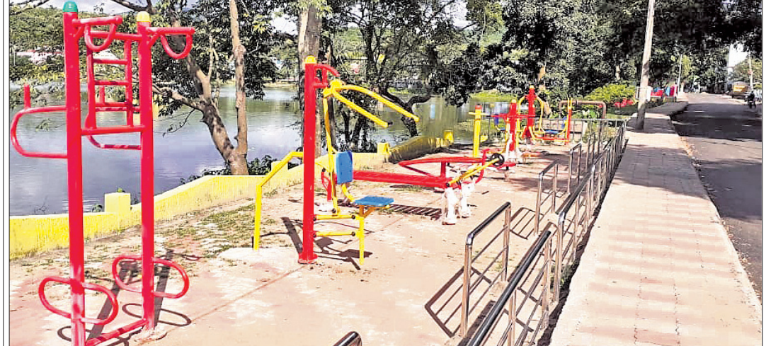
ଦେଶାନ୍ତ ଅଫିସ, ୧୮୯