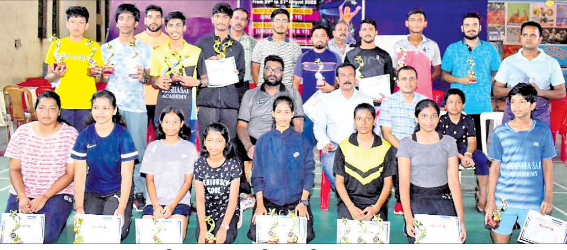
କିଳିକାପାଳ ଗହଣରେ ଚାକ୍ଷିୟନ ଖେଳାଳିଙ୍କ ସମେତ ଅନ୍ୟମାନେ।

ଦେଶାନ୍ତର କିଛି ବ୍ୟାପକ ଆୟୋଜିତ ପାଠ୍ୟପୁସ୍ତକ ପଢ଼ାବାର ଉଦ୍ଦେଶ୍ୟରେ