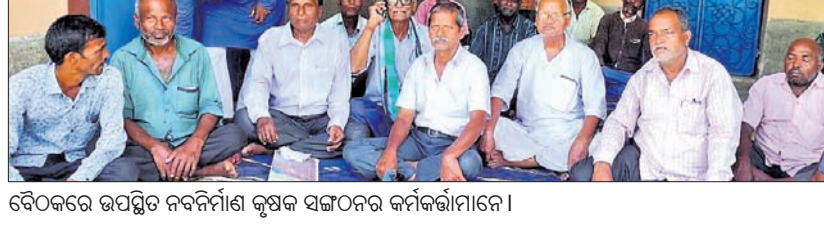
ବୈଠକରେ ଉପସ୍ଥିତ ନବନିର୍ବାଣୀ କୃଷକ ସଙ୍ଗଠନର କର୍ମକର୍ମୀମାନେ।