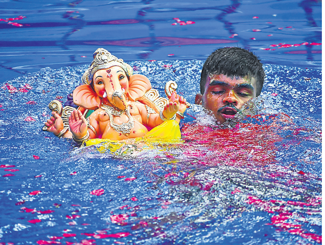
ମୁମ୍ବାଇର ଦାଦର ଚୌପାଟୀଠାରେ ନିର୍ମିତ ଏକ କୃତ୍ରିମ ପୋଖରୀରେ ଗୁରୁବାର ଜଣେ ଯୁବକ ଗଣେଶ ମୂର୍ତ୍ତି ବିସର୍ଜନ କରୁଛନ୍ତି।

ମସ୍କୋ, ୧୯ ଡ୍ରୁଲ ଚାଲିଛି। ୭ ତାରିଖ ପର୍ଯ୍ୟନ୍ତ ମୁକ୍ତେନ୍ଦ୍ର ଉପରେ ଆକ୍ରମଣ ଭିତରେ ରୁଷିଆ ବଡ଼ଧରଣର ସମରାଭ୍ୟାସରେ ଭୋଷ୍ଟୋକ୍-୨୦୨୨ ଗୁରୁବାର ଆରମ୍ଭ କରିଛି। ଏଥିରେ ଭାରତ, ଚାଇନା ସମେତ ସାଥୀବର୍ଗ ସଂଘ ଅମଳର କେତେକ ଦେଶ ଏବଂ ଲାଓସ୍, ମାଡାଗାସ୍କାର (୩୯) ତିରୁପତିର ଏକ ହସିଗାଲରେ ଆନାନ୍ଦେସିଆ ଚେକ୍ରିସିଆନ୍ ଭାବେ କାର୍ଯ୍ୟ କରୁଥିବା ଜଣାପଡ଼ିଛି।