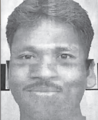
ଅଭିଯୁକ୍ତଙ୍କ ଷ୍ଟେଟ୍ ସାରା ଦେଶରେ ଚାଷ୍ୟ ଖେଳାଇଥିଲା। ଆଦେଶ ୩୪ ଜଣଙ୍କୁ ହତ୍ୟା କରି ଦଶନ୍ଧି ପର୍ଯ୍ୟନ୍ତ ଫେରାର ଥିଲେ। ୨୦୧୮ରେ ପୋଲିସ୍ ତାଙ୍କୁ ଗିରଫ କରିଥିଲା।

କାରି କରାଯାଇଛି। ମଙ୍ଗଳ ସ୍ଥଳ ହେଲେ ତାଙ୍କଠାରୁ ହତ୍ୟାକାଣ୍ଡର ସୂଚକ ମିଳିପାରେ ବୋଲି ପୋଲିସ୍ କହିଛି। ଆଶ୍ଚର୍ଯ୍ୟକର କଥା ହେଉଛି ହତ୍ୟା ପରେ ଅଭିଯୁକ୍ତ କୌଣସି କୁତ୍ସାପାତ ନ କରି କେବଳ ତାଙ୍କ ମୋବାଇଲ୍ ଫୋନ୍ ଦେଇଯାଇଛନ୍ତି। ଏହା ପୂର୍ବରୁ ସେଥିରୁ ସିନ୍ଧୁଗାଡ଼ି କାଢ଼ି ସେଠାରେ ହିଁ ଫିଙ୍ଗି ଦେଉଛନ୍ତି। ଅଭିଯୁକ୍ତ ଯାଇକୋ କିଲର ହୋଇଥିବାରୁ କୌଣସି ସୂଚନା ନ ଥିବା ପୋଲିସ୍ କହିଛି। ଏହାପୂର୍ବରୁ ମଧ୍ୟପ୍ରଦେଶର ସିରିଏଲ କିଲର ଆଦେଶ ଖାତା ତ୍ରୁଟି ହୋଇଥିବା ଏବଂ କୁଳରକୁ ଗାଡ଼ରେ କରି ହତ୍ୟାକରିବା ଘଟଣା ସେତେବେଳେ