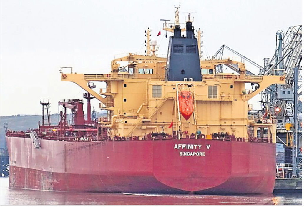
ଅଟକିଯିବାକୁ କେନାଲ ୬ ଦିନ ପର୍ଯ୍ୟନ୍ତ ଅବରୋଧ ହୋଇ ରହିଥିଲା। ଗ୍ରୀସୀକ ଜାମ୍ ଫଳରେ ଦିନକୁ ୯ ବିଲିୟନ ଡଲାର ବୋର୍ ଏବଂ ଅର୍ଥମୂଲ୍ୟ ମନ୍ତ୍ର ସାହାଯ୍ୟରେ ବାଣିଜ୍ୟିକ କ୍ଷତି ହୋଇଥିଲା। ୧୪ ଟନ୍ ଉଚ୍ଚ ଜାହାଜକୁ ହଟାଯାଇଥିଲା।