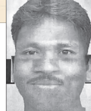
ଅଭିଯୁକ୍ତଙ୍କ ଷ୍ଟେଟ୍ ସାରା ଦେଶରେ ଚାଞ୍ଚଳ୍ୟ ଖେଳାଇଥିଲା। ଆଦେଶ ୩୪ ଜଣଙ୍କୁ ହତ୍ୟା କରି ଦଶନ୍ଧି ପର୍ଯ୍ୟନ୍ତ ଫେରାର ଥିଲେ। ୨୦୧୮ରେ ପୋଲିସ ତାଙ୍କୁ ଗିରଫ କରିଥିଲା।

କାରି କରାଯାଇଛି। ମଙ୍ଗଳ ସୁନ୍ଦ ହେଲେ ତାଙ୍କଠାରୁ ହତ୍ୟାକାଣ୍ଡର ସୁରାକ ମିଳିପାରେ ବୋଲି ପୋଲିସ କହିଛି। ଆଶ୍ଚର୍ଯ୍ୟକର କଥା ହେଉଛି ହତ୍ୟା ପରେ ଅଭିଯୁକ୍ତ କୌଣସି ଲୁଚ୍ଚପାଟ ନ କରି କେବଳ ତାଙ୍କ ମୋବାଇଲ ଫୋନ୍ ଦେଇଯାଇଛନ୍ତି। ଏହା ପୂର୍ବରୁ ସେଥିରୁ ସିନ୍ଧୁଗାଡ଼ି କାଢ଼ି ସେଠାରେ ହିଁ ଫିଙ୍ଗି ଦେଉଛନ୍ତି। ଅଭିଯୁକ୍ତ କୌଣସି ସୂଚନା ନ ଥିବା ପୋଲିସ କହିଛି। ଏହାପୂର୍ବରୁ ମଧ୍ୟପ୍ରଦେଶର ସିରିଏଲ କିଲର ଆଦେଶ ଖାମ୍ବା ବ୍ରହ୍ମ ବ୍ରାଜଭର ଏବଂ କୁନରଙ୍କୁ ଗାରେଟ କରି ପୁରେନ୍ ଆଧାରରେ ଅଭିଯୁକ୍ତଙ୍କ ଷ୍ଟେଟ୍