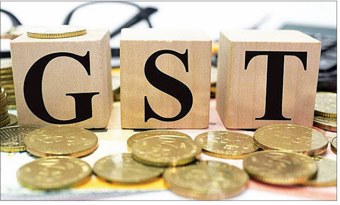
ଜିଏସ୍ଟି ୨୪,୨୧୦ କୋଟି ଟଙ୍କା ରହିଥିବା ବେଳେ ଗାତମସିନା କିଏସ୍ଟି ୩୦,୯୫୧ କୋଟି ଟଙ୍କା ରହିଛି।