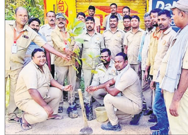
ଡ୍ରାଇଭର ମହାସଂଘ ପକ୍ଷରୁ ଚାରାରୋପଣ କରାଯାଇଛି।