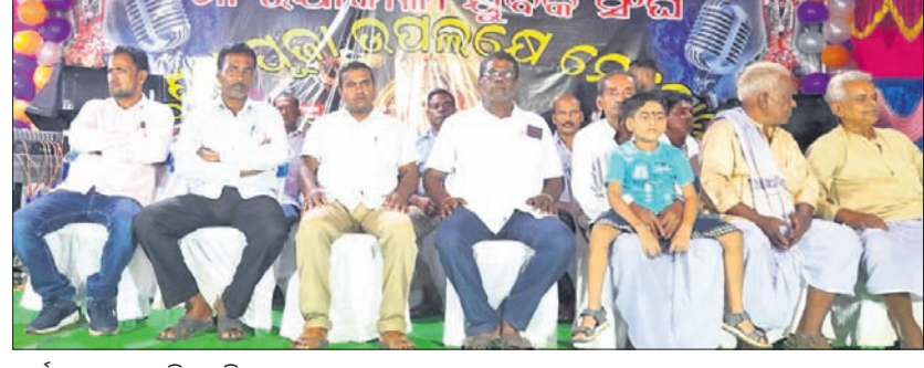
କାର୍ଯ୍ୟକ୍ରମରେ ଉପସ୍ଥିତ ଅତିଥି।