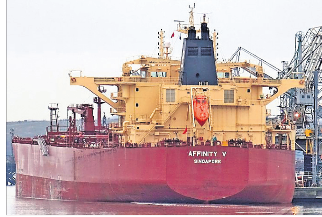
ଅଟକିଯିବାରୁ କେନାଲ ୬ ଦିନ ପର୍ଯ୍ୟନ୍ତ ଅବରୋଧ ହୋଇ ରହିଥିଲା। ଗ୍ରୀକ୍ କାମ୍ ଫଳରେ ଦିନକୁ ୧ ବିଲିୟନ ଡଲାର ବୋର୍ ଏବଂ ଅର୍ଥମୂଲ୍ୟ ମନ୍ତ୍ର ସାହାଯ୍ୟରେ ବାଣିଜ୍ୟିକ କ୍ଷତି ହୋଇଥିଲା। ୧୪ ଟଙ୍କା ଲାଭ କରୁଥିବା ଜାହାଜକୁ ହତାହତ ହୋଇଥିଲା।