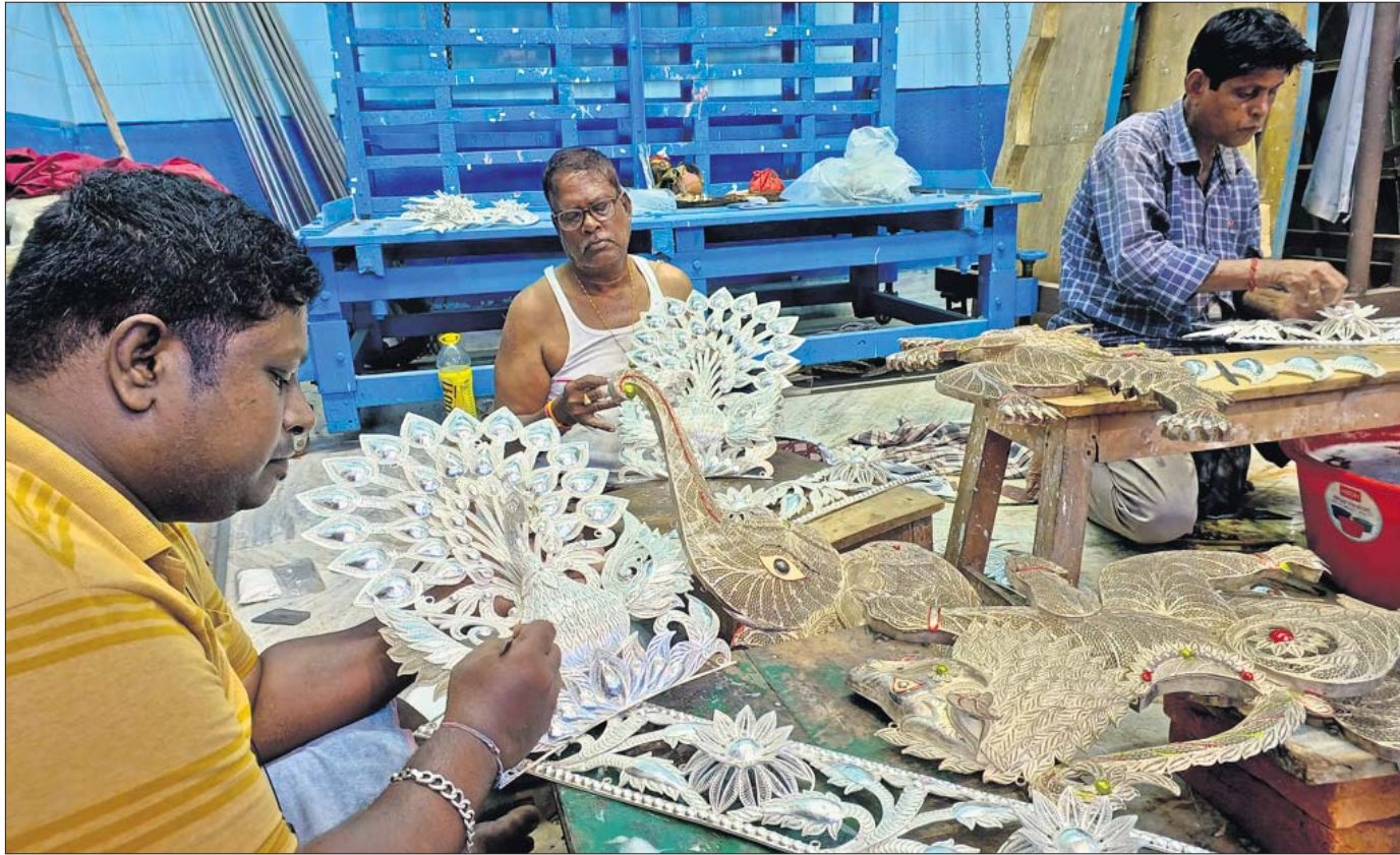
ଦଶହରା ପ୍ରସ୍ତୁତି: କଟକ ରୁଢ଼ୀ ଠାକୁରାଣୀ ପୂଜା ମଣ୍ଡପରେ ଚାନ୍ଦିନୀଦେବୀଙ୍କୁ ବ୍ୟବହୃତ ଚାନ୍ଦି ଅଳଙ୍କାରକୁ ଗୁରୁବାର କାରିଗରମାନେ ସଫା କରୁଛନ୍ତି।