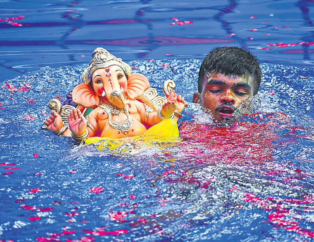
ପୁଣ୍ୟାଳୟ ଦାବର ଚୌପାଟୀଠାରେ ନିର୍ମିତ ଏକ କୃତ୍ରିମ ପୋଖରୀରେ ଗୁରୁବାର ଜଣେ ଯୁବକ ଗଣେଶ ମୂର୍ତ୍ତି ବିସର୍ଜନ କରୁଛନ୍ତି।