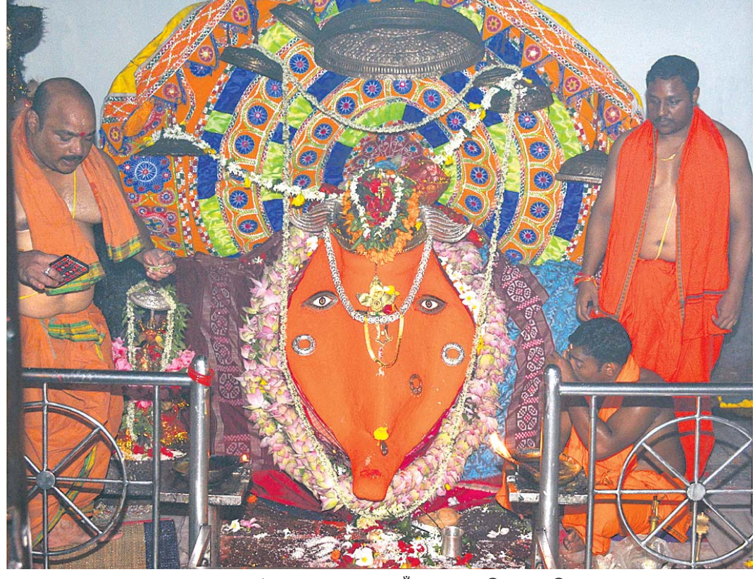
ସମଲେଇକୁ ମା' ସମଲେଇଶ୍ରୀଙ୍କଠାରେ ନୂଆଁଖାଇ ମହାଆଳତି କରାଯାଇଛି।