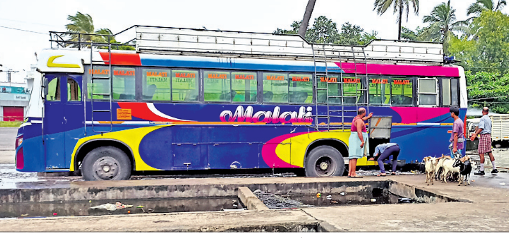
ଗାଡ଼ି ପରିବହନ, ରାଜ୍ୟ ସୀମା ଗେଟ୍ ଦେଇ ଓ ଟୋଲ ଗେଟ୍ ଖର୍ଚ୍ଚକୁ ବର୍ଦ୍ଧିବା ପାଇଁ କଲିକତାରୁ ପାରାଦୀପ ଆସୁଥିବା ଏକ ଘରୋଇ ବସ୍ ଟିକିରେ ହେଇ ଅଣାଯାଇଛି । ହେଲିକୃତିକୁ ବ୍ୟବହାରୀମାନେ ପାରାଦୀପ ବସ୍ଷ୍ଟାରେ ଗୁରୁବାର ବସ୍ତୁ ବାହାର କରୁଛନ୍ତି ।