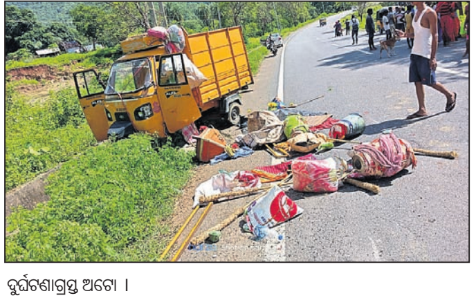
ଦୁର୍ଘଟଣାଗ୍ରସ୍ତ ଅଟେ ।

ବଲସକୁମ୍ଭା, ୧୯ କନ୍ଧମାଳ ଜିଲ୍ଲା ଖଜୁରାପଡ଼ା ବ୍ଲକ୍ ଅନ୍ତର୍ଗତ ପୁରୁକୂମ୍ଭା ପୋଲିସ ଠାନୁ ଅନ୍ତର୍ଗତ ଗୋଟାପୁଣ୍ଡା ଗ୍ରାମ ନିକଟରେ ନାମ ସଂକୀର୍ତ୍ତନ ଦଳ ଗାଡ଼ି ଦୁର୍ଘଟଣା ଘଟି ଅନେକ ଗୁରୁତର ଆହତ ହୋଇଛନ୍ତି।