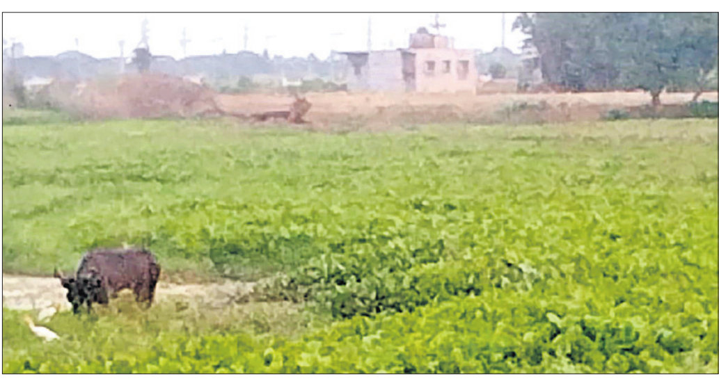
ଗୋବରୀ ନଦୀକୁ ଜୀବନଦଖଲ କରି ଘର ନିର୍ମାଣ କରାଯାଇଛି ।

ପଟ୍ଟାମୁଣ୍ଡା ପୌରାଞ୍ଚଳ ଦେଇ ପ୍ରବାହିତ ହେଉଥିବା ଗୋବରୀ ନଦୀ କ୍ରମଶଃ ପୋତି ହୋଇପଡିଛି । ଏହି ନଦୀ ୬୦ ଦଶନ୍ଧି ପୂର୍ବରୁ ଚିରସ୍ରୋତା ବ୍ରାହ୍ମଣୀ ନଦୀରୁ ବାହାରି ପ୍ରାୟ ୩୦ କିମି ଅତିକ୍ରମ କଲା ପରେ ବଙ୍ଗୋପସାଗରରେ ମିଶିଛି । ଏହି ନଦୀ ଚିରସ୍ରୋତା ସହ ନୌଚଳାଚଳ ପରିବହନ ପାଇଁ ଉଦ୍ଦିଷ୍ଟ ଥିଲା । ମାତ୍ର ୧୮୬୦ ମସିହାରେ କଟକ-ଗାନ୍ଧିବାଲି ରାସ୍ତା ତିଆରି ହେବା ସମୟରେ ପଟ୍ଟାମୁଣ୍ଡାଠାରେ ବ୍ରାହ୍ମଣୀ ଗୋବରୀ ନଦୀର ସଂଯୋଗ ପଥକୁ ବନ୍ଦ କରି ଦିଆଯାଇଥିଲା । ଏହା ବ୍ରାହ୍ମଣୀ ବନ୍ୟା ନିରୋଧକ ଦଶହଜାରି ବନ୍ଧ ଭାବେ ମାନ୍ୟ ରହିଛି । ତେବେ ପଟ୍ଟାମୁଣ୍ଡାଠାରୁ ଗଣାକିଆ ପର୍ଯ୍ୟନ୍ତ ପ୍ରାୟ ୧୬ କିମି ବ୍ୟାପୀ ଗୋବରୀ ନଦୀ କ୍ରମଶଃ ପୋତି ହୋଇପଡିଥିବାରୁ ଜୀବନଦଖଲକାରୀଙ୍କ କବ୍‌ଜାକୁ ଚାଲିଯାଇଛି । ଫଳରେ ଗୋବରୀ ନଦୀ ଉପରେ ନିର୍ଭର କରୁଥିବା ଉଭୟପାର୍ଶ୍ୱର ହଜାର ହଜାର ଏକର ଭୂମି ଚାଷକର୍ତ୍ତା ପାଇଁ ବିନା ପଡିଆ ପଡୁଛି । ଏଥିଯୋଗୁ ଲୋକମାନଙ୍କର ଅର୍ଥନୈତିକ ଓ ସାମାଜିକ ବିକାଶ ହୋଇପାରୁନାହିଁ । ଏହାର ପାର୍ଶ୍ୱବର୍ତ୍ତୀ ଅଞ୍ଚଳର ଜନସାଧାରଣଙ୍କ ସତେଜତା ଅଭାବ ସାଙ୍ଗକୁ ବିଭାଗୀୟ କର୍ତ୍ତୃପକ୍ଷଙ୍କ