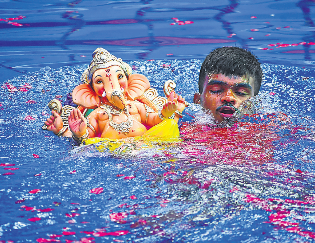
ପୂୟାଜର ଦାବର ଚୌପାଟୀଠାରେ ନିର୍ମିତ ଏକ କୃତ୍ରିମ ପୋଖରୀରେ ଗୁରୁବାର ଜଣେ ଯୁବକ ଗଣେଶ ମୂର୍ତ୍ତି ବିସର୍ଜନ କରୁଛନ୍ତି।