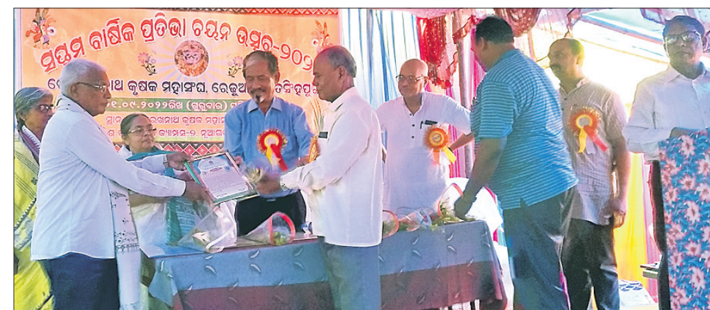
ଅତିଥିମାନେ ଭଲକେଶନା କାର୍ଯ୍ୟ କରିଥିବା ବ୍ୟକ୍ତି ବିଶେଷଙ୍କୁ ସମ୍ବର୍ଦ୍ଧିତ କରୁଛନ୍ତି ।