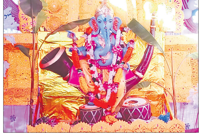
ବିରିତି ବ୍ଲକ୍ ଅନ୍ତର୍ଗତ ଗୋପାଳନା ପୂଜା କମିଟି ପକ୍ଷରୁ ତିନିଲୋଠାରେ ଆୟୋଜିତ ଗଣେଶ ପୂଜା ।