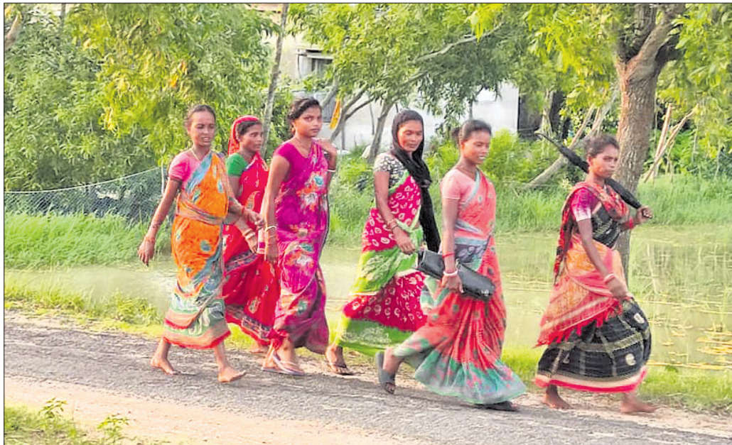
ଆଦିବାସୀ ମହିଳାମାନେ କାମ କରିବାକୁ ଯାଉଛନ୍ତି।