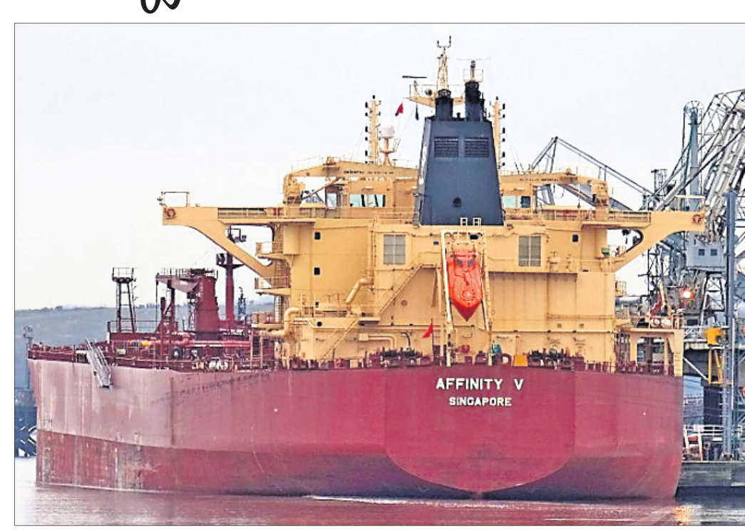
ଅଟକିଯିବାରୁ କେନାଲ ୬ ଦିନ ପର୍ଯ୍ୟନ୍ତ ଅବରୋଧ ହୋଇ ରହିଥିଲା। ଗ୍ରୀସିକ ଜାମ୍ ଫଳକେ ଦିନକୁ ୧ ବିଲିୟନ ଡଲାର ବୋର୍ ଏବଂ ଅର୍ଥମୂଲ୍ୟ ମନ୍ତ୍ର ସାହାଯ୍ୟରେ ବାଣିଜ୍ୟିକ କ୍ଷତି ହୋଇଥିଲା। ୧୪ ଟନ୍ ଉଚ୍ଚ ଜାହାଜକୁ ହଟାଯାଇଥିଲା।