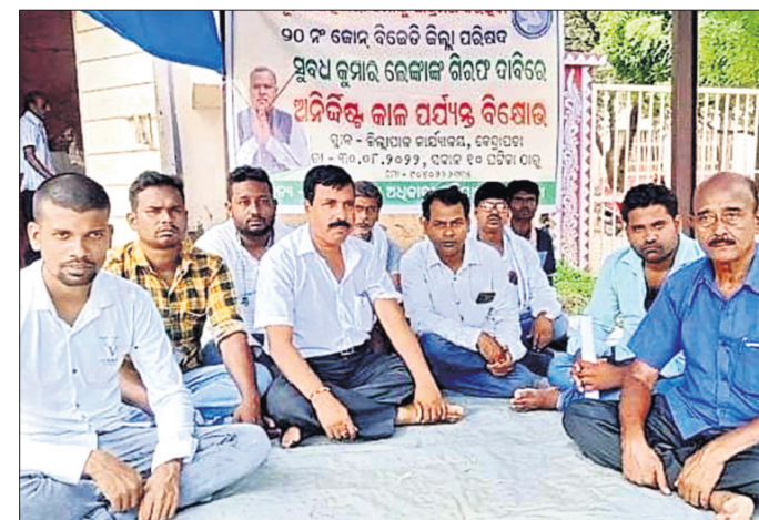
ଧାରଣା ଦେଇଥିବା ଜନକର ଜେନାଙ୍କ ସହ ଅନ୍ୟମାନେ ।