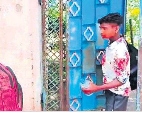
ଭୟରେ ହଷ୍ଟେଲ ଛାତ୍ରଛାତ୍ରୀ ଛାତ୍ରୀଛାତ୍ରୀ