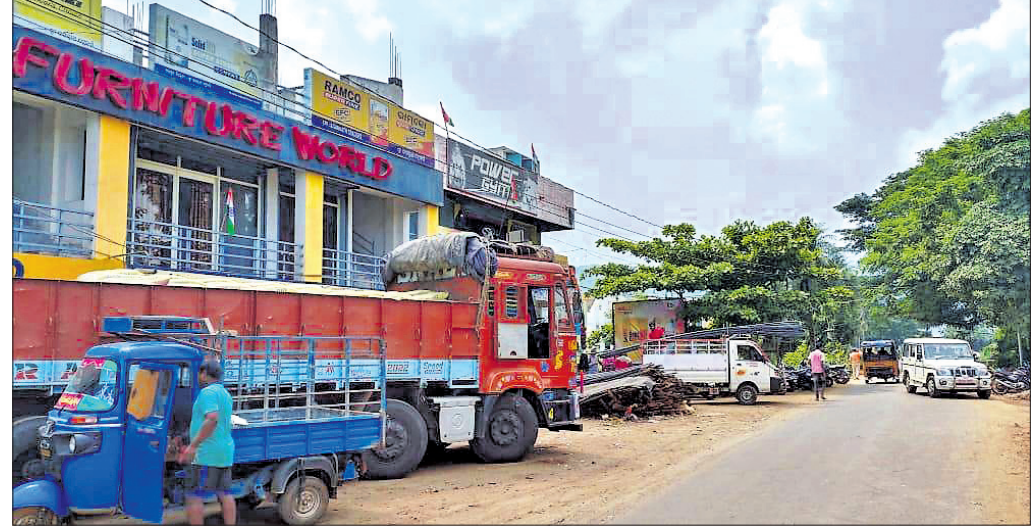
ମୁଖ୍ୟରାଷ୍ଟ୍ରା କଡ଼ରେ ଥିବା ମାଲ୍ ବୋର୍ଡିଂ ଟ୍ରକ୍ ।

ପ୍ରଶାନ୍ତ ପ୍ରଧାନଙ୍କୁ ସର୍ବଜି କୁଲର ବଣ୍ଟନ କରାଯାଇଛି। ପୁଲବାଣୀ ବିଧାୟକ ଅଜୟ କନ୍ଧର ଏହି କୁଲର ପ୍ରଦାନ କରିଥିଲେ। ତିନୋଟି ବ୍ଲକ୍ ଖଜୁରାପଡ଼ା, ପୁଲବାଣୀ, ଫିରିଙ୍ଗିଆର ୧୦ ଜଣ ଚାଷୀଙ୍କୁ ଏହି ସର୍ବଜି କୁଲର ବଣ୍ଟନ କରାଯାଇଛି।