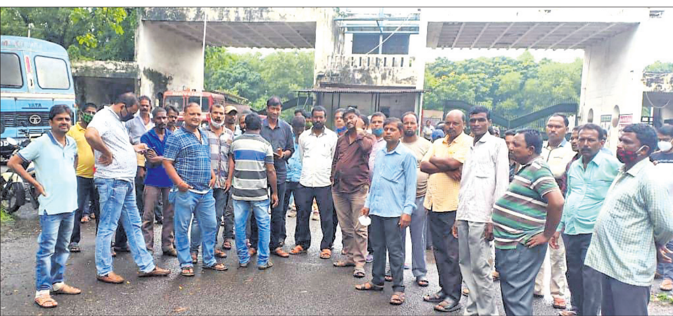
କର୍ମଚାରୀମାନେ ବିକ୍ଷୋଭ ପ୍ରଦର୍ଶନ କରୁଛନ୍ତି।

ମେସୋ ଷ୍ଟିଲ୍ କାରଖାନାରେ କର୍ମଚାରୀମାନେ ଗୁରୁବାର କାରଖାନା ପାଟକରେ ତାଲା ପକାଇ ପୁଣି ବିକ୍ଷୋଭ ପ୍ରଦର୍ଶନ କରିଛନ୍ତି। ବାରମ୍ବାର ପ୍ରଶାସନ ଓ କାରଖାନା କର୍ତ୍ତୃପକ୍ଷଙ୍କ ସହ ଆଲୋଚନା ହେଉଥିଲେ ମଧ୍ୟ କାରଖାନା ଚାଲିବା ଏବଂ ବକେୟା ପାଉଣା ମିଳିବା ନେଇ କୌଣସି ସଂକେତ ମିଳିନାହିଁ। କର୍ମଚାରୀଙ୍କ ଅଭିଯୋଗ ମୁତାବକ, କେବଳ ପ୍ରଶାସନିକ ଆଶ୍ୱାସନା ବ୍ୟତୀତ କୌଣସି ନିଷ୍ପତ୍ତି ବାହାରି ପାରୁନାହିଁ। ଅଗଷ୍ଟ ୨୨ରେ କର୍ମଚାରୀ କାରଖାନା ଚାଲିବା ଏବଂ ବକେୟା ପାଉଣା ଦାବିରେ ଆନ୍ଦୋଳନ କରିବା ସହିତ କାରଖାନାକୁ କୋଇଲା ନେଇ ଆସୁଥିବା ଗାଡ଼ି ଗୁଡ଼ିକୁ ଅବକ ରଖିଥିଲେ। ସେତେବେଳେ ପୋଲିସ ଓ ଜିଲ୍ଲା ପ୍ରଶାସନର ଅନୁରୋଧରେ ଆନ୍ଦୋଳନ ସାମୟିକ ଭାବେ ପ୍ରତ୍ୟାହତ ହୋଇଥିଲା। ପରେ ଗତ ମାସ ୨୫ ତାରିଖରେ ଏଟିଏମ୍ କାର୍ଯ୍ୟାଳୟରେ ବସିଥିବା ତ୍ରିପାକ୍ଷିକ ବୈଠକରେ କର୍ମଚାରୀଙ୍କ ଦାବି ନେଇ ଆଲୋଚନା ହୋଇଥିଲା। ତେବେ ସେ ପର୍ଯ୍ୟନ୍ତ