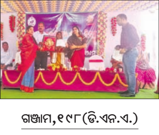
ଗଞ୍ଜାମ, ୧୯ (ଡି.ଏନ୍.ଏ.)

ଗଞ୍ଜାମ ଏନ୍.ଏ.ସି. ପକ୍ଷରୁ ପାଳିତ ହୋଇଛି ସ୍ୱାସ୍ଥ୍ୟ ଶାସନ ଦିବସ। ଏହି ଅବସରରେ ଏନ.ଏ.ସି. ପ୍ରଶାସନ ପୁଲ୍ଲତୋଳା ଗ୍ରାମର ଅଜିତା ମହାବିଦ୍ୟାଳୟ ଶ୍ରେଷ୍ଠ ସ୍ୱଚ୍ଛସାଥୀ ଭାବେ ପୁରସ୍କୃତ କରିଛି।