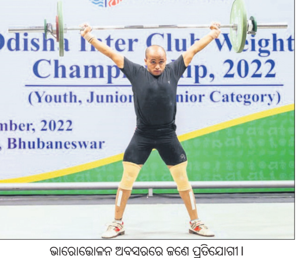
ଭାରୋତ୍ତୋଳନ ଅବସରରେ ଜଣେ ପ୍ରତିଯୋଗୀ ।