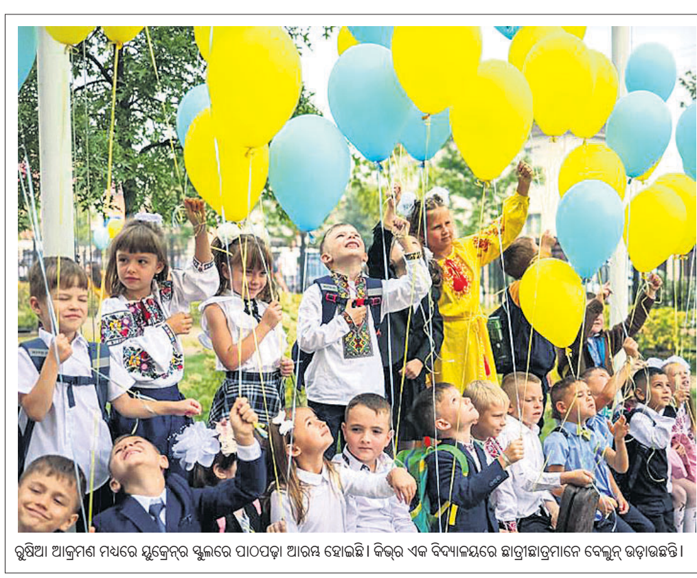
ରୁଷିଆ ଆକ୍ରମଣ ମଧ୍ୟରେ ଯୁକ୍ତେନ୍ଦ୍ର ସ୍କୁଲରେ ପାଠପଢ଼ା ଆରମ୍ଭ ହୋଇଛି। କିନ୍ତୁ ଏକ ବିଦ୍ୟାଳୟରେ ଛାତ୍ରାଛାତ୍ରୀମାନେ ବେଲୁନ୍ ଉଡ଼ାଉଛନ୍ତି।

ଆଫଗାନିସ୍ତାନର ହେରାତ୍ ସହରରେ ଥିବା ଏକ ମସ୍ଜିଦରେ ଶୁକ୍ରବାର ବିସ୍କୋରଣ ଘଟି ୧୮ ଜଣ ନିହତ ହୋଇଛନ୍ତି। ଅନ୍ୟମ ୨୧ ଜଣ ଆହତ ହୋଇଛନ୍ତି।