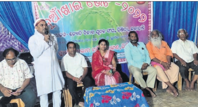
କାର୍ଯ୍ୟକ୍ରମରେ ମଞ୍ଚାସୀନ ଅତିଥିବୃନ୍ଦ।