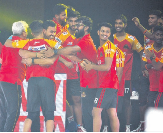
ବିଜୟ ହାସଲ ପରେ ଉଲ୍ଲାସିତ ଓଡ଼ିଶା ଜଗରନଟ୍ସ ଦଳ ।