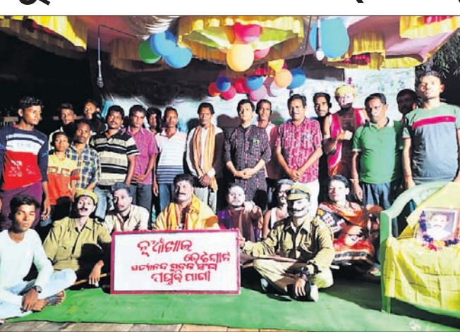
ନୂଆଁଖାଇ ଭେଟପାଟ କାର୍ଯ୍ୟକ୍ରମରେ ମଞ୍ଚାସୀନ ଅତିଥି ଓ ସଂଘର କର୍ମକର୍ମୀ।