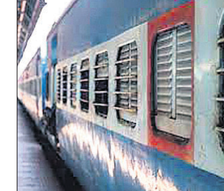
ଜବରଦସ୍ତି ଚାଣି ନେଇ ବାହାରକୁ ଫିଙ୍ଗି ଦେଇଥିଲେ। ପରେ ନିଜେ ଟ୍ରେନ୍ରୁ ଡେଇଁ ଖସିଯିବାକୁ ଉଦ୍ୟମ କରିଥିଲେ।

ଅଭିଯୁକ୍ତ ସମାପ(୨୭), ସେ ଏବଂ ତାଙ୍କ ପୁଅ ଥିଲେ। କେହି ନ ଥିବାର ସୂଚନା ନେଇ ସମାପ ତାଙ୍କୁ ବଳାକ୍ଲାର ଉଦ୍ୟମ କରିଥିଲେ।