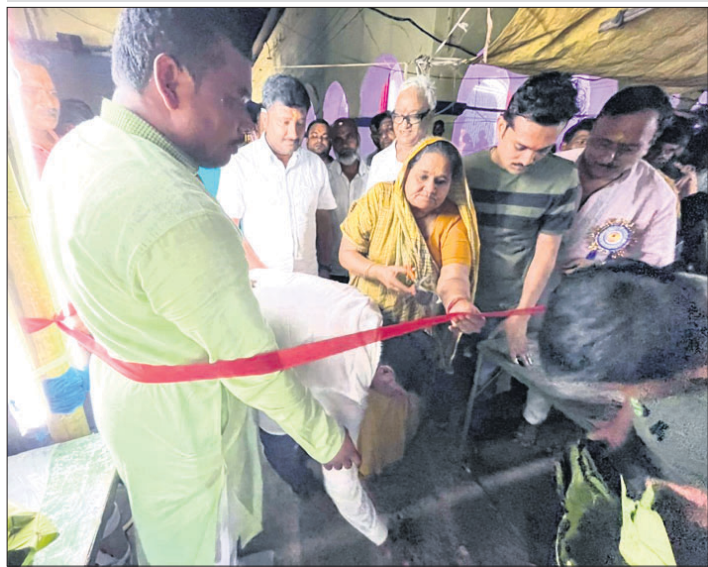
ଅନୁପ୍ରସାଦ ବିତରଣର କାର୍ଯ୍ୟକ୍ରମ 'ଆନନ୍ଦ ବଜାର' ର ଶୁଭାରମ୍ଭ କରାଯାଇଛି।

ଲୁହାଣପାଟଣା, ୨୯ (ଡି.ଏନ.ଏ.): ସୁନ୍ଦରଗଡ଼ ଜିଲ୍ଲା ଲୁହାଣପାଟଣା ବ୍ଲକ ଅନ୍ତର୍ଗତ ଦର୍ମ୍ୟ ପଞ୍ଚାୟତର ୧୪୩ ନମ୍ବର ଜାତୀୟ ରାଜପଥ ବିରୋଧୀ ଗୋଲେରୀରେ ଶୁକ୍ରବାର ଅପରାହ୍ଣ ପ୍ରାୟ ଦୁଇଟାରେ ଦୁର୍ଘଟଣା ଘଟିଛି। ବ୍ରଜ ଚଳେ ଚାପିହୋଇ ଚାଲିକି ମୃତ୍ୟୁ ଘଟିଛି। କୋରଡ଼ା ଖଣି ଅଞ୍ଚଳରୁ ଲୁହାଣପାଟଣା ବୋହେ ଓଡ଼ି ୧୪୩-ଏ-୩୬୫୭ ବ୍ରଜ ରାଜରକେଲ ପଟେ ବୁଡ଼ ଗତିରେ ଯାଉଥିବାବେଳେ ବିରୋଧୀ ଗୋଲେରୀ ଠାରେ ଭାରସାମ୍ୟ ହରାଇ ରାସ୍ତା କଡ଼ରେ ବାଡେଇ ହୋଇଥିଲା। ଫଳରେ ଚାଲିକି ମୃତ୍ୟୁ ଘଟିଥିଲା। ଖବରପାଇ ଚାରିପୋଖି ଯୋଗାଯୋଗ ସମସ୍ତେ ବନ୍ଦ ହୋଇଥିଲା। ପହଞ୍ଚି ମୃତଦେହ ଉଦ୍ଧାର କରି ଗଣେଶ ଉପାସନା ଚଳିଥିଲା। ଫଳରେ ଚାଲିକି ମୃତ୍ୟୁ ଘଟିଥିଲା। ଖବରପାଇ ଚାରିପୋଖି ଯୋଗାଯୋଗ ସମସ୍ତେ ବନ୍ଦ ହୋଇଥିଲା। ପହଞ୍ଚି ମୃତଦେହ ଉଦ୍ଧାର କରି ଗଣେଶ ଉପାସନା ଚଳିଥିଲା। ଫଳରେ ଚାଲିକି ମୃତ୍ୟୁ ଘଟିଥିଲା। ଖବରପାଇ ଚାରିପୋଖି ଯୋଗାଯୋଗ ସମସ୍ତେ ବନ୍ଦ ହୋଇଥିଲା। ପହଞ୍ଚି ମୃତଦେହ ଉଦ୍ଧାର କରି ଗଣେଶ ଉପାସନା ଚଳିଥିଲା।