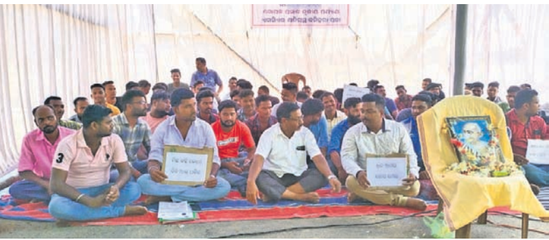
ହିଲୁକା ଏରିଆ ଅଫିସ ସମ୍ମୁଖରେ ଶତଗ୍ରହଣମାନେ ଧାରଣାରେ ବସିଛନ୍ତି।

କରାଯାଇଛି। ଏଥିପାଇଁ ଆଇନଶୁଖାଳୀ ପରିସ୍ଥିତି ଉପସ୍ଥିତ କେବଳ ଏମିତିକି କର୍ତ୍ତୃପକ୍ଷ ଦାୟୀ ରହିବ ବୋଲି ଆନ୍ଦୋଳନକାରୀମାନେ ପ୍ରକାଶ କରିଛନ୍ତି।