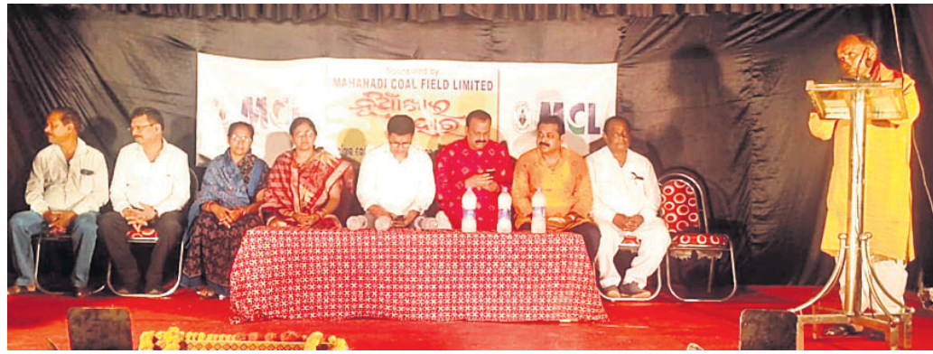
ଖଜୁରଚିକ୍ରା ନୂଆଁଖାଇ ଭେଟପାଟରେ ମଞ୍ଚାସୀନ ଅତିଥିବୃନ୍ଦ।