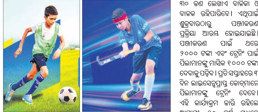
ଭୁବନେଶ୍ୱର, ୨୧ (ବ୍ରାହ୍ମା ପ୍ରତିନିଧି)

ଏବଂ ରୋମାଞ୍ଚକ କରିବ। ଆଗାମୀ ଦିନରେ ଯଦି ବିଦେଶୀ ଖେଳାଳିଙ୍କୁ ସାମିଲ କରାଯିବ ତେବେ ବିଭିନ୍ନ ଦୃଷ୍ଟିକୋଣକୁ ବିଚାରକୁ ନେଇ ବିଶେଷ କରି ଯେପରି ଭାରତୀୟ ଖେଳାଳିମାନେ ଅଧିକ ଉପକୃତ ହୋଇପାରିବେ ତାକୁ ଦୃଷ୍ଟିରେ ରଖାଯିବ।