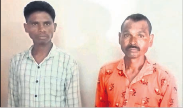
ଗିରଫ ୨ ମାଉସାଦୀ।

ମାଲକାନଗିରି ଜିଲା ସାମାନ୍ୟ ଛତିଶଗଡ଼ର ବିଜାପୁର ପୋଲିସର ସହ ଅପରେଶନ ବେଳେ ନାଡ଼ପାଲି ଜଙ୍ଗଲରୁ ୨ ଜଣ ମାଉସାଦୀ ଗିରଫ ହୋଇଛି।