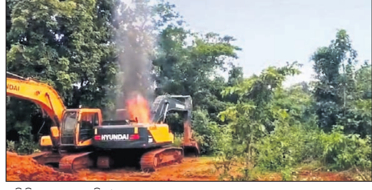
ଭାଙ୍ଗି ଦିଆଯାଇଥିବା ମେଶିନ।

କେନ୍ଦୁଝର, ୨୯ (ସ.ପ୍ର.) କେନ୍ଦୁଝର ଜିଲ୍ଲା ନୟାକୋଟ ଥାନା ଅଧୀନ କାଦକଳା ଗ୍ରାମ ନିକଟ ଜମିସିପଟିଠାରେ ସୁରି ପାଇଁ ଲାଜନ ବିଛାଉଣା କାମ କରୁଥିବା ମେସର୍ସ କେସିଏସ୍ ପ୍ରୋଜେକ୍ଟ କମ୍ପାଣିର ଶୁକ୍ରବାର ଅପରାହ୍ନରେ ପୁରୁଣାମାନେ ଭଙ୍ଗାଚୁଲ୍ଲା କରିବା ସହ ମେଶିନ ପୋଡ଼ିଦେଇଛନ୍ତି। ପୁରୁଣାମାନେ ଏକ ମାଟିଖୋଳା ମେଶିନକୁ ପୋଡ଼ିଦେଇଥିବା ବେଳେ ଜେନେରେଟର, ଅନ୍ୟ ଗାଡ଼ି ଭାଙ୍ଗି ଦେଇଛନ୍ତି। ଏହି ସମୟରେ କମ୍ପାଣିରେ କେହି ନ ଥିଲେ ବୋଲି କୁହାଯାଉଛି। ତେବେ ଏନେଇ ଏସ୍ପିସିପି ପି.କେ. ଚପୋ ଓ ଅନ୍ୟ ପୋଲିସ୍ ଅଧିକାରୀ ଯୋଗ୍ୟ ସହ ଘଟଣାସ୍ଥଳକୁ ଯାଇ ସ୍ଥିତି ଅନୁଧ୍ୟାନ କରିଛନ୍ତି। ଏହାକୁ ନେଇ ସ୍ଥାନୀୟ ଅଞ୍ଚଳରେ ଭବେଜନା ଲାଗି ରହିଥିବାରୁ ପୋଲିସ୍ ନଜର ରଖିଛି। ତଦନ୍ତ ପରେ କାର୍ଯ୍ୟାନୁଷ୍ଠାନ ଗ୍ରହଣ କରାଯିବ ବୋଲି ଏସ୍ପିସିପି ଚପୋ କହିଛନ୍ତି। ଏନେଇ ମେସର୍ସ କେସିଏସ୍ ସଂସ୍ଥା ପକ୍ଷରୁ ନାୟାକୋଟ ଥାନାରେ