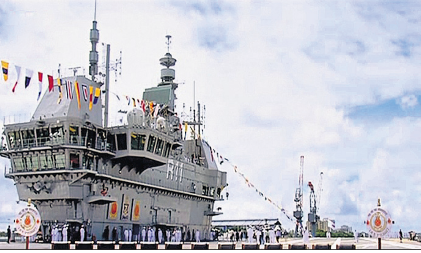
କେରଳର କୋଟି ଶିପ୍ଯାତରୁ ରୁଚୁବାର ସ୍ୱଦେଶୀ ଜ୍ଞାନକୌଶଳରେ ନିର୍ମିତ ଭାରତର ପ୍ରଥମ ବିମାନବାହୀ ମୁକ୍ତାହାଳ ଆଇଏଏଏଏଫ ବିକ୍ରାନ୍ତର ଜଳାବତରଣ।

କଲ୍ୟାଣ ଗୌବେ ସର୍ବଭାରତୀୟ ଫୁଟବଲ ମହାସଂଘ (ଏଆଇଏଏଏଫ)ର ନୂଆ ସଭାପତି ଭାବେ ନିର୍ବାଚିତ ହୋଇଛନ୍ତି।