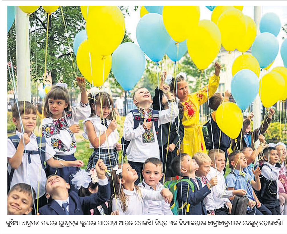
ରୁଷିଆ ଆକ୍ରମଣ ମଧ୍ୟରେ ଯୁକ୍ତେନ୍ଦ୍ର ସ୍କୁଲରେ ପାଠପଢ଼ା ଆରମ୍ଭ ହୋଇଛି। କିନ୍ତୁ ଏକ ବିଦ୍ୟାଳୟରେ ଛାତ୍ରାଛାତ୍ରୀମାନେ ବେଲୁନ୍ ଉଡ଼ାଉଛନ୍ତି।

ଆଫଗାନିସ୍ତାନର ହେରାତ୍ ସହରରେ ଥିବା ଏକ ମସ୍ଜିଦରେ ଶୁକ୍ରବାର ବିସ୍କୋରଣ ଘଟି ୧୮ ଜଣ ନିହତ ହୋଇଛନ୍ତି। ଅନ୍ୟମ ୨୯ ଜଣ ଆହତ ହୋଇଛନ୍ତି।