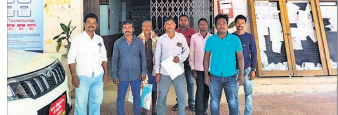
ଅଭିଯୋଗ କରିବାକୁ ଆସିଥିବା ଗାଷୀ ।