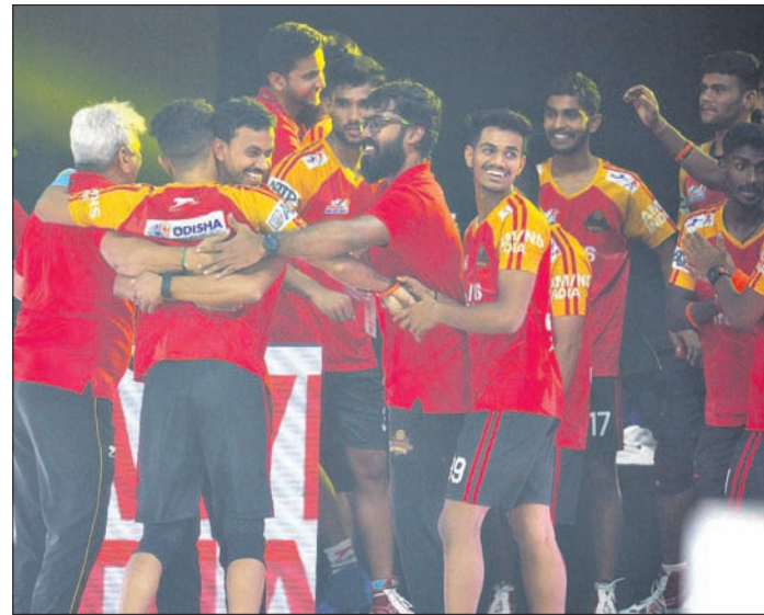
ବିଜୟ ହାସଲ ପରେ ଉଲ୍ଲାସିତ ଓଡ଼ିଶା ଜଗରନଟ୍ସ ଦଳ ।