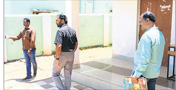
ନୋଡାଲ ବାପୁଜୀ ହାତୀକୁଳରେ ଜିଲାପାଳ ତଦାରଖ କରୁଛନ୍ତି ।