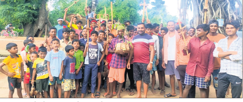
ଯୁବକମାନେ ଗୋଡ଼ୁଣ୍ଡି ଧରି ଚକା ଗାଈ ମାରିବାକୁ ବୁଲୁଛନ୍ତି ।

‘ହାଣ୍ଡି ହାଣ୍ଡି ଦୁରୁଖୁଣ୍ଡି ନା ଦେଲା ଘରେ ଚାନ୍ଦରେ ଗୁଣ୍ଡି’ ଗୀତରେ କମ୍ପାନା ଗାଁ । ଏହି ପାରମ୍ପରିକ କୃଷିଭିତ୍ତିକ ଗୀତ ଗାଇ ଉପରକୋଟ ଓ ଝରିଗାଁ ବ୍ଲକର କେତେକ ଗାଁରେ କୃଷିଭିତ୍ତିକ ‘ଗୋରଣ୍ଡା ପର୍ବ’ ପାଳନ କରାଯାଇଛି । ନୂଆଖାଇ ପର୍ବରେ ଗାଁର ମୁକ୍ତମାନେ ଘରଘର ବୁଲି ଗାଈ,ଧାନ, ପତ୍ରପତ୍ରୀ ମାରିବାବେଳେ ଏହି ଗୀତ ଗାଇଥାନ୍ତି । ଏହି ‘ଗୋରଣ୍ଡା ପର୍ବ’ ପାଳନ କଲେ ପଞ୍ଚାଳ ଭଲ ହେବା ସହ ରୋଗବ୍ୟାଧି ଦୂରରେ ରହିବେ ବୋଲି ଆଦିବାସୀଙ୍କ ବିଶ୍ୱାସ ରହିଛି ।