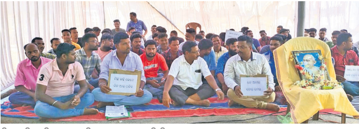
ହିଲୁକା ଏରିଆ ଅଫିସ ସମ୍ପର୍କରେ କ୍ଷତିଗ୍ରସ୍ତମାନେ ଧାରଣାରେ ବସିଛନ୍ତି।

ଗ୍ରାମର ୧୫୦ରୁ ଊର୍ଦ୍ଧ୍ୱ ଲୋକଙ୍କ ୩୪୮ ଏକକ ନି ଅଧିକାରୀଙ୍କୁ କରାଯାଇଥିଲା। ସେହି ଏକାକୀ ସମୟରେ ନିକଟସ୍ଥ ମଲିକସ ଓ କୁସୁମପାଳ ଗ୍ରାମର ଜମି ମଧ୍ୟ ଅଧିକାରୀ ହୋଇଥିଲା।