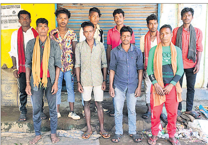
ଦାଦନ ଖତିବାକୁ ଯାଇଥିବା ଶ୍ରମିକମାନେ ।

କାମ କରି ବର୍ଷ ବର୍ଷ ବିତିଯାଉଥିଲେ ହେଁ ମଜୁରି ମିଳୁନାହିଁ । ଠିକାଦାରମାନେ କାମ କରାଇ ସେମାନଙ୍କୁ ମଜୁରି ଦେବାକୁ ଭୁଲିଯାଆନ୍ତି । ଏନେଇ ବାରମ୍ବାର ଦେଖାଦେଇ ପ୍ରାୟ ୩୦ରୁ ଉର୍ଦ୍ଧ୍ୱ ଗ୍ରାମବାସୀ ଏକତ୍ରିତ ହୋଇ ରାସ୍ତାର ଉଭୟ ପାର୍ଶ୍ୱରେ ଥିବା ସମସ୍ତ ଶୁଖିଲା ଗଛ ହଟାଇବାକୁ ଡାକ୍ତା ସ୍ୱରୂପ ବିଭାଗର ନିର୍ଦ୍ଦେଶ ଯତ୍ନ କରାଯାଇଥିଲା । ଏହି ଗ୍ରାମରେ କାମ କରୁଥିବା ପ୍ରାୟ ୧୫ ଜଣ ଗ୍ରାମବାସୀ ଦାଦନ ଖତିବାକୁ ବାହାର ରାଜ୍ୟକୁ ଯାଇଛନ୍ତି । ଏହି ଗ୍ରାମରେ କାମ କରୁଥିବା ପ୍ରାୟ ୧୫ ଜଣ ଗ୍ରାମବାସୀ ଦାଦନ ଖତିବାକୁ ବାହାର ରାଜ୍ୟକୁ ଯାଇଛନ୍ତି । ଏହି ଗ୍ରାମରେ କାମ କରୁଥିବା ପ୍ରାୟ ୧୫ ଜଣ ଗ୍ରାମବାସୀ ଦାଦନ ଖତିବାକୁ ବାହାର ରାଜ୍ୟକୁ ଯାଇଛନ୍ତି । ଏହି ଗ୍ରାମରେ କାମ କରୁଥିବା ପ୍ରାୟ ୧୫ ଜଣ ଗ୍ରାମବାସୀ ଦାଦନ ଖତିବାକୁ ବାହାର ରାଜ୍ୟକୁ ଯାଇଛନ୍ତି ।