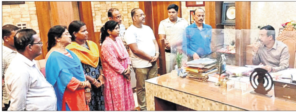
ପୌର କର୍ମଚାରୀମାନେ ଜିଲାପାଳଙ୍କୁ ଭେଟି ଦାବିପତ୍ର ଦେଖାଉଛନ୍ତି ।