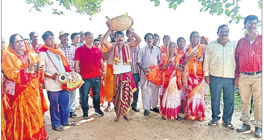
ମିନାବଜାର ପୂଜା ପ୍ରତିଷ୍ଠାନ ପକ୍ଷରୁ ଶୁଭ ମାଟି ଅନୁକୂଳ କରାଯାଇଛି ।

ପୂର୍ବ ନିର୍ଦ୍ଧାରିତ ସମୟରେ ଉଭୟ ପୂଜା ମଣ୍ଡପର କର୍ମକର୍ମୀମାନେ ଶୋଭାଯାତ୍ରାରେ ବାହାରି ବ୍ରାହ୍ମଣୀ ନଦୀ କୂଳରେ ପହଞ୍ଚିଥିଲେ । ସେଠାରେ ପୂଜାଚଳା ପରେ ମାଟି ଅନୁକୂଳ କରାଯାଇଥିଲା । ମିନାବଜାର ପ୍ରତିଷ୍ଠାନର ସଦସ୍ୟ ଶୋଭାଯାତ୍ରାରେ ବକରାମ ମନ୍ଦିରରେ ପହଞ୍ଚିଥିଲେ । ଅପରାହ୍ନ ୨ଟାରେ ଏକ ବିଶାଳ ଶୋଭାଯାତ୍ରାରେ ଅନୁକୂଳ ମାଟିକୁ ସହର ପରିକ୍ରମା କରାଯାଇ ପୂଜା ମଣ୍ଡପକୁ