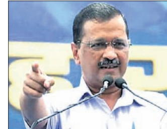
ଦିଲ୍ଲୀ ମୁଖ୍ୟମନ୍ତ୍ରୀ ଅରବିନ୍ଦ କେଜ୍‌ରିଓ୍ୱାଲ। ଶିକ୍ଷା, ସ୍ୱାସ୍ଥ୍ୟସେବା ଏବଂ ମାରଣା ବିଦ୍ୟୁତ୍ ଭଳି ସୁବିଧା ପ୍ରଦାନ କରୁନାହିଁ, କିନ୍ତୁ ଆମ ଆଦମ୍ଭୀ ପାଟି ସେମାନଙ୍କ କଲ୍ୟାଣ ପାଇଁ ଯତ୍ନବାନ ହେବ। ଗ୍ରାମାଞ୍ଚଳର ମହିଳାଙ୍କୁ ଭଣ୍ଡା ଭାବରେ ମାସକୁ ହଜାରେ ଟଙ୍କା ମଧ୍ୟ ଏଏପି ସରକାର ଦେବେ। ରାଜ୍ୟରେ ୨୭

ଅହମ୍ମଦାବାଦ, ୩୧: ଏଏପି ରାଜ୍ୟରେ କ୍ଷମତାକୁ ଆସିବ ତେବେ ସାଧାରଣ ଲୋକଙ୍କୁ ଦିଆଯାଇଥିବା ସମସ୍ତ ପ୍ରତିଶ୍ରୁତି ଲାଭ ଭାଜପା କର୍ମୀମାନେ ମଧ୍ୟ ପାଇବେ। ଭାଜପା ନେତାଙ୍କୁ ଆମ ଦଳରେ ଅନ୍ତର୍ଭୁକ୍ତ କରିବାକୁ ଚାହୁଁନାହିଁ ବା, ବୁଧ ଏବଂ ଚାନ୍ଦିନୀରେ ଥିବା ଭାଜପା କର୍ମୀମାନେ ବହୁ ସଂଖ୍ୟାରେ ଆମ ସହ ଯୋଗ ଦେଉଛନ୍ତି। ମୁଁ ତାଙ୍କୁ ପଚାରିବାକୁ ଚାହୁଁଛି ଏବେ ବର୍ଷ ପରେ ଦି ଚାନ୍ଦିନୀ ବନ୍ଦକରେ ଭାଜପା ଚାନ୍ଦିନୀ କ'ଣ ଦେଇଛି? କେଜ୍‌ରିଓ୍ୱାଲ କହିଛନ୍ତି, ଭାଜପା ଏହାର ଦକାୟ କର୍ମୀ ଏବଂ ସେମାନଙ୍କ ପରିବାର ସଦସ୍ୟଙ୍କୁ ମାରଣ ତଥା ଗୁଣାମୂଳ