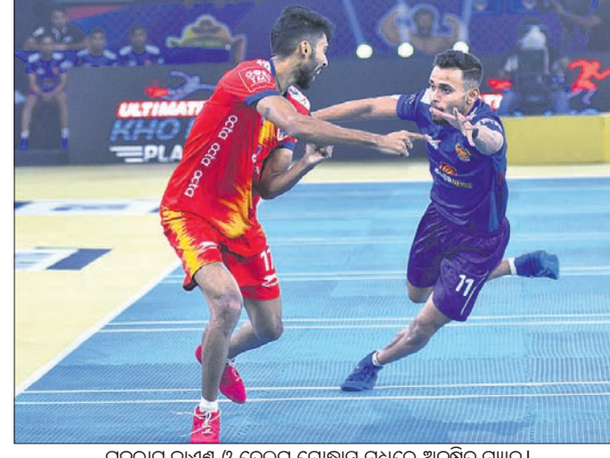
ଗୁଜରାଟ ଜାଏଣ୍ଟ୍ସ ଓ ଡେଲ୍‌ଗୁ ଯୋଦ୍ଧାସ୍ ମଧ୍ୟରେ ଅନୁଷ୍ଠିତ ମ୍ୟାଚ୍।

ହାର ମାନିଥିଲେ ମୁରେ। ପରାଜିତ ହୋଇଥିଲେ ହେଁ ସେ ନିଜ ପ୍ରଦର୍ଶନକୁ ନେଇ ଖୁସି ପ୍ରକାଶ କରିଛନ୍ତି। ୩୫ ବର୍ଷ ବୟସରେ ଜଣେ ସିଡେଣ୍ଟ ଖେଳାଳିଙ୍କ ପୂର୍ଣ୍ଣାବଳୀ କରୁଥିବାରୁ ସେ ଖୁସି ପ୍ରକାଶ କରିଛନ୍ତି। ୨୦୧୬ ପରଠାରୁ ୬ ବର୍ଷରେ ପ୍ରଥମ ଥର ପାଇଁ ଗ୍ରାଣ୍ଡସ୍ଲାମ ପ୍ରବେଶରେ ପୂର୍ଣ୍ଣ ଅତ୍ୟନ୍ତ ଖୁସି ବୋଲି ମୁରେ କହିଛନ୍ତି। ଅନ୍ୟତମ ଆମେରିକୀୟ ଖେଳାଳି କୋକୋଆ ଗୋର୍ଡ଼ ବିଜୟ ସହିତ ୪ର୍ଥ ରାଉଣ୍ଡରେ ପ୍ରବେଶ କରିଛନ୍ତି। ମାଡିସନ୍ କିସ୍‌କ୍ସ ୬-୨, ୬-୩ ରେ ପରାସ୍ତ କରିଥିବା ବେଳେ ପରବର୍ତ୍ତୀ ମ୍ୟାଚରେ ଝାଙ୍କ ଶୁ ଆଇଲ୍‌ଜୁ ଭେଟିବେ। ଡିଫେଣ୍ଡିଂ ପୁରୁଷ ଚାମ୍ପିୟନ ଡାନିଲ ମେଡଭେଡେଭ ଚାଲିନୀର ଫ୍ରେ ଯିବିଙ୍କୁ ୬-୪, ୬-୨ ଓ ୬-୨ରେ ପରାସ୍ତ କରି ୪ର୍ଥ ରାଉଣ୍ଡରେ ପହଞ୍ଚିଛନ୍ତି। ଅନ୍ୟ ଏକ ମ୍ୟାଚରେ ଫ୍ରେମ୍‌ଲଟ୍ ଚାମ୍ପିୟନ ଓଡୁ କାବୁର୍‌ବ୍ ୩୧ ନମ୍ବର ଖେଳାଳି ସେଲ୍‌ବି ରୋଜର୍‌ସ୍‌ଙ୍କୁ ପରାସ୍ତ କରିଛନ୍ତି। ପୂର୍ବରୁ ସିଡେଣ୍ଟ ଓ ଗ୍ରାଣ୍ଡସ୍ଲାମ ଚାମ୍ପିୟନ ଖେଳାଳିଙ୍କ ମଧ୍ୟରେ ଆନେକ କୋଷ୍ଠାଭିତ୍, ମାରିଆ ସାକାନ୍‌ରା, ପରଲ୍‌ ବଡୋସା, ଏମ୍ମା ରାଡୁକାନ୍‌ ଓ ଲେୟଲ୍‌ ଫର୍ନାଣ୍ଡେଜ୍ ବିଦାୟ ନେଇଥିବା ବେଳେ ଲଗା ସିଡେଣ୍ଟ କଠୁ କାବୁର୍‌ବ୍ ୪ର୍ଥ ରାଉଣ୍ଡ ପ୍ରବେଶ କରିଛନ୍ତି। କାବୁର୍‌ବ୍ ପରବର୍ତ୍ତୀ ରାଉଣ୍ଡରେ ଭେରେଜିନାଙ୍କୁ ଭେଟିବେ।