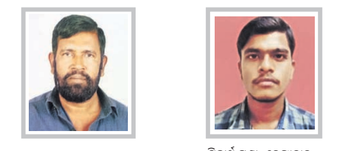
ଶେଖ୍ ଯାକୂବ୍, ଗୋପ୍ ବିକାର୍ଥ ପଣ୍ଡା, ଡେକୋରାଟିଭ

ସୂଚନା: ଆଗାମୀ ଆଶା ପୃଷ୍ଠା ପାଇଁ ଲେଖା ଓ ପଞ୍ଜରୀ ପଠାଇବା ଲାଗି ଇ-ମେଲ୍ ଠିକଣା: dharitriagamiasha@gmail.com