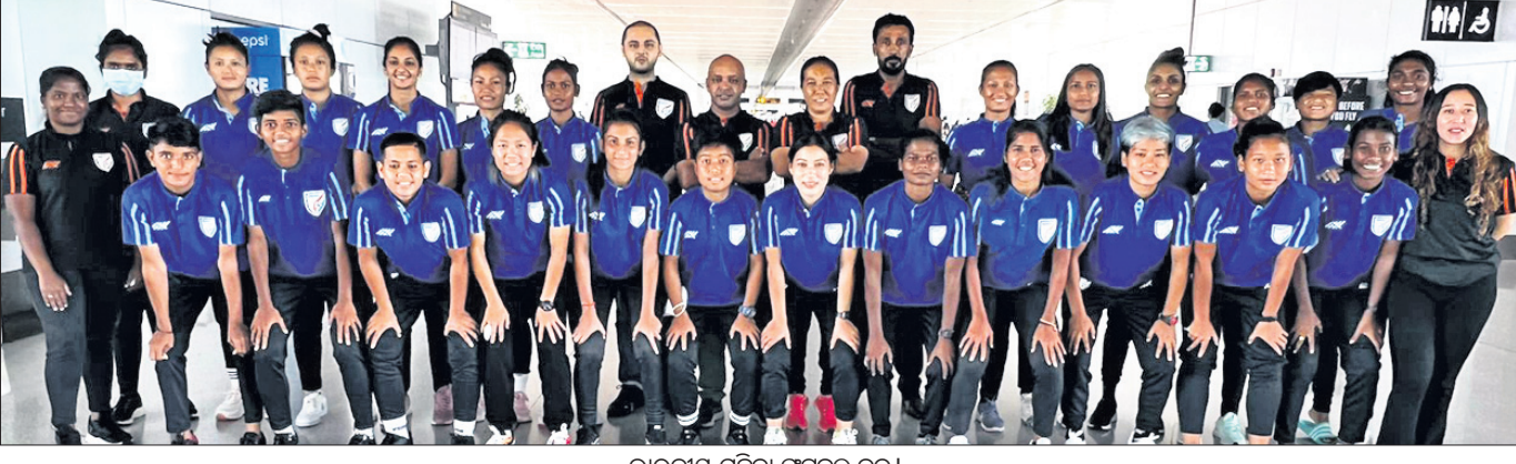
ଭାରତୀୟ ମହିଳା ଫୁଟବଲ୍ ଦଳ।