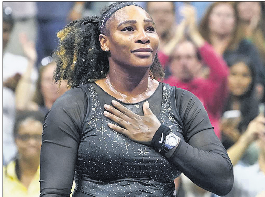
କ୍ୟାରିୟରର ଅତିମ ଗ୍ରାଣ୍ଡସ୍ଲାମ ଖେଳିବାପରେ ସେରେନା ଓଲିମ୍ପିକ୍ସରେ

ଚଳିତ ବର୍ଷର ଅତିମ ଗ୍ରାଣ୍ଡସ୍ଲାମ ଟୁର୍ନାମେଣ୍ଟ ସୁଧସ୍ ଓପନରେ ଦେଖିବାକୁ ମିଳିଛି ପୁଣି ଏକ ବଡ଼ ବିପର୍ଯ୍ୟୟ। ନିଜର ଅତିମ ଗ୍ରାଣ୍ଡସ୍ଲାମ ଖେଳୁଥିବା ସେରେନା ଓଲିମ୍ପିକ୍ ତୃତୀୟ ରାଉଣ୍ଡରୁ ହାରି ବିଦାୟ ନେଇଥିବା ବେଳେ ୩ ଥର ଗ୍ରାଣ୍ଡସ୍ଲାମ ଚାମ୍ପିୟନ ଆଣ୍ଡି ମୁରେ ମଧ୍ୟ ପରାଜୟ ସହିତ ବିଦାୟ ନେଇଛନ୍ତି। ନିଜ କ୍ୟାରିୟରର ଅତିମ ଗ୍ରାଣ୍ଡସ୍ଲାମ ଖେଳୁଥିବା ନେଇ ସେରେନା ପରୋକ୍ଷ ଭାବରେ ସୂଚନା ଦେଇ ସାରିଥିବା ବେଳେ ଏହି ପରାଜୟ ସହିତ ୨୩ ଗ୍ରାଣ୍ଡସ୍ଲାମ ବିଜୟିନୀ ସେରେନାଙ୍କ ଯାତ୍ରାରେ ପୂର୍ଣ୍ଣଚକ୍ରେ ପଡ଼ିଛି। ଶୁକ୍ରବାର ବିଳମ୍ବିତ ରାତିରେ ଆର୍ଥର ଆଣ୍ଡି ଷ୍ଟିଭେନସରେ ଖେଳାଯାଇଥିବା ଏହି ମ୍ୟାଚ ପରେ ସେରେନା କାନ୍ଦି ପକାଇଥିଲେ। ଯଦିଓ ସେରେନା ନିଜ ଅବସର ସମ୍ପର୍କରେ କୌଣସି ସ୍ପଷ୍ଟ ସୂଚନା ଦେଇନାହାନ୍ତି ତଥାପି ଭଉଣୀ ଭେନସ ଓଲିମ୍ପିକ୍ସରୁ ସୂଚନା ଏସବୁ ଆକଳନକୁ ସ୍ପଷ୍ଟ କରୁଛି। ତୃତୀୟ ରାଉଣ୍ଡ ମ୍ୟାଚରେ ଅଷ୍ଟ୍ରେଲିଆର ଆଲି ଟମ୍ପାକୋନୋଭିଚଙ୍କ ବିପକ୍ଷରେ ସେରେନା ୬-୪, ୬-୬(୪) ଓ ୬-୧ରେ ପରାଜିତ ହୋଇଥିଲେ। ଏହି