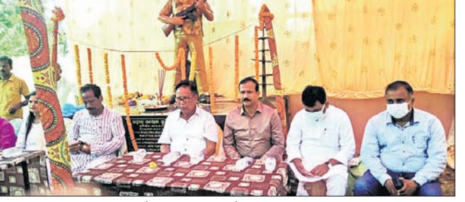
ଶହୀଦଙ୍କ ପ୍ରତିମୂର୍ତ୍ତି ଅନାବରଣ କାର୍ଯ୍ୟକ୍ରମରେ ଉପସ୍ଥିତ ଅତିଥିମାନେ ।