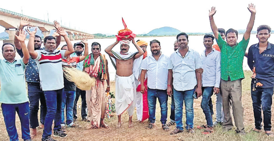
ମାଟି ଅନୁକୂଳ ଅବସରରେ ଗଣେଶ ବଜାର ପୂଜା ପ୍ରତିଷ୍ଠାନର କାର୍ଯ୍ୟକର୍ମୀମାନେ ।