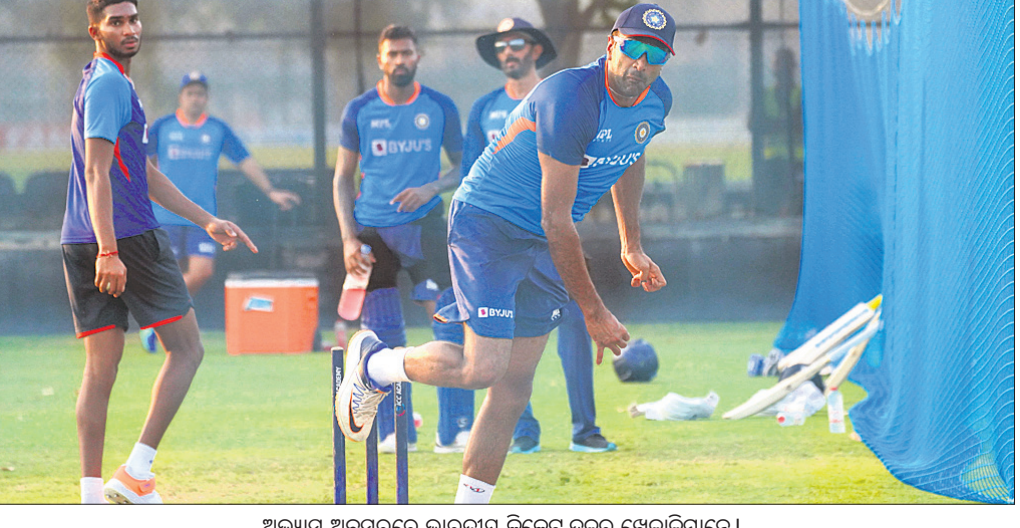
ଅଭ୍ୟାସ ଅବସରରେ ଭାରତୀୟ କ୍ରିକେଟ ଦଳର ଖେଳାଳିମାନେ।

ଲତ୍ତାହିମ୍ ପ୍ରିୟମର ଲିଭ୍ (ଆଇପିଏଲ୍) ସିଜନ ୨୦୨୩ ପାଇଁ ପୂର୍ବତନ ଅଷ୍ଟ୍ରେଲିୟା କ୍ରିକେଟର ଚପ୍ ମୁକ୍ତିକ୍ ସ୍ଥାନରେ କିରନ୍‌ଟା ଟ୍ରାଏନ ଲୀରା ସନରାଇଜର୍ସ ହାଲଡ୍ରାବାଦ ଚିମ୍ବର ମୁଖ୍ୟ କୋଚ୍ ଭାବେ ନିଯୁକ୍ତି ପାଇଛନ୍ତି। ୫୩ ବର୍ଷୀୟ ଲୀରା ପ୍ରଥମଥର ପାଇଁ ଏକ ଟି୨୦ ଚିମ୍ବର ମୁଖ୍ୟ କୋଚ୍ ହୋଇଛନ୍ତି। ଷ୍ଟେଡ଼ିୟମରେ ପୂର୍ବତନ ଅଧିନାୟକ ଗତ ଡିସେମ୍ବରରେ ସନରାଇଜର୍ସ ଚିମ୍ବର ରଣକୋଶଳ ଉପଦେଷ୍ଟା ଓ ବ୍ୟାଟିଂ କୋଚ୍ ଭାବେ ଯୋଗ ଦେଇଥିଲେ। ପୂର୍ବତନଯୋଗ୍ୟ, ମୁକ୍ତିକ୍ ଡକ୍ଟରାଧାନରେ ସନରାଇଜର୍ସ ୨୦୧୩ରୁ ୨୦୧୯ ମଧ୍ୟରେ ୫ଥର ଡେପ୍ୟୁଟିରେ ପ୍ରବେଶ କରିବା ସହ ୨୦୧୬ରେ ଚାମ୍ପିୟନ ହୋଇଥିଲା। ତାଙ୍କ ସ୍ଥାନରେ ଅଷ୍ଟ୍ରେଲିଆର ଟେଭେଲିସ୍ ୨୦୨୦ରେ ମୁଖ୍ୟ କୋଚ୍ ହୋଇଥିଲେ। ଡେବେ ଗତବର୍ଷ ମୁକ୍ତି କ୍ରିକେଟ ଡାଇରେକ୍ଟର ଭାବେ ପୁନର୍ବାର ସନରାଇଜର୍ସକୁ ଫେରିଥିଲେ। ହେଲେ ଦଳ ମାତ୍ର ୩ଟି ବିଜୟ ସହ ପଏଣ୍ଟ୍‌ ଟେବୁଲରେ ସର୍ବନିମ୍ନ ସ୍ଥାନରେ ରହିଥିଲା। ଫଳରେ ମୁକ୍ତିକ୍ ପୁନର୍ବାର ସନରାଇଜର୍ସର ମୁଖ୍ୟ କୋଚ୍ ପଦବୀରେ ଅବସ୍ଥାପିତ କରାଯାଇଥିଲା। ତାଙ୍କ ଅଧୀନରେ ଦଳ ୨୦୨୨ ସିଜନରେ ୧୦ଟି ଦଳକୁ ନେଇ ହୋଇଥିବା ଟୁର୍ନାମେଣ୍ଟରେ ୬ ବିଜୟ ଓ ୮ ପରାଜୟ ସହ ୮ମ ସ୍ଥାନରେ ରହିଥିଲା।