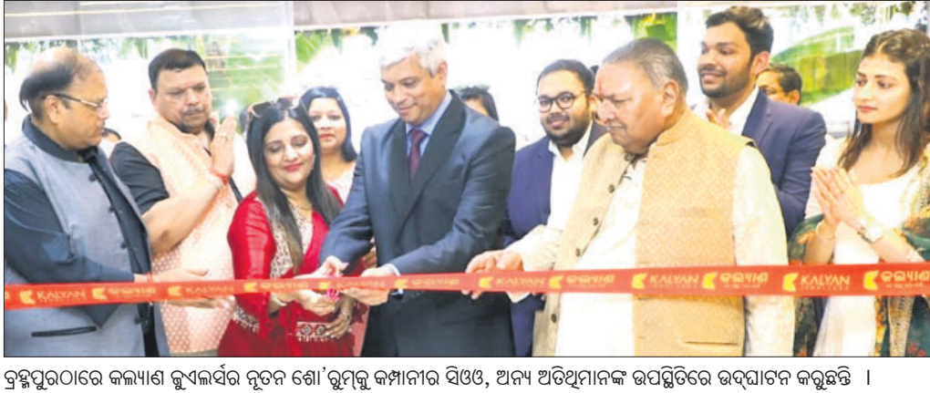
ବ୍ରହ୍ମପୁରରେ କଲ୍ୟାଣ କ୍ଲବ୍‌ଲାର୍ସ୍ ନୂତନ ଶୋ'ରୁ ମୁଖ୍ୟ ଅତିଥିମାନଙ୍କ ଉପସ୍ଥିତିରେ ଉଦ୍‌ଘାଟନ କରୁଛନ୍ତି ।

୧ ଲକ୍ଷ ଟଙ୍କା ମୂଲ୍ୟର ହାରା ଗହଣା କ୍ରୟ ଉପରେ ୧୦ ହଜାର ଟଙ୍କା ପର୍ଯ୍ୟନ୍ତ ରିହାତି ପ୍ରଦାନ କରାଯିବ ବୋଲି ଷୋର ପକ୍ଷରୁ ଘୋଷଣା କରାଯାଇଛି। ଏହା ସହ ପ୍ରତି ଗ୍ରାମର ଗଢ଼ା ମୂଲ୍ୟ ଉପରେ ୦.୫୫ ଶହ ଟଙ୍କାର ରିହାତି ଓ ପୁରୁଣା ସୁନା ବଦଳ ଉପରେ ପ୍ରତି ଗ୍ରାମରେ ଅଧିକ ୫୦ ଟଙ୍କା ପ୍ରଦାନ କରାଯିବ ବୋଲି କଲ୍ୟାଣ କ୍ଲବ୍‌ଲାର୍ସ୍ ପକ୍ଷରୁ ଜଣାଯାଇଛି। ସେହିଭଳି ଷୋର ପକ୍ଷରୁ କଲ୍ୟାଣ ସୁନା ଦରର ମଧ୍ୟ ଶୁଭାରମ୍ଭ କରାଯାଇଛି।