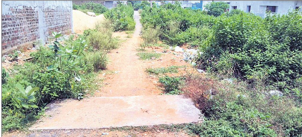
ହାତ୍ତିଧୁଆ ପୁନର୍ବସତି କଲୋନୀକୁ ନିର୍ମାଣ କରାଯାଇଥିବା ଅତି ସଂକୀର୍ଣ୍ଣ ରାସ୍ତା।

■ ପ୍ରଥମ ଖଣି ବିସ୍ଫାଦିତଙ୍କ ଦୁଃଖ ଦୂର କରିପାରିନାହିଁ ଏମ୍ବିଏଲ୍ ■ ତାଳଚେର ହାତ୍ତିଧୁଆ ପୁନର୍ବସତି କଲୋନୀରେ ନାହିଁ ଯୌଳିକ ସୁବିଧା ■ ୨୨ ବର୍ଷ ପରେ ବି ନ୍ୟାୟ ପିଲି ନ ଥିବା ଜଣିହରାଇ ଅଭିଯୋଗ