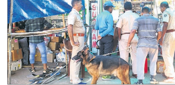
ପୋଲିସ ସହାୟା କୁକୁର ଓ ସାଇକ୍ଲିଷ୍ଟ ଚିମ୍ପ ସହାୟତାରେ ତଦନ୍ତ କରୁଛି ।