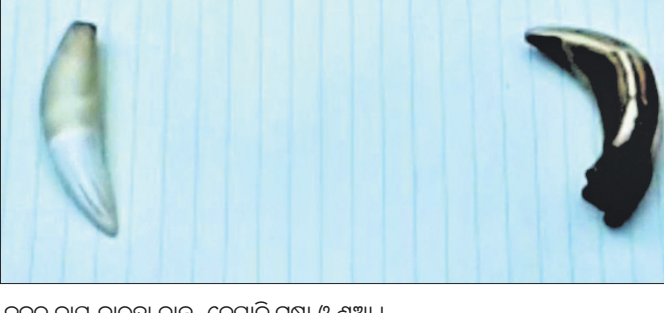
ଜବତ ବାଘ, ବାରହା ଦାନ୍ତ, ନେପାଳି ମୁଷା ଓ ଶୁଆ। ବନବିଭାଗ ପକ୍ଷରୁ ଜୈନସି ସୂଚନା ଦିଆଯାଇନାହିଁ। ଗତ କିଛି ମାସ ତଳେ ଏହିସଂସ୍ଥ ବାଘ ଛାଜ ଜବତ କରିଥିଲା। ଏବେ ବାଘ ଓ ବାରହା ଦାନ୍ତ ଜବତ ପରେ ରଣପୁରରେ ବାଘ ଓ ଅନ୍ୟ ଜାବକକୁ ଶିକାରୀ ସମ୍ରାଜ୍ଞ ଥିବା ପ୍ରମାଣିତ ହେଉଛି।