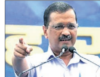
ଦିଲ୍ଲୀ ମୁଖ୍ୟମନ୍ତ୍ରୀ ଅରବିନ୍ଦ କେଜ୍‌ରିଓ୍ୱାଲ। ଶିକ୍ଷା, ସ୍ୱାସ୍ଥ୍ୟସେବା ଏବଂ ମାରଣୀ ବିଦ୍ୟୁତ୍ ଭଳି ସୁବିଧା ପ୍ରଦାନ କରୁନାହିଁ, କିନ୍ତୁ ଆମ୍ ଆଦ୍ୱା ପାର୍ଟି ସେମାନଙ୍କ କଲ୍ୟାଣ ପାଇଁ ଯତ୍ନବାନ ହେବ। ଗ୍ରାମାଞ୍ଚଳର ମହିଳାଙ୍କୁ ଭଣ୍ଡା ଭାବରେ ମାସକୁ ହଜାରେ ଟଙ୍କା ମଧ୍ୟ ଏଏପି ସରକାର ଦେବେ। ରାଜ୍ୟରେ ୨୭

ଅହମ୍ମଦାବାଦ, ୩୯: 'ଭାଜପା କର୍ମୀମାନେ ଦଳକୁ ଦରମା ନିଅନ୍ତୁ, କିନ୍ତୁ ଭିତରେ ଏଏପି ପାଇଁ କାମ କରନ୍ତୁ' ଆମ୍ ଆଦ୍ୱା ପାର୍ଟିର ରାଷ୍ଟ୍ରୀୟ ସଂଯୋଜକ ତଥା ଦିଲ୍ଲୀ ମୁଖ୍ୟମନ୍ତ୍ରୀ ଅରବିନ୍ଦ କେଜ୍‌ରିଓ୍ୱାଲ ଗୁଜରାଟ ଗସ୍ତ ଅବସରରେ ଶନିବାର ରାଜକୋଟରେ ଏହା କହିଛନ୍ତି। କେଜ୍‌ରିଓ୍ୱାଲ କହିଛନ୍ତି ଆମ ପାଖରେ ଟଙ୍କା ନାହିଁ, ଭାଜପା କର୍ମୀମାନେ ଦଳକୁ ଦରମା ନେଇ ଭିତରେ ଏଏପି ପାଇଁ କାମ କରନ୍ତୁ। କାରଣ ଆମ ପାଖରେ ଟଙ୍କା ନାହିଁ ଯଦି ଏଏପି ରାଜ୍ୟରେ କ୍ଷମତାକୁ ଆସିବ ତେବେ ସାଧାରଣ ଲୋକଙ୍କୁ ଦିଆଯାଇଥିବା ସମସ୍ତ ପ୍ରତିଶ୍ରୁତିର ଲାଭ ଭାଜପା କର୍ମୀମାନେ ମଧ୍ୟ ପାଇବେ। ଭାଜପା ନେତାଙ୍କୁ ଆମ ଦଳରେ ଅନ୍ତର୍ଭୁକ୍ତ କରିବାକୁ ଚାହୁଁନାହିଁ, କିନ୍ତୁ ଏବଂ ଚାହୁଁଲେ ଥିବା ଭାଜପା କର୍ମୀମାନେ ବହୁ ସଂଖ୍ୟାରେ ଆମ ସହ ଯୋଗ ଦେଉଛନ୍ତି। ମୁଁ ତାଙ୍କୁ ପଚାରିବାକୁ ଚାହୁଁଛି ଏବେ ବର୍ଷ ପରେ ଦି ଟଙ୍କା ଯେବା ବଦଳରେ ଭାଜପା ଟାଙ୍କୁ କ'ଣ ଦେଇଛି? କେଜ୍‌ରିଓ୍ୱାଲ କହିଛନ୍ତି, ଭାଜପା ଏହାର ଦକାୟ କର୍ମୀ ଏବଂ ସେମାନଙ୍କ ପରିବାର ସଦସ୍ୟଙ୍କୁ ମାରଣୀ ତଥା ଗୁଣାମୁକ୍ତ