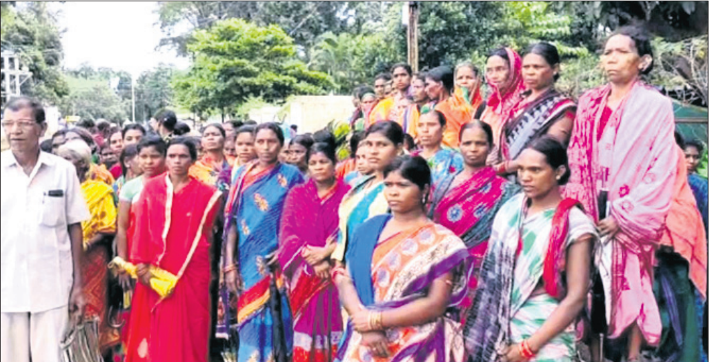
ମଦ ବିରୋଧରେ ଏକାଠି ହୋଇଥିବା ମହିଳାମାନେ ।

କୋଟଗଡ଼, ୩୯(ଡି.ଏନ.ଏ.) କକ୍ଷମାଳ ଜିଲା ବାଲିଗୁଡ଼ା ବ୍ଲକ କୁଟିକିଆ ପଞ୍ଚାୟତରେ ଦେଶୀ ମହୁଲି ମଦ ବିକ୍ରି ଓ ତିଆରି କରୁଥିବା ବ୍ୟକ୍ତିଙ୍କ ବିରୋଧରେ ଦୃଢ଼ କାର୍ଯ୍ୟାନୁଷ୍ଠାନ ଦାବି କରିଛନ୍ତି ପଞ୍ଚାୟତର ଶହ ଶହ ମହିଳା ଓ ବୁଦ୍ଧିଜୀବୀ। କୁଟିକିଆ ପଞ୍ଚାୟତର ବିଭିନ୍ନ ସ୍ଥାନରେ ଦେଶୀ ମହୁଲି ମଦ ବିକ୍ରି ଦ୍ୱାରା ଝିଅ,ବୋହୂମାନେ ଘରୁ ବାହାରକୁ ଯିବାକୁ ସୁରକ୍ଷିତ ମଣ୍ଡଳୀହାତୀ, ପୁରୁଷମାନେ ମଦ ପିଇବା ଦ୍ୱାରା ଘରେ ଅଶାନ୍ତି ସୃଷ୍ଟି କରିବା ସହିତ