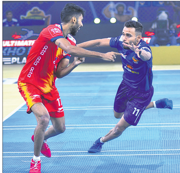
ଗୁଜରାଟ କ୍ୟାମ୍ପସ୍ ଓ ଡେଲୁରୁ ଯୋଦ୍ଧାସ୍ ମଧ୍ୟରେ ଅନୁଷ୍ଠିତ ମ୍ୟାଚ୍

ହେଁ ସେ ନିଜ ପ୍ରଦର୍ଶନକୁ ନେଇ ଖୁସି ପ୍ରକାଶ କରିଛନ୍ତି। ୩୫ ବର୍ଷ ବୟସରେ ଜଣେ ସିଡେଡ ଖେଳାଳିଙ୍କ ମୁକାବିଲା କରୁଥିବାରୁ ସେ ଖୁସି ପ୍ରକାଶ କରିଛନ୍ତି। ୨୦୧୬ ପରଠାରୁ ୬ ବର୍ଷରେ ପ୍ରଥମ ଥର ପାଇଁ ଗ୍ରାଣ୍ଡସ୍ଲାମ ପ୍ରଦେଶରେ ମୁଁ ଅତ୍ୟନ୍ତ ଖୁସି ବୋଲି ମୁରେ କହିଛନ୍ତି। ଅନ୍ୟତମ ଆମେରିକୀୟ ଖେଳାଳି କୋକୋଆ ଗୋଟିଏ ବିଜୟ ସହିତ ୪ର୍ଥ ରାଉଣ୍ଡରେ ପ୍ରବେଶ କରିଛନ୍ତି। ମାଡିସନ୍ କିସ୍କୁ ୬-୨, ୬-୩ ରେ ପରାସ୍ତ କରିଥିବା ବେଳେ ପରବର୍ତ୍ତୀ ମ୍ୟାଚରେ ଝାଙ୍ଗ ଶୁ ଆଇଙ୍କୁ ଭେଟିବେ। ଡିଫେଣ୍ଟିଫୁ ପୁରୁଷ ଚାମ୍ପିୟନ ଡାନିଲ ମେଡଭେଡେଫ୍ ଚାଲିନାର ଓ ଯିଙ୍ଗଙ୍କୁ ୬-୪, ୬-୨ ଓ ୬-୨ରେ ପରାସ୍ତ କରି ୪ର୍ଥ ରାଉଣ୍ଡରେ ପହଞ୍ଚିଛନ୍ତି। ଅନ୍ୟ ଏକ ମ୍ୟାଚରେ ଡ୍ରେଲଲଡର୍ ଚାମ୍ପିୟନ ଓଡୁ ଜାକ୍ସନ୍ ୩୧ ନମ୍ବର ଖେଳାଳି ସେଲିଏ ରୋକର୍ସ୍କୁ ପରାସ୍ତ କରିଛନ୍ତି। ପୂର୍ବରୁ ସିଡେଡ ଓ ଗ୍ରାଣ୍ଡସ୍ଲାମ ଚାମ୍ପିୟନ ଖେଳାଳିଙ୍କ ମଧ୍ୟରେ ଆନେଜ କୋଷ୍ଟାଭିଟ୍, ମାରିଆ ସାଲାରା, ପଇଲା ବଡୋସା, ଏମ୍ମା ରାଡୁକାନ୍ତୁ ଓ ଲେୟଲା ଫର୍ନାଣ୍ଡେଜ ବିଦାୟ ନେଇଥିବା ବେଳେ ଜରା ସ୍ପିଟେକ୍ କଫ ଜାକ୍ସନ୍ ୪ର୍ଥ ରାଉଣ୍ଡ ପ୍ରବେଶ କରିଛନ୍ତି। ଜାକ୍ସନ୍ ପରବର୍ତ୍ତୀ ରାଉଣ୍ଡରେ ଭେରେନିକା କୁଦେରମେଡୋଭାଙ୍କୁ ଭେଟିବେ।