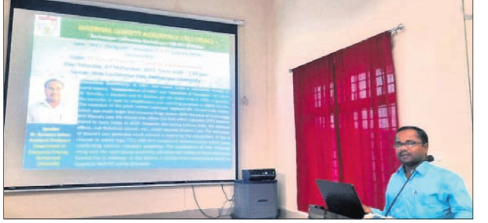
ସତନ୍ତ୍ର ବକ୍ତୃତା କାର୍ଯ୍ୟକ୍ରମରେ ମୁଖ୍ୟବକ୍ତା ଶାର୍ପକ ସମ୍ପର୍କରେ ବାର୍ତ୍ତା ପ୍ରଦାନ କରୁଛନ୍ତି ।