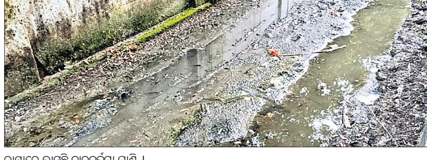
ରାସ୍ତାରେ ଭାସୁଛି ନାଳନର୍ଦ୍ଦମା ପାଣି।