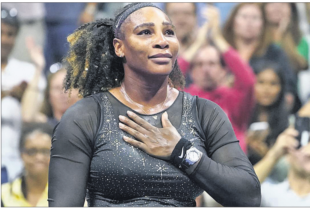
କ୍ୟାରିୟରର ଅନ୍ତିମ ଗ୍ରାଣ୍ଡସ୍ଲାମ୍ ଖେଳିବା ପରେ ଦର୍ଶକଙ୍କଠାରୁ ବିଦାୟ ନେଇଛନ୍ତି ସେରେନା ଫ୍ଲିଲିପ୍ସ।

ଓ ୬-୧ରେ ପରାଜିତ ହୋଇଥିଲେ। ଏହି ପରାଜୟ ପରେ ସେ କାହି ପକାଇଥିବା ବେଳେ ୨୯ ବର୍ଷୀୟା ଚମଲାନୋଭିଚ ମଧ୍ୟ ଦୁଃଖ ପ୍ରକାଶ କରିଥିଲେ। ସେରେନାଙ୍କୁ ଏପରି ଅବସ୍ଥାରେ ଦେଖିବା ନିହାତି କଷ୍ଟବାୟକ ବୋଲି ଚମଲାନୋଭିଚ