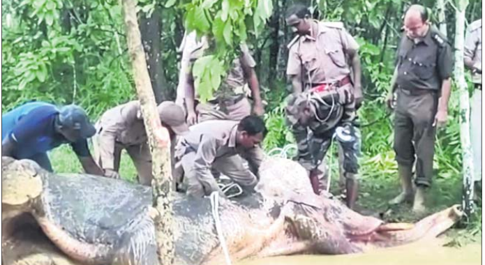
ପାଣି ପିଇବାକୁ ଆସି ଚଳିପଡ଼ିଛି ଦନ୍ତାହାତୀ।

ହୋଇ ପଡ଼ିଥିବା ଦେଖି ବନ ବିଭାଗକୁ ଖବର ଦେଇଥିଲେ। ବନ ବିଭାଗର କିଛି କର୍ମଚାରୀ ଘଟଣାସ୍ଥଳରେ ପହଞ୍ଚି ହାତୀକୁ ଖାଦ୍ୟ ଖାଇବାକୁ ଦେଇଥିଲେ ମଧ୍ୟ ସେ ଖବର ନ ଥିଲା। ଶନିବାର ହାତୀଟି ଏକ ଖାଲୁଆ ସ୍ଥାନକୁ ପାଣି ପିଇବାକୁ ଆସି