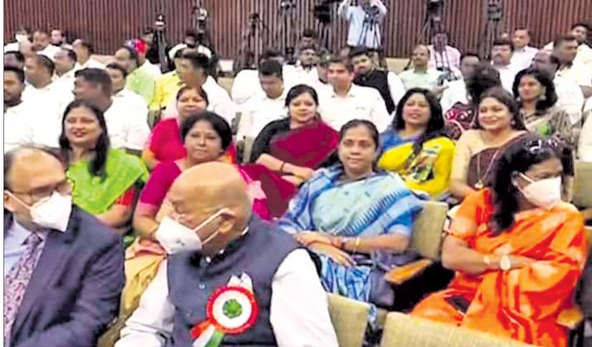
ସମାରୋହରେ ଯୋଗଦେଇଥିବା ଅନ୍ୟାନ୍ୟ ବିଶିଷ୍ଟ ବ୍ୟକ୍ତିବିଶେଷ।