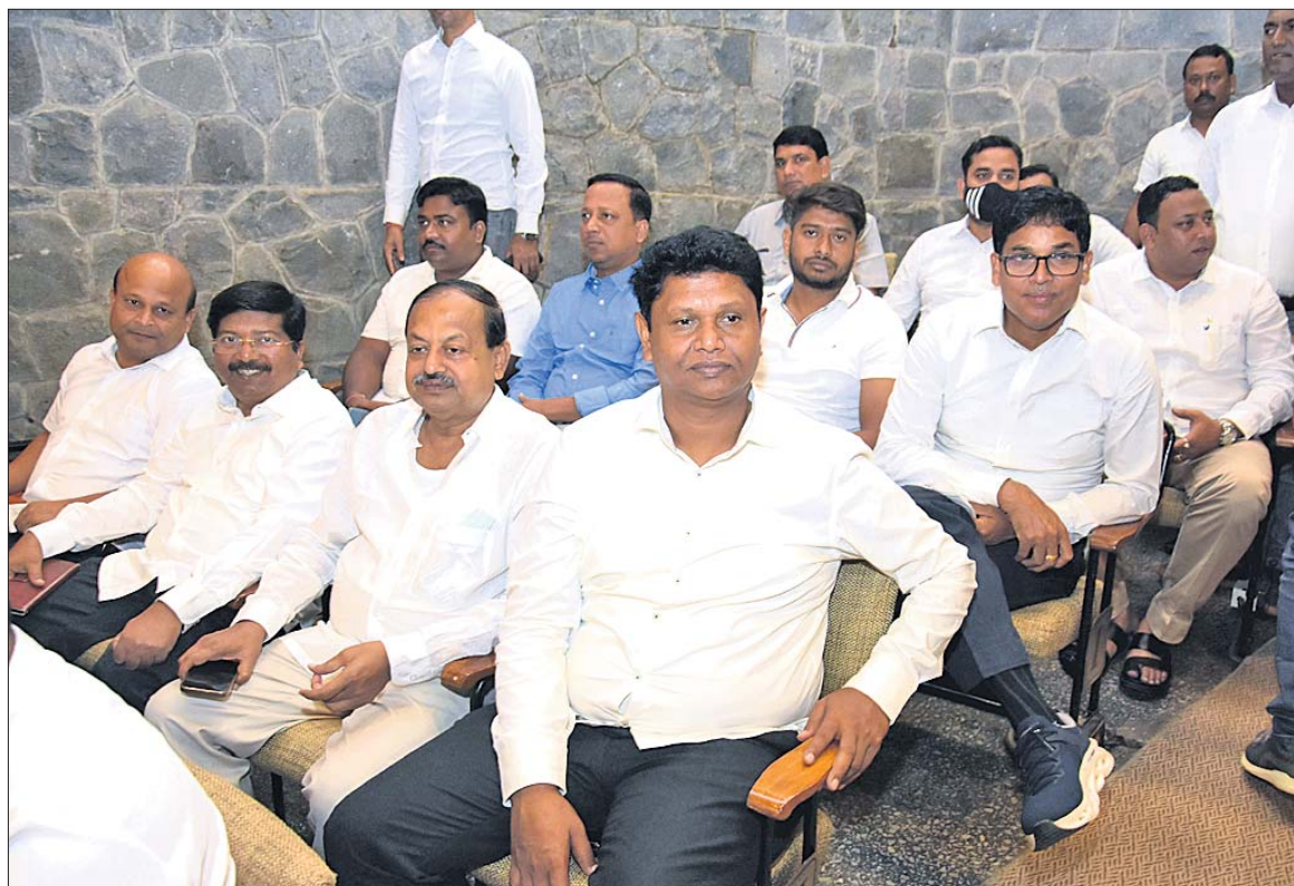
ସମ୍ମାନ ସମାରୋହରେ ଓଡ଼ିଶାକୁ ଯୋଗ ଦେଇଥିବା ବିଜେଡି ନେତା, ମନ୍ତ୍ରୀ, ବିଧାୟକ ଓ ଅନ୍ୟମାନେ।