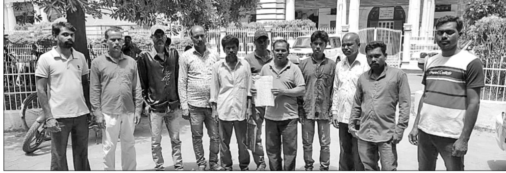
ଅଭିଯୋଗ କରିବାକୁ ଆସିଥିବା ଚାଷୀମାନେ।