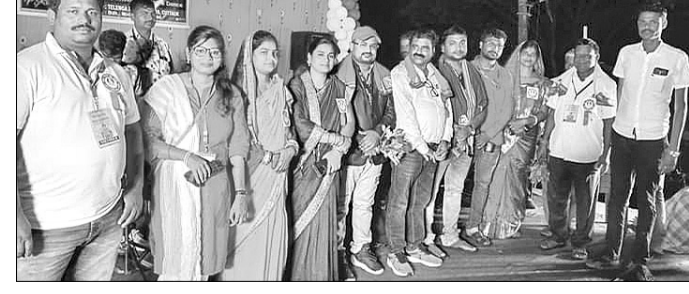
କାର୍ଯ୍ୟକ୍ରମରେ ଉପସ୍ଥିତ ଅତିଥି ଓ ଅନ୍ୟମାନେ।