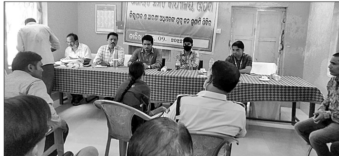
ମୁକ୍ତ ଜନଶୁଣାଣି ଶିବିରରେ ଜିଲ୍ଲାପାଳ ଓ ଏସପି ଅଭିଯୋଗ ଶୁଣୁଛନ୍ତି।

ବାଲେଶ୍ୱର ଜିଲ୍ଲା ଓପିପା ବ୍ଲକ ପରିସରରେ ଯୋମବାର ଜିଲ୍ଲାପାଳ ଓ ଏସପିଙ୍କ ମୁକ୍ତ ଜନଶୁଣାଣି ଶିବିର ଅନୁଷ୍ଠିତ ହୋଇଯାଇଛି।