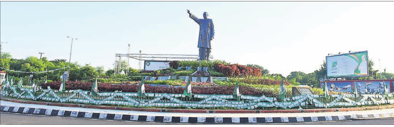
ପୁଖ୍ୟମନ୍ତ୍ରୀ ନବୀନ ପଟ୍ଟନାୟକଙ୍କୁ ସ୍ଵାଗତ ଜଣାଇବା ପାଇଁ ଭୁବନେଶ୍ଵର ବିମାନ ବନ୍ଦର ନିକଟରେ ବିଜେଡି ପଡାକାରେ ଛାଉଣି କରାଯାଇଛି।

ଭୁବନେଶ୍ଵର, ୫୯ (ବୁଧବେ) ପୁଖ୍ୟମନ୍ତ୍ରୀ ନବୀନ ପଟ୍ଟନାୟକ ରବିବାର କ୍ୟାପିଟାଲ ଫାଉଣ୍ଡେସନ ଯୋଗାଇଥିବା ପକ୍ଷରୁ ଜୀବନକ୍ୟାପା ସାଧନା ପୁରସ୍କାର ଗ୍ରହଣ କରିଛନ୍ତି। ଏହି ପୁରସ୍କାର ପୁଖ୍ୟମନ୍ତ୍ରୀଙ୍କୁ ମିଳିବା ପରେ ବିଜେଡି ଶିବିରରେ ଖୁସିର ଲହରୀ ଖେଳିଯାଇଛି। ଏଥିପାଇଁ ଦିଲ୍ଲୀରେ ଦଳୀୟ ନେତାମାନେ ବ୍ୟାପକ ଆୟୋଜନ କରିଥିଲେ। ସେଠାରେ ରହୁଥିବା ପ୍ରବାସୀ ଓଡ଼ିଆଙ୍କୁ ଏକତ୍ରିତ କରିବା ସହ ଦଳର ସୁର ଓ ଛାତ୍ର ନେତାମାନେ ସେମାନଙ୍କ ସହିତ ଯୋଗଦେଇଥିଲେ।