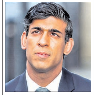
ରଷି ସୁନକ, ପରାଜିତ ପ୍ରଧାନମନ୍ତ୍ରୀ ପ୍ରାର୍ଥୀ

ଏହି ଅଭିଯାନରେ ମୋ ସପକ୍ଷରେ ମତଦାନ କରିଥିବା ସମସ୍ତଙ୍କୁ ଧନ୍ୟବାଦ ଦେଉଛି। କଞ୍ଚରଭେଟିକ୍ ପାର୍ଟିର ନେତା ତଥା ପ୍ରଧାନମନ୍ତ୍ରୀ ହେବାକୁ ଯାଉଥିବା ଲିଭ୍ ଟ୍ରାସ୍ ଭାରତ-ବ୍ରିଟେନ୍ ମଧ୍ୟରେ ରଣନୈତିକ, ଅର୍ଥନୈତିକ ସମ୍ପର୍କକୁ ମଜବୁତ କରିବା ପାଇଁ ବରିଷ୍ଠ ବ୍ରିଟିଶ୍ ରାଜନେତାଙ୍କ ମଧ୍ୟରୁ ଅନ୍ୟତମ ଟ୍ରାସ୍ ଅନ୍ତର୍ଜାତୀୟ ବାଣିଜ୍ୟ ସଚିବ ଥିବାବେଳେ ଗତବର୍ଷ ମେ'ରେ ବୋରିସ୍ ଜନ୍ସନ ସରକାରଙ୍କ ପକ୍ଷରୁ ଭାରତ ସହ ଦ୍ୱିପକ୍ଷ ବାଣିଜ୍ୟ ସହଯୋଗୀତା (ଇଡିପି) ଚୁକ୍ତିନାମା ପ୍ରସ୍ତୁତ କରିଥିଲେ। ବର୍ତ୍ତମାନର ମୁଖ୍ୟ ବାଣିଜ୍ୟ ଚୁକ୍ତିନାମା