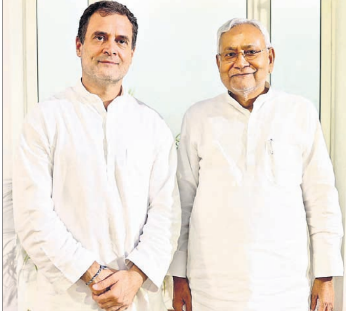
ନୂଆଦିଲ୍ଲୀଠାରେ ରାହୁଲ ଗାନ୍ଧୀଙ୍କୁ ତାଙ୍କ ବାସଭବନରେ ଭେଟୁଛନ୍ତି ବିହାର ପୁଖ୍ୟମନ୍ତ୍ରୀ ନୀତୀଶ କୁମାର।