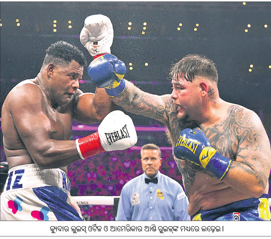
କୁସୁବାର ଲୁଇସ୍ ଓଡ଼ିଜ ଓ ଆମେରିକାର ଆଣ୍ଡି ରୁଇଜ୍ ମଧ୍ୟରେ ଲଢ଼େଇ।