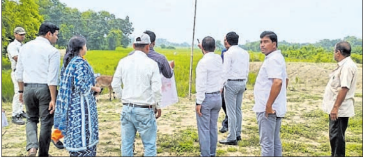
ପଦାବହୁଗାମୀ ଜମି ସର୍ବେକ୍ଷଣ କରୁଥିବା ଆରବିଆଇ ଟିମ୍ ଓ ଜିଲ୍ଲା ପ୍ରଶାସନ

ନଦୀ ନିକଟରେ ଥିବା ବନ୍ୟା ପ୍ରତିଷ୍ଠାରେ ପ୍ରଶାସନ ସହ ପୂର୍ଣ୍ଣାଙ୍ଗୁଳ ଆଲୋଚନା କରିଥିଲେ