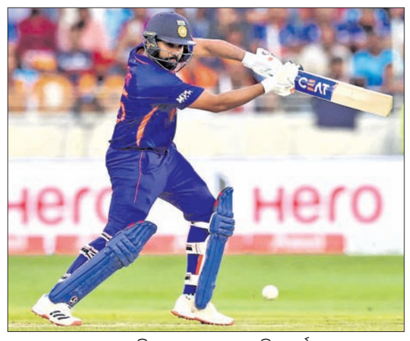
ଶର୍ମା ଖେଳିବା ଅବସରରେ ରେହିତ ଶର୍ମା ।

କ୍ରୁଭାଲ, ୨୯ ଅଧିନାୟକ ରେହିତ ଶର୍ମାଙ୍କ ଦ୍ରୁତ ଅର୍ଦ୍ଧଶତକ ସହାୟତାରେ ଭାରତ ମଜଲୁମ ଅନୁଷ୍ଠିତ ଏସିଆ କପ୍ ଜିଟକର ଶ୍ରୀଲଙ୍କା ବିପକ୍ଷ ସୁପର ଫୋର ମ୍ୟାଚରେ ୧୭୩ ରନ ସ୍କୋର କରିଛି । ଅନ୍ୟପକ୍ଷରେ ଆବଶ୍ୟକ ସମୟରେ ଶ୍ରୀଲଙ୍କା ବୋଲରମାନେ ଉଇକେଟ୍ ହାସଲ କରି ଦଳପାଇଁ ଆଶା ଉଜାଡିତ କରିଛନ୍ତି । ବ୍ୟାଟିଂ ଆମନ୍ତ୍ରଣ ପାଇଥିବା ଭାରତ ଦ୍ୱିତୀୟ ଓଭରରେ ଲୋକେଶ ରାହୁଲ(୬)ଙ୍କ ଉଇକେଟ୍ ହରାଇଥିଲେ । ପୂର୍ବ ୨ ମ୍ୟାଚରେ ଅର୍ଦ୍ଧଶତକ ହାସଲ କରିଥିବା ବିରାଟ କୋହଲି ଏଠାରେ ଖାତା ଖୋଲିବା ପୂର୍ବରୁ ଆଉଟ୍ ହେବାକୁ ଭାରତ ୧୩ ରନରେ ୨ ଉଇକେଟ୍ ହରାଇ ପ୍ରାରମ୍ଭିକ ବ୍ୟାଟିଂ ବିପର୍ଯ୍ୟୟର ସମ୍ମୁଖୀନ ହୋଇଥିଲା ।