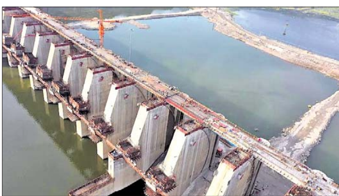
ପୋଲାଭରମ୍ ପ୍ରକଳ୍ପ ନିର୍ମାଣ ହେଉଥିବାରୁ ଏହା କାର୍ଯ୍ୟକାରୀ ହେଲେ ଓଡ଼ିଶାର ବହୁ ଅଞ୍ଚଳ ଜଳମଗ୍ନ ହେବ। ନିକଟରେ ଓଡ଼ିଶାର