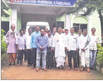
ଆନାରେ ଏତଲା ଦେବାକୁ ଆସିଥିବା ଜୁଇ ସମାଜ ।

ଯୁକ୍ତବାଣୀ ଅଫିସ/ପିରିଲିଆ, ୬.୯ କୁଇ ସମାଜ ପିରିଲିଆ ଶାଖା ପକ୍ଷରୁ ପୁରୀ ଶଙ୍କରାଚାର୍ଯ୍ୟ ଜଗତଗୁରୁ ନିଖୁଳାନନ୍ଦ ସରସ୍ୱତୀଙ୍କୁ ଗିରଫ କରିବା ପାଇଁ ପିରିଲିଆ ଆନାରେ ମଙ୍ଗଳବାର ଏତଲା ଦିଆ ଯାଇଛି ।