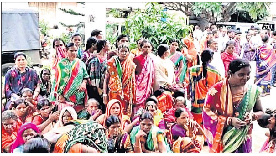
ଆନାରେ ବସିଥିବା ଗ୍ରାମବାସୀ ।

ବାଲିଗୁଡ଼ା, ୬.୯.୨୨-ଏ.ଏ.ଏ. ଦେଶୀ ମହଲ ମଦ ବନ୍ଦ ଓ ପ୍ରସ୍ତୁତି ବିରୋଧ କରି ବାଲିଗୁଡ଼ା ଆନା ଅନ୍ତର୍ଗତ କୁଟିକିଆ ପଞ୍ଚାୟତର ଶାନ୍ତିନିକ ମହଲା ଓ ପୁରୁଷ ମଙ୍ଗଳବାର ବାଲିଗୁଡ଼ା ଆନା ପରିସରରେ ଆନାରେ ବସିଥିଲେ ।