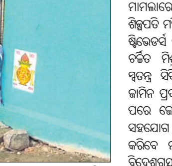
ବୋହୂ ମାନ୍ୟତା ଦାବିରେ ଯୁବତୀ ଜଣକ ପ୍ରେମିକଙ୍କ ଘର ଆଗରେ ଧାରଣା ଦେଇଛନ୍ତି

ଦେବଗଡ଼,୨୧(ଡି.ଏନ.ଏ): ବୋହୂର ମାନ୍ୟତା ଦାବିରେ ଜଣେ ଯୁବତୀ ଦେବଗଡ଼ ଜିଲ୍ଲା ଉପାଧ୍ୟକ୍ଷ ଥାନା ଅନ୍ତର୍ଗତ ବାବରକୋଟ ଗ୍ରାମ ଛିଡ଼ା ପ୍ରେମିକଙ୍କ ଘର ଆଗରେ ଧାରଣା ଦେଇଛନ୍ତି