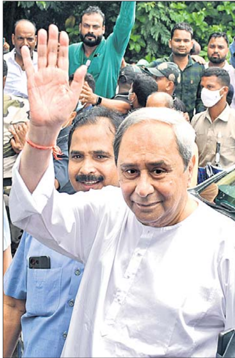
ମୁଖ୍ୟମନ୍ତ୍ରୀ ନବୀନ ପଟ୍ଟନାୟକ ମଙ୍ଗଳବାର ନୂଆଦିଲ୍ଲୀରୁ ଫେରିବା ପରେ ତାଙ୍କୁ ସ୍ୱାଗତ କରିବା ପାଇଁ ଭୁବନେଶ୍ୱର ବିମାନବନ୍ଦର ନିକଟରେ ସମବେତ ବିଜେଡି ନେତା ଓ କର୍ମୀ।