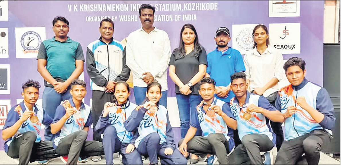
କାନ୍ୟା ଛୁନିୟର ଉତ୍ତମ ଚାମ୍ପିୟନସିପ୍ରେ ପଦକ ବିଜେତା ଓଡ଼ିଶା ପ୍ରତିଯୋଗୀମାନେ କର୍ମକର୍ମାଳୟ ସହ ।

(ଅଣ୍ଡୋବର ୧୬ରୁ ନଭେମ୍ବର ୧୩)କୁ ସେ ବାଦ୍ ପଡ଼ିଛନ୍ତି । ତାଙ୍କର ଅପେକ୍ଷାଧାର ହେବା ସ୍ତାଇଟ ବଲ୍ ତାଙ୍କୁ ଅତି କମ୍ରେ ପ୍ରାୟ ସମସ୍ତ ସମୟ ଲାଗିବ । ଦକ୍ଷିଣ ଆଫ୍ରିକା ଟି୨୦ ବିଶ୍ୱକପ୍ରେ ଏହାର ଉଦ୍ଘାଟନା ମ୍ୟାଚ ଅଣ୍ଡୋବର ୨୪ରେ ଖେଳିବ । ଅଣ୍ଡୋବିଆରେ ଆଇସିସି ଲଜେନ୍ସରେ ଭାରତୀୟ ପୂର୍ବରୁ ଭାରତରୁ ରୁଲେ ଯିବ ଦକ୍ଷିଣ ଆଫ୍ରିକା । ସେଠାରେ ସେପ୍ଟେମ୍ବର ୨୮ରୁ ଅଣ୍ଡୋବର ୧୧ ମଧ୍ୟରେ ୩ ଅନ୍ତର୍ଜାତୀୟ ଟି୨୦ ଓ ସମାନ ସଂଖ୍ୟକ ଅନ୍ତର୍ଜାତୀୟ ଦିନିକିଆ ଖେଳିବ । ଦକ୍ଷିଣ ଆଫ୍ରିକା ଟି୨୦ ଦଳ : ଚେନ୍ନାଇ କିଙ୍ଗ୍ସ (ଅଧିନାୟକ), କ୍ୱିଣ୍ଟନ ଡିକକ୍, ରିକା ହେଷ୍ଟିକ୍, ହେନର୍ଡ୍ କ୍ଲୁସେନ, କେଶାବ ମହାରାଜ, ଲୁଗ୍ରି ଏନଗିଟି, ଏନଗିଟ ନଗେ, ଫ୍ରେଡ ପାର୍ନେଲ, ହେନ ପ୍ରୋଟୋସିଅସ, କାରିସୋ ରାବାଟା, ରିଲି ରୋସୋ, ଗାବ୍ରିଏଲ ସାମ୍ପି, ଟ୍ରିଷ୍ଟିଆନ୍ ସ୍କୁ । ଦକ୍ଷିଣ ଆଫ୍ରିକା ଦିନିକିଆ ଦଳ: ଚେନ୍ନାଇ କିଙ୍ଗ୍ସ (ଅଧିନାୟକ), କ୍ୱିଣ୍ଟନ ଡିକକ୍, ରିକା ହେଷ୍ଟିକ୍, ହେନର୍ଡ୍ କ୍ଲୁସେନ, କେଶାବ ମହାରାଜ, କାନେମନ ମଲାନ ଏବଂ ମାରକ୍ରାମ୍, ଦେବିତ ମିଲର, ଲୁଗ୍ରି ଏନଗିଟି, ଏନଗିଟ ନୋଗେ, ଫ୍ରେଡ ପାର୍ନେଲ, ଆଷ୍ଟିଲ ଫେଲ୍‌ଜୋୟା, ହେନ ପ୍ରୋଟୋସିଅସ, କାରିସୋ ରାବାଟା, ଗାବ୍ରିଏଲ ସାମ୍ପି ।