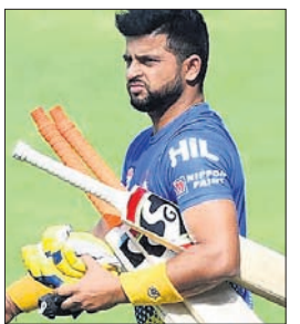
ନୂଆଦିଲ୍ଲୀ, ୨୯ (ପି.ଟି.):