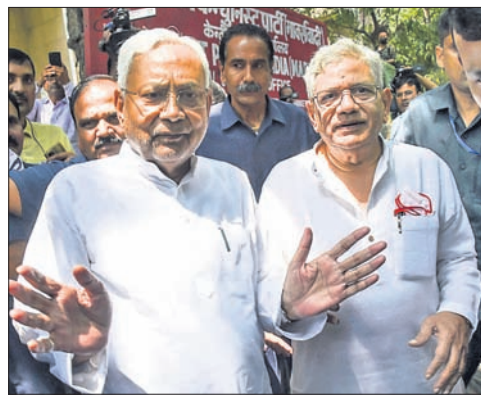
ସିପିଏମ୍ ନେତା ସୀତାରାମ ଯେତୁରାଙ୍କ ସହ ନୀତୀଶ କୁମାର