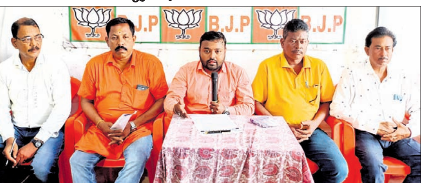
ଖବରଦାତା ସମ୍ମିଳନୀରେ ଭାଜପା କର୍ମକର୍ତ୍ତା।

ବାଲେଶ୍ୱର ଅଫିସ୍, ୨୧ ବନ୍ୟା କ୍ଷୟକ୍ଷତି ତାଲିକାରୁ ବାଲେଶ୍ୱର ଜିଲ୍ଲା ସଦର ବ୍ଲକ୍ ବାଦ୍ ପଡ଼ିଛି । ଜିଲ୍ଲା ପ୍ରଶାସନର ଏଭଳି ଅବହେଳା ପ୍ରତିବାଦରେ ଜିଲ୍ଲା ସ୍ତର ନିକଟସ୍ଥ ସଦର ଭାଜପା କାର୍ଯ୍ୟାଳୟରେ ମଙ୍ଗଳବାର ଏକ ଖବରଦାତା ସମ୍ମିଳନୀ କରାଯାଇଛି ।