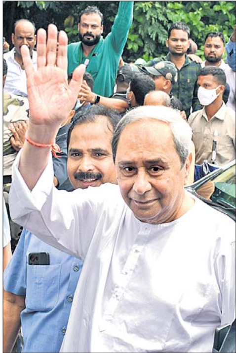
ମୁଖ୍ୟମନ୍ତ୍ରୀ ନବୀନ ପଟ୍ଟନାୟକ ମଙ୍ଗଳବାର ନୂଆଦିଲ୍ଲୀରୁ ଫେରିବା ପରେ ତାଙ୍କୁ ସ୍ଵାଗତ କରିବା ପାଇଁ ଭୁବନେଶ୍ଵର ବିମାନବନ୍ଦର ନିକଟରେ ସମବେତ ବିଜେଡି ନେତା ଓ କର୍ମୀ।