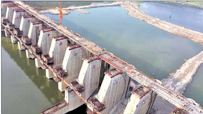
ପୋଲାଭରମ୍ ପ୍ରକଳ୍ପ ନିର୍ମାଣ ହେଉଥିବାରୁ ଏହା କାର୍ଯ୍ୟକାରୀ ହେଲେ ଓଡ଼ିଶାର ବହୁ ଅଞ୍ଚଳ ଜଳମଗ୍ନ ହେବ। ନିକଟରେ ଓଡ଼ିଶାର ଅନେକ ଅଞ୍ଚଳରେ ବନ୍ୟା ଦେଖାଦେଇଛି। ବରାହ ଚିତ୍ରାମାଳା ସୁପାରିସର ଉଲ୍ଲେଖନ କରାଯାଇ ପ୍ରକଳ୍ପ ନିର୍ମାଣ କରାଯାଉଥିବା