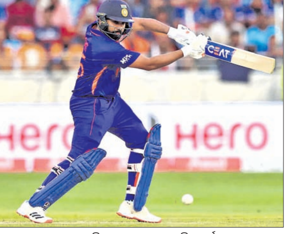
ଶର୍ମା ଖେଳିବା ଅବସରରେ ରେହିତ ଶର୍ମା।

କ୍ଲ୍ୟୁୟର୍, ୬:୩୯ ଅଧିନାୟକ ରେହିତ ଶର୍ମାଙ୍କ ଦ୍ରୁତ ଅର୍ଦ୍ଧଶତକ ସହାୟତାରେ ଭାରତ ମଙ୍ଗଳବାର ଅନୁଷ୍ଠିତ ଏସିଆ କପ୍ ଜିଟକେଟର ଶ୍ରୀଲଙ୍କା ବିପକ୍ଷ ସୁପର ଫୋର ମ୍ୟାଚରେ ୧୭୩ ରନ ସ୍କୋର କରିଛି। ଅନ୍ୟପକ୍ଷରେ ଆବଶ୍ୟକ ସମୟରେ ଶ୍ରୀଲଙ୍କା ବିଜୟରେ ଉତ୍ତମ ସହାୟକ କରି ବଳପାଇଁ ଆଶା ଉଜ୍ଜାବିତ କରିଛନ୍ତି। ବ୍ୟାଟି ଆମନ୍ତ୍ରଣ ପାଇଥିବା ଭାରତ ଦ୍ଵିତୀୟ ଓଭରରେ ଲୋକେଶ ରାହୁଲ(୬)ଙ୍କ ଉତ୍ତମ ସହାୟକ ହୋଇଥିଲା। ପୂର୍ବ ୨ ମ୍ୟାଚରେ ଅର୍ଦ୍ଧଶତକ ହାସଲ କରିଥିବା ବିରାଟ କୋହଲି ଏଠାରେ ଖାତା ଖୋଲିବା ପୂର୍ବରୁ ଆଉଟ ହେବାକୁ ଭାରତ ୧୩ ରନରେ ୨ ଉତ୍ତମ ସହାୟକ ପ୍ରାପ୍ତ ବିରାଟ କୋହଲି ବିପର୍ଯ୍ୟୟର ସମ୍ମୁଖୀନ ହୋଇଥିଲା।