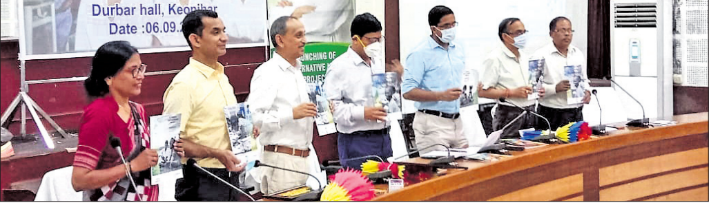
ଉଦ୍ଘାଟନା କାର୍ଯ୍ୟକ୍ରମରେ ଯୋଗଦେଇଥିବା ଅଧିକାରୀ।