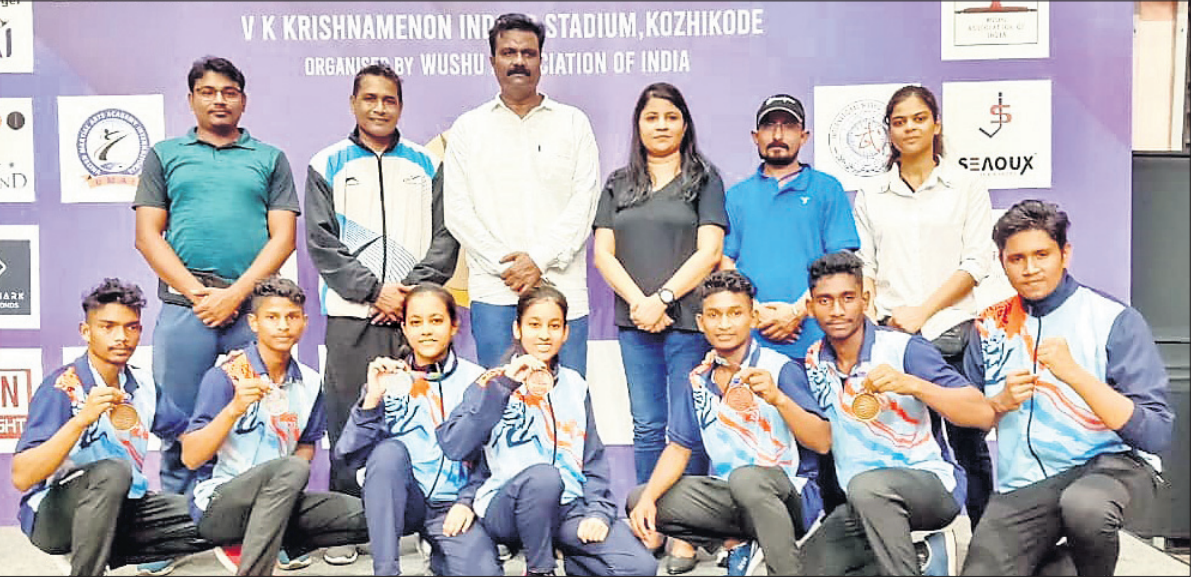
କ୍ରୀଡ଼ା କ୍ଲବ୍‌ରେ ଉପସ୍ଥାପିତ ହେଉଥିବା ପଦକ ବିଜେତା ଓଡ଼ିଶା ପ୍ରତିଯୋଗୀମାନେ କର୍ମକର୍ତ୍ତାଙ୍କ ସହ।