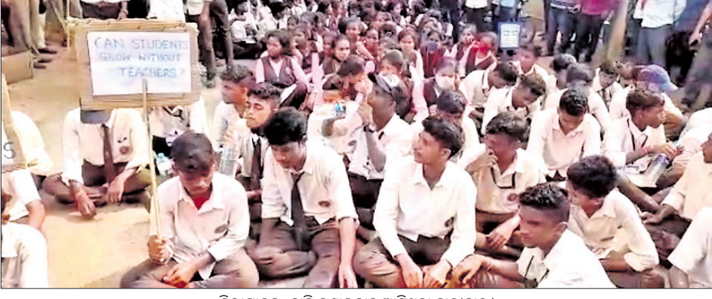
ଜିଲ୍ଲାପାଳଙ୍କୁ ଦାବି ଜଣାଇବାକୁ ଆସିଥିବା ଛାତ୍ରୀଛାତ୍ର।

ମୟୂରଭଞ୍ଜ ଜିଲ୍ଲା ବାଙ୍ଗରିପୋଷି ଏକଲବ୍ୟ ଆବାସିକ ବିଦ୍ୟାଳୟର ଛାତ୍ରୀଛାତ୍ରମାନେ ବିଭିନ୍ନ ସମସ୍ୟା ସମ୍ପର୍କରେ ଜିଲ୍ଲାପାଳଙ୍କୁ ଭେଟି ଦାବି ଜଣାଇବାକୁ ରାସ୍ତାକୁ ଓହ୍ଲାଇଛନ୍ତି। ମଙ୍ଗଳବାର ସ୍କୁଲ ବନ୍ଦ କରି ଆନ୍ଦୋଳନ କରିବା ପରେ ଦୀର୍ଘ ୬ଦି.ମି. ଚାଲି ଚାଲି ରହି ଏକଲବ୍ୟ ପରିସରରେ ଅଟକ ରହିଥିଲେ। ପରେ ୪୯ନଂ. ଜାତୀୟ ରାଜପଥରେ ଧାରଣା ଦେଇଥିବା ସୂଚନା ମିଳିଛି। ଦାବି ପୂରଣ ନ ହେଲେ ଆନ୍ଦୋଳନ ଜାରି ରହିବ ବୋଲି ସେମାନେ ପ୍ରକାଶ କରିଛନ୍ତି। ସୂଚନାଯୋଗ୍ୟ, ବାଙ୍ଗରିପୋଷି ବ୍ଲକ୍ ଶ୍ୟାମସୁନ୍ଦରପୁର ପଞ୍ଚାୟତରେ ରହିଛି ଏକଲବ୍ୟ ଆବେଦି ଆବାସିକ ବିଦ୍ୟାଳୟ। ଏଥିରେ ପ୍ରଥମରୁ +୨ ପର୍ଯ୍ୟନ୍ତ ଛାତ୍ରୀଛାତ୍ରମାନେ ଅଧ୍ୟୟନ କରୁଛନ୍ତି। ପଦାର୍ଥ ବିଜ୍ଞାନ ଓ ରସାୟନ ବିଜ୍ଞାନ ଶିକ୍ଷକ ପଦବୀ ପାଇଁ ପଢ଼ୁଥିବାରୁ ପାଠପଢ଼ାରେ ବାଧା ଉଠୁଛି। ସେହିପରି