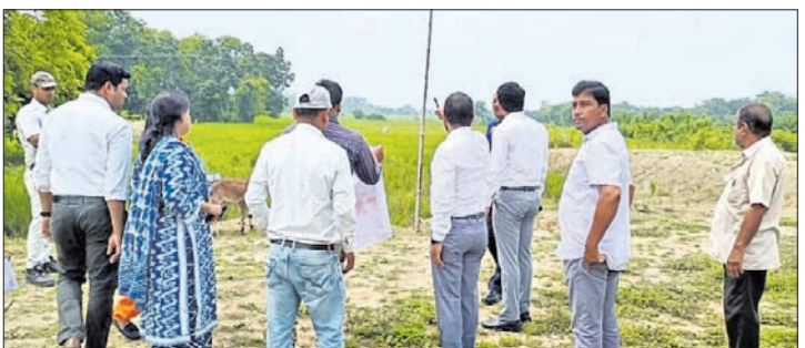
ପଦାବହୁଗାମିତ ଜମି ସର୍ବେକ୍ଷଣ କରୁଛନ୍ତି ଆର୍ଭିଆଇ ଟିମ୍ ଓ ଜିଲ୍ଲା ପ୍ରଶାସନ। ଛପା କାଗଜ କାରଖାନାର ପୁଣ୍ୟ ମାନସ ସିଦ୍ଧାନ୍ତ କରାଯାଉଥିବା ସୂଚନା ମିଳିଛି। ମହାବଳିକା ସମେତ ଉଚ୍ଚ ଅଧିକାରୀମାନେ କାରଖାନା ଲାଗି ୧୫୦ ଏକର ଜମି ପଦାବହୁଗାମିତରେ ପହଞ୍ଚି ଥିବା ବେଳେ ଏଠାରେ ଏହି ପ୍ରକଳ୍ପ ହେବା ଏକପ୍ରକାର ଆବଶ୍ୟକତା ରହିଛି। ଏହି ଜମି ବୁଢ଼ାବଳକ

ନଦୀ ନିକଟରେ ଥିବା ବନ୍ୟା ଛୁଟିକୁ ନେଇ ପ୍ରଶାସନ ସହ ପୂର୍ଣ୍ଣାଙ୍ଗୁଳୀ ଆଲୋଚନା କରିଥିଲେ। ଆବଶ୍ୟକ ପଦକ୍ଷେପ ବନ୍ୟାକଳକୁ କେନାଲ ଦେଇ ନିୟନ୍ତ୍ରଣ କରାଯାଇପାରିବ ବୋଲି ଅଧିକାରୀମାନଙ୍କୁ ଜିଲ୍ଲା ପ୍ରଶାସନ ପକ୍ଷରୁ କୁହାଯାଇଥିଲା। ଏହି ପ୍ରକଳ୍ପ ପାଇଁ ପୂର୍ବରୁ ଗତ ଏପ୍ରିଲରେ ପ୍ରଥମଥର ପାଇଁ ଆର୍ଭିଆଇର ମଙ୍ଗଳିଆ ଟିମ୍ ଉଦ୍ଦେଶ୍ୟ ଏବଂ ଜିଲ୍ଲା ପ୍ରଶାସନ ସହଯୋଗରେ ନେତୃତ୍ୱା ବୁକ୍ ପଦାବହୁଗାମି, ବାଉଁଶମୁହାଁ ଏବଂ ନରହରିପୁର ଅଞ୍ଚଳରେ ଥିବା ସରକାରୀ ଜମିକୁ ବୁଲି ଦେଖିଥିଲେ। ପୁନର୍ବାର ଗତ ଜୁଲାଇ ୧୨ ତାରିଖରେ ଆର୍ଭିଆଇର ଏକ ଟିମ୍ ଜିଲ୍ଲାପାଳଙ୍କ ଅଧିକାରରେ ପହଞ୍ଚି ସେଠାରେ କିଛି ସମୟ ଆଲୋଚନା ପରେ ଜମି ସର୍ବେକ୍ଷଣ ପାଇଁ ପଦାବହୁଗାମି ଅଞ୍ଚଳକୁ ଯାଇ ଛୁଟି ଅନୁଧ୍ୟାନ କରିଥିଲେ।