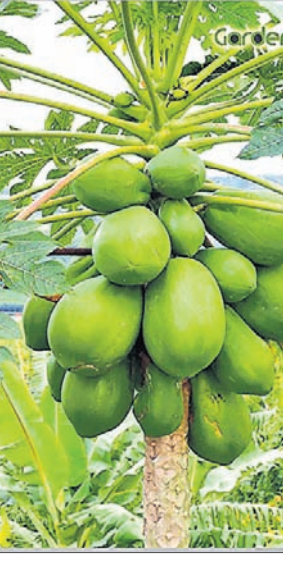
ସିଞ୍ଚନ କରାଯାଇ ପାରିବ। ପିକ୍‌କି ଓ ଲେମ୍ବୁର ପାଣିକୁ ଅଧିକ ଦିଅନ୍ତୁ।

ଅନୁରଭଞ୍ଜା ଗଛର ମୂଳଗଡ଼ା ରୋଗ ପ୍ରତିକାର ପାଇଁ ଗଛମୂଳକୁ ମାଟି ଦେଇ ଓ ପାଣି କମିବାକୁ ଦିଅନ୍ତୁ ନାହିଁ। ରୋଗୀ ଗଛକୁ ବାହାର କରିଦିଅନ୍ତୁ। ମୋଟାଲାଇଫ୍ ଓ ମାକୋଜେବ୍ (ଡିଡୋମିଲ୍ ଏମ୍.ଜେଭ୍) ଏକ ଲିଟର ପାଣିରେ ୨ ଗ୍ରାମ୍ ମିଶାଇ ଗଛମୂଳରେ ମାଟିଭିତ୍ତୀ କରନ୍ତୁ। ବର୍ଷାଦିନେ ଲେମ୍ବୁରେ ଫାଇଗୋଫ୍‌ଫୋରା ଶତା ରୋଗ ପ୍ରାୟୁର୍ଭାବ ବେଶୀ ହୁଏ। ଗଛଗଛର ନିମ୍ନ ଭାଗରୁ ଅଠା ବାହାରେ। ଏହାର ଦମନ ପାଇଁ ଆଗ୍ରାନ୍ତ ହୋଇଥିବା ଡାକପତ୍ରକୁ ଗଛରୁ କାଟି ଦିଅନ୍ତୁ। ବୋର୍ଡୋ ମିଶ୍ରଣ ବା ଦ୍ରବଣ ସିଞ୍ଚନ କରନ୍ତୁ ଓ କଟା ଜାଗାରେ ପ୍ରଲେପ ଦିଅନ୍ତୁ। ଏକ ମାସ ଅନ୍ତରେ କପଡ଼ ଅକ୍ସିକ୍ୱେଲିନ ଡିମିଲ୍ ଏକ ଲିଟର ପାଣିରେ ୩ ଗ୍ରାମ୍ ମିଶାଇ ସିଞ୍ଚନ କରନ୍ତୁ। ଏକଭାଗ ବୋର୍ଡୋ ମିଶ୍ରଣ (୫:୫:୫୦)କୁ ୧୫ ଦିନ ଅନ୍ତରେ