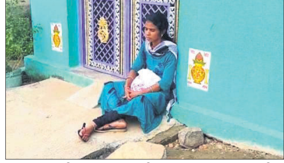
ବୋହୂ ମାନ୍ୟତା ଦାବିରେ ଯୁବତୀ ଜଣକ ପ୍ରେମିକଙ୍କ ଘର ଆଗରେ ଧାରଣା ଦେଇଛନ୍ତି।