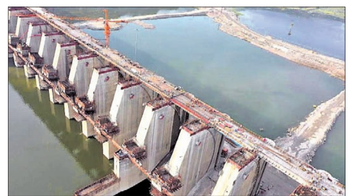
ପୋଲାଭରମ୍ ପ୍ରକଳ୍ପ ନିର୍ମାଣ ହେଉଥିବା ପାଇଁ ଏହା କାର୍ଯ୍ୟକାରୀ ହେଲେ ଓଡ଼ିଶାର ବହୁ ଅଞ୍ଚଳ ଜଳମଗ୍ନ ହେବ। ନିକଟରେ ଓଡ଼ିଶାର ପୋଲାଭରମ୍ ପ୍ରକଳ୍ପ ନିର୍ମାଣ ହେଉଥିବା ପାଇଁ ଏହା କାର୍ଯ୍ୟକାରୀ ହେଲେ ଓଡ଼ିଶାର ବହୁ ଅଞ୍ଚଳ ଜଳମଗ୍ନ ହେବ।

ସର୍ବୋଚ୍ଚ ଆଦାଲତ କହିଛନ୍ତି। ପ୍ରକୃତ ପାଇଁ କେନ୍ଦ୍ର ସରକାର ପାଣି ଯୋଗାଇଛନ୍ତି। ତେଣୁ ସମସ୍ତ ସମ୍ପୂର୍ଣ୍ଣ ରାଜ୍ୟର ମୁଖ୍ୟ ସଚିବଙ୍କ ଦୈନିକ ତାକି କେନ୍ଦ୍ର ସମାଧାନ ସ୍ତ୍ରୁ ବାହାର କରିବା ଆବଶ୍ୟକ। ସେଥିରେ କୌଣସି ମତାମତ ନାହିଁ।