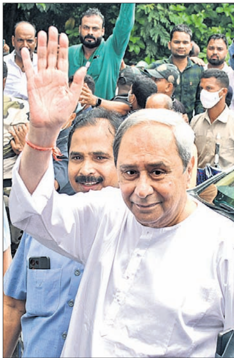
ମୁଖ୍ୟମନ୍ତ୍ରୀ ନବୀନ ପଟ୍ଟନାୟକ ମଙ୍ଗଳବାର ନୂଆଦିଲ୍ଲୀରୁ ଫେରିବା ପରେ ତାଙ୍କୁ ସ୍ୱାଗତ କରିବା ପାଇଁ ଭୁବନେଶ୍ୱର ବିମାନବନ୍ଦର ନିକଟରେ ସମବେତ ବିଜେଡି ନେତା ଓ କର୍ମୀ।