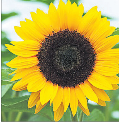
ସୂର୍ଯ୍ୟମୁଖୀ ଚାଷରେ କଳକି ରୋଗ ଦମନ ପାଇଁ ପ୍ରତି ଲିଟର ପାଣିରେ ୦.୫ ମି.ଲି. ଡାଇପେଟୋକୋନାଭୋଲ୍ କିମ୍ବା ଅକ୍ସିକ୍ୱେଲିନ ୨ ଗ୍ରାମ୍/ଲିଟର ମିଶାଇ ପତ୍ର ସିଞ୍ଚନ କରନ୍ତୁ।