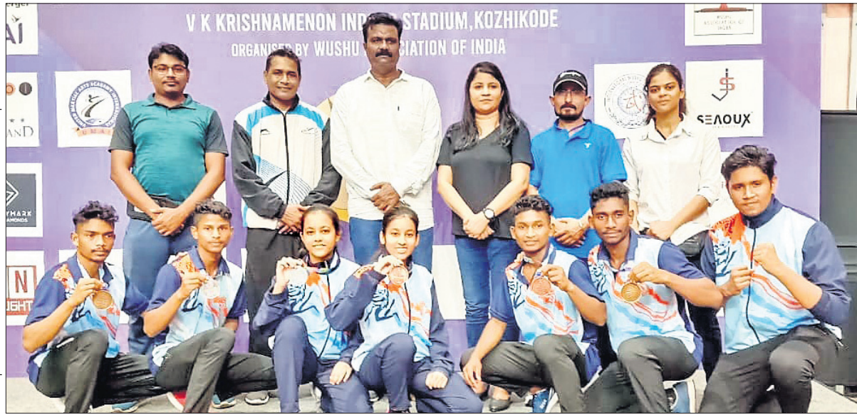
ଜାତୀୟ ଜୁନିୟର ଉତ୍ତମ ଚାମ୍ପିୟନସ୍‌ସ୍‌ରେ ପଦକ ବିଜେତା ଓଡ଼ିଶା ପ୍ରତିଯୋଗୀମାନେ କର୍ମକର୍ତ୍ତାଙ୍କ ସହ ।

ପୂର୍ବରୁ ଏକ ନମ୍ବର ମାନ୍ୟତାପ୍ରାପ୍ତ ଚାରିନମ୍ବର ମେଡଭେଡେସ୍ ବିଦା ହୋଇ ସାରିଥିବା ବେଳେ ୨୦୦୦ ମସିହା ପରେ ପ୍ରଥମ ଥର ପାଇଁ ଦୁଇ ଚମ୍ପିୟନ୍‌ଙ୍କ ମଧ୍ୟରେ କ୍ୱାର୍ଟର ଫାଇନାଲରେ ପ୍ରବେଶ କରିବାରେ ଅସମର୍ଥ ରହିଛନ୍ତି । ଚିଆପୋ ପରବର୍ତ୍ତୀ ରାଉଣ୍ଡରେ ୯ ନମ୍ବର ମାନ୍ୟତାରେ ରହିଥିବା ଆଣ୍ଡି ରୁଜଲେଭଲକୁ ଭେଟିବେ । ରୁଜଲେଭଲ ବିଶ୍ୱ ମାନ୍ୟତାର ୬ ନମ୍ବର ସ୍ଥାନରେ ରହିଥିବା କାମ୍ ନୋବିକ୍ ୬-୪, ୬-୪ ଓ ୬-୪ ସେଟ୍‌ରେ ପରାସ୍ତ କରିଛନ୍ତି । ଦୁଇଟି ଗେମ୍‌ ପଛୁଆ ରହିଥିବା ବିଷ୍ଣୁ ମାନ୍ୟତାର ୧୧