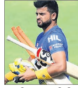
ନୂଆଦିଲ୍ଲୀ, ୬/୯ (ପି.ଟି.):

ପୂର୍ବତନ ଭାରତୀୟ ଖେଳାଳି ସୁରେଶ ରାଇନା ଜିଉଜେଟ୍‌ରେ ସମସ୍ତ ଫର୍ମାଟ୍‌ରେ ଅବସର ଗ୍ରହଣ କରିଛନ୍ତି । ପୂର୍ବରୁ ଅନ୍ତର୍ଜାତୀୟ ଜିଉଜେଟ୍‌ରେ ରାଇନା ଅବସର ଗ୍ରହଣ କରି ସାରିଥିବା ବେଳେ ଘରୋଇ ଜିଉଜେଟ୍‌ରେ ଆଇପିଏଲରୁ ମଙ୍ଗଳବାର ଅବସର ଗ୍ରହଣ କରିଛନ୍ତି । ଏହା ସହିତ ସେ ଲିଜେଣ୍ଡ ଲିଗ୍ ଏବଂ ବିଭିନ୍ନ ବିଦେଶୀ ଟି୨୦ ଲିଗ୍‌ରେ ବର୍ତ୍ତମାନ ଅଂଶଗ୍ରହଣ କରିପାରିବେ । ଅଗଷ୍ଟ ୧୫, ୨୦୨୦ରେ ମହେନ୍ଦ୍ର ସିଂ ଧୋନୀଙ୍କ ପଛେ ପଛେ ସେ ଅନ୍ତର୍ଜାତୀୟ ଜିଉଜେଟ୍‌ରେ ସମାପନ ଗ୍ରହଣ କରିଥିଲେ । ୨୦୨୧ ମାସ ସେ ଆଇପିଏଲ ଖେଳିଥିବା ବେଳେ ୨୦୨୨ରେ ତେଲୁଗୁ ପୁସରକିଙ୍ଗ୍‌ସ୍ ପକ୍ସରୁ ତାଙ୍କୁ ରିଲିଜ୍ କରାଯାଇଥିଲା । ନିଜ ଜିଉଜେଟ୍‌ରେ ସେ ବିସିଆଇ, ଭଉର ପ୍ରବେଶ ଜିଉଜେଟ୍‌ ଓ ବିଏସ୍‌କେକୁ ଧନ୍ୟବାଦ ଜ୍ଞାପନ କରିଥିଲେ । ଘରୋଇ ଜିଉଜେଟ୍‌ରେ ସ୍କ୍ରାମ୍ ଖେଳାଳି କୌଣସି ବିଦେଶୀ ଟି୨୦ ଲିଗ୍ କିମ୍ବା ଲିଜେଣ୍ଡ ଲିଗ୍‌ରେ ଅଂଶଗ୍ରହଣ କରିବା ଉପରେ କଟକଣା ରହିଥିବାରୁ ରାଇନା ଅବସର ଗ୍ରହଣ କରିଥିବା ଚର୍ଚ୍ଚା ହେଉଛି । ଆସନ୍ତା ବର୍ଷରୁ ଦକ୍ଷିଣ ଆଫ୍ରିକାରେ ହେବାକୁ ଥିବା ଟି୨୦ ଲିଗ୍‌ର ସମସ୍ତ ପ୍ରୋଜେକ୍ଟ ଭାରତୀୟ ହୋଇଥିବା ବେଳେ ଏଥିରେ ବିଏସ୍‌କେ ମଧ୍ୟ ସାମିଲ ରହିଛି । ଅକ୍ଟୋବର ୨୦୨୧ରେ ରାଇନା ଶେଷ ଥର ପାଇଁ ବିଏସ୍‌କେ ଜର୍ସିରେ ନଜର ଆସିଥିଲେ । ୨୦୧୧ ଦିନିଆଁ ବିଶ୍ୱକପ୍ ବିଜୟୀ ଦଳର ସଦସ୍ୟ ରହିଥିବା ରାଇନା ଭାରତ ପାଇଁ ୨୨୬ ଦିନିଆଁ, ୧୮ ଟେଷ୍ଟ୍ ଓ ୬୮ ଟି୨୦ ମ୍ୟାଚ ଖେଳିଛନ୍ତି ।