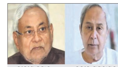
ନୀତୀଶ କୁମାର ନବୀନ ପତ୍ତନାୟକ

ଭୁବନେଶ୍ୱର, ୭/୯ (ବ୍ୟୁରୋ) କେନ୍ଦ୍ରରେ କ୍ଷମତାସୀନ ଭାଜପା ସରକାରଙ୍କୁ ଆସନ୍ତା ୨୦୨୪ ନିର୍ବାଚନରେ ରାଜିତ୍ୱକୁ କରିବାକୁ ବିରୋଧୀଙ୍କୁ ଏକାଠି କରିବା ପାଇଁ ବିହାର ପୁଷ୍ପମାଲ୍ୟ ନୀତୀଶ କୁମାର ଭୋଗସାୟର ଉଦ୍ୟମ ଚଳାଇଛନ୍ତି। ନୀତୀଶ ଏବେ ଜଣଙ୍କ ପରେ ଜଣେ ବିରୋଧୀ ନେତାଙ୍କୁ ଭେଟୁଛନ୍ତି। ସେ ଓଡ଼ିଶା ପୁଷ୍ପମାଲ୍ୟ ନବୀନ ପତ୍ତନାୟକଙ୍କୁ ସାମ୍ବାଦ କରିବା ନେଇ ଚର୍ଚ୍ଚା କୋର ଧରିଛି। ଏ ନେଇ ଜାତୀୟ ରଣମାଧ୍ୟମରେ ଖବର ପ୍ରକାଶ ପାଇଛି। ପୂର୍ବରୁ ନୀତୀଶ ଓଡ଼ିଶା ଆସି ନବୀନ ନିବାସରେ