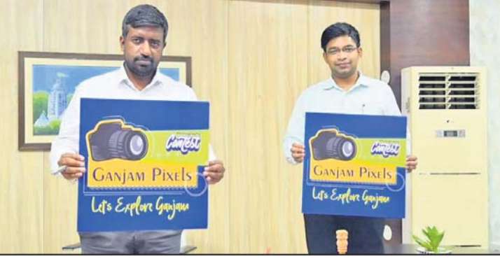
ଜିଲାପାଇ ଓ ସିଡିଓ ଶୁଭାଞ୍ଜନ କରୁଛନ୍ତି।