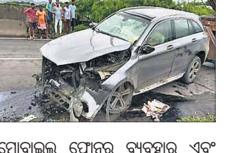
ମୋବାଇଲ ଫୋନ୍ ବ୍ୟବହାର ଏବଂ ଟ୍ରାଫିକ୍ ସିଗ୍ନାଲକୁ ଅଣଦେଖା କରିବା

ଦୁର୍ଘଟଣାଜନିତ ମୃତ୍ୟୁର ଅନ୍ୟତମ କାରଣ ବୋଲି ସଡ଼କ ପରିବହନ ମନ୍ତ୍ରାଳୟ ରିପୋର୍ଟରେ କୁହାଯାଇଛି। ଉକ୍ତ ରିପୋର୍ଟ ଅନୁଯାୟୀ ୨୦୨୦ରେ ସିଏବିଏନ୍ ବ୍ୟବହାର ନ କରିବା କାରଣରୁ ଦୁର୍ଘଟଣାରେ ୧୧ ପ୍ରତିଶତରୁ ଅଧିକ ଜଣଙ୍କ ମୃତ୍ୟୁ ହୋଇଥିଲା।