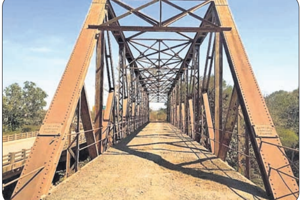
ପ୍ରାୟ ଦଶ ବର୍ଷ ତଳେ ଏହି ଲୁହା ପୋଲ ବ୍ୟବହାର ହେଉଥିଲା । ବୁଲି ରାଜ୍ୟ ମଧ୍ୟରେ ଯାତାୟତରେ ସୁସମ୍ପର୍କ ଗଢି ଉଠିବା ସହ ବ୍ୟବସାୟିକ

ନରେଶ ଚନ୍ଦ୍ର ପଟ୍ଟନାୟକ କେନ୍ଦ୍ରାପଡ଼ା, ୭୮୯ ଓଡ଼ିଶା ଓ ଝାଡ଼ଖଣ୍ଡ ସୀମାରେ ଥିବା ବୈତରଣୀ ନଦୀ ଉପରେ ଶହେ ବର୍ଷ ପୂର୍ବରୁ ନିର୍ମାଣ ହୋଇଥିଲା ସେତୁ। ଉଭୟ ରାଜ୍ୟ ମଧ୍ୟରେ ସମ୍ପର୍କ ଯୋଗୁଥିବା ବ୍ରିଡ୍ଜ ଅମଳର ଏହି ସେତୁ ଆଜି ଅସ୍ତରାଶିତ। ଏହା ଉପରେ ପୂର୍ବଭଳି ଲୋକେ ଯାତାୟତ କରିବାକୁ ନିରାପଦ ମଣ୍ଡଳାହାନ୍ତି। ତେଣୁ ଏହି ପୋଲର ମରାମତି କରାଯାଇ ଏହିସମୟ ମାନ୍ୟତା ଦେବା ସହିତ ଏହାର ସୁରକ୍ଷା କରାଯାଇପାରିଲେ ଏହା ଏକ ପର୍ଯ୍ୟଟନ ସ୍ଥଳ ଭାବେ ବିବେଚିତ ହୋଇପାରିବ ବୋଲି ବୁଝାକାଟା ମହଲରେ ମତପ୍ରକାଶ ପାଇଛି। ବିଚ୍ଛିନ୍ନାଞ୍ଚଳ ଷଡ଼େଇକଳା, ଖରପୁଆଁ, ଚକ୍ରଧରପୁର, ଚାନ୍ଦିଆ ଏକଦା ଅବିଭକ୍ତ ଓଡ଼ିଶା ରାଜ୍ୟରେ ରହିଥିଲା । ଏଣୁ ଏହି ପୋଲ ସେ ସମୟରେ ରୁକୁରୁ ବନ୍ଦନ କରୁଥିଲା । ପରବର୍ତ୍ତୀ ସମୟରେ ଓଡ଼ିଶା ଓ ବିହାର (ବର୍ତ୍ତମାନ ଝାଡ଼ଖଣ୍ଡ) ରାଜ୍ୟକୁ ଏହି ପୋଲ ଲୁହାପଥର ପରିବହନର ପୃଷ୍ଠା ଯାତାୟତ ପଥ ପାଲଟିଥିଲା । ଏହାର ଅପରପାର୍ଶ୍ଵ ଉତ୍ତରରେ ଥିବା ବ୍ରିଡ୍ଜ ଅମଳର ପଥର ପୋଲର ଅବଶେଷ ଅନେକଙ୍କୁ ଏବେ ମଧ୍ୟ ଆକୃଷ୍ଟ କରୁଛି ।