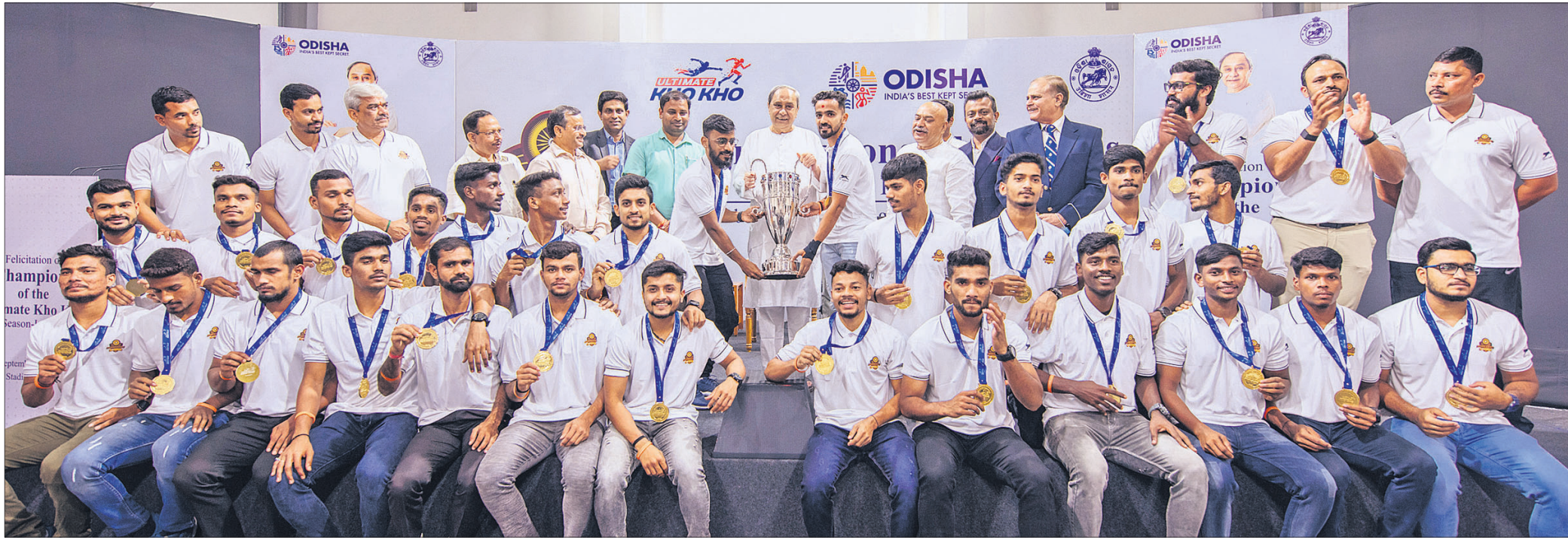
କଳିଙ୍ଗ ଷ୍ଟାଡ଼ିୟମର ଭାରୋତୋଳନ ହଲରେ ମୁଖ୍ୟମନ୍ତ୍ରୀ ନବୀନ ପଟ୍ଟନାୟକ ରୂପବାର ଅଭିନେତା ଖୋ ଖୋ ଲିଭ୍ ଚାମ୍ପିୟନ ଓଡ଼ିଶା ଜଗରନନୁ ଦଳକୁ ସମର୍ଥନ କରୁଛନ୍ତି।