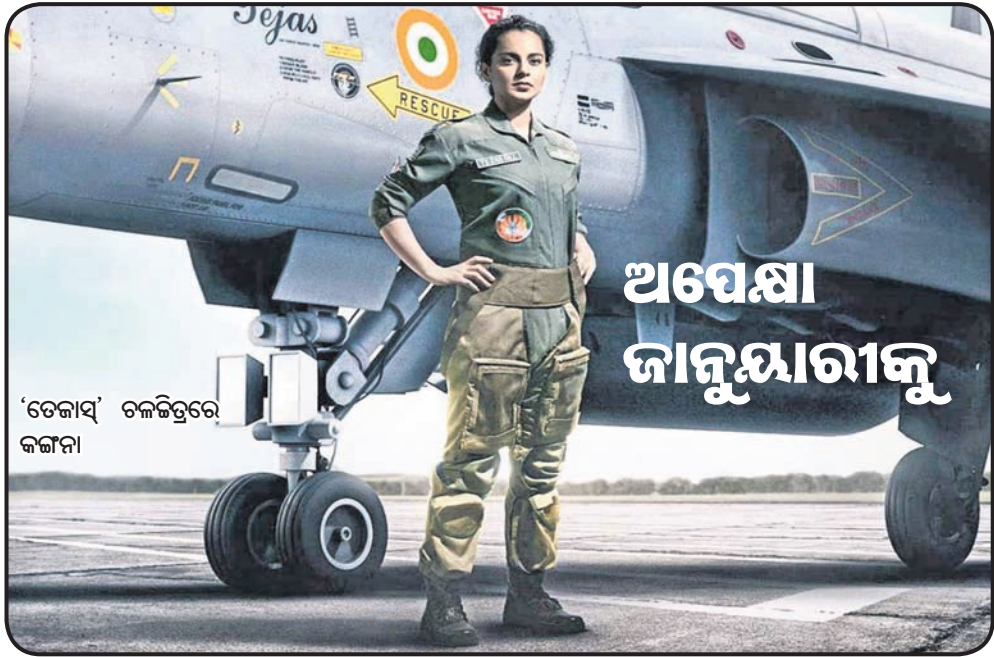
'ଡେକାସ୍' ଚଳଚ୍ଚିତ୍ରରେ କଳାକାରୀ