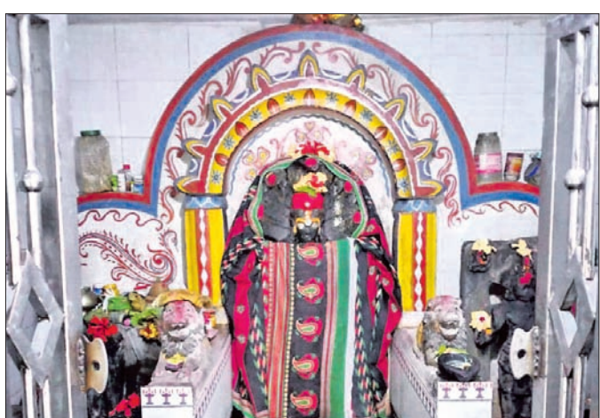
ବରଦାର ପ୍ରସିଦ୍ଧ ଭଗବତୀ ପୀଠ।

ଉତ୍କଳବନ୍ଧୁ ପଣ୍ଡା ଖଇରା, ଡାଏ ବାଲେଶ୍ଵର ଜିଲ୍ଲା ଖଇରା ବ୍ଲକ୍ ବରଦା ଅଞ୍ଚଳର ଆରାଧ୍ୟା ଦେବୀ ମା' ଭଗବତୀ। ଭଦ୍ରକ ମୋଟେଲ ଛକରୁ କାଉଁରୁ ରାସ୍ତା ଦେଇ ଯିବା ବେଳେ ବାଟରେ ପଡ଼େ। ବାଲେଶ୍ଵର ଜିଲ୍ଲା ଗରସଙ୍ଗ ଅନ୍ତରା ବଜାର ଦେଇ ମଧ୍ୟ ବରଦା ଯିବାକୁ ରାସ୍ତା ରହିଛି। ବାଲେଶ୍ଵର ଭଦ୍ରକ ଦୁଇ ଜିଲ୍ଲା ସୀମାରେ ଅବସ୍ଥିତ ଏହି ପ୍ରାଚୀନ ପୀଠର ଅନେକ କିମ୍ବଦନ୍ତୀ ରହିଛି। ପ୍ରତ୍ୟକ୍ଷଦେବୀ ଭାବେ ଭକ୍ତଙ୍କ ମନ କଥା ଜାଣି ବର ଦେଉଥିବା ନେଇ ବିଶ୍ଵାସ ରହିଛି। ବରଦାୟିନୀ ମା' ଭଗବତୀଙ୍କ ନାମରୁ ଗ୍ରାମର ନାମ ବରଦା ହୋଇଛି। ଏହି ମନ୍ଦିର ୫ଶହ ବର୍ଷ ତଳର ପୁରୁଣା ବୋଲି ସ୍ଥାନୀୟ ବାସିନ୍ଦା ଦାବି କରନ୍ତି। ପ୍ରବାଦ ଅନୁଯାୟୀ ଶୋଡ଼ଣ ଶତାବ୍ଦୀରେ କଳାପାହାଡ଼ ବଂଶରୁ