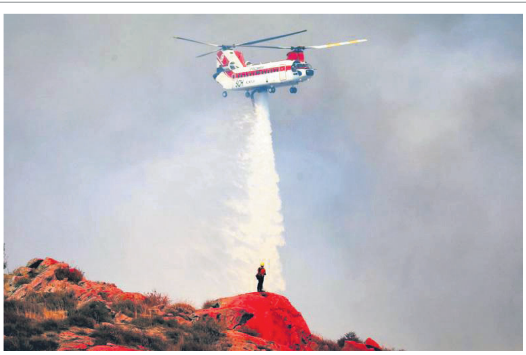
ଆମେରିକାର କାଲିଫର୍ନିଆ ଜଙ୍ଗଲରେ ଲାଗିଥିବା ନିଆଁକୁ ଆୟତ୍ତ କରିବା ପାଇଁ ଆକାଶମାର୍ଗରୁ ଏକ ପାର୍ବତ୍ୟାଞ୍ଚଳରେ ହେଲିକପ୍ଟର କରିଆରେ ପାଣି ସିଞ୍ଚନ କରାଯାଇଛି।

ନିଜକୁ ଯୋଡ଼ି ଜ୍ଞାନ ଆହରଣ କରିପାରିବେ ବୋଲି ସଂସ୍କାର ଗାଜା ତାଇରେକ୍ଟର ଥୋମାସ୍ ହାଇଲ୍ କହିଛନ୍ତି।