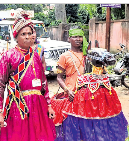
ମାଟି ଅନୁକୂଳ ଶୋଭାଯାତ୍ରାରେ ଲୋକ କଳାକାରମାନେ ପାରମ୍ପରିକ ନୃତ୍ୟ ପରିବେଷଣ କରୁଛନ୍ତି।