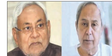
ନୀତୀଶ କୁମାର ନବୀନ ପଟ୍ଟନାୟକ

ଭୁବନେଶ୍ୱର, ୭୯(ବୁଧବାର) କେନ୍ଦ୍ରରେ କ୍ଷମତାସୀନ ଭାଜପା ସରକାରଙ୍କୁ ଆସନ୍ତା ୨୦୨୪ ନିର୍ବାଚନରେ ଗାଦିଚ୍ୟୁତ କରିବାକୁ ବିରୋଧୀଙ୍କୁ ଏକାଠି କରିବା ପାଇଁ ବିହାର ପୁଷ୍ପମାଳ୍ୟ ନୀତୀଶ କୁମାର ଭୋରସୋର ଭଦ୍ରମା ଚଳାଇଛନ୍ତି। ନୀତୀଶ ଏବେ ଜଣଙ୍କ ପରେ ଜଣେ ବିରୋଧୀ ନେତାଙ୍କୁ ଭେଟିଛନ୍ତି। ସେ ଓଡ଼ିଶା ପୁଷ୍ପମାଳ୍ୟ ନବୀନ ପଟ୍ଟନାୟକଙ୍କୁ ସାକ୍ଷାତ କରିବା ନେଇ ଚର୍ଚ୍ଚା କୋର ଧରିଛି। ଏ ନେଇ ଜାତୀୟ ରାଜନୀତିରେ ଖବର ପ୍ରକାଶ ପାଇଛି। ପୂର୍ବରୁ ନୀତୀଶ ଓଡ଼ିଶା ଆସି ନବୀନ ନିବାସରେ