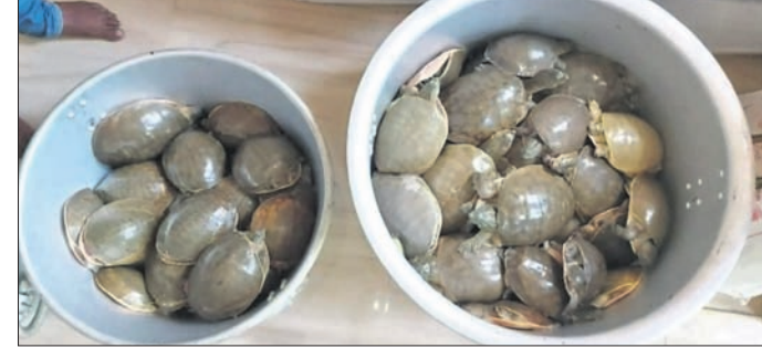
ଉଦ୍ଧାର ହୋଇଥିବା କଲକ୍ଷ।

ବ୍ୟବସ୍ଥା କରିଆରେ ବିନା ଅନୁବିଧାରେ ଅନୁଲାଇନ୍ ପେମେଣ୍ଟ କରି ପାରିବେ। ବେସରକାରୀ ଗୃହ ନିର୍ମାଣକାରୀ ସଂସ୍ଥା ହେଉ କିମ୍ବା ସରକାରଙ୍କ ଡେଭେଲପମେଣ୍ଟ ଏଜେଣ୍ଟ ସେମାନଙ୍କ ହାଉସିଂ ପ୍ରକଳ୍ପରେ ଆର୍ଥିକ ଦୁର୍ବଳ ଶ୍ରେଣୀଙ୍କ ପାଇଁ ୧୦% ଘର ନିର୍ମାଣ କରିବା ବାଧ୍ୟତାମୂଳକ କରାଯାଇଛି। 'ହାଉସିଂ ଫର୍ ଅଲ୍ ନାଟି' ଅନୁଯାୟୀ ୨୦୨୧-୨୨ ଆର୍ଥିକ ବର୍ଷ ପୂର୍ଣ୍ଣ ବିଭିନ୍ନ ସହରାଞ୍ଚଳରେ ପ୍ରାୟ ୧୫୦୦ ବାସଗୃହ ଇଡବ୍ଲ୍ୟୁଏସ୍‌ଏମ୍‌ଏମ୍ ପାଇଁ ନିର୍ମାଣ କରାଯାଇଛି। ନଗର ଉନ୍ନୟନ ବିଭାଗ ପକ୍ଷରୁ ପ୍ରସ୍ତୁତ କରାଯାଇଥିବା ହାଉସିଂ ଆଇଟମେଣ୍ଟ ଅର୍ଡର କରାଯିବ। ଏଥିରୁ ସହରାଞ୍ଚଳରେ ଆର୍ଥିକ ଦୁର୍ବଳ ଶ୍ରେଣୀର କେତେ ପରିବାରର ଘର ନାହିଁ ତାହା ଜଣାପଡ଼ିବ। ଏହାଛଡ଼ା ଯେଉଁମାନେ ହାଉସିଂ ସିମ୍‌ରେ ଘର ପାଇଛନ୍ତି ସେମାନେ ମଧ୍ୟ ଏହି