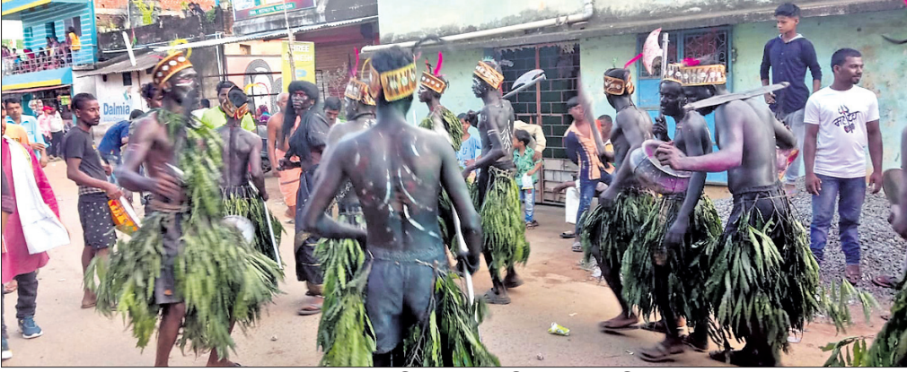
କଳାକାରମାନେ ଆଦିବାସୀ ନୃତ୍ୟ ପରିବେଷଣ କରୁଛନ୍ତି ।