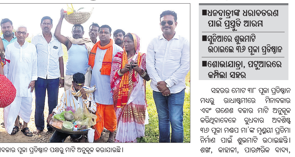
ଦେଢ଼ାନାଳ ଲକ୍ଷ୍ମୀବଜାର ପୂଜା ପ୍ରତିଷ୍ଠାନ ପକ୍ଷରୁ ମାଟି ଅନୁକୂଳ କରାଯାଇଛି।

ଧାରବରରଣ କରିବେ ଧନବାତ୍ରୀ। ଦୀର୍ଘ ଦୁଇବର୍ଷ ପରେ ପୂର୍ତ୍ତି ନବବଧୁ ପରି ସଜେଇ ହେବ ସହର। ପୁରକ ଚୋରଣ, ଆଖି ଝୋସିଦେବା ଭଳି ଆଲୋକମାଳାରେ ଝଲସି ଉଠିବ ପରିବେଶ। ପାରମ୍ପରିକ ପୂଜାର୍ଚ୍ଚନା, ବେଦମନ୍ତ୍ରରେ କମ୍ପିଠିବ ପୂଜା ପ୍ରତିଷ୍ଠାନ। ସନ୍ଧ୍ୟା ଦର୍ଶନ କରିବାକୁ ଲୋକାଗମ୍ୟ ହୋଇପଡ଼ିବ ମା'ଙ୍କ ଆସ୍ଥାନ। ପବିତ୍ର ସ୍ମୃତିଆରେ ଗଣପତି ଲକ୍ଷ୍ମୀପୂଜା ପାଇଁ ମାଟି ଉଠାଣ ସହ ମହୋତ୍ସବର ବିଗୁଲ୍ ବାଜିଥିବାବେଳେ ଏହାକୁ ନେଇ ଦେଢ଼ାନାଳବାସୀଙ୍କ ମଧ୍ୟରେ ଦେଖିବାକୁ ମିଳିଛି ଅଭୂତପୂର୍ବ ଉତ୍ସାହ।