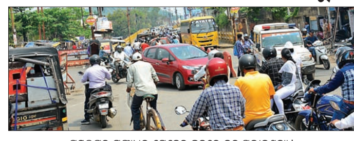
ସମଲପୁର ଗଙ୍ଗାଧର ମେହେର ଛକରେ ବନ୍ଦ ପ୍ରଭାବଶୂନ୍ୟ।

ସମଲପୁର, ୭୮୯(ବୁଧବାର) ସ୍ୱତନ୍ତ୍ର କୋଶଳ ପ୍ରଦେଶ ୩୦ନ ଦାବିରେ କୋସଳ ସେନା ଓ କୋଶଳ ରାଏଜ ଫୁଲି ମୋର୍ଚ୍ଛା ପକ୍ଷରୁ କୁଖବାର ପଶ୍ଚିମ ଓଡ଼ିଶା ବନ୍ଦ ତାକରା ଦିଆଯାଇଥିଲା। ସୁବର୍ଣ୍ଣପୁର, ବଲାଙ୍ଗୀର, ବରଗଡ଼ ଜିଲ୍ଲାରେ ବନ୍ଦର ଅଟକଳ ୩୭୯୧ କୋଟି ୬୬ ଲକ୍ଷ ୯୭ କୋଟି ୯୭ ଲକ୍ଷ ଟଙ୍କା ଖର୍ଚ୍ଚ ହୋଇଛି ବୋଲି ସୂଚନା କର୍ମୀ ପଞ୍ଜା କହିଥିଲେ। କଳାହାଣ୍ଡି ଜିଲ୍ଲାର ନଲୁଠାରେ ପ୍ରସ୍ତୁତି ଲୋକେ ପରିଓଡିକାଲ ଓଭରହଲିକ୍ସ କାରଖାନା ପାଇଁ ଗତ ବଜେଟରେ ୨ କୋଟି ଟଙ୍କା ଘୋଷଣା କରାଯାଇଥିଲା। କିନ୍ତୁ ବର୍ତ୍ତମାନ ପର୍ଯ୍ୟନ୍ତ ମାତ୍ର ୩୧ ହଜାର ଟଙ୍କା ଖର୍ଚ୍ଚ କରାଯାଇଛି। ପଶ୍ଚିମ ଓଡ଼ିଶା ପ୍ରତି ରେଳ ବିଭାଗର ଚରମ ଉଦାସୀନତା ବକବରର ରହିଛି ବୋଲି ପଞ୍ଜା କହିଥିଲେ। ସୁବର୍ଣ୍ଣପୁର, ବରଗଡ଼, ବଲାଙ୍ଗୀର, ବରଗଡ଼ ଜିଲ୍ଲାରେ ବନ୍ଦର ଅଟକଳ ୩୭୯୧ କୋଟି ୬୬ ଲକ୍ଷ ୯୭ କୋଟି ୯୭ ଲକ୍ଷ ଟଙ୍କା ଖର୍ଚ୍ଚ ହୋଇଛି ବୋଲି ସୂଚନା କର୍ମୀ ପଞ୍ଜା କହିଥିଲେ। କଳାହାଣ୍ଡି ଜିଲ୍ଲାର ନଲୁଠାରେ ପ୍ରସ୍ତୁତି ଲୋକେ ପରିଓଡିକାଲ ଓଭରହଲିକ୍ସ କାରଖାନା ପାଇଁ ଗତ ବଜେଟରେ ୨ କୋଟି ଟଙ୍କା ଘୋଷଣା କରାଯାଇଥିଲା। କିନ୍ତୁ ବର୍ତ୍ତମାନ ପର୍ଯ୍ୟନ୍ତ ମାତ୍ର ୩୧ ହଜାର ଟଙ୍କା ଖର୍ଚ୍ଚ କରାଯାଇଛି। ପଶ୍ଚିମ ଓଡ଼ିଶା ପ୍ରତି ରେଳ ବିଭାଗର ଚରମ ଉଦାସୀନତା ବକବରର ରହିଛି ବୋଲି ପଞ୍ଜା କହିଥିଲେ।