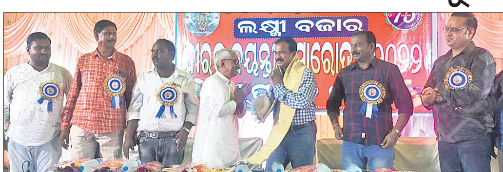
ଲକ୍ଷ୍ମୀବଜାର ପୂଜା ପ୍ରତିଷ୍ଠାନର ୭୫ବର୍ଷ ପୂର୍ତ୍ତି ସମାରୋହ