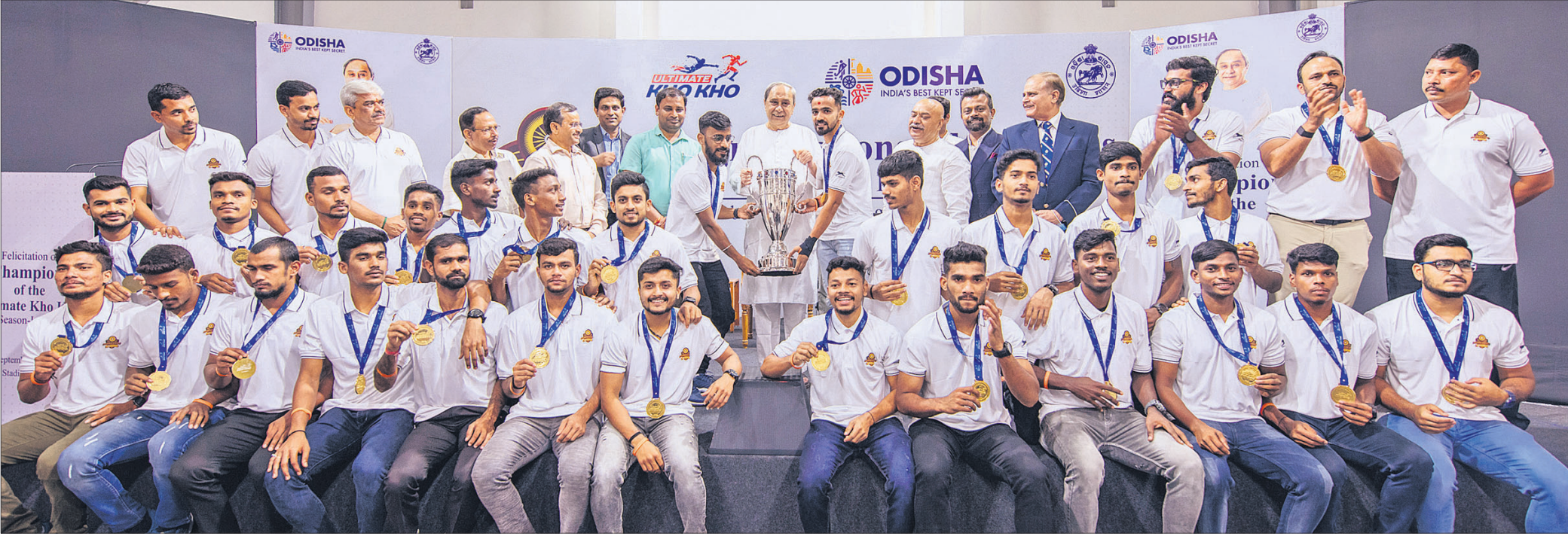
କଳିଙ୍ଗ ଷ୍ଟାଡ଼ିୟମର ଭାରୋତୋଳନ ହଲରେ ମୁଖ୍ୟମନ୍ତ୍ରୀ ନବୀନ ପଟ୍ଟନାୟକ ରୂପବାର ଅଭିନେତା ଖୋ ଖୋ ଲିଭ୍ ଚାମ୍ପିୟନ ଓଡ଼ିଶା ଜଗରନଟ୍ସ ଦଳକୁ ସମର୍ଥନ କରୁଛନ୍ତି।