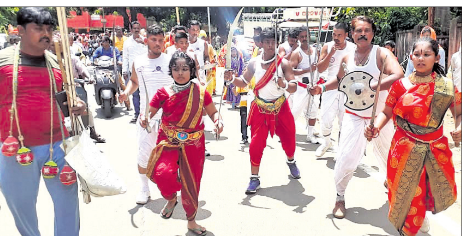
କଳାକାରଙ୍କ ପାଇକ ନୃତ୍ୟ ପରିବେଷଣ।

ଲୋକନୃତ୍ୟ ମଧ୍ୟରେ ମହୋତ୍ସବର ଆଦ୍ୟପର୍ବ ଆରମ୍ଭ ହୋଇଥିବାବେଳେ ସାରା ସହରରେ ସୃଷ୍ଟି ହୋଇଥିଲା ଆଧ୍ୟାତ୍ମିକ ବାତାବରଣ। ଲକ୍ଷ୍ମୀବଜାର, ଶଙ୍ଖ, କାହାଳୀ, ପାରମ୍ପରିକ ବାଦ୍ୟ, ସହାୟକ ଅମଳାପତ୍ରା, କୁବିଳି ଚାଉଳ-୧, ବନମାଳାପ୍ରସାଦ, ଶୁଭ ଆନାମା ପୂଜା ପ୍ରତିଷ୍ଠାନ କୁଞ୍ଜକାନ୍ତ ପୋଖରୀକୁ ଶୁଭ ମାଟି ଉଠାଇଛି। ମହିଷାସଂ ଅରବିନ୍ଦ ବଜାର ସମେତ ଅନ୍ୟ ପୂଜା ମଣ୍ଡପ ନିଜ ସୁବିଧା ପୂର୍ଣ୍ଣ ଭାବରେ ମାଟି ଅନୁକୂଳ କରିଛନ୍ତି। ଏଥିପାଇଁ ପ୍ରାୟତଃ ମଧ୍ୟାହ୍ନ ପର୍ଯ୍ୟନ୍ତ ଜନଗଣଙ୍କୁ ପୂଜାମଣ୍ଡପ ଯାଏ ଲାଗିଥିଲା ଜନଗହଳି। ଚଳିତବର୍ଷ ୩୯୯ ପୂଜା ପ୍ରତିଷ୍ଠାନ ଆରମ୍ଭ ହୋଇଥିବାବେଳେ ଏହାର ଲକ୍ଷ୍ମୀବଜାର ୭୫ତମ ବର୍ଷ ପୂର୍ତ୍ତି ପାଳନ କରୁଛି। ଏହାକୁ ନେଇ ବେଶ୍ ଉତ୍ସାହ