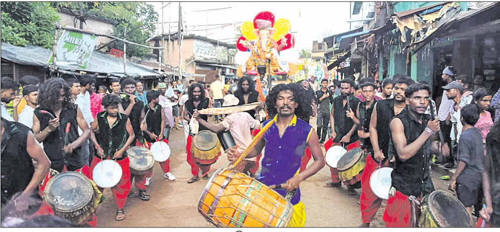
ଶୋଭାଯାତ୍ରାରେ ସାମିଲ ହୋଇଥିବା ବାଦ୍ୟ ଦଳ ।