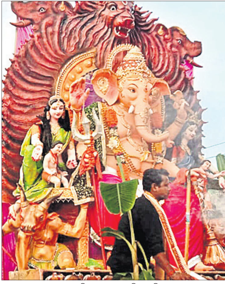
ଗଣପତିଙ୍କୁ ଶୋଭାଯାତ୍ରାରେ ନିଆଯାଇଛି ।