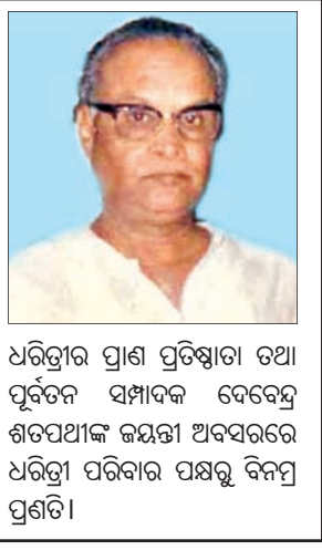
ଧରତ୍ରୀର ପ୍ରାଣ ପ୍ରତିଷ୍ଠାତା ତଥା ପୂର୍ବତନ ସମ୍ପାଦକ ଦେବେନ୍ଦ୍ର ଶତପଥୀଙ୍କ ଜୟନ୍ତୀ ଅବସରରେ ଧରତ୍ରୀ ପତ୍ରିକାର ପକ୍ଷରୁ ବିନମ୍ର ପ୍ରଣତି।

ରଣବୀର କପୁର ଏବଂ ଆଲିଆ ଭଟ୍ଟଙ୍କ ବହୁ ପ୍ରତୀକ୍ଷିତ ଫିଲ୍ମ 'ବ୍ରହ୍ମାସ୍ତ୍ର' ଶୁକ୍ରବାର ବଡ଼ପରଦାକୁ ଆସିବାକୁ ଯାଉଥିବାବେଳେ ରିଲିଜ ପୂର୍ବରୁ ଏହାକୁ ଡାକ୍ ବିରୋଧ କରାଯାଇଛି।