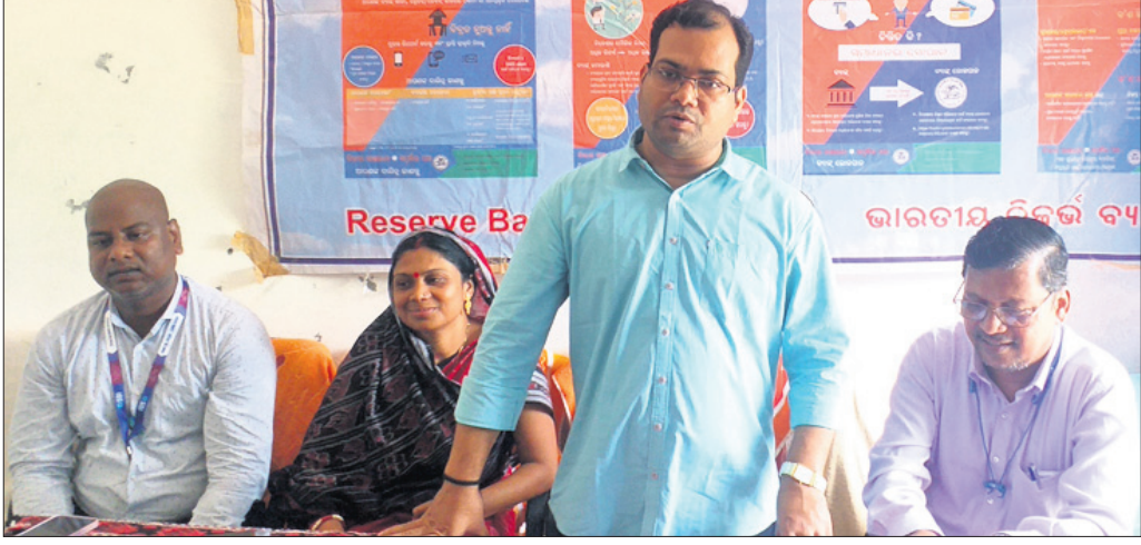
କାର୍ଯ୍ୟକ୍ରମରେ ମଞ୍ଚାସନ ଅତିଥି।

ନାନା ଯୋଜନାକୁ ଫାଇଦା ଉଠାଇବା ପାଇଁ ଶିବିରୀୟା ଚପୁରତା ପ୍ରକାଶ କରିବା ଉଚିତ୍। ଏ ଦିଗରେ ପଞ୍ଚାୟତରେ କାର୍ଯ୍ୟକ୍ରମ ଏନିକିଟି, ସିଆରପି, ସରପଞ୍ଚ ଓ ସମିତିସଭାମାନେ ଜମାଖୋରାଧାରୀଙ୍କୁ ନେଇ କାଗ୍ରତ ପ୍ରଦାନ କରିବେ। ଏହାଛଡ଼ା ବ୍ୟାଙ୍କକୁ ନେଇ ସମ୍ପୂର୍ଣ୍ଣ ହେଉଥିବା ସହ ଆଲୋଚନା କରିଆରେ ସମାଧାନ କରିପାରିବେ ବୋଲି ଅତିଥିମାନେ କହିଥିଲେ। ବ୍ୟାଙ୍କକୁ ନେଇ ଶିବିରୀୟାଙ୍କ ମନରେ ଥିବା ପ୍ରଶ୍ନଗୁଡ଼ିକୁ ବ୍ୟାଙ୍କ ଅଧିକାରୀ ବୁଝାଇ ସେମାନଙ୍କ ସନ୍ଦେହ ଦୂର କରିଥିଲେ। ଉକ୍ତ କାର୍ଯ୍ୟକ୍ରମରେ ୧୫୦ରୁ ଉର୍ଦ୍ଧ୍ୱ ମହିଳା ଓ ପୁରୁଷ ଯୋଗଦେଇ ଥିଲେ।