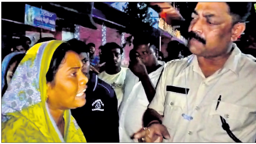
ପୋଲିସ୍ ସହିତ ଗ୍ରାମବାସୀ ଯୁକ୍ତିତର୍କ କରୁଛନ୍ତି ।

ଗଣେଶ ପୂଜା ପାର୍ବଣ କଟକଣା ନୟାଗଡ଼ ଜିଲ୍ଲା ପ୍ରଶାସନ ଲାଗୁ କରିଛି । ଗ୍ରାମିଣ ସମସ୍ୟା, ଅସରଣ ଓ ଆଇନଶୃଙ୍ଖଳା ପରିସ୍ଥିତିକୁ ଏତାଇବା ପାଇଁ ପରିସ୍ଥିତିକୁ ଦୃଷ୍ଟିରେ ରଖି ନୟାଗଡ଼ ଜିଲ୍ଲାପାଳ ଯୋଗା ରୁଷ୍ଟି ଜିଲ୍ଲାର ବିଭିନ୍ନ ଥାନାର ଆଇଆଇସି, ଡିଏସ୍, ଡିଏସ୍‌ସି, ଡିଏସ୍‌ସି ନିର୍ବାହୀ ଅଧିକାରୀଙ୍କୁ ଭିଡ଼ି ଓ କନଫରେନ୍ସରେ ପାର୍ବଣ କଟକଣା ସମ୍ପର୍କରେ ଅବଗତ କରାଇଥିଲେ । ଏହାସତ୍ତ୍ୱେ ଜିଲ୍ଲାର ପାର୍ବଣ କଟକଣା ଠିକ୍ରେ କାମ କରୁନା ଉପରେ ଥାନା ରାଜସ୍ୱନାମା ଫାଣ୍ଡି ସୁନାଖଳାରେ ମଙ୍ଗଳବାର ରାତିରେ ଗଣେଶ ଠାକୁରଙ୍କ ଭସାଣି ଯାତ୍ରାକୁ ତିଜେ ଗାଡ଼ିକୁ ଜବତ କରିବା ପରେ ଉତ୍ତରାଧିକାରୀ ପ୍ରକାଶ ପାଇଥିଲା । ଏହି ଘଟଣାକୁ ନେଇ ପୋଲିସ୍ ସହ ଗ୍ରାମାଧ୍ୟ ଲୋକଙ୍କ କଥା କଟାକଟି, ଯୁକ୍ତିତର୍କ ହୋଇଥିଲା ।