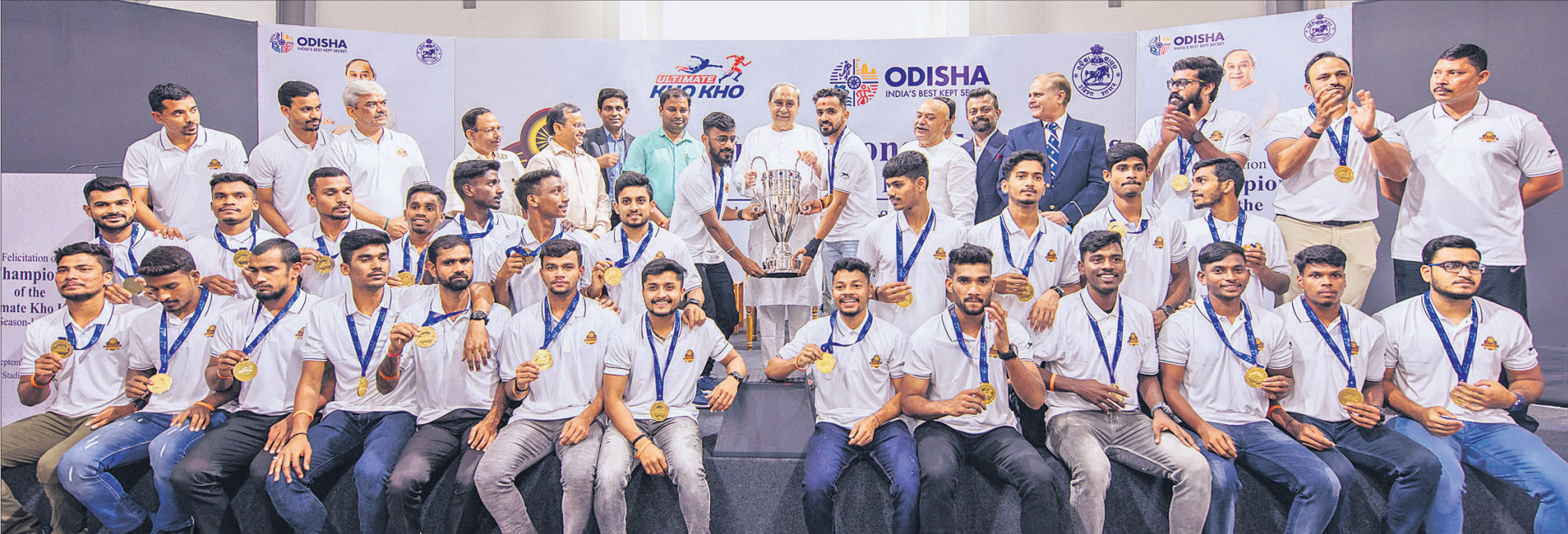
କଳିଙ୍ଗ ଷ୍ଟାଡ଼ିୟମର ଭାରୋତୋଳନ ହଲରେ ମୁଖ୍ୟମନ୍ତ୍ରୀ ନବୀନ ପଟ୍ଟନାୟକ ରୂପବାର ଅଭିନେତା ଖୋ ଖୋ ଲିଭ୍ ଚାମ୍ପିୟନ ଓଡ଼ିଶା ଜଗରନଟ୍ଟ ଦଳକୁ ସମର୍ଥନ କରୁଛନ୍ତି।