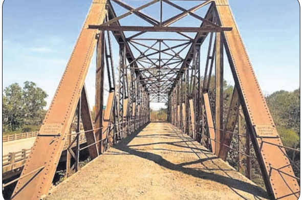
ପ୍ରାୟ ଦଶ ବର୍ଷ ତଳେ ଏହି ଲୁହା ପୋଲ ବ୍ୟବହାର ହେଉଥିଲା । ବୁଲି ରାଜ୍ୟ ମଧ୍ୟରେ ଯାତାୟତରେ ସୁସମ୍ପର୍କ ଗଢି ଉଠିବା ସହ ବ୍ୟବସାୟିକ

ନଗରୀ ଚନ୍ଦ୍ର ପଟ୍ଟନାୟକ କେନ୍ଦ୍ରୀୟ, ୩୯ ଓଡ଼ିଶା ଓ ଝାଡ଼ଖଣ୍ଡ ସୀମାରେ ଥିବା ବୈତରଣୀ ନଦୀ ଉପରେ ଶହେ ବର୍ଷ ପୂର୍ବରୁ ନିର୍ମାଣ ହୋଇଥିଲା ସେତୁ। ଉଭୟ ରାଜ୍ୟ ମଧ୍ୟରେ ସମ୍ପର୍କ ଯୋଗୁଥିବା ବ୍ରିଡ୍ଜ ଅମଳର ଏହି ସେତୁ ଆଜି ଅସୁରକ୍ଷିତ। ଏହା ଉପରେ ପୂର୍ବଭଳି ଲୋକେ ଯାତାୟତ କରିବାକୁ ନିରାପଦ ମଣ୍ଡଳାହାନ୍ତି। ତେଣୁ ଏହି ପୋଲର ମରାମତି କରାଯାଇ ଏହି ସମ୍ପର୍କ ମାନ୍ୟତା ଦେବା ସହିତ ଏହାର ସୁରକ୍ଷା କରାଯାଇପାରିଲେ ଏହା ଏକ ପର୍ଯ୍ୟଟନ ସ୍ଥଳ ଭାବେ ବିବେଚିତ ହୋଇପାରିବ ବୋଲି ବୁଝାଳାବା ମହଲରେ ମତପ୍ରକାଶ ପାଇଛି। ବିଚ୍ଛିନ୍ନାଞ୍ଚଳ ଷଡ଼େଇକଳା, ଖରପୁଆଁ, ଚକ୍ରଧରପୁର, ଚାନ୍ଦିଆ ଏକଦା ଅବିଭକ୍ତ ଓଡ଼ିଶା ରାଜ୍ୟରେ ରହିଥିଲା । ଏଣୁ ଏହି ପୋଲ ସେ ସମୟରେ ରୁକୁରୁ ବନ୍ଦନ କରୁଥିଲା । ପରବର୍ତ୍ତୀ ସମୟରେ ଓଡ଼ିଶା ଓ ବିହାର (ବର୍ତ୍ତମାନ ଝାଡ଼ଖଣ୍ଡ) ରାଜ୍ୟକୁ ଏହି ପୋଲ ଲୁହାପଥର ପରିବହନର ପୃଷ୍ଠା ଯାତାୟତ ପଥ ପାଲଟିଥିଲା । ଏହାର ଅପରପାର୍ଶ୍ୱ ଉତ୍ତରାଞ୍ଚଳରେ ଥିବା ବ୍ରିଡ୍ଜ ଅମଳର ପଥର ପୋଲର ଅବଶେଷ ଅନେକଙ୍କୁ ଏବେ ମଧ୍ୟ ଆକୃଷ୍ଟ କରୁଛି ।