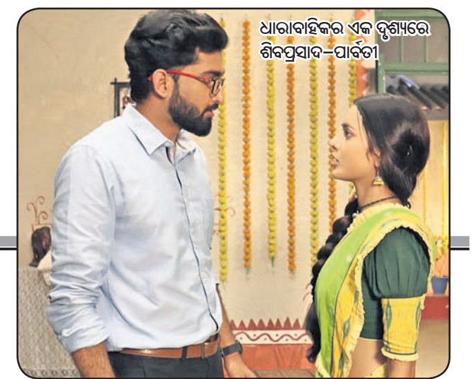
ଧାରାବାହିକର ଏକ ଦୃଶ୍ୟରେ ଶିବପ୍ରସାଦ-ପାର୍ବତୀ