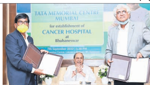
କରିଥିବାକୁ ପୁଞ୍ଜୀମନ୍ତ୍ରୀ କେନ୍ଦ୍ର ସରକାର, ଟାଟା ଟ୍ରଷ୍ଟ ଓ ନାଲକରକୁ କୃତଜ୍ଞତା ଜଣାଇଛନ୍ତି । ଏହି ପ୍ରକଳ୍ପ କେନ୍ଦ୍ର ସରକାର, ରାଜ୍ୟ ସରକାର ଓ ଘରୋଇ କ୍ଷେତ୍ର ମଧ୍ୟରେ ସମନ୍ୱୟର ଏକ ଉଦାହରଣ ପାଲଟିବ ବୋଲି ପୁଞ୍ଜୀମନ୍ତ୍ରୀ କହିଛନ୍ତି ।

ଜଟଣୀସ୍ଥିତ ନାଲକର ପରିସରରେ ଏକ କ୍ୟାମ୍ପସର ହସ୍ପିଟାଲ ଗଠନ କରାଯିବ । ୨୦୦ ଶଯ୍ୟା ବିଶିଷ୍ଟ ଏହି ହସ୍ପିଟାଲ ପାଇଁ ରାଜ୍ୟ ସରକାର ଓ ଟାଟା କ୍ୟାମ୍ପସର ମେମୋରିଆଲ ସେଣ୍ଟର ମଧ୍ୟରେ ରୁଧିରୀ ଏକ ସୁଯୋଗପାତ୍ର ସ୍ୱାକ୍ଷର ହୋଇଛି ।