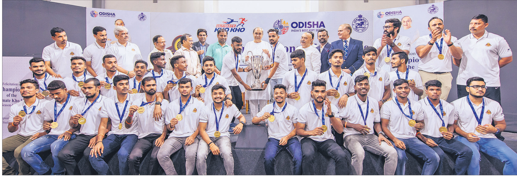
କଳିଙ୍ଗ ଷ୍ଟାଡ଼ିୟମର ଭାରୋତୋଳନ ହଲରେ ମୁଖ୍ୟମନ୍ତ୍ରୀ ନବୀନ ପଟ୍ଟନାୟକ ରୂପବାର ଅଭିନେତା ଖୋ ଖୋ ଲିଭ୍ ଚାମ୍ପିୟନ ଓଡ଼ିଶା ଜଗରନନ୍ଦୁ ଦଳକୁ ସମର୍ଥନ କରୁଛନ୍ତି।