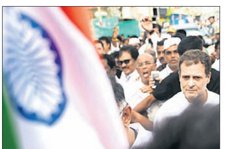
ଭାରତ ଯୋଡ଼ା ଯାତ୍ରାରେ କଂଗ୍ରେସ ନେତା ରାହୁଲ ଗାନ୍ଧୀ ।