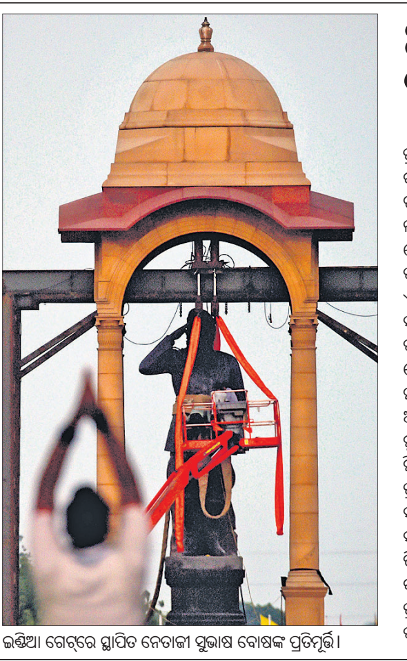
ଇଣ୍ଡିଆ ଗେଟ୍‌ରେ ସ୍ଥାପିତ ନେତାଜୀ ସ୍ତୁଭାଙ୍କ ବୋଧେକ ପ୍ରତିମୂର୍ତ୍ତି ।