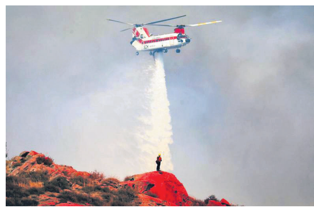
ଆମେରିକାର କାଲିଫର୍ନିଆ ଜଙ୍ଗଲରେ ଲାଗିଥିବା ନିଆଁକୁ ଆୟତ୍ତ କରିବା ପାଇଁ ଆକାଶମାର୍ଗରୁ ଏକ ପାର୍ବତ୍ୟାଞ୍ଚଳରେ ହେଲିକପ୍ଟର କରିଆରେ ପାଣି ବିସର୍ଜନ କରାଯାଇଛି ।