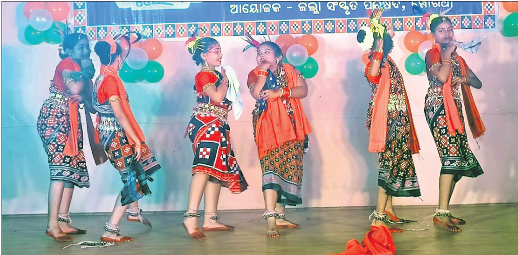
ଜୟୀ ରାଜଗୁରୁ ଭବନରେ ଆୟୋଜିତ ନୂଆଁଖାଇ କାର୍ଯ୍ୟକ୍ରମରେ କଳାକାରଙ୍କ ଦ୍ୱାରା ପରିବେଷିତ ସମ୍ବଲପୁରୀ ନୃତ୍ୟ।