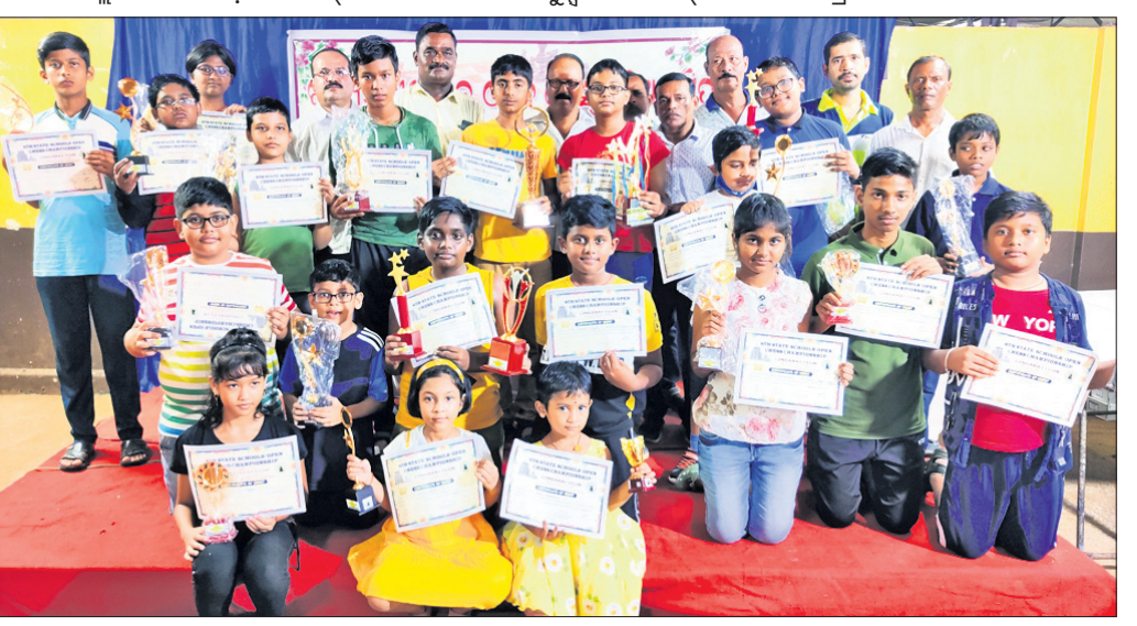
ରାଜ୍ୟ ସ୍କୁଲ୍ ଚେସ୍‌ର କୃତୀ ପ୍ରତିଯୋଗୀମାନେ ଅତିଥିଙ୍କୁ ଗହଣରେ ।

ଭୁବନେଶ୍ୱର, ୧୦୧୯ (ବ୍ରାହ୍ମା ପ୍ରତିନିଧି) ଆସୋସିଏଟସ ଆନୁକୁଲ୍ୟରେ ଆୟୋଜିତ ରାଜ୍ୟ ସ୍କୁଲ୍ ଓପନ ଚେସ୍‌ରେ ଭୁବନେଶ୍ୱର କେନ୍ଦ୍ରୀୟ ବିଦ୍ୟାଳୟ-୧ର ତ୍ରିଦେବ ଚାମ୍ପିୟନ ଚାମ୍ପିୟନ