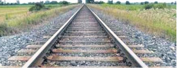
ଯାଜପୁର ଅଧିକ, ୧୦/୯