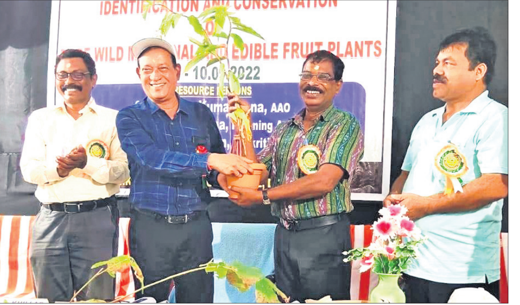
ଅତିଥିମାନେ ଚାରା ରୋପଣ କରିବାକୁ ଛାତ୍ରାଛାତ୍ରୀଙ୍କୁ ଉତ୍ସାହିତ କରୁଛନ୍ତି।