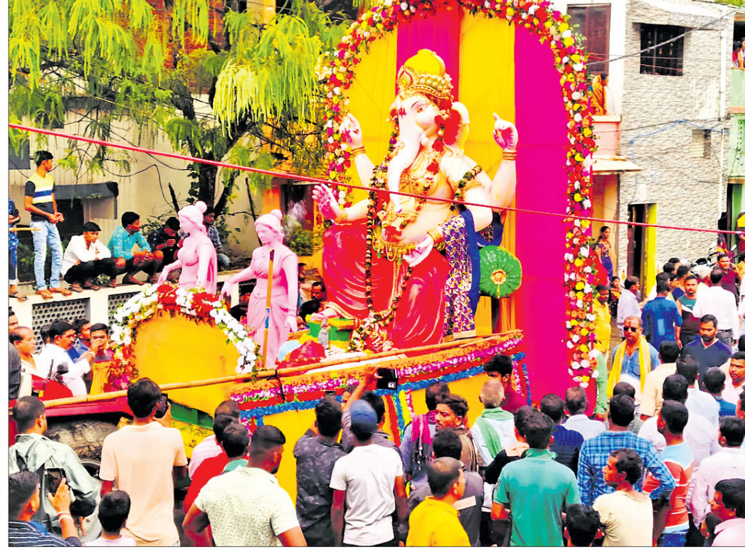
ଭସାଣି ଶୋଭାଯାତ୍ରାରେ ସାମିଲ ହୋଇଥିବା ଏକ ମେଡ଼ ସହର ପରିକ୍ରମା କରୁଛି ।