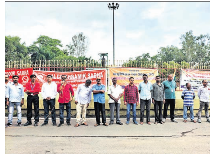
ଶ୍ରମିକ କୋଅର୍ଡିନେସନ କମିଟି ପକ୍ଷରୁ ପ୍ରତିବାଦ କରାଯାଇଛି ।

ବର୍ତ୍ତମାନ, ୧୦।୯ (ଡି.ଏ.ଏ.) ନାଲକୋ ପକ୍ଷରୁ ଠିକା ଶ୍ରମିକଙ୍କୁ ସୁରକ୍ଷା ସରଞ୍ଚନା ପ୍ରଦାନ ଆଦି ଦାବିରେ ଏହି ପ୍ରତିବାଦ ସଭା ହୋଇଥିଲା। ନାଲକୋ ଶ୍ରମିକ ସଭା, ନାଲକୋ ନିର୍ମାଣ ମନ୍ତ୍ରଣାଳୟ କମିଟି ପକ୍ଷରୁ ଏକ ପ୍ରତିବାଦ ସଭା, ଆଲୁମିନିୟମ ମନ୍ତ୍ରଣାଳୟ ସଂଘ, ନାଲକୋ କର୍ମଚାରୀ ସଂଘ, ନାଲକୋ ଇଞ୍ଜିନିୟରୀ ଶ୍ରମିକ ସଂଘ, ନାଲକୋ ଶ୍ରମିକ ସଂଘ ଉପସ୍ଥିତ ଥିଲେ।