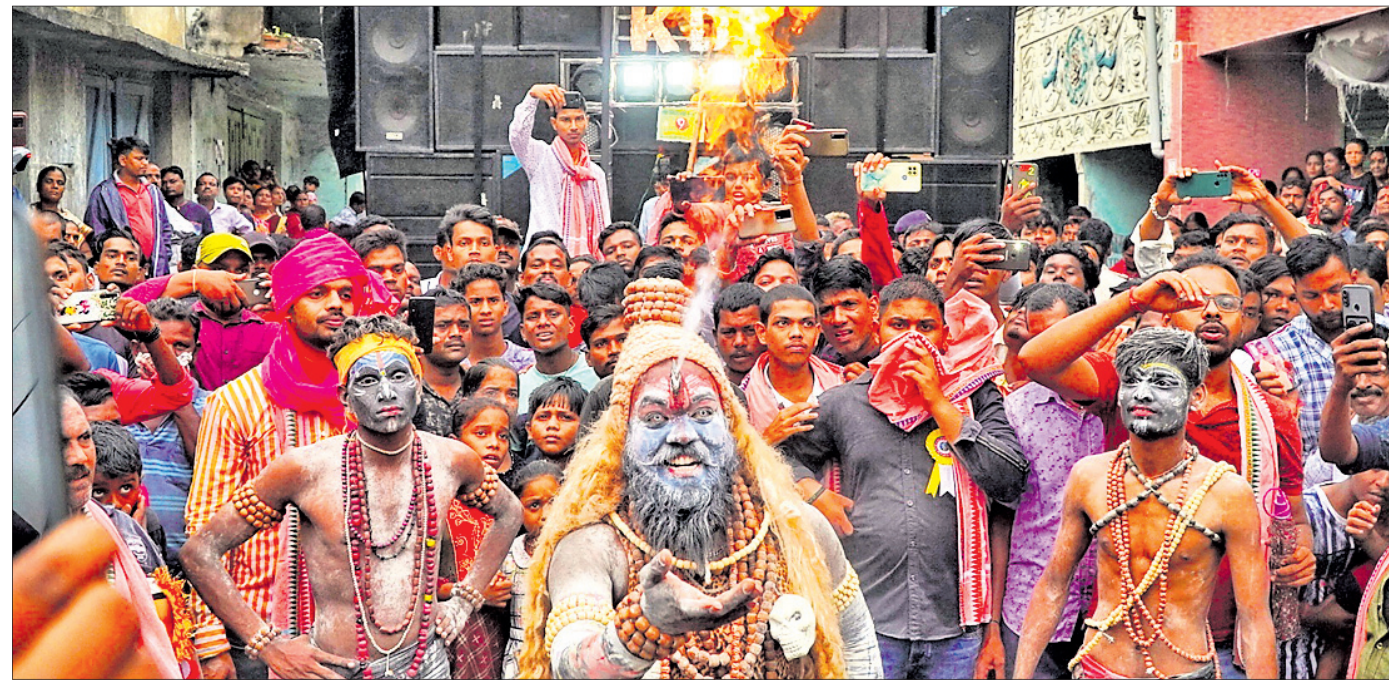
ସାଧୁବେଶଧାରୀ ନିଆଁ ଫୁଲୁଥିବା ବେଳେ ଦର୍ଶକଙ୍କ ପ୍ରବଳ ଭିଡ଼ ।