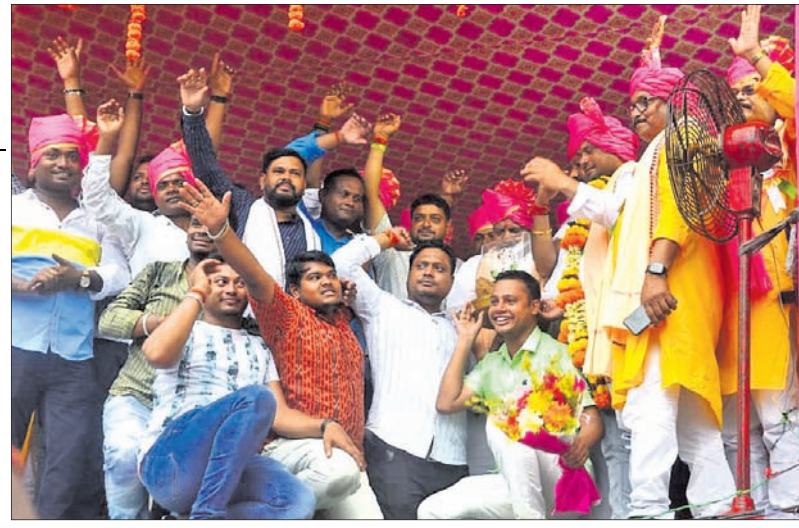
ମଞ୍ଚ ଉପରେ କର୍ମକର୍ତ୍ତାମାନେ ।