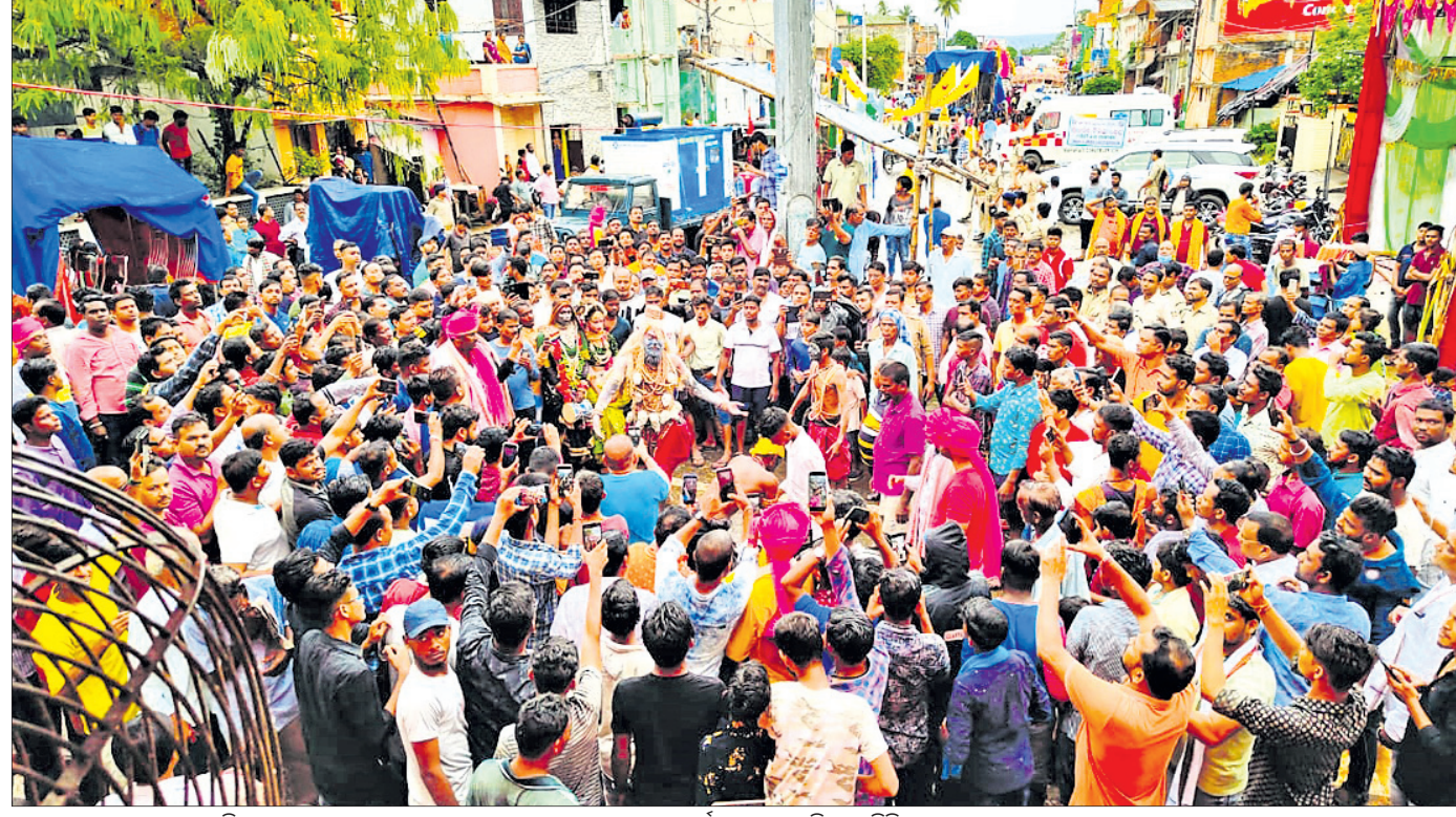
ତାଳଚେର ସହରରେ ଭସାଣି ଶୋଭାଯାତ୍ରା ବେଳେ ହେଉଥିବା ଲୋକନୃତ୍ୟ ଦେଖିବାକୁ ଦର୍ଶକଙ୍କ ପ୍ରବଳ ଭିଡ଼ ଲାଗିଛି ।