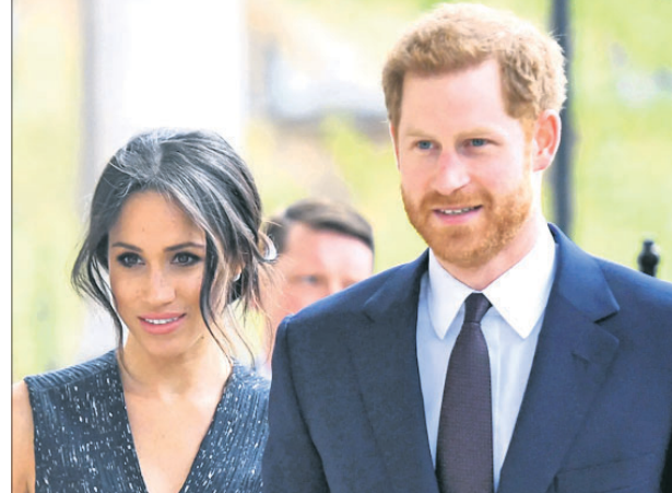
ପରିବାରକୁ ଫେରିପାରିବେ ବୋଲି ନ ଫେରିଲେ ବି ତାଙ୍କ ସନ୍ତାନ କୁହାଯାଉଛି। ହ୍ୟାରି ଓ ମେଘାନ ରାଜ ଉପାଧି ପାଇପାରିବେ।