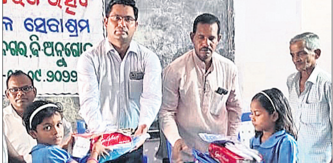
ଛାତ୍ରୀଛାତ୍ରଙ୍କୁ ପୋଷାକ ବଣ୍ଟନ କରାଯାଇଛି।