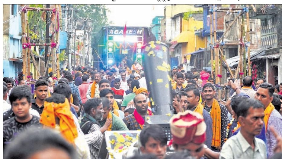
ଶୋଭାଯାତ୍ରା ସମୟରେ ମେଡ଼ ଆଗରେ ଯାଉଥିବା କମିଟି କର୍ମକର୍ତ୍ତା ଓ ଅନ୍ୟମାନେ ।