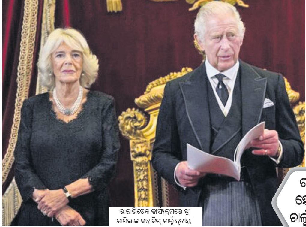
ରାଜା ଚାର୍ଲ୍ସଙ୍କ କାର୍ଯ୍ୟକ୍ରମରେ ସ୍ତ୍ରୀ କାମିଲାଙ୍କ ସହ କିଙ୍ଗ୍ ଚାର୍ଲ୍ସ ତୃତୀୟ।