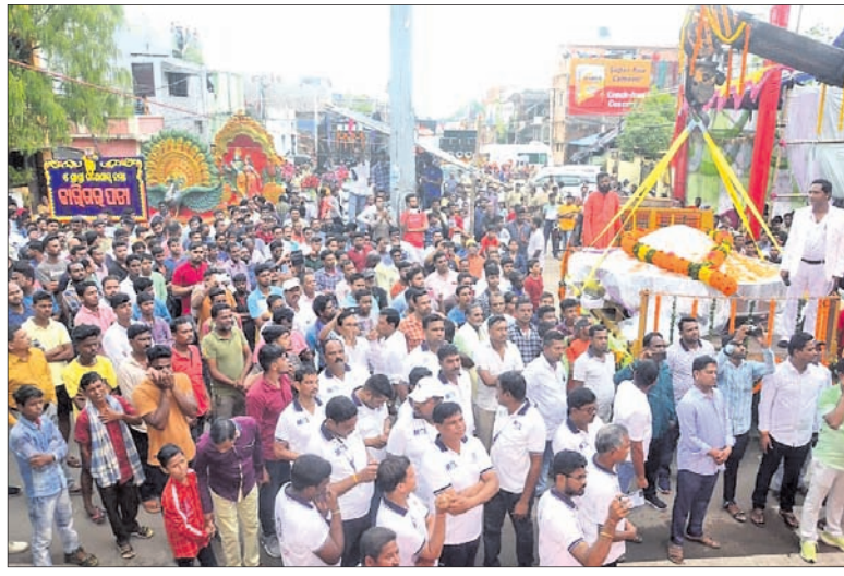
ନିର୍ମାଣ ବେଳେ ଆଞ୍ଚାଳତୁକୁ କ୍ରେନ୍ ଦ୍ୱାରା ଉଠାଯାଇଛି ।