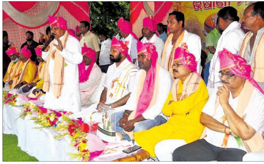
ଶୋଭାଯାତ୍ରା ପୂର୍ବରୁ ମେଲଣ ପଡ଼ିଆଠାରେ ମଞ୍ଚ ଉପରେ ଅତିଥି ଓ କେନ୍ଦ୍ରୀୟ ପୂଜା କମିଟି କର୍ମକର୍ତ୍ତାମାନେ ।