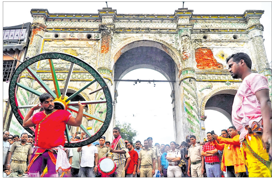
ଶୋଭାଯାତ୍ରାବେଳେ ସମରକଳା ପ୍ରଦର୍ଶନ କରାଯାଇଛି ।