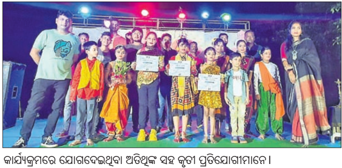
କାର୍ଯ୍ୟକ୍ରମରେ ଯୋଗଦେଇଥିବା ଅତିଥିଙ୍କ ସହ କୃତୀ ପ୍ରତିଯୋଗୀମାନେ।