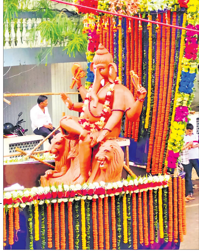
ଭସାଣି ଶୋଭାଯାତ୍ରାରେ ଯାଉଥିବା ଏକ ମେଡ଼ ।