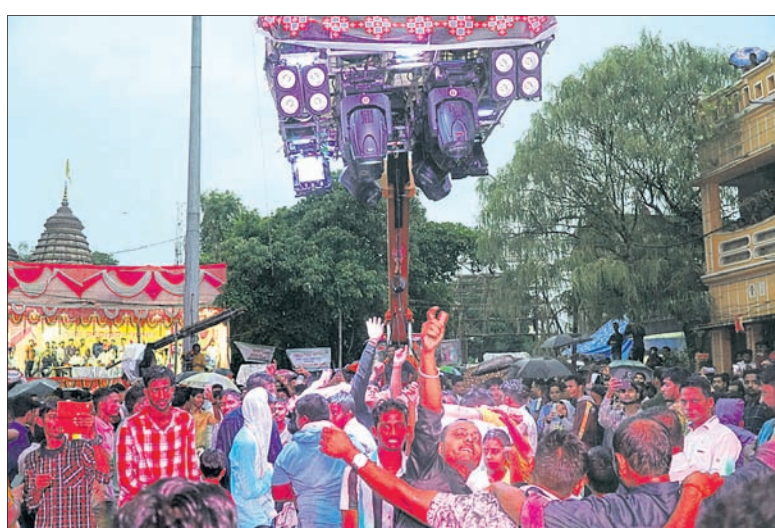
ସଙ୍ଗୀତର ତାଳେ ତାଳେ ନୃତ୍ୟ କରୁଥିବା ସହରବାସୀ ।