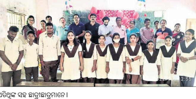
ଅତିଥିଙ୍କ ସହ ଛାତ୍ରୀଛାତ୍ରମାନେ।