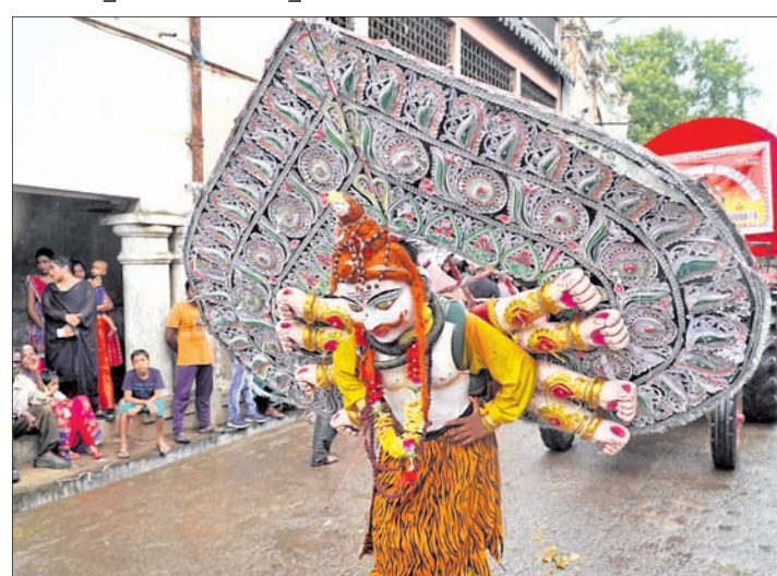
ଭସାଣି ଶୋଭାଯାତ୍ରା ବେଳେ ପରିବେଷିତ ଲୋକକଳା ।